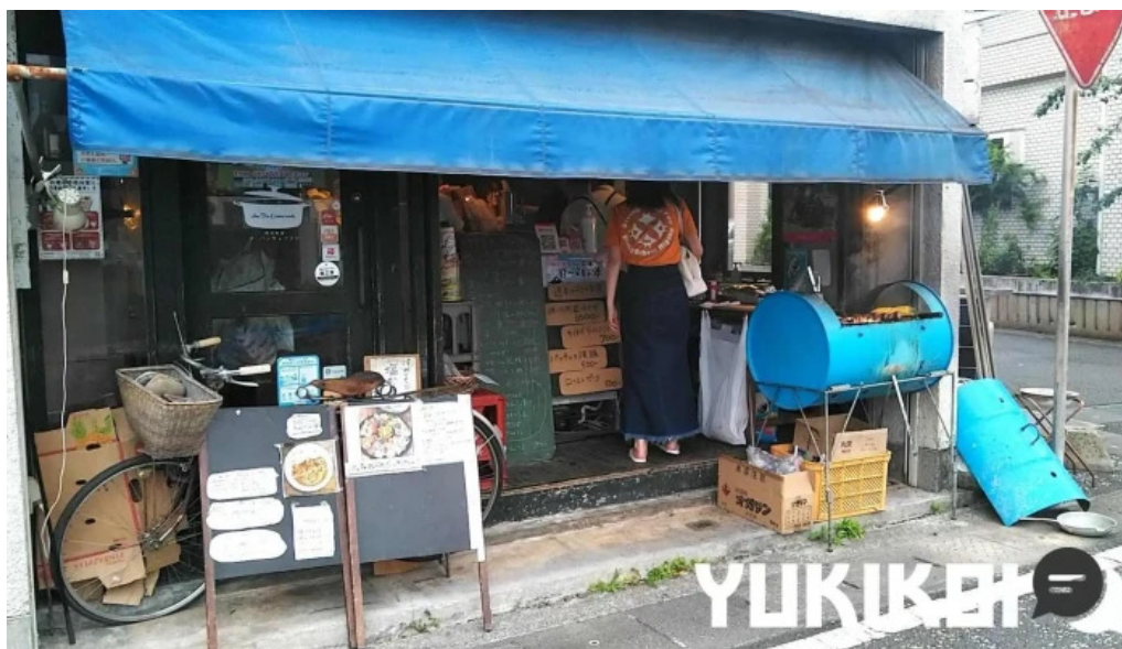
オ・パツキャマラド 奄美市