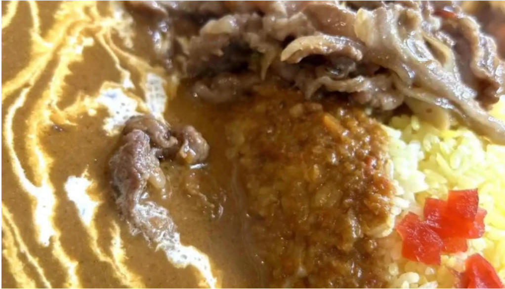
オパッキアマラド カレー