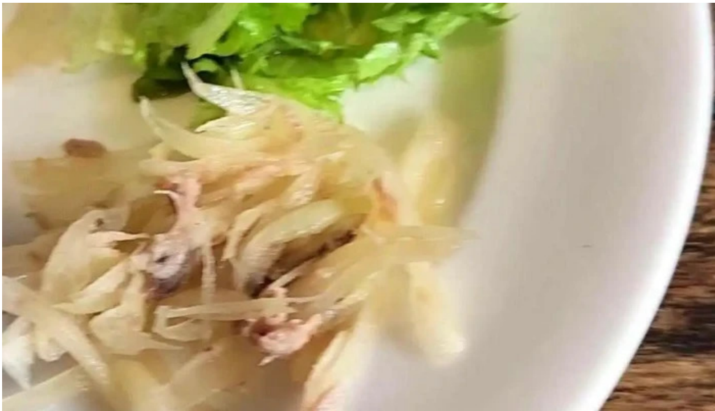
オパッキアマラド 動画