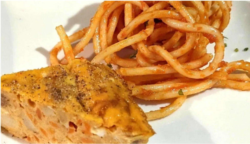
オパッキアマラド 行き方