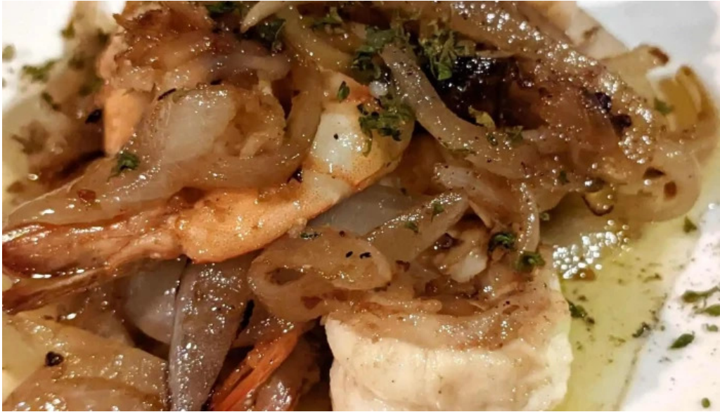
オパッキアマラド 住所