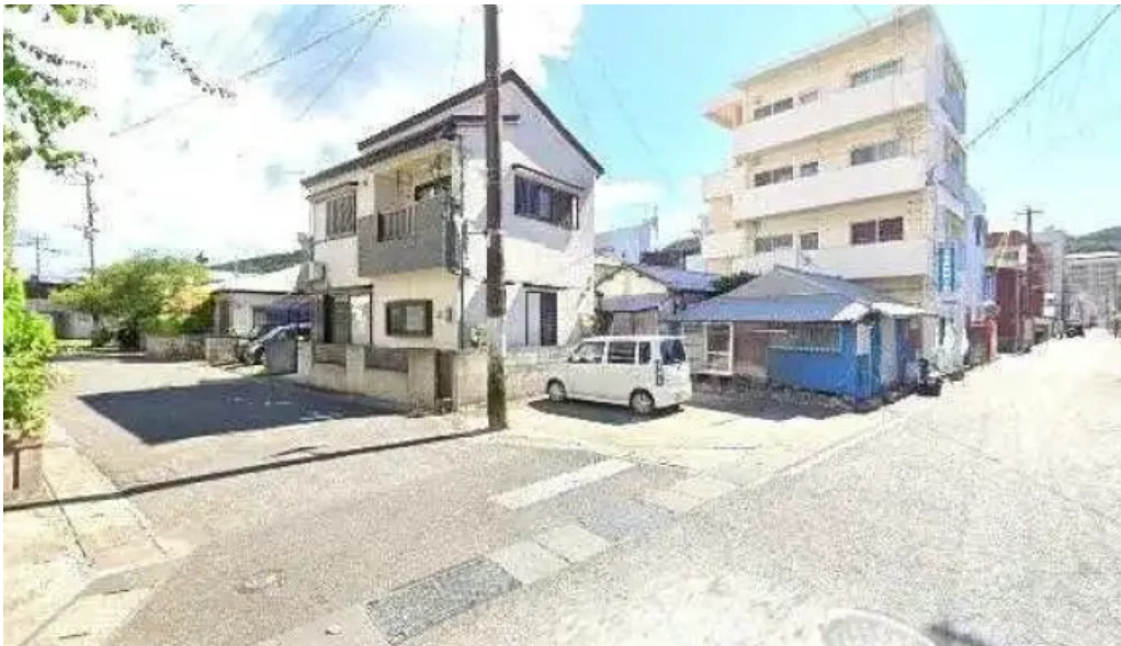
オパッキアマラド 奄美市