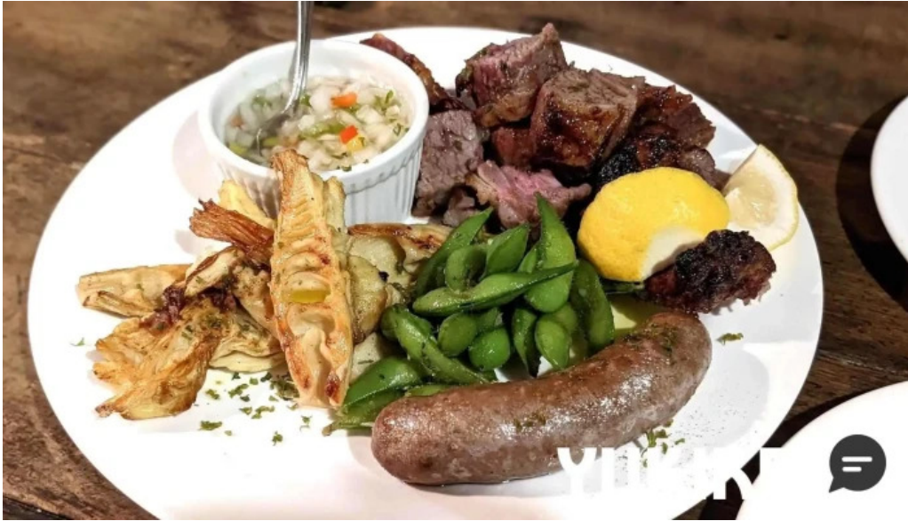
オパッキアマラド 料理飲み物