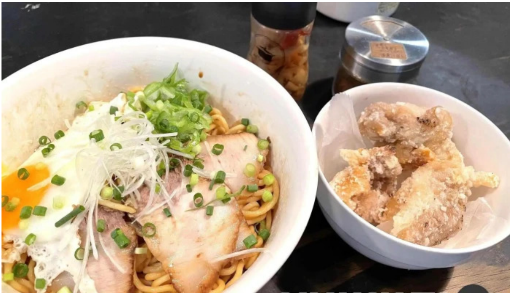
オパッキアマラド ラーメン