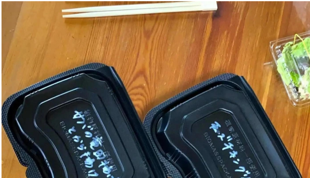
オパッキアマラド 営業中