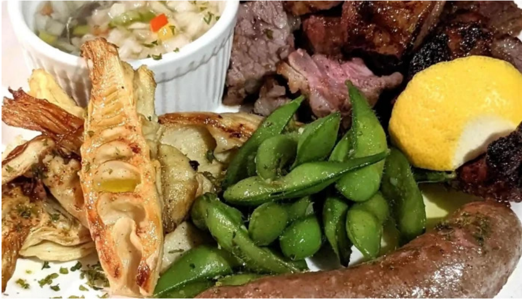
オパッキアマラド ロコミ