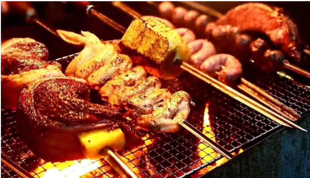
オパッキアマラド オーナー提供