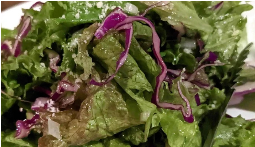
オパッキアマラド コメント