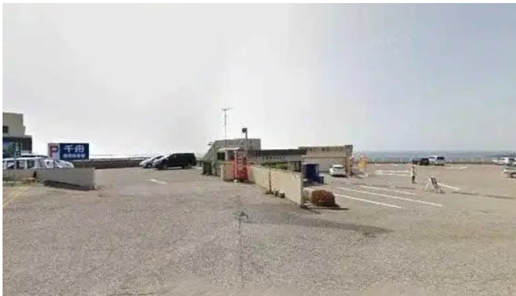
千舟 ストリートビューと 360 ビュー