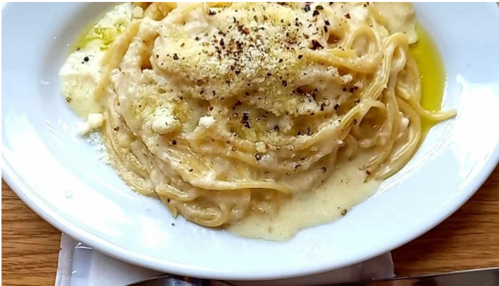
チッチョ comentario 1