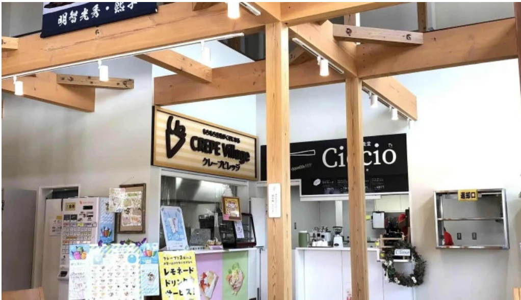
チッチヨ comentario 5