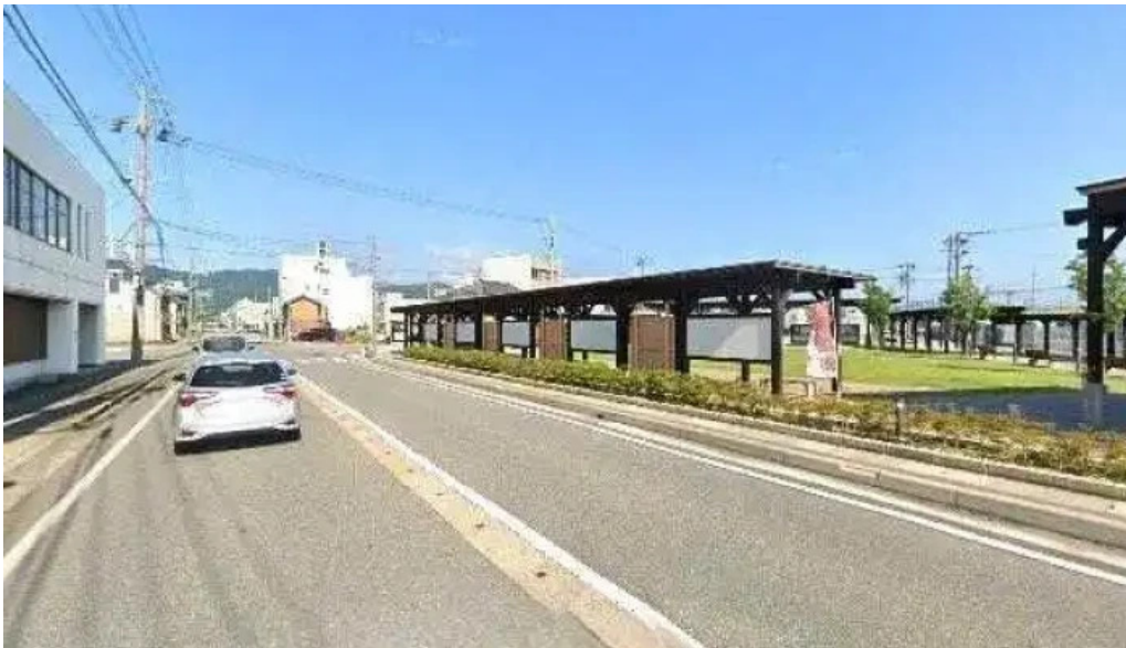
チッチョ ストリートビューと 360 ビュー