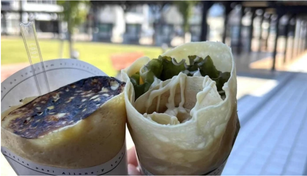
チッチョ comentario 2