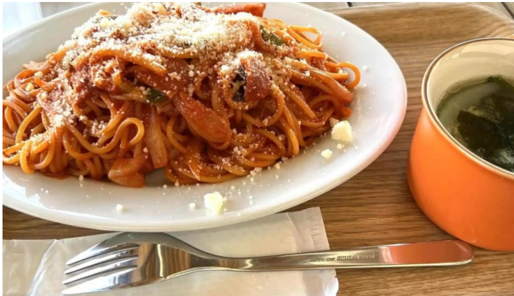
チッチヨ comentario 4