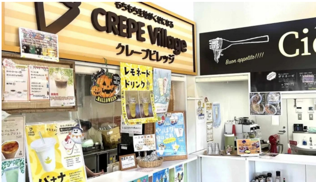
チッチヨ comentario 3