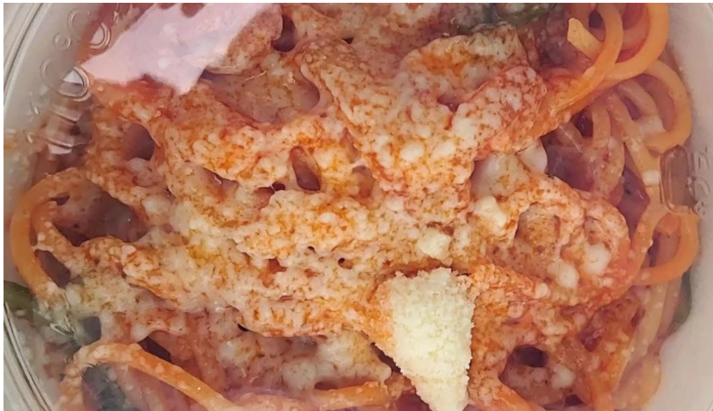
チッチョ comentario 7