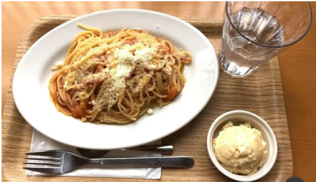
チッチョ 料理飲み物