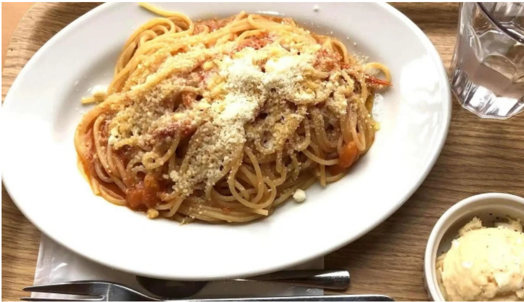
チッチヨ comentario 6