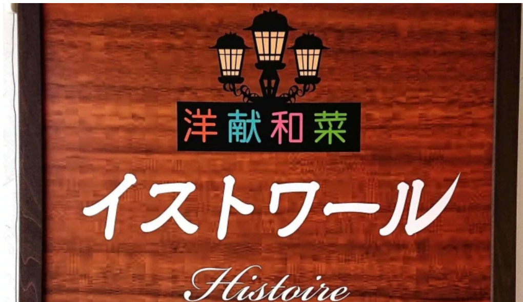
洋献和菜 イストワール 所在地