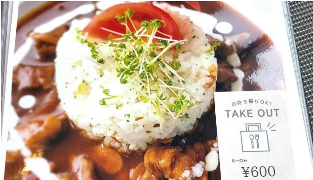
洋献和菜 イストワール コメント