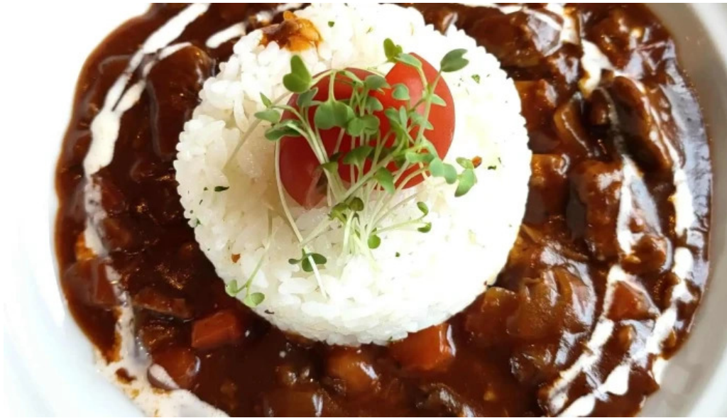
洋献和菜 イストワール 営業時間