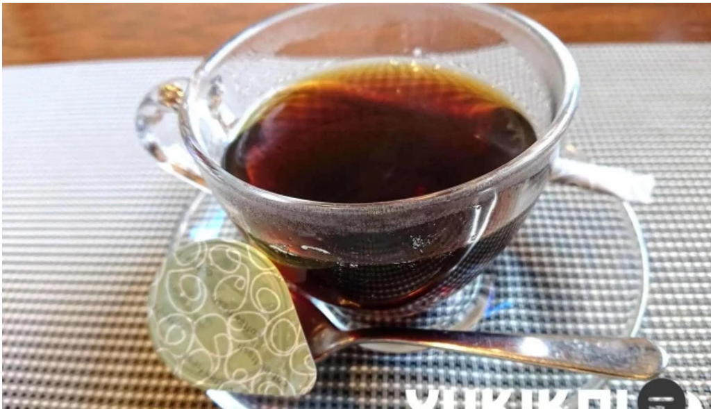
洋献和菜 イストワール コーヒー