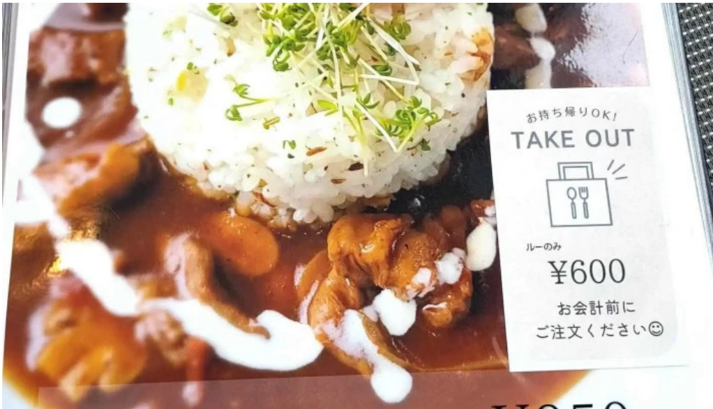
洋献和菜 イストワール メニュー