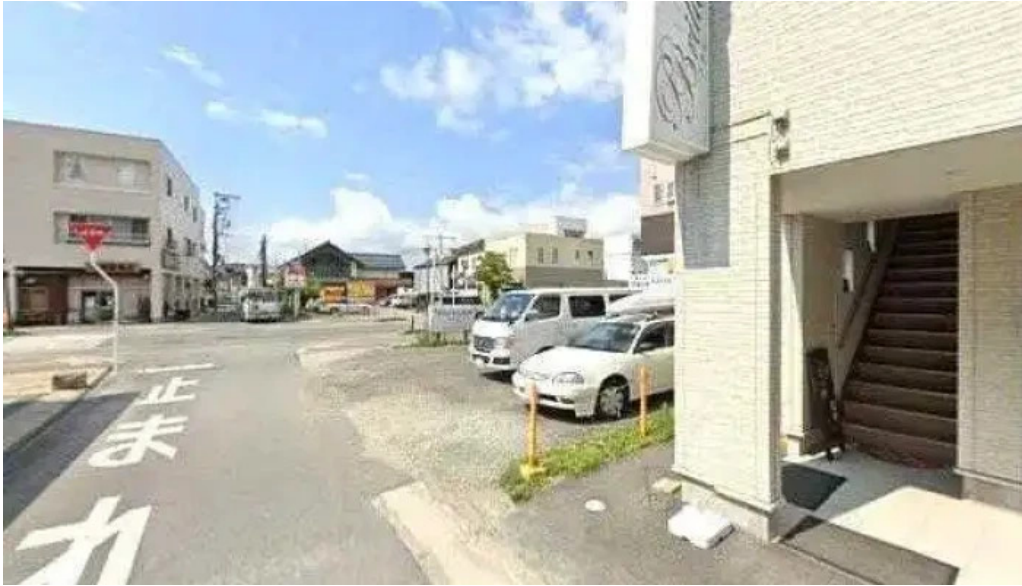
洋献和菜 イストワール 南陽市