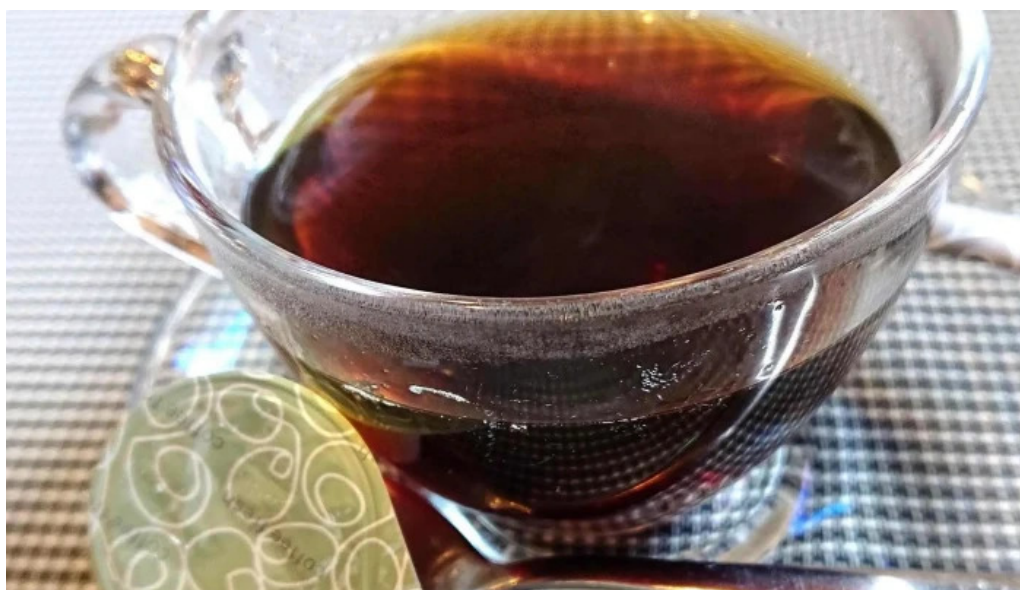
洋献和菜 イストワール 電話