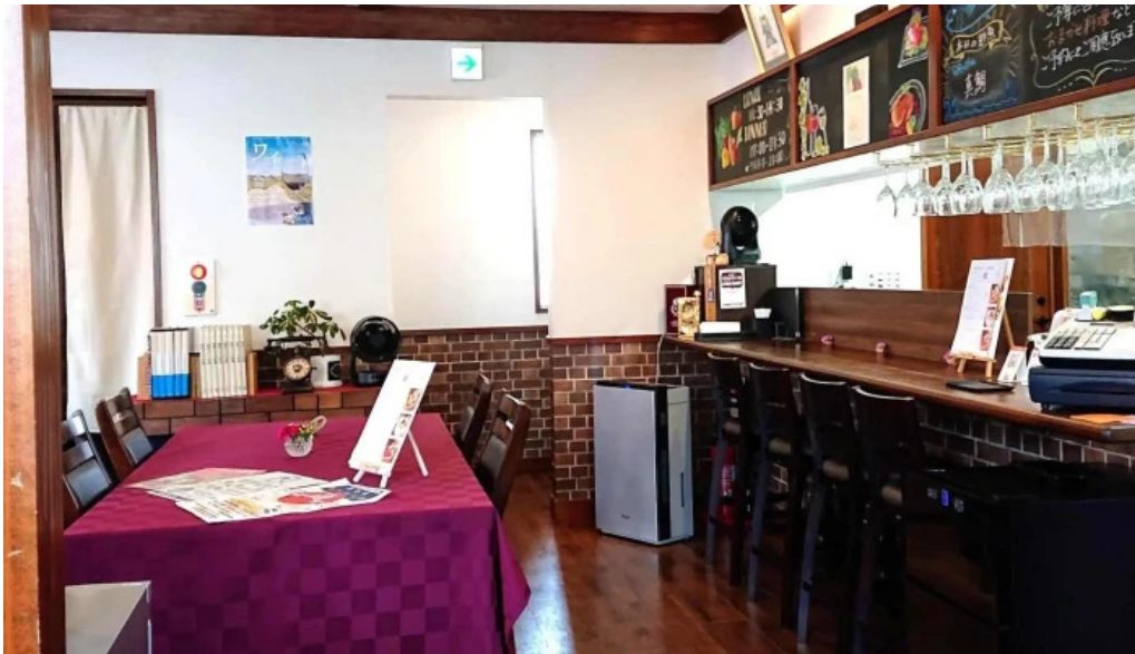
洋献和菜 イストワール どこ