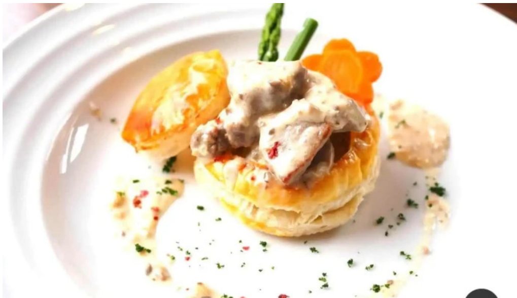
洋献和菜 イストワール 料理飲み物