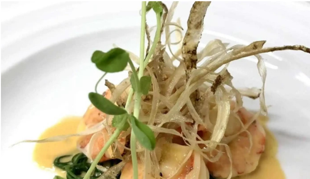
洋献和菜 イストワール