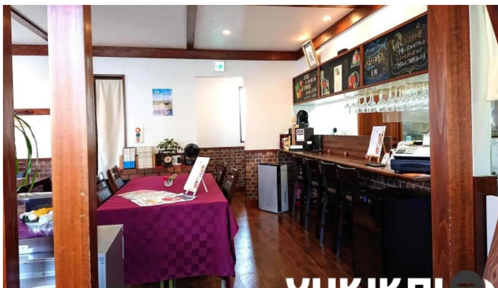
洋献和菜 イストワール 雰囲気