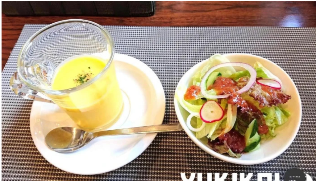
洋献和菜 イストワール 味噌汁