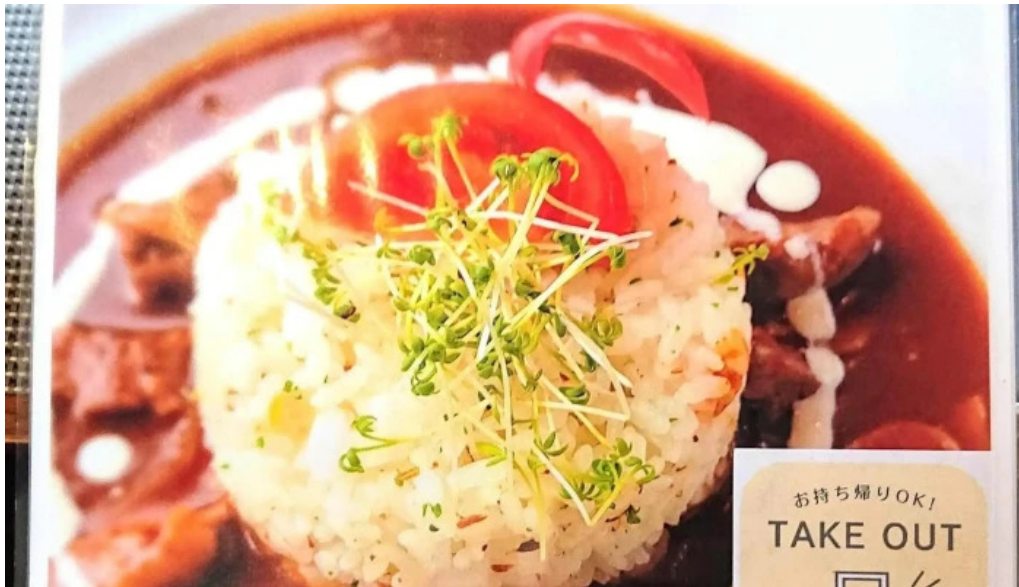
洋献和菜 イストワール 番号