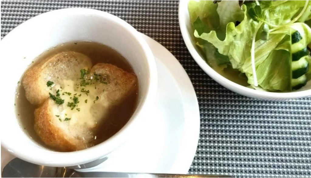
洋献和菜 イストワール プロモーション