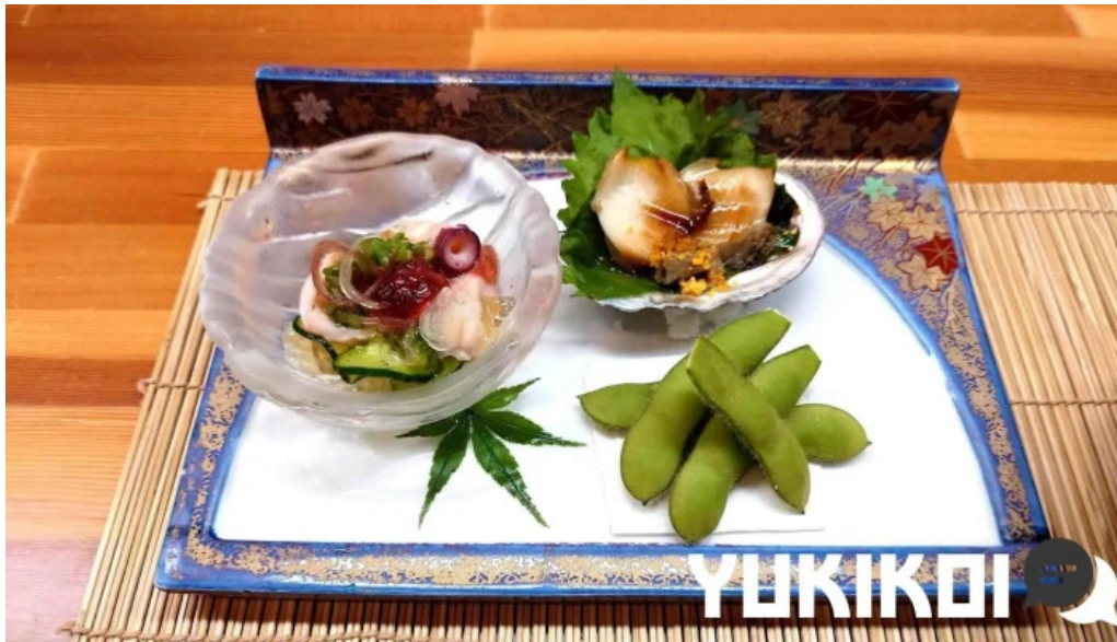
富田屋 料理飲み物