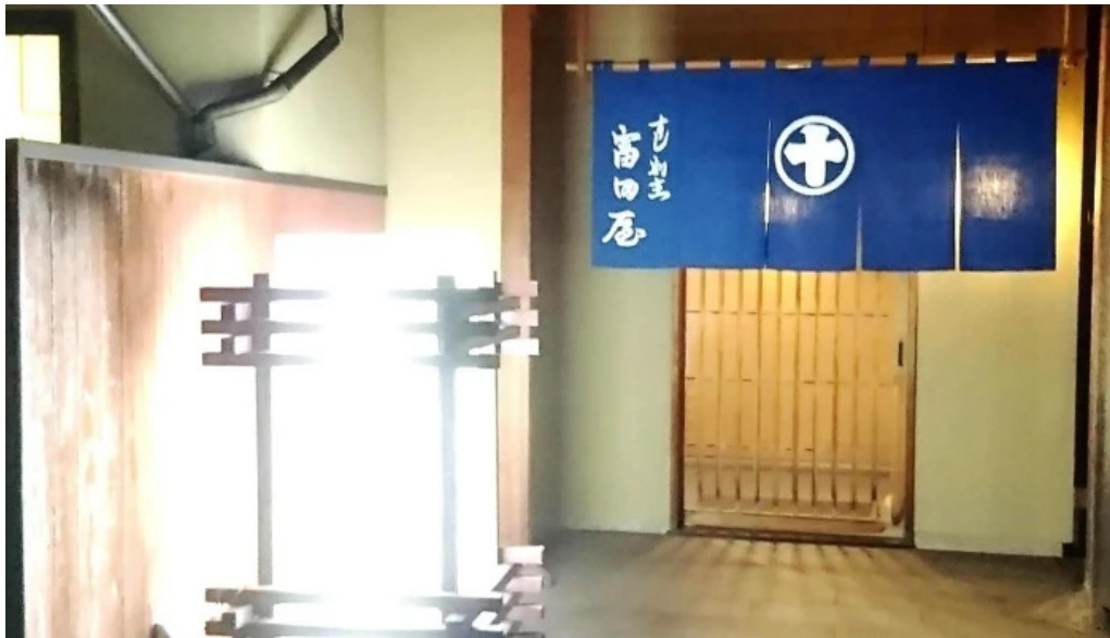
富田屋 ウェブサイト