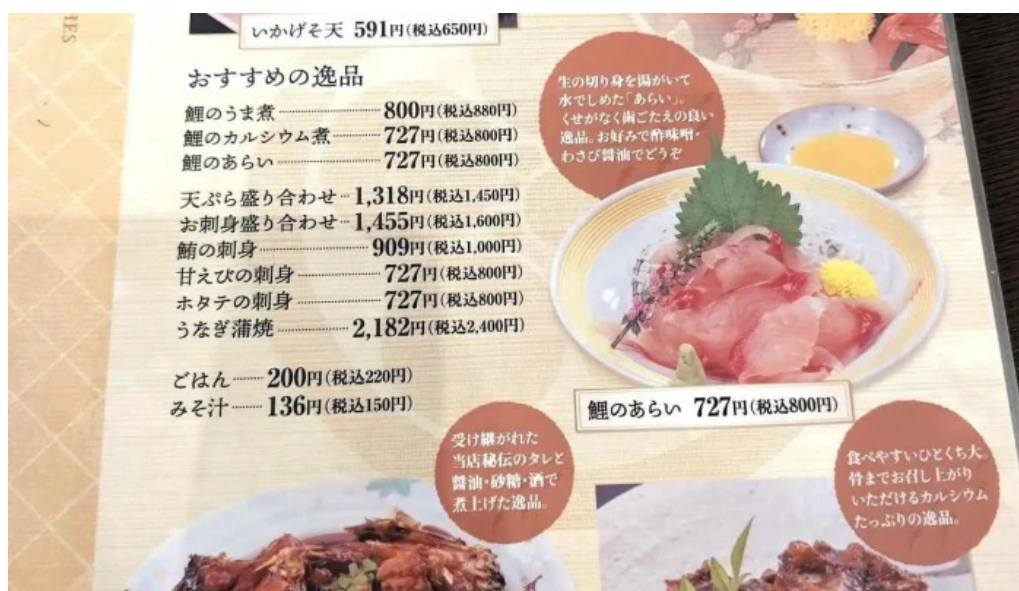
レストラン味処四季彩渡部鯉店 メニュー