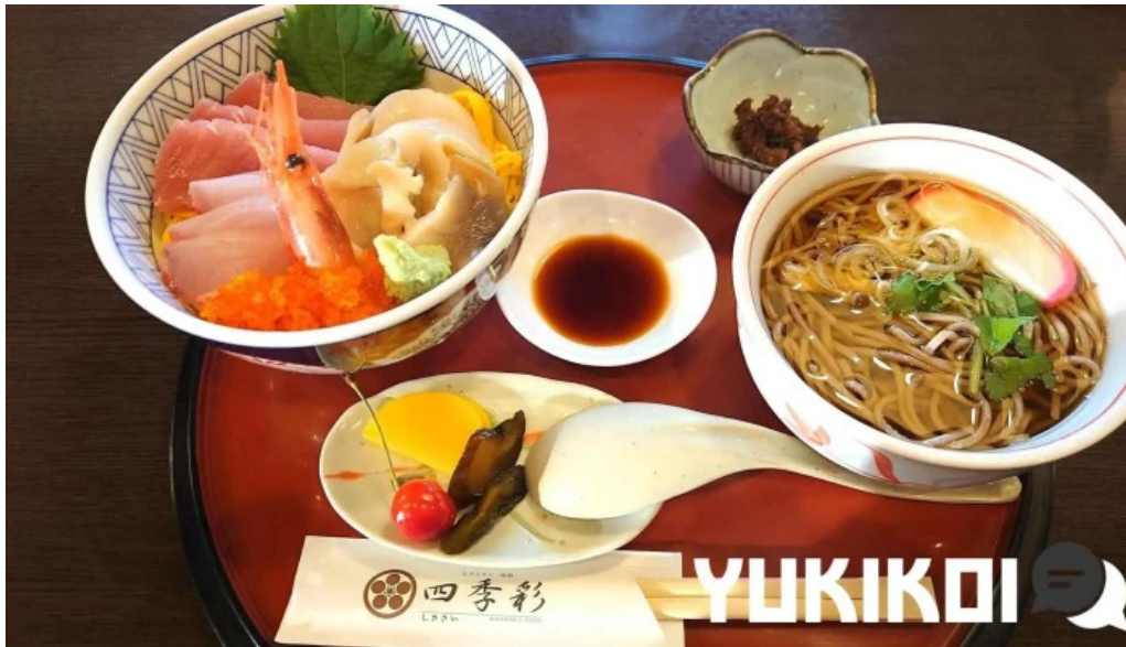
レストラン味処四季彩渡部鯉店 蕎麦