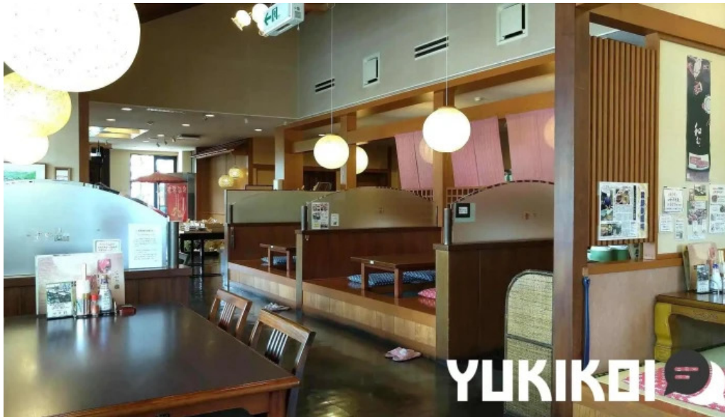
レストラン味処四季彩渡部鯉店 雰囲気