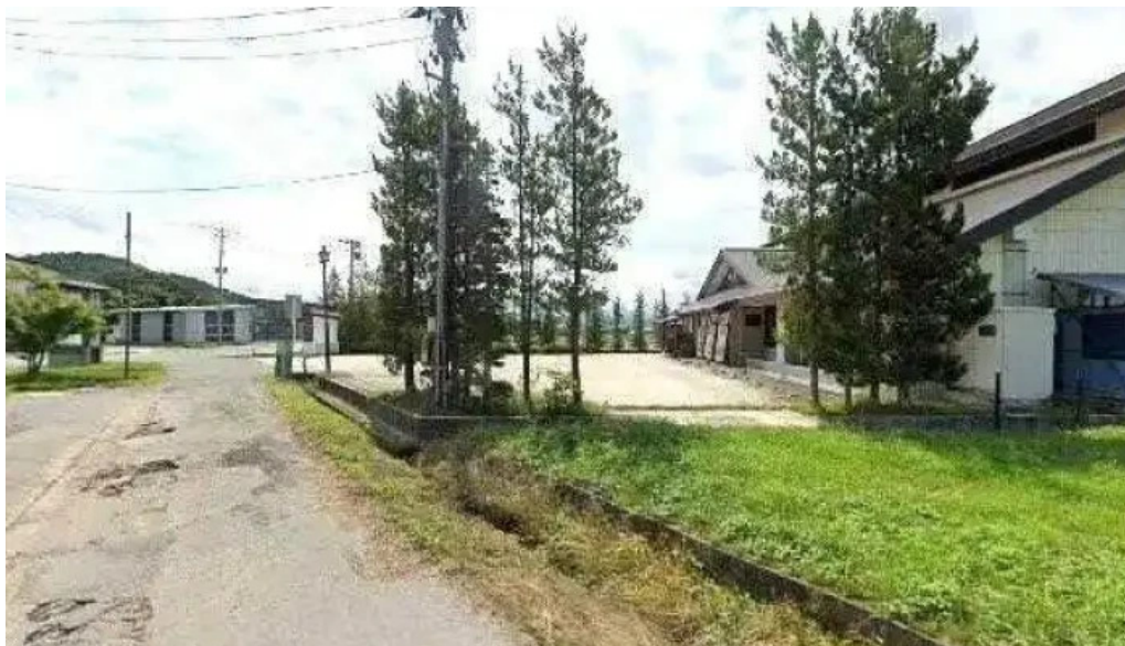
レストラン味処四季彩渡部鯉店 南陽市