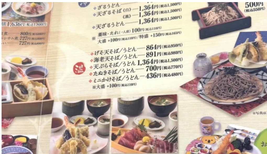
レストラン味処四季彩渡部鯉店 instagram