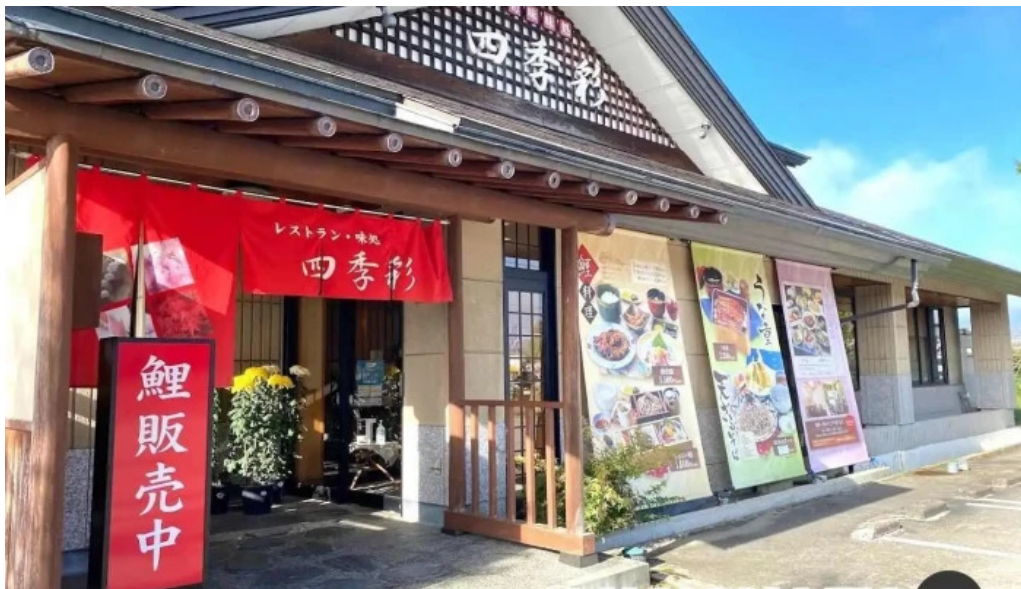
レストラン味処四季彩・渡部鯉店 南陽市