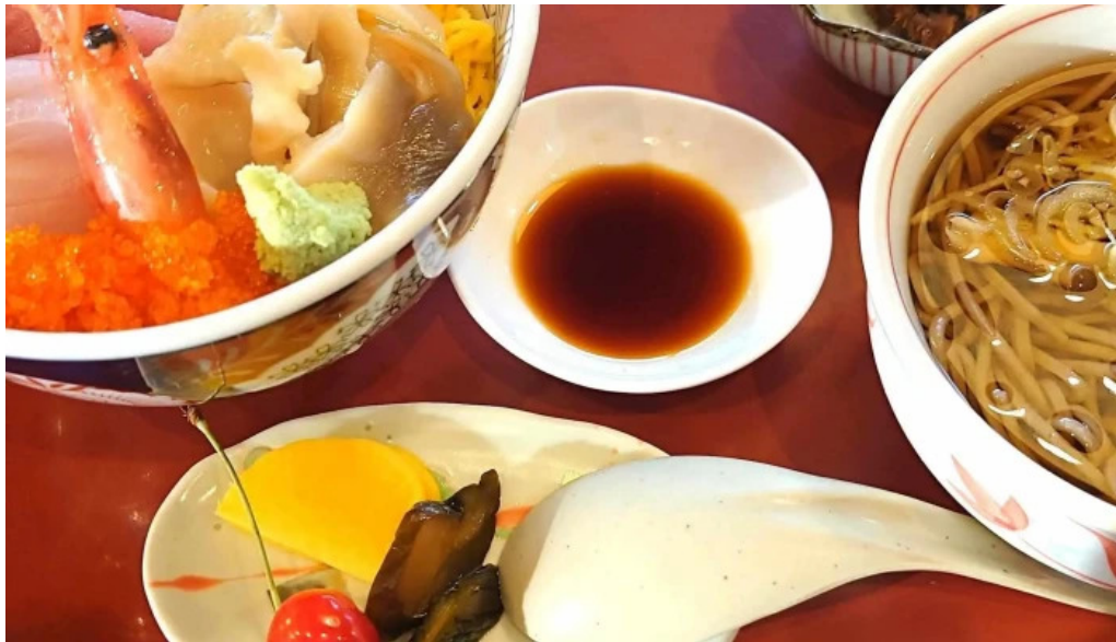
レストラン味処四季彩渡部鯉店 所在地