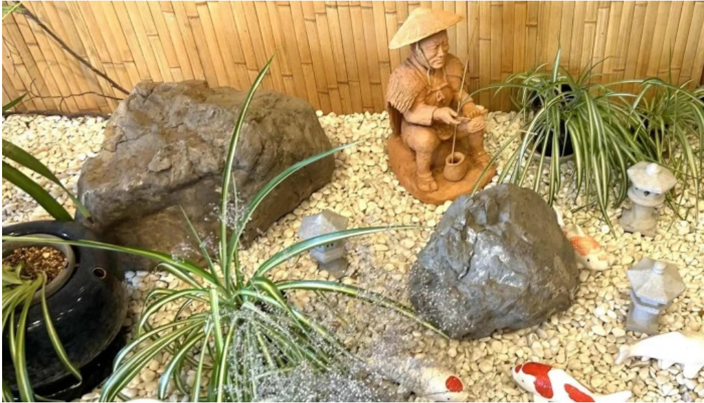
レストラン味処四季彩渡部鯉店 コメント