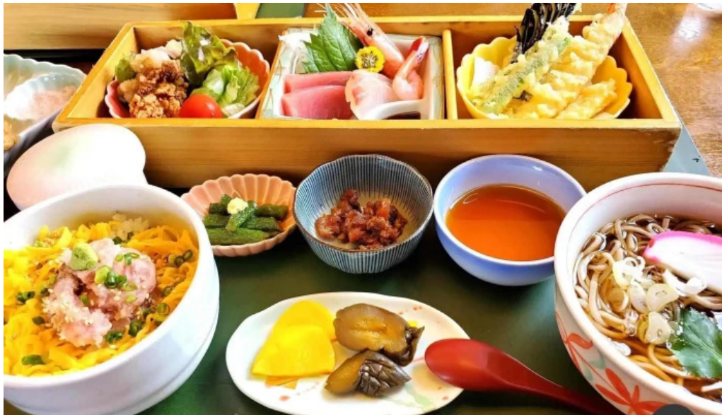
レストラン味処四季彩渡部鯉店 料理飲み物