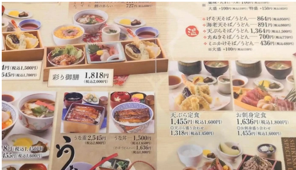
レストラン味処四季彩渡部鯉店 営業中