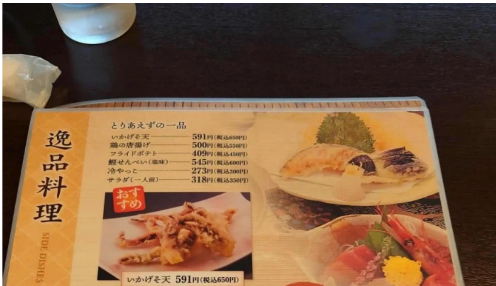
レストラン味処四季彩渡部鯉店 近く