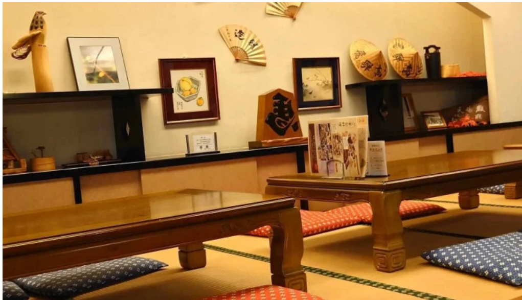
レストラン味処四季彩渡部鯉店 口コミ