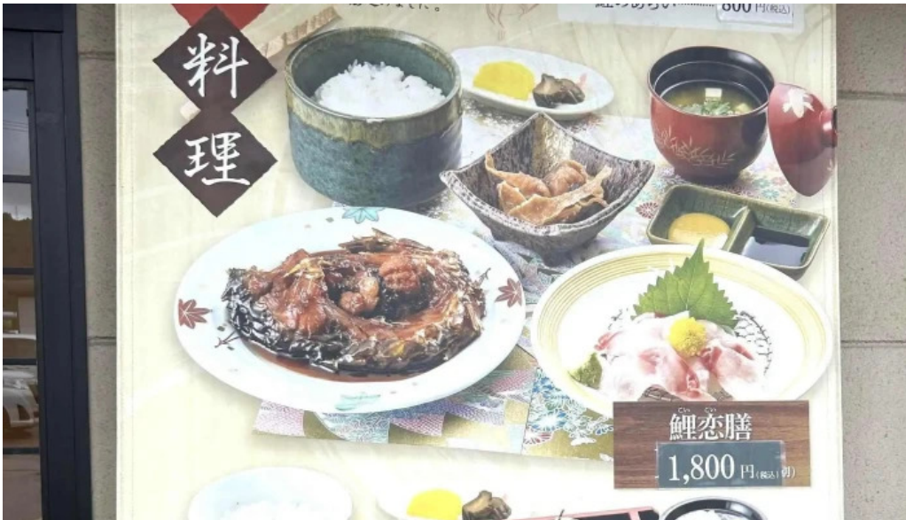
レストラン味処四季彩渡部鯉店 どこ