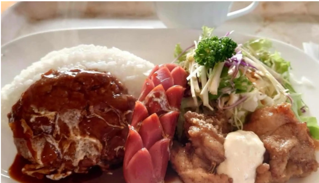
レストハウス 樹林 営業中