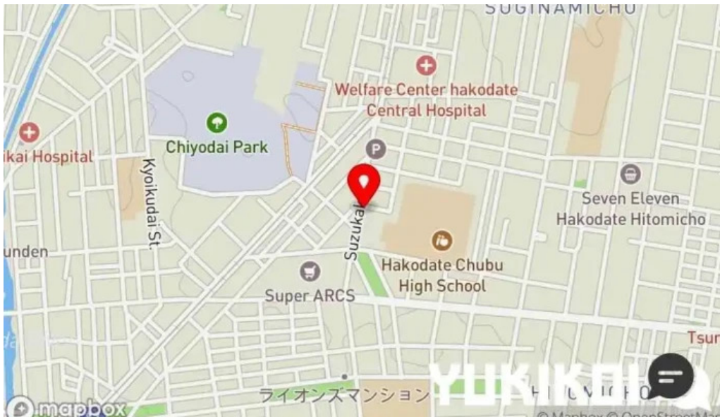
レストハウス 樹林 地図