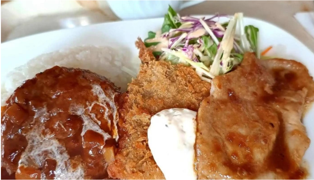
レストハウス 樹林 営業時間