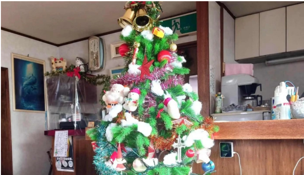
レストハウス 樹林 カタログ