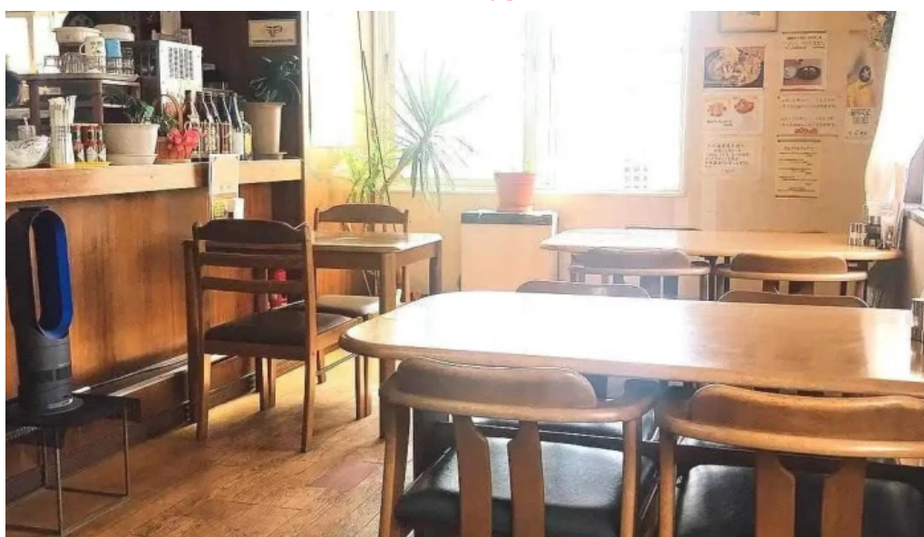
レストハウス 樹林 雰囲気