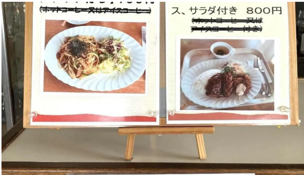
レストハウス 樹林 メニュー