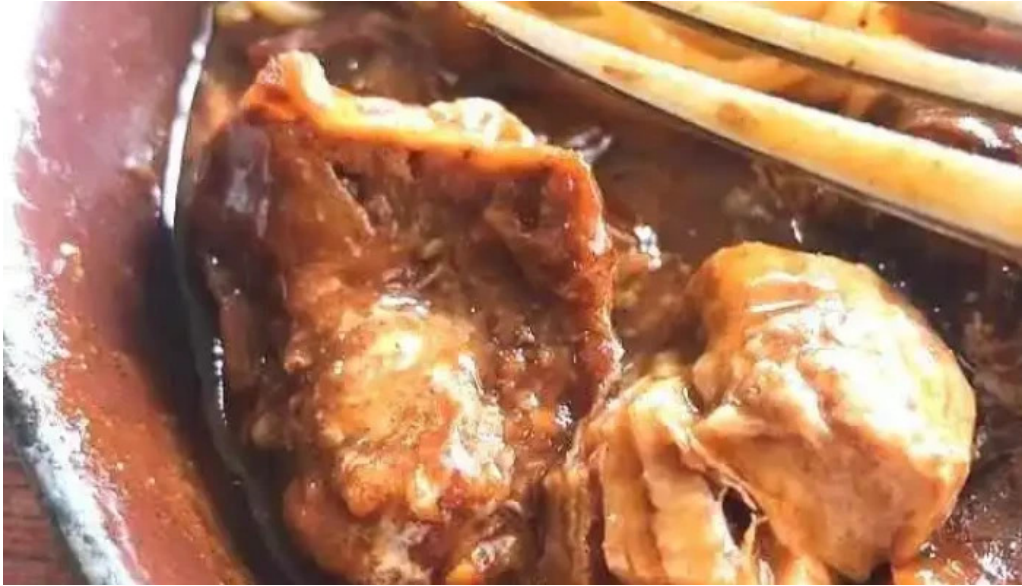
レストハウス 樹林 動画