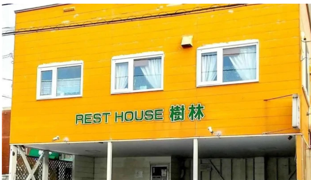
レストハウス 樹林 最新