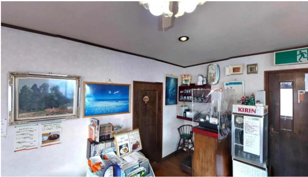
レストハウス 樹林 函館市