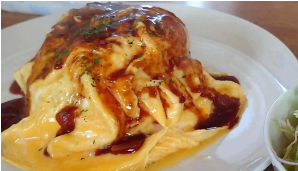
レストハウス 樹林 割引