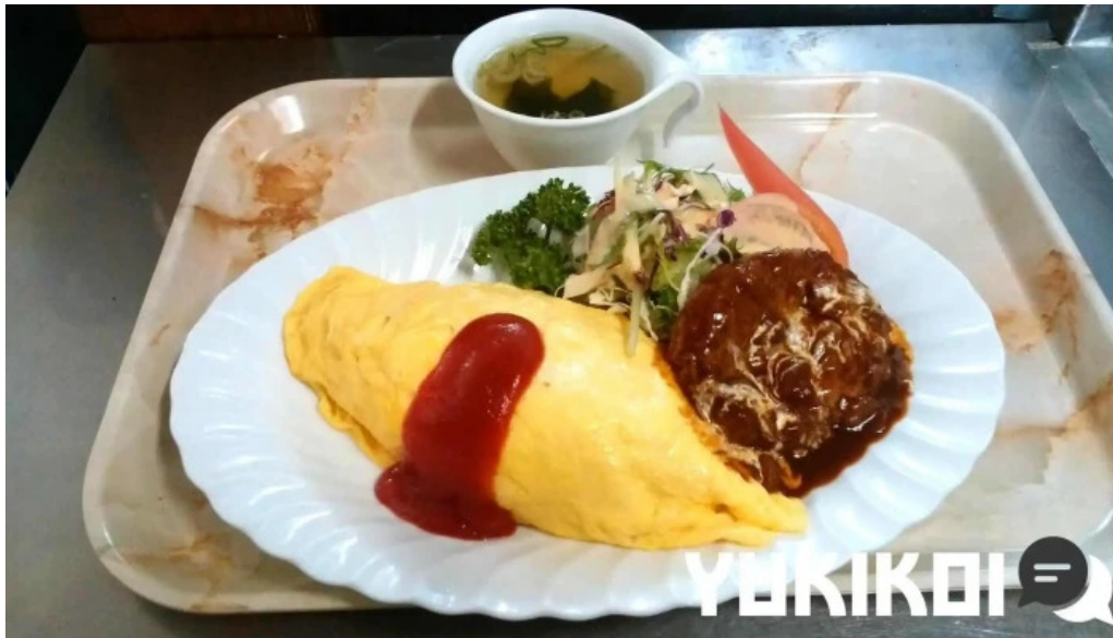
レストハウス 樹林 オムライス