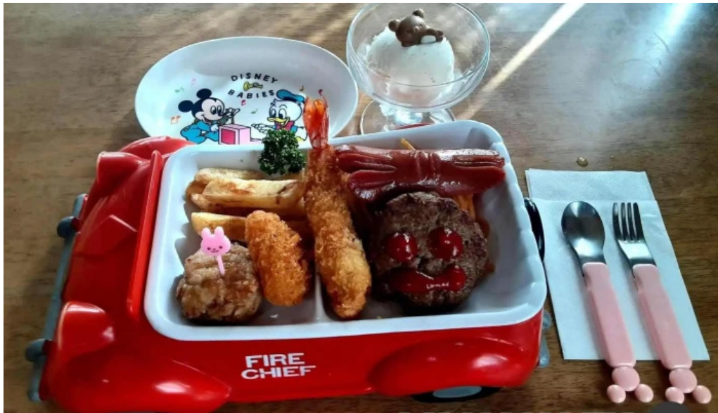
レストハウス 樹林 料理飲み物