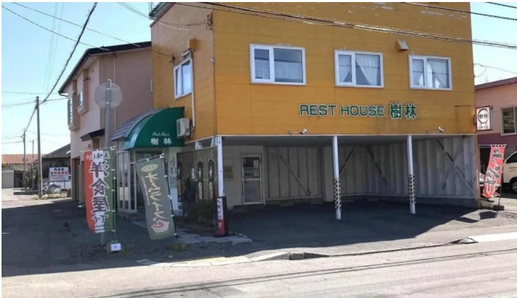
レストハウス 樹林