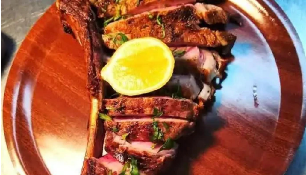
ヴェールバーアンドグリル オーナー提供