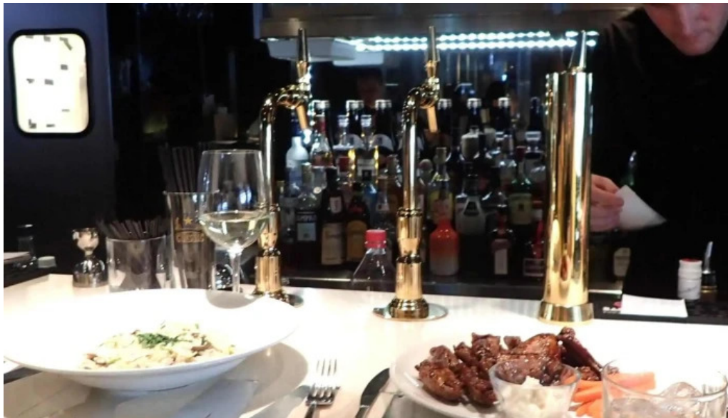
ヴェールバーアンドグリル 口コミ