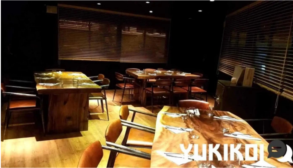
ヴェールバーアンドグリル 料理飲み物