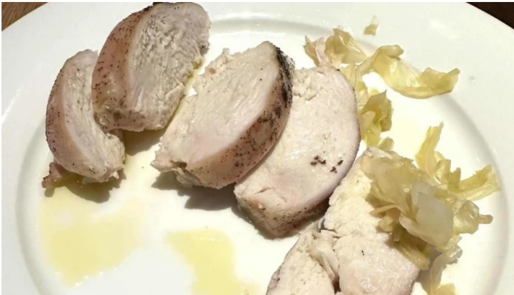
ヴェールバーアンドグリル ウェブサイト