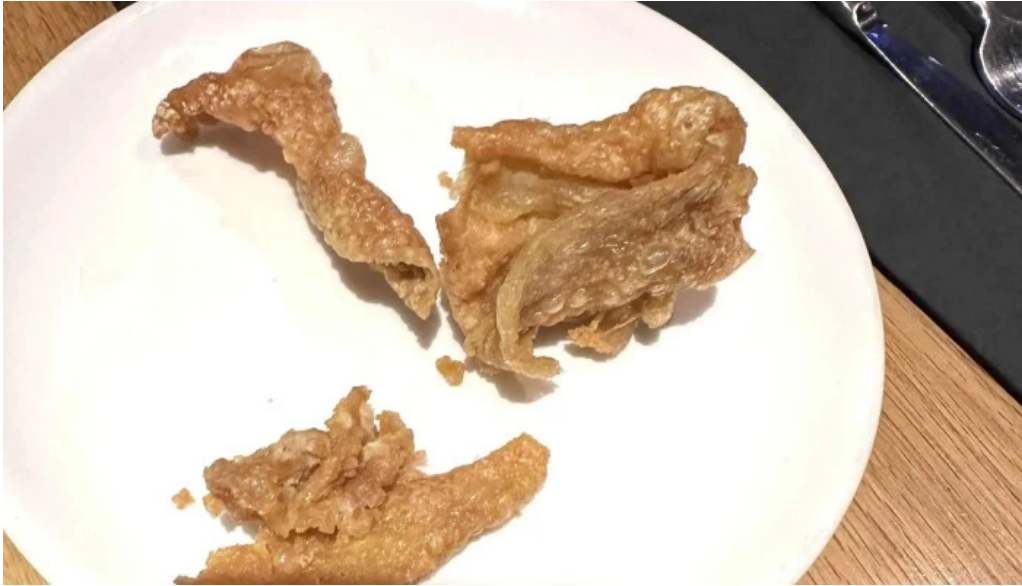
ヴェールバーアンドグリル 割引