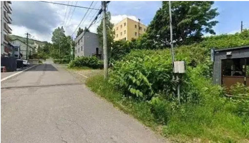
ヴェールバーアンドグリル 倶知安町