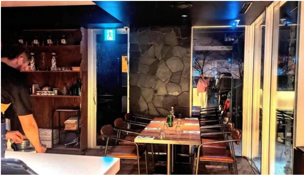
ヴェールバーアンドグリル 雰囲気