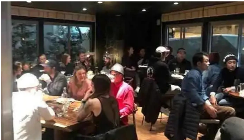
ヴェール・バー・アンド・グリル 倶知安町