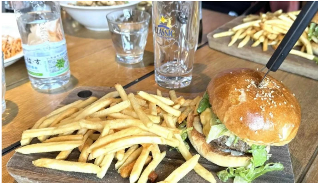
ヴェールバーアンドグリル 営業中