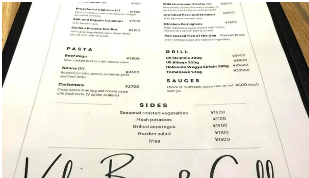
ヴェールバーアンドグリルメニュー