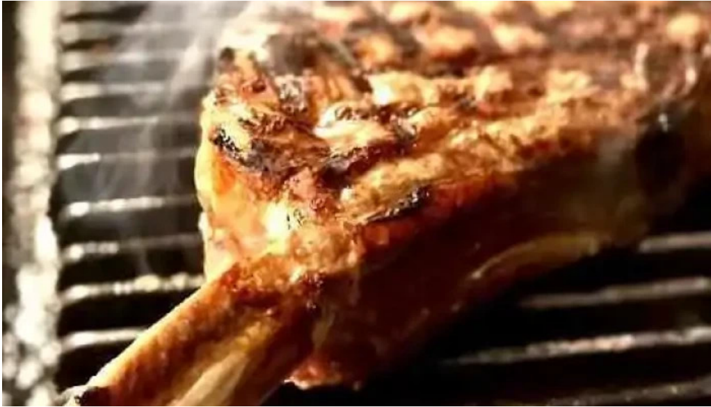
ヴェールバーアンドグリル ステーキ