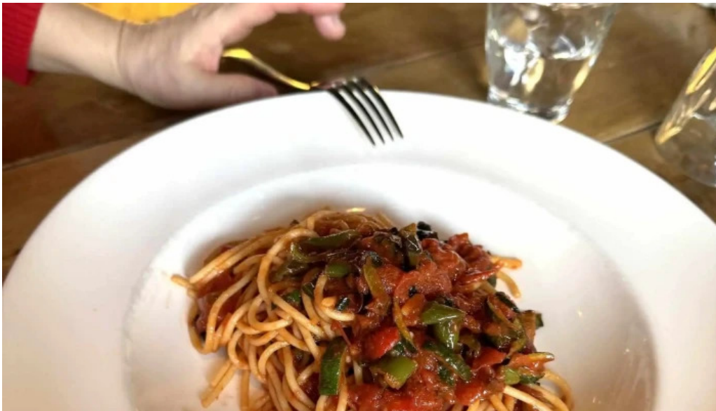
ヴェールバーアンドグリル カタログ