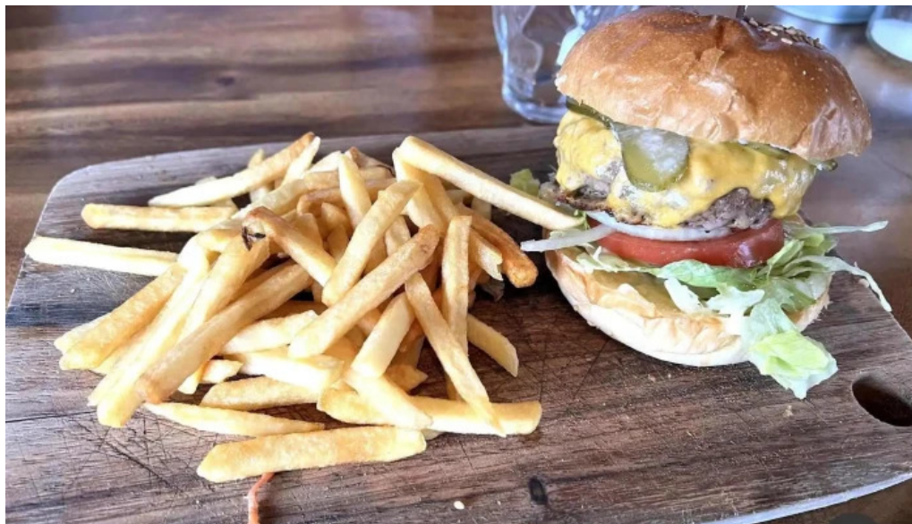
ヴェールバーアンドグリル フライドポテト