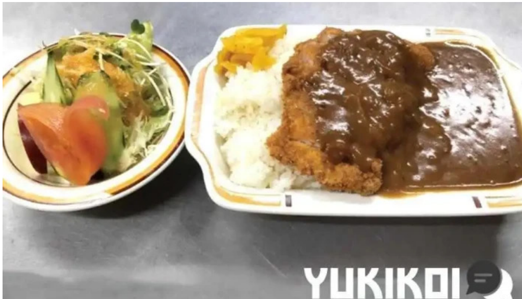
グリルかかし 料理飲み物