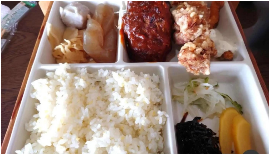
グリルかかし 弁当