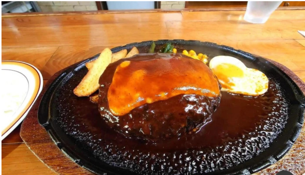
グリルかかし ソールズベリーステーキ