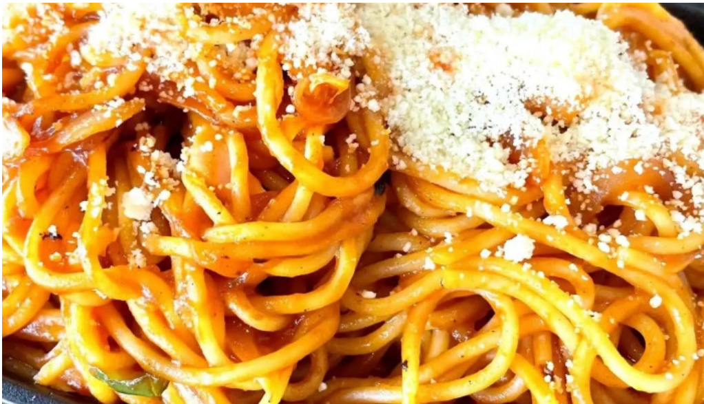
グリルかかし ウェブサイト