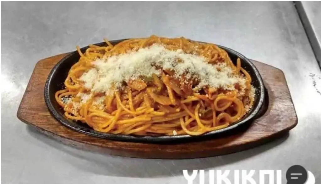
グリルかかし