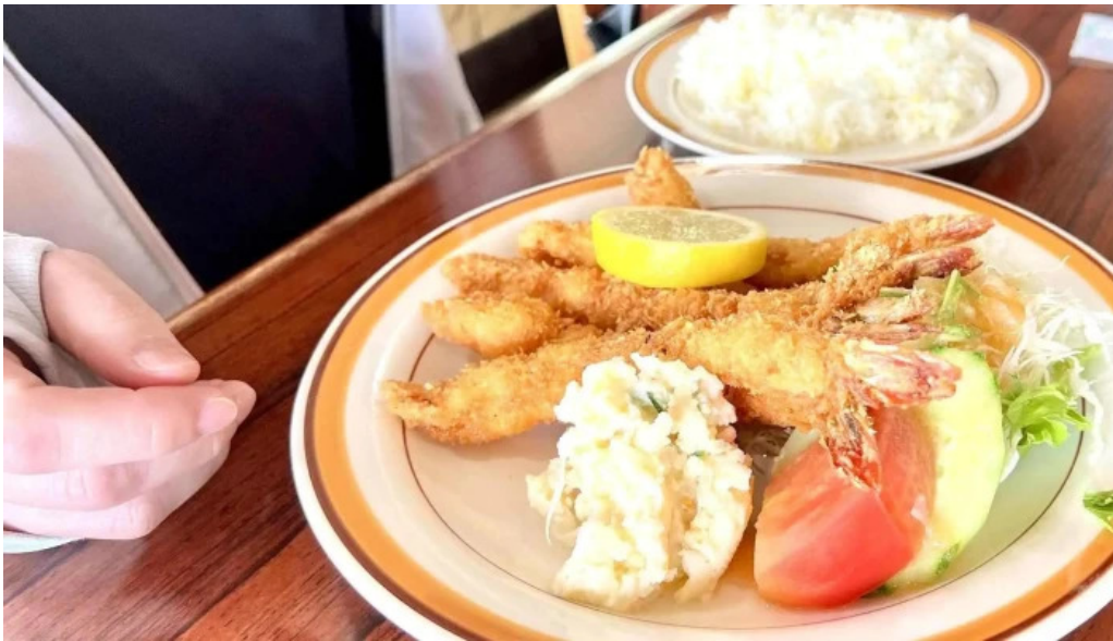
グリルかかし 割引