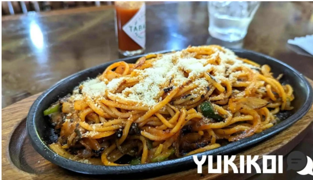
グリルかかし ナポリタン