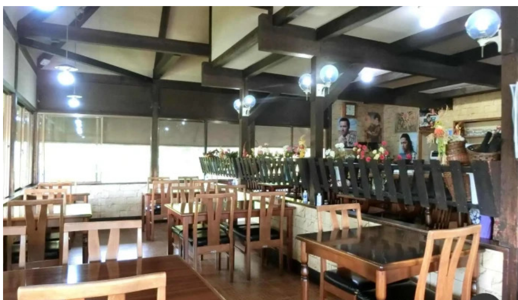
グリルかかし 雰囲気