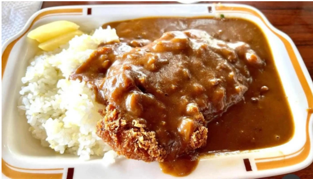
グリルかかし 豚カツ