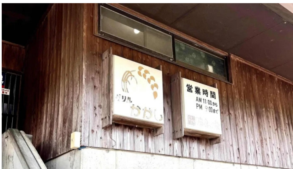
グリルかかし 電話