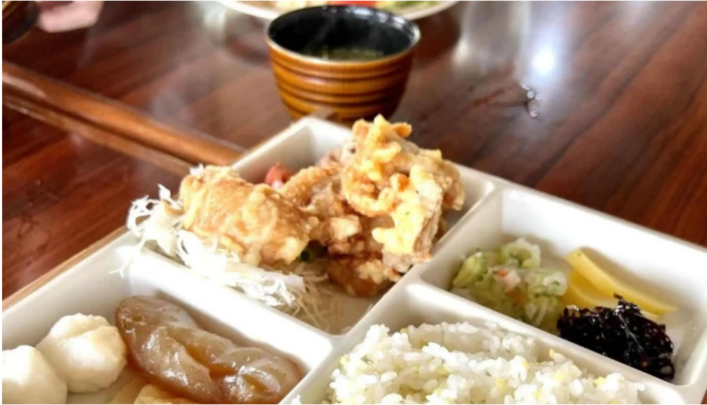
グリルかかし 営業時間