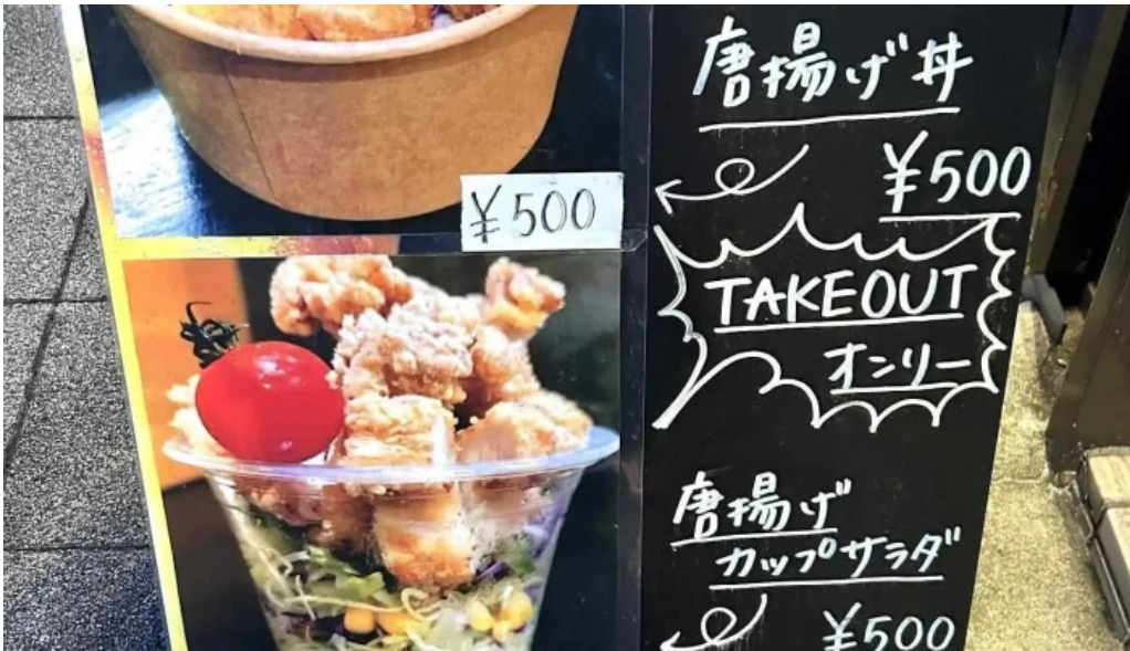
からあげ翔 メニュー