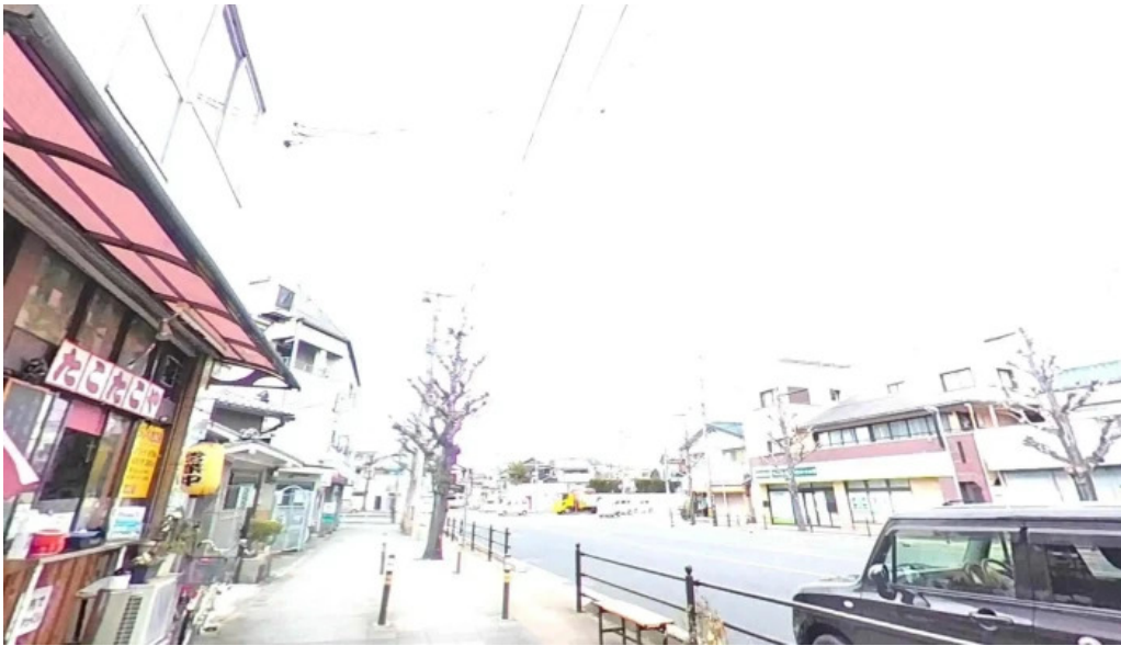
からあげ翔 京都市