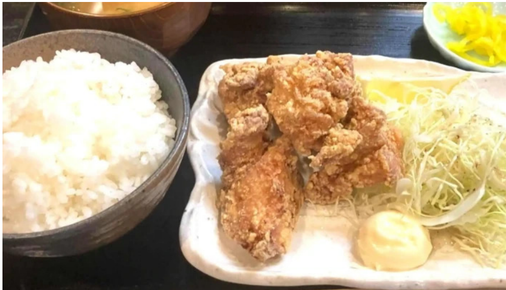
からあげ 翔 カタログ