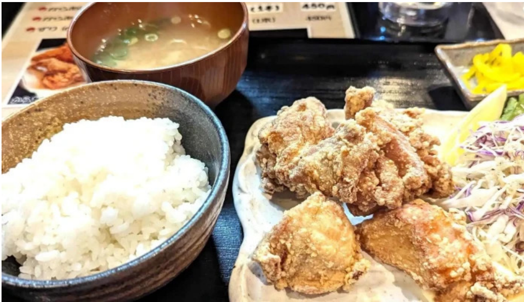
からあげ 翔 所在地