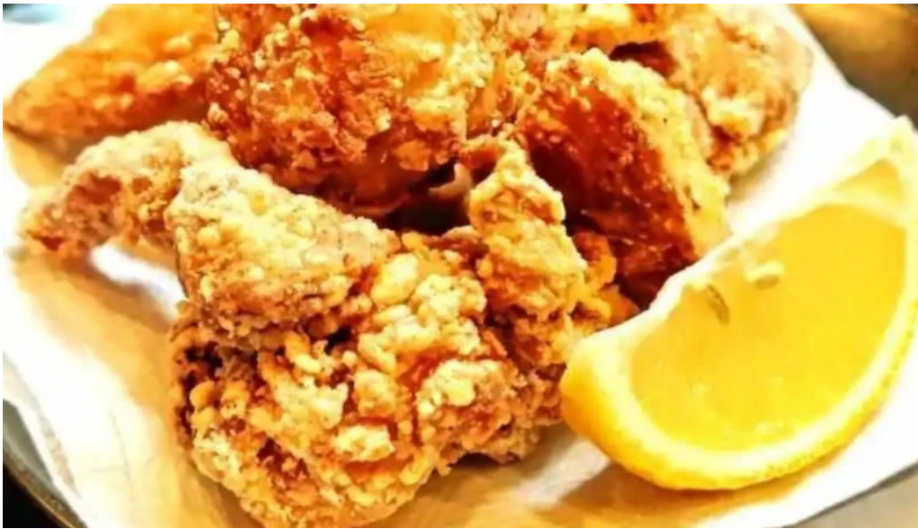
からあげ 翔 料理飲み物