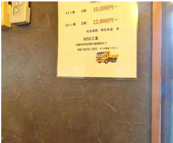
からあげ 翔 雰囲気