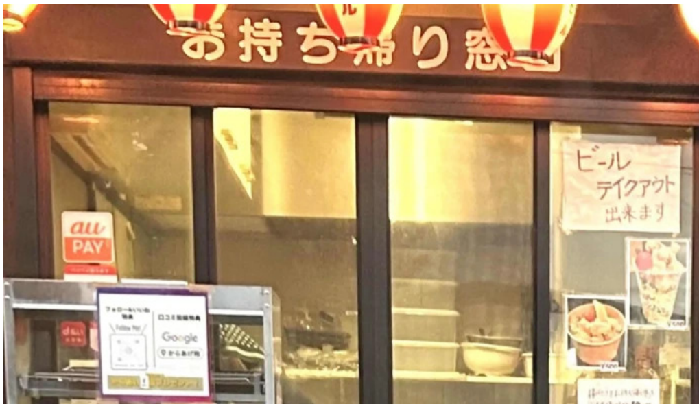
からあげ翔 スコア