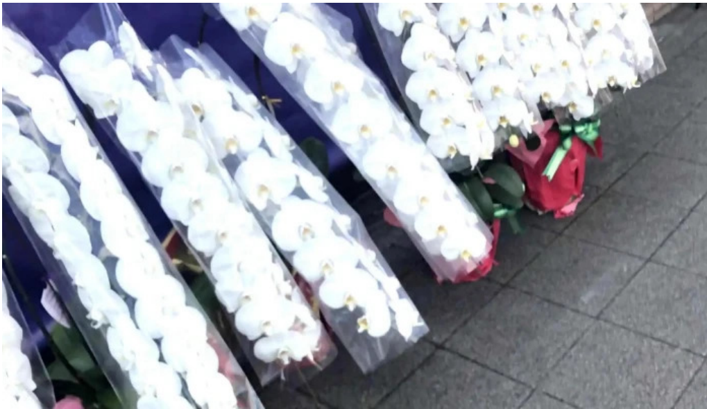
からあげ翔 コメント