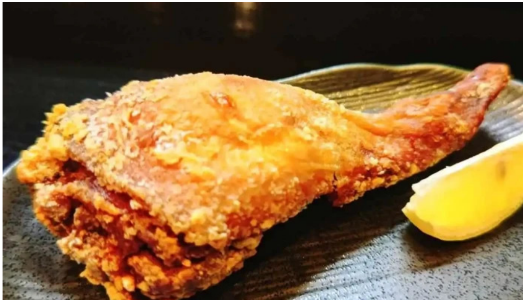
からあげ 翔