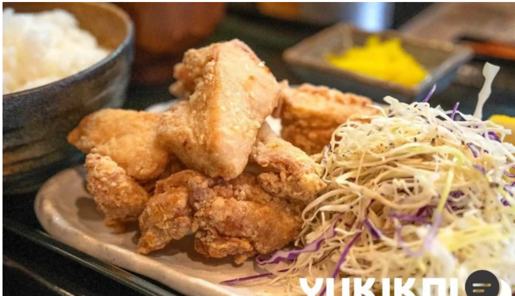
からあげ 翔 から揚げ