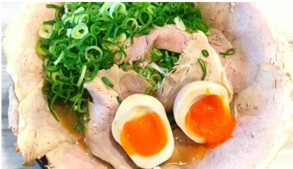
麺屋 龍仙 電話