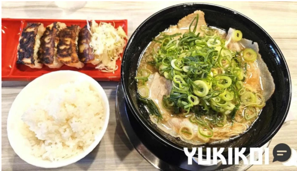
麺屋 龍仙 ラーメン