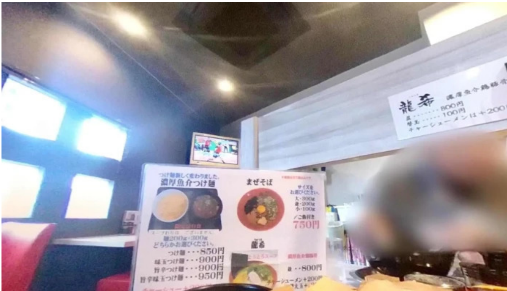
麺屋 龍仙 長岡京市