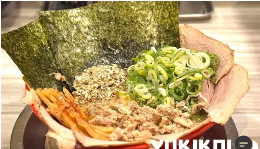
麵屋 龍仙 料理飲み物