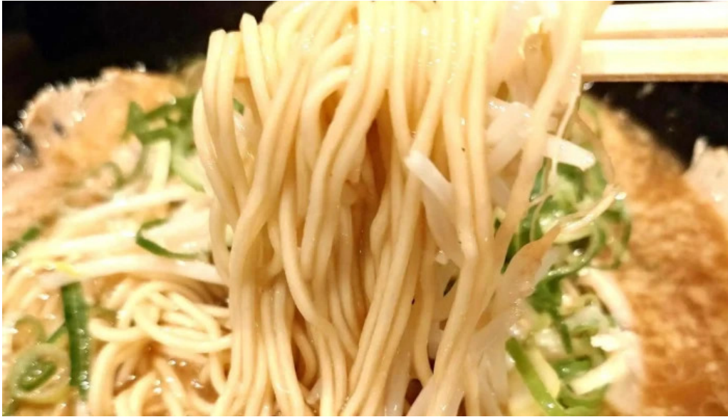
麵屋 龍仙 動画