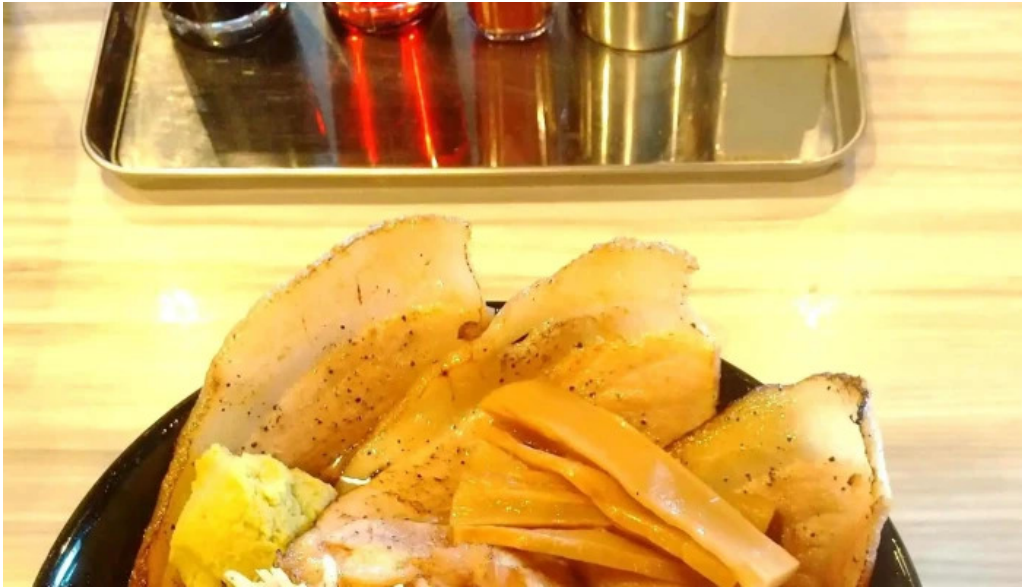
麵屋 龍仙 カタログ