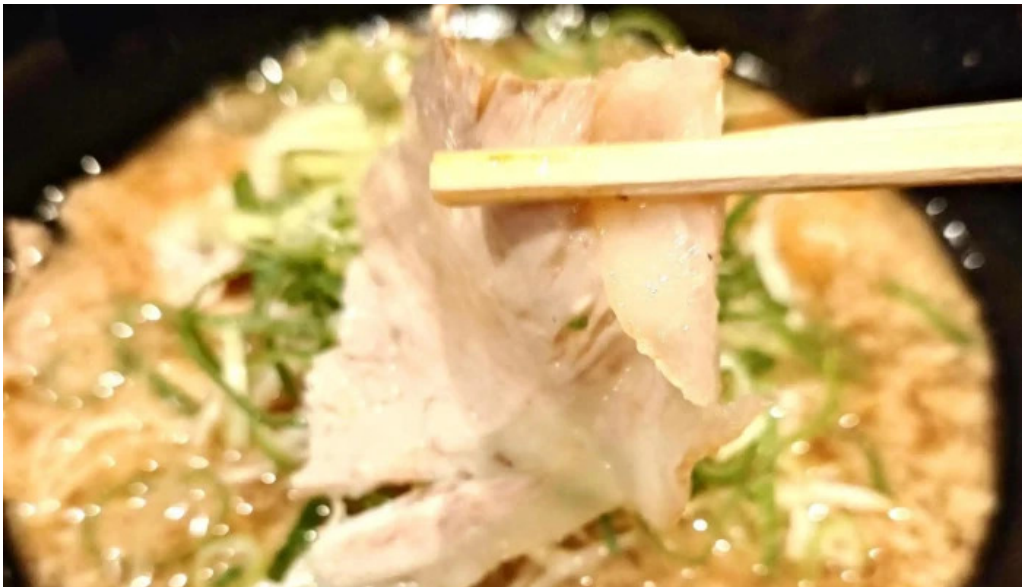
麺屋 龍仙 番号