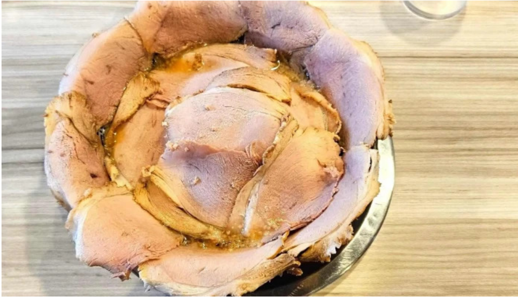
麵屋 龍仙 ポルケッタ