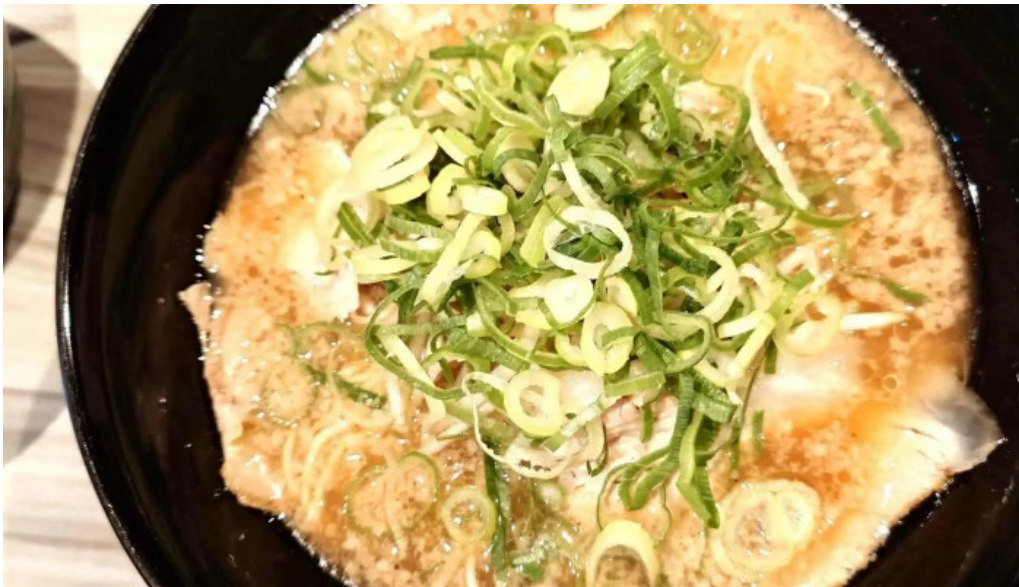
麺屋 龍仙 どころ