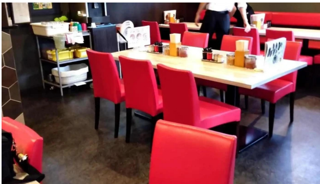
麺屋 龍仙 雰囲気