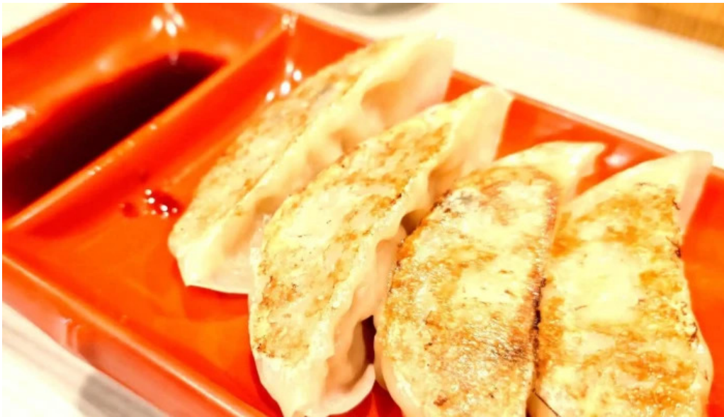
麵屋 龍仙 割引