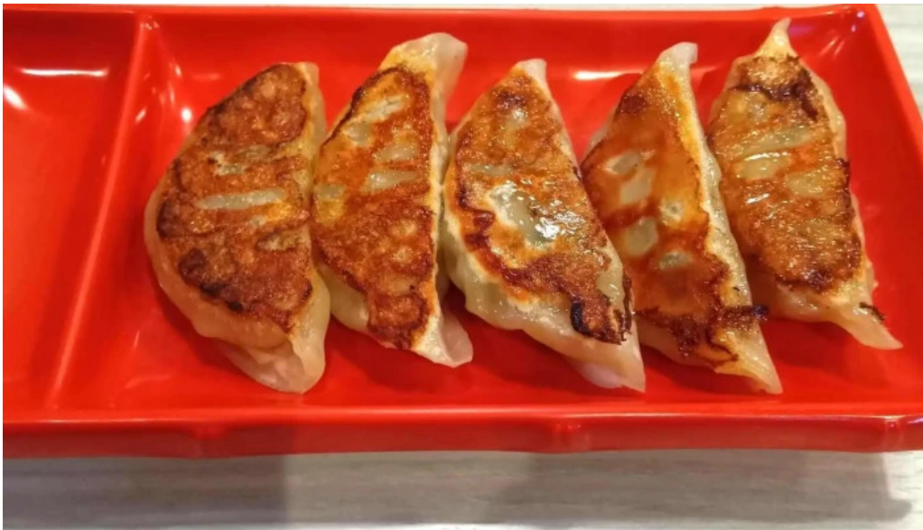
麵屋 龍仙 最新