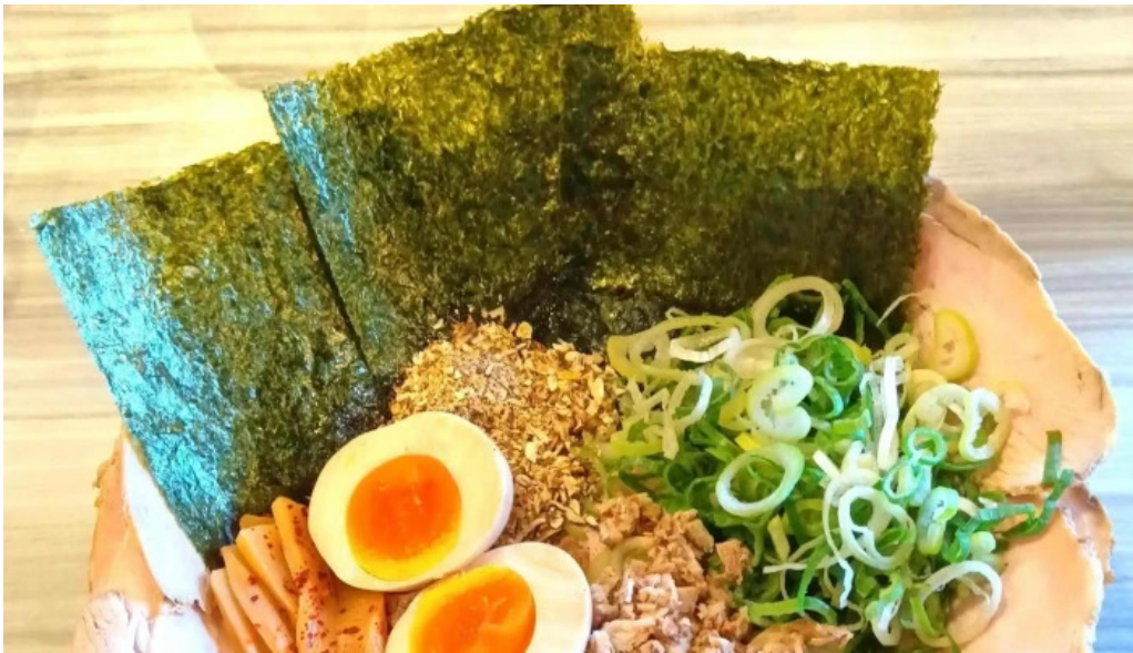
麵屋 龍仙 料金