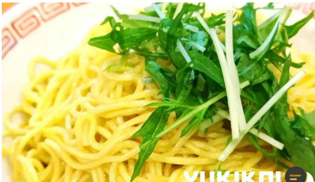
風来房 スパゲッティ