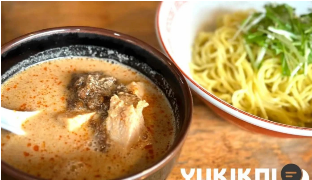
風来房 料理飲み物