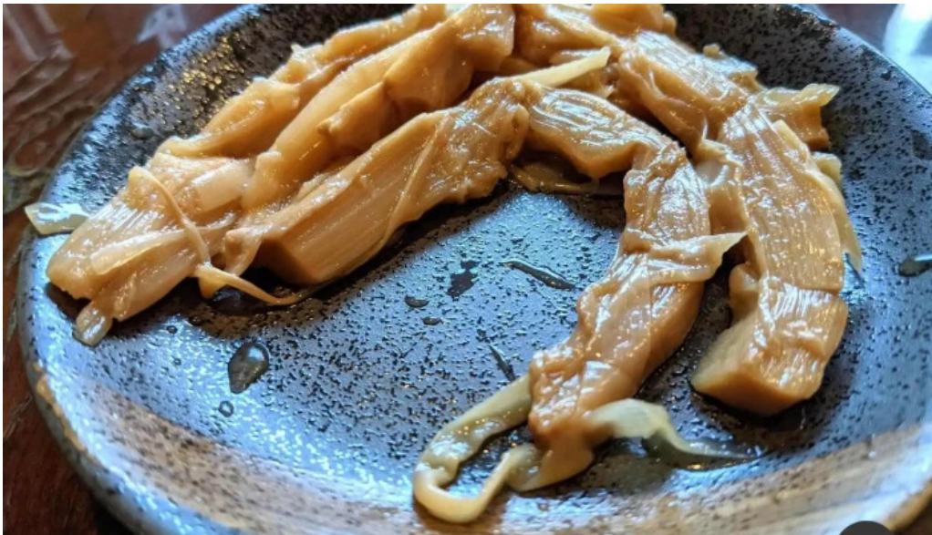
もちもちの木 野田店 料理飲み物