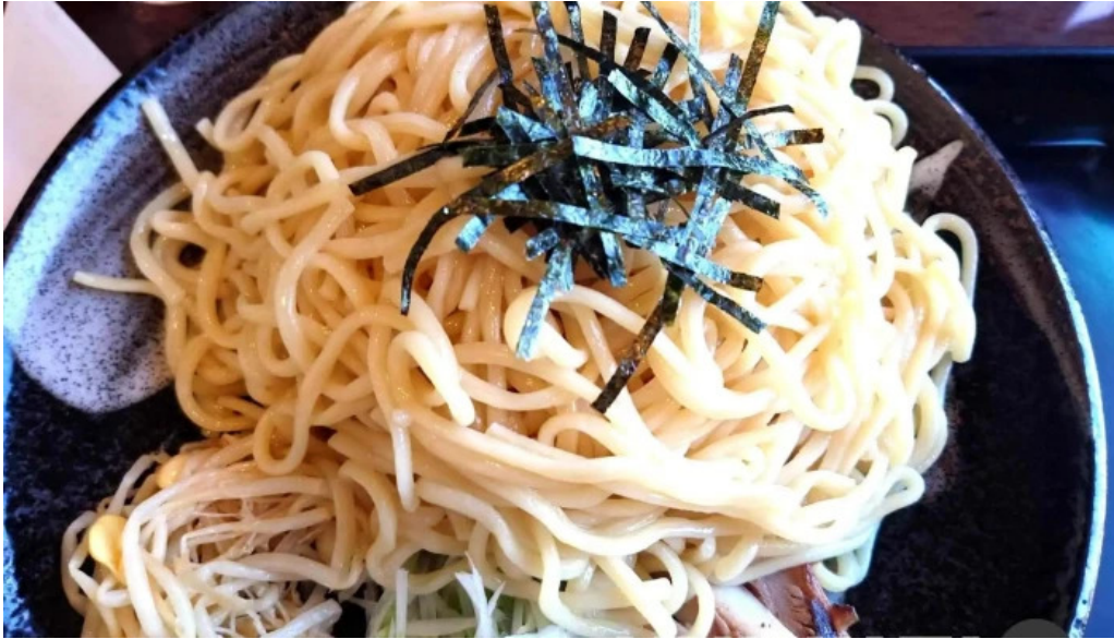
もちもちの木 野田店 蕎麦