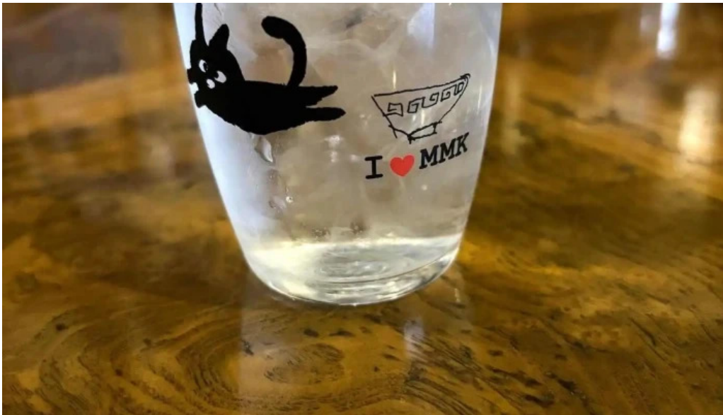
もちもちの木 野田店 日本酒