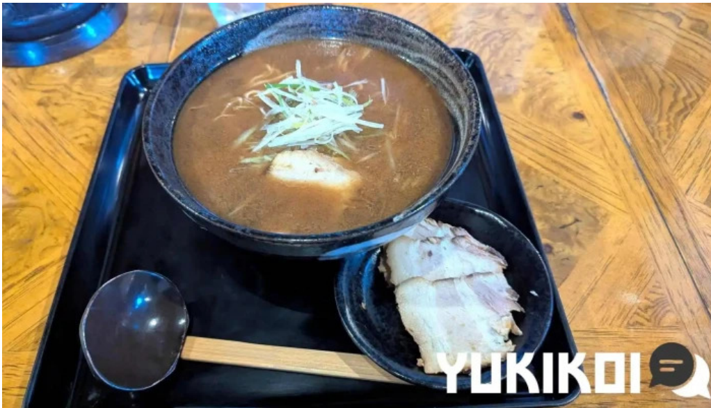
もちもちの木 野田店 最新