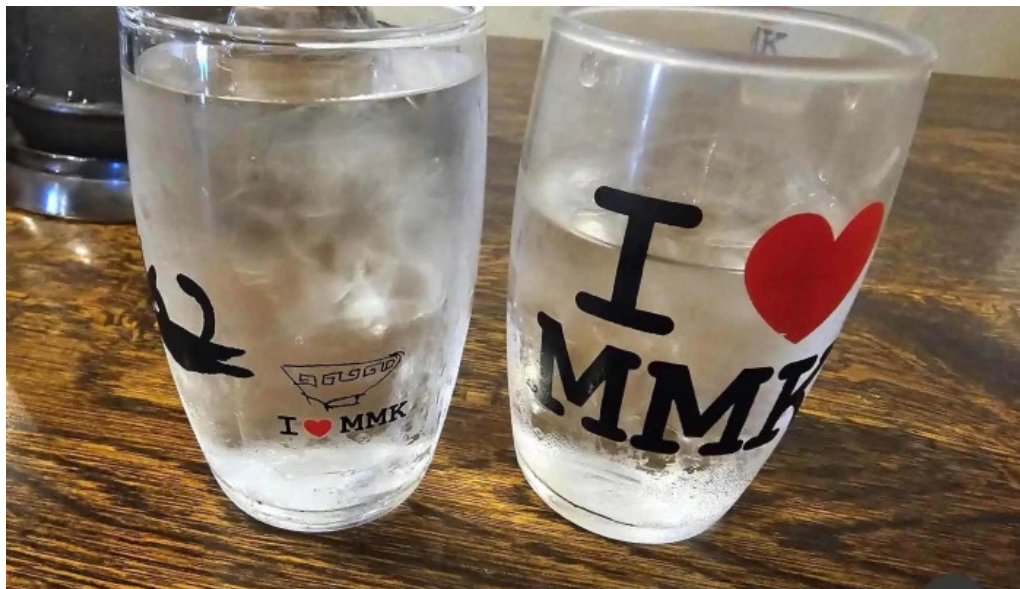
もちもちの木 野田店 ペプシコーラ