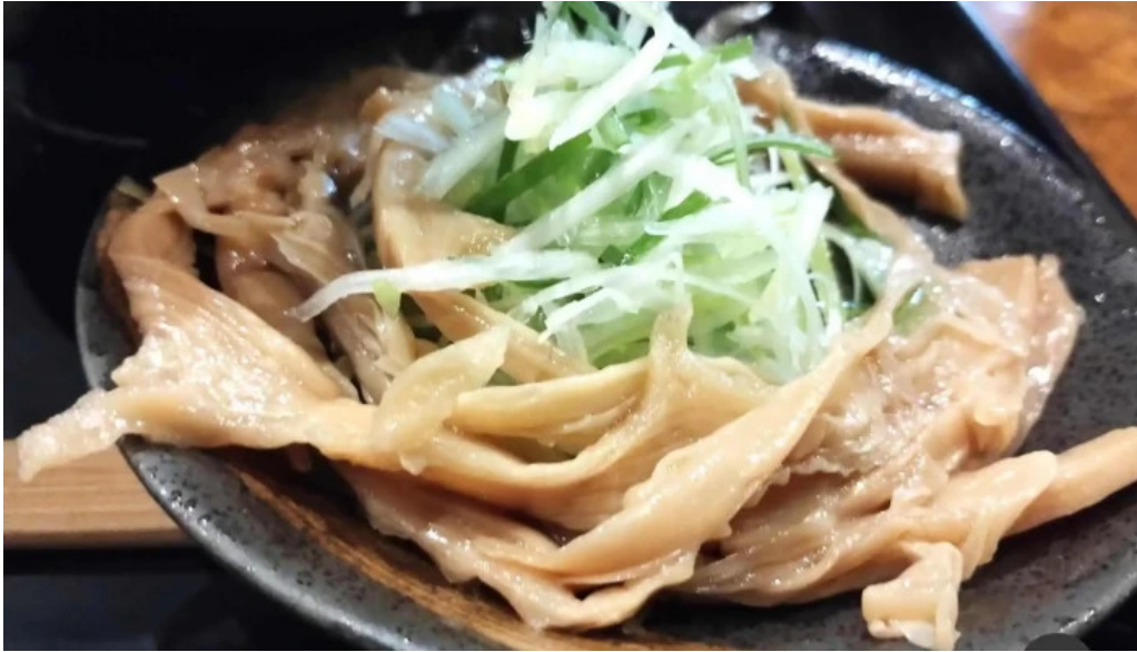
もちもちの木 野田店 トライプ