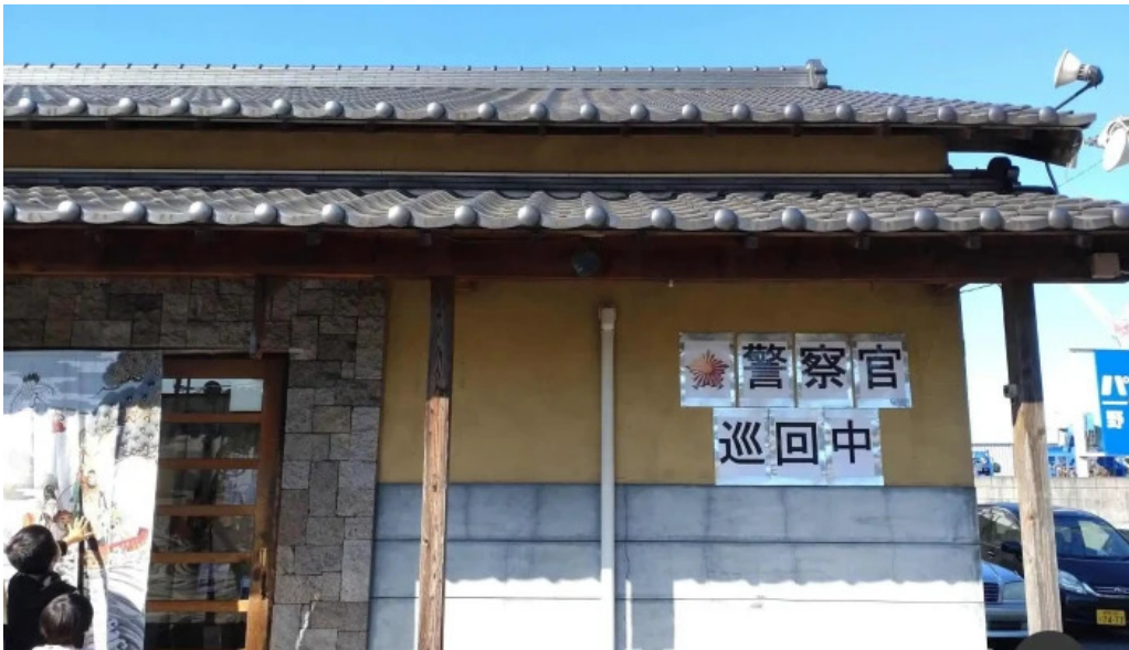
もちもちの木 野田店 野田市