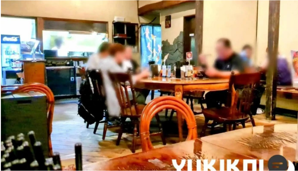
もちもちの木 野田店 雰囲気