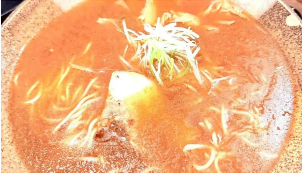
もちもちの木 野田店 ラーメン