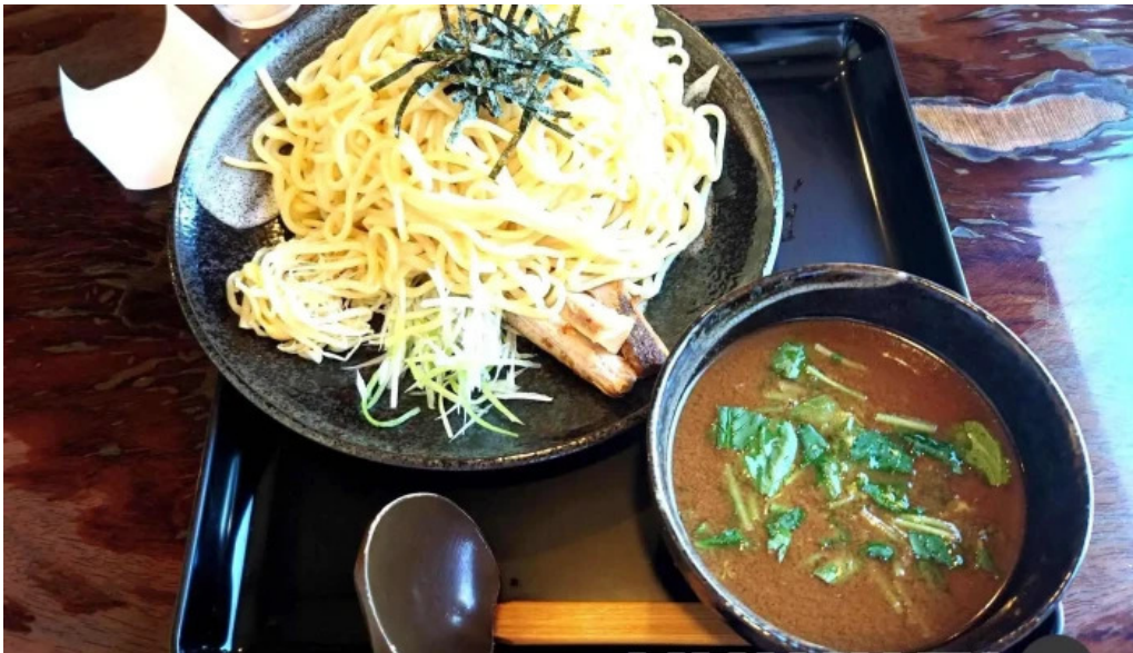
もちもちの木 野田店 つけ麺