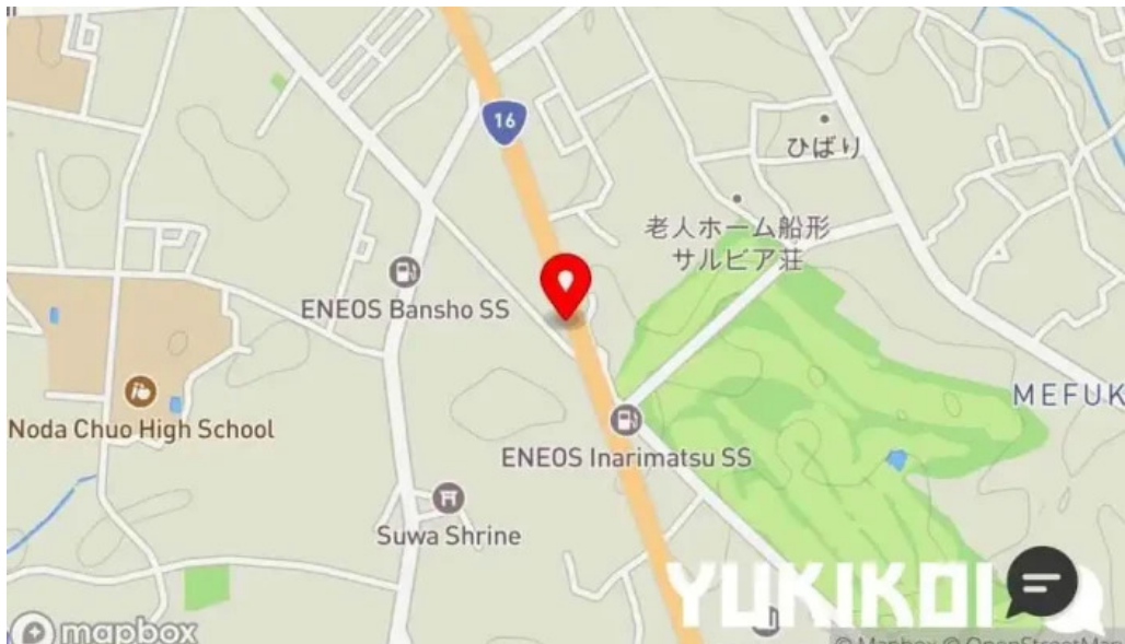
もちもちの木 野田店 地図