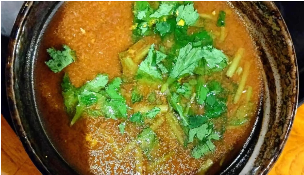
もちもちの木 野田店 ラッサム