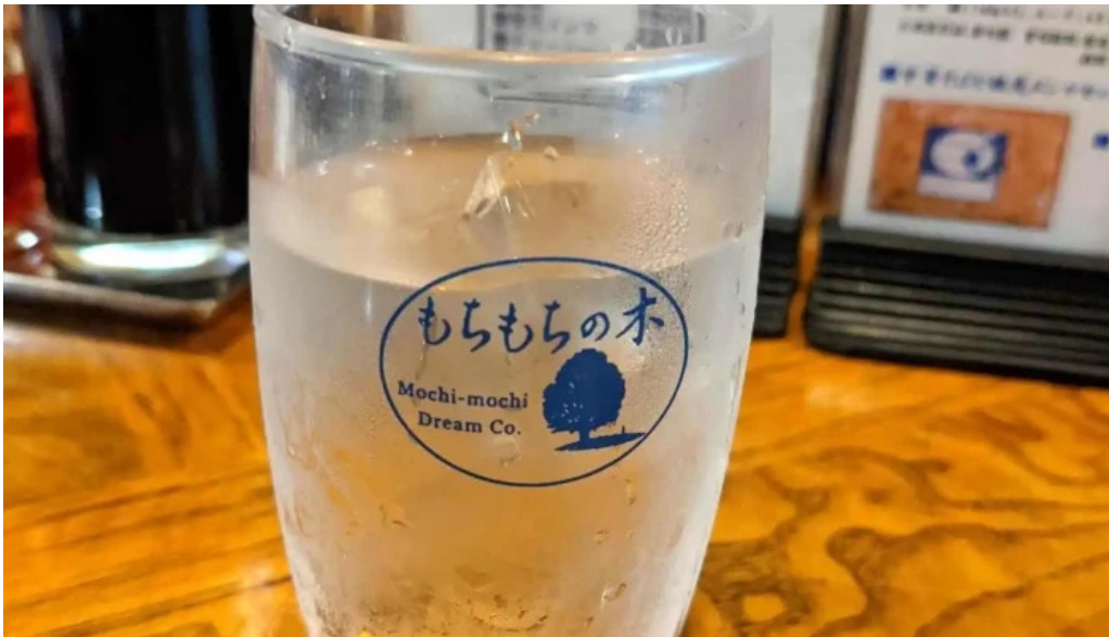
もちもちの木 野田店 シードル