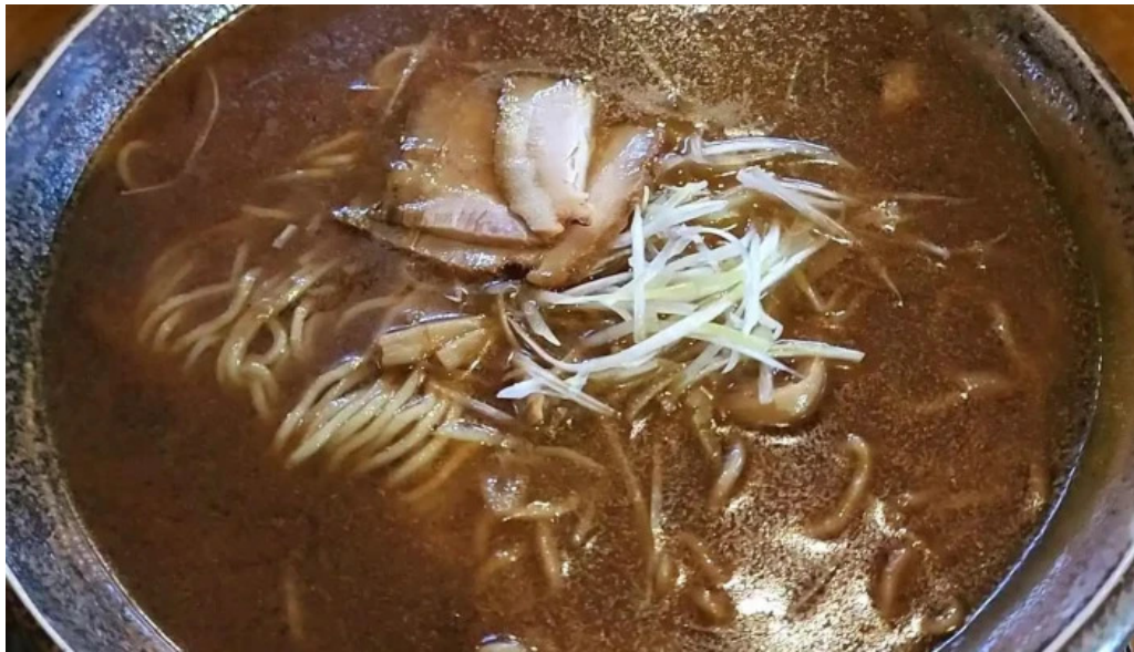
もちもちの木 野田店 動画