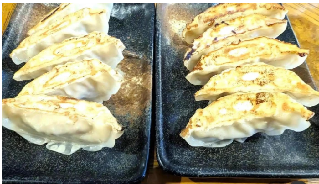
もちもちの木 野田店 餃子