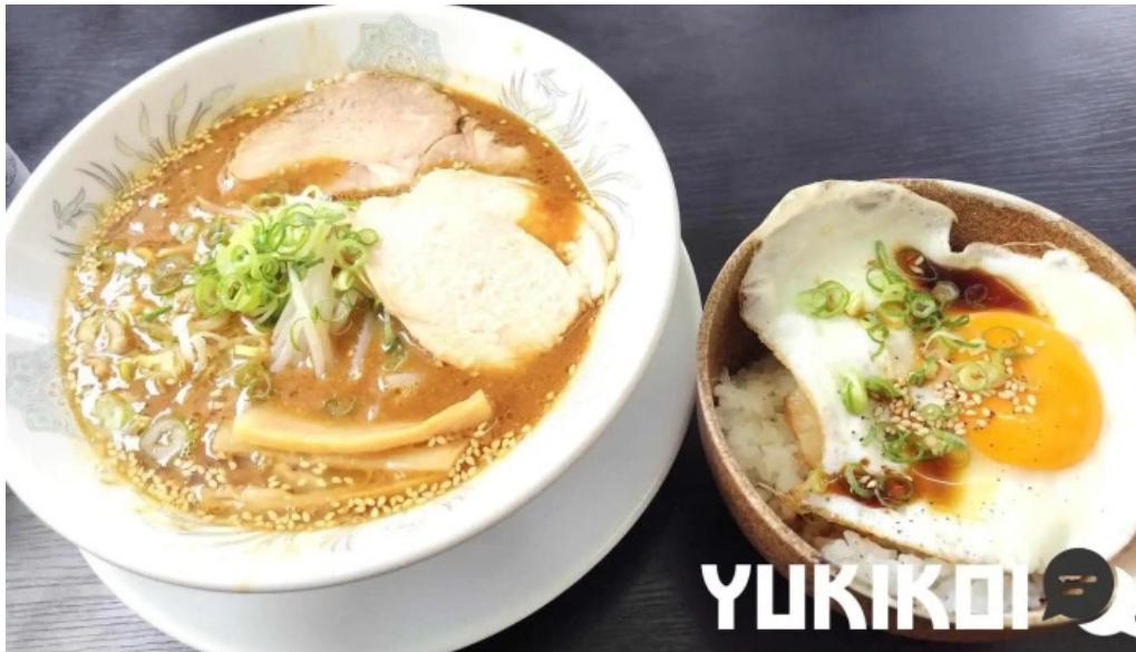
鶏つよし ラーメン