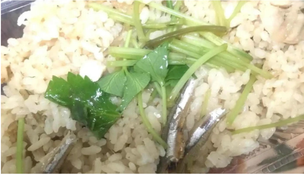
鶏つよし 料理飲み物