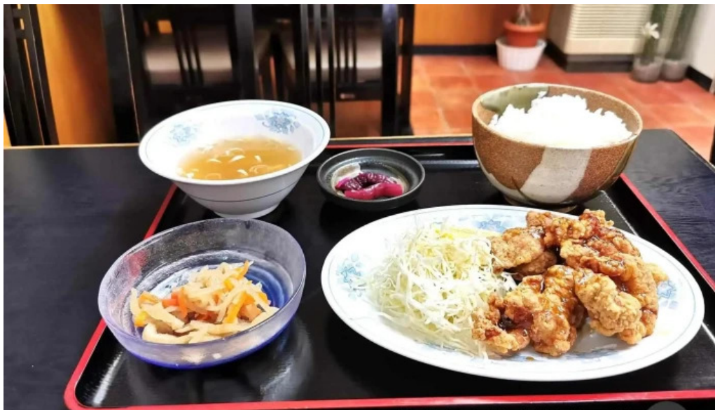
鶏つよしから揚げ