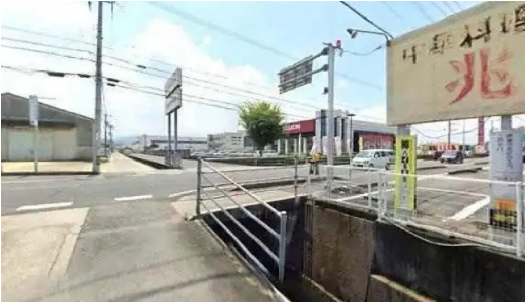
鶏つよし 観音寺市