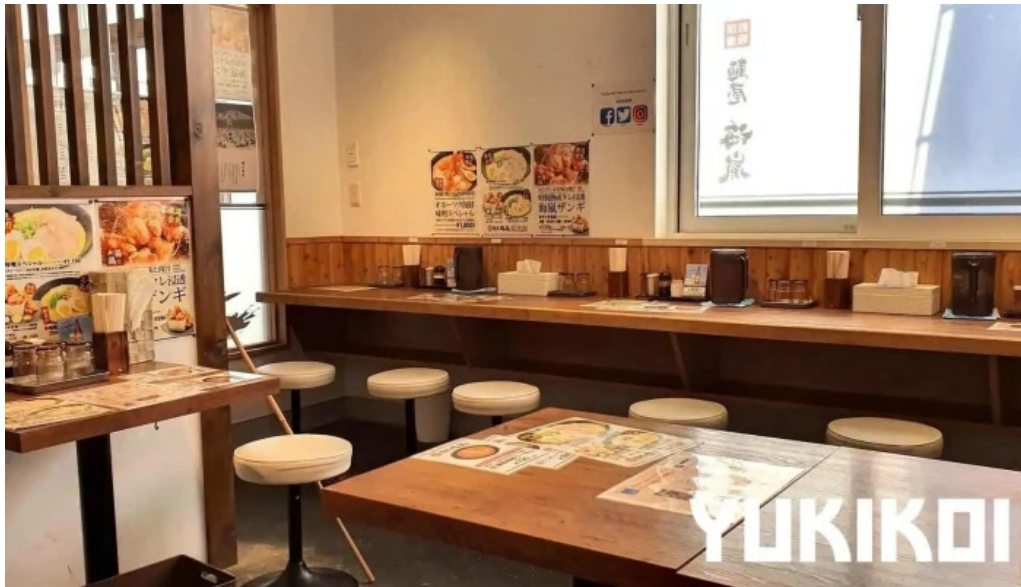
麵屋 海風 霧団気