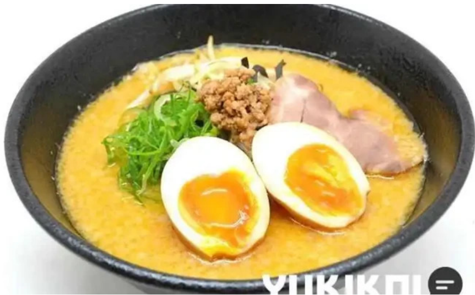
麵屋 海嵐 料理飲み物