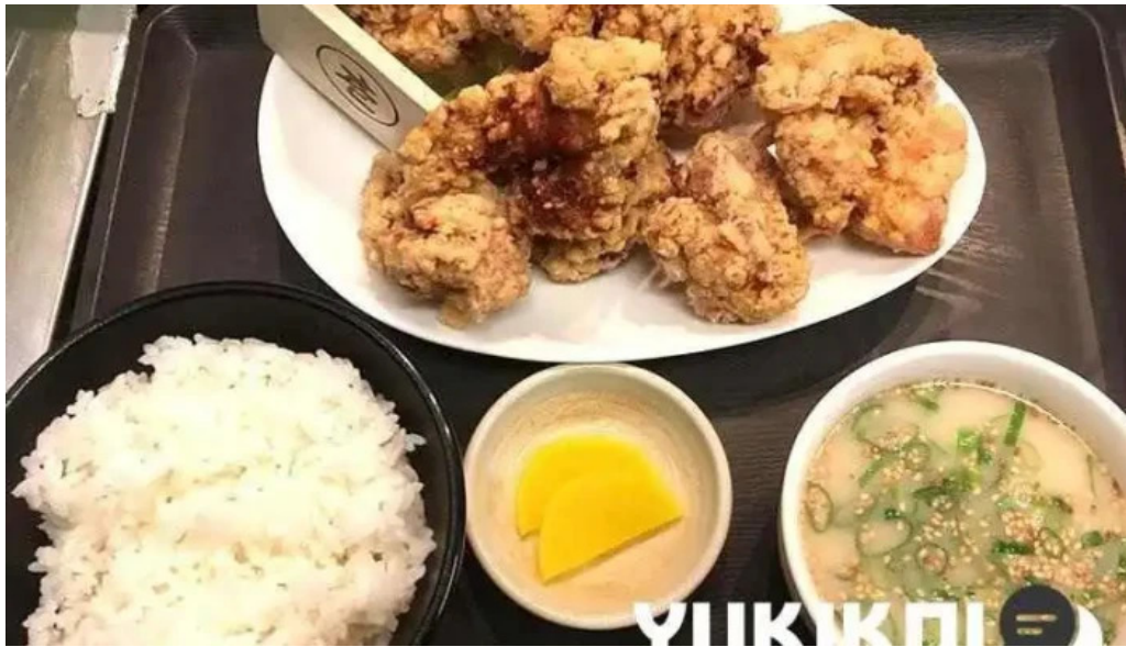
麵屋 海嵐 から揚げ