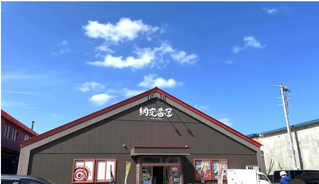
麺屋 海嵐 すべて