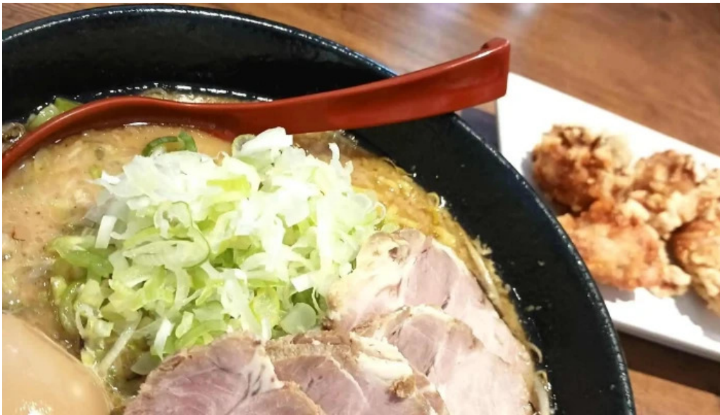
麺屋 海嵐 comentario 1