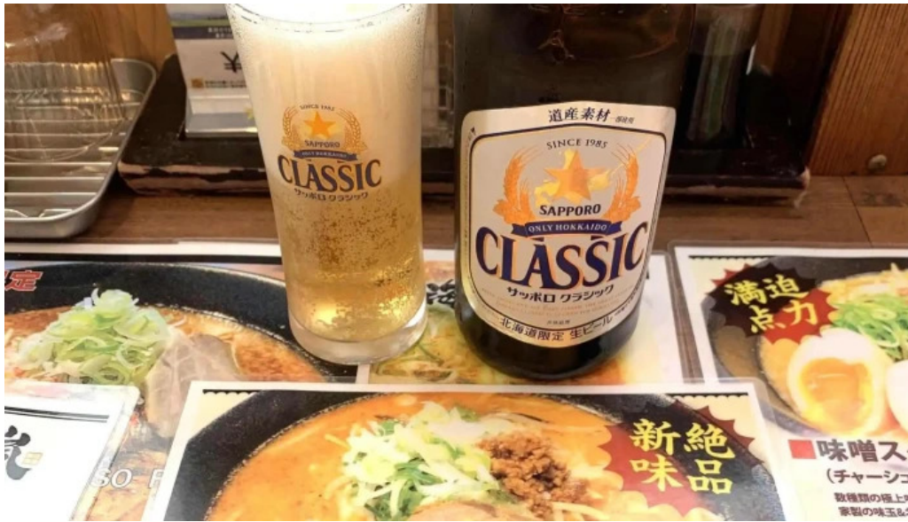
麵屋 海嵐 comentario 4