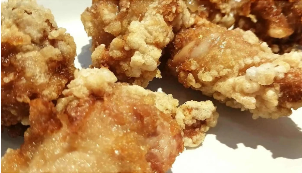
麺屋 海嵐 comentario 2