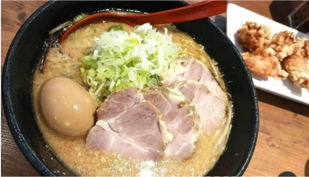
麺屋 海嵐 スープ