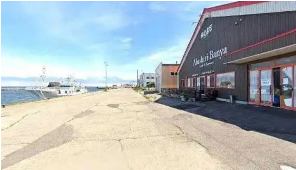
麺屋 海嵐 ストリートビューと 360 ビュー