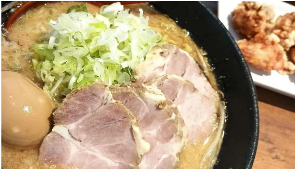
麵屋 海嵐 comentario 3