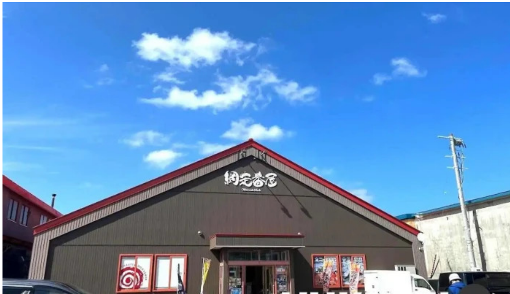
麵屋 海風 網走市