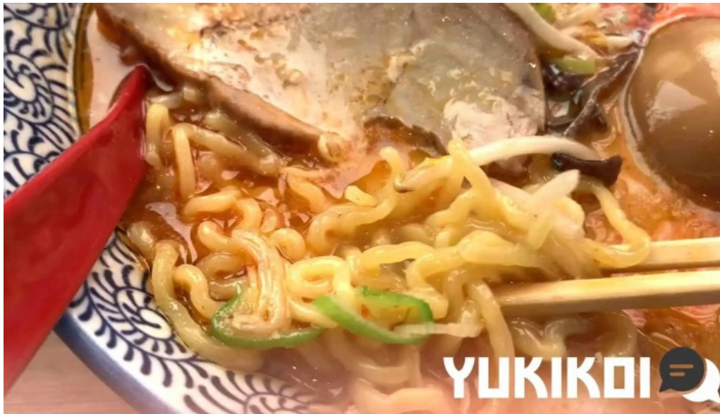
麺屋 海嵐 ラーメン