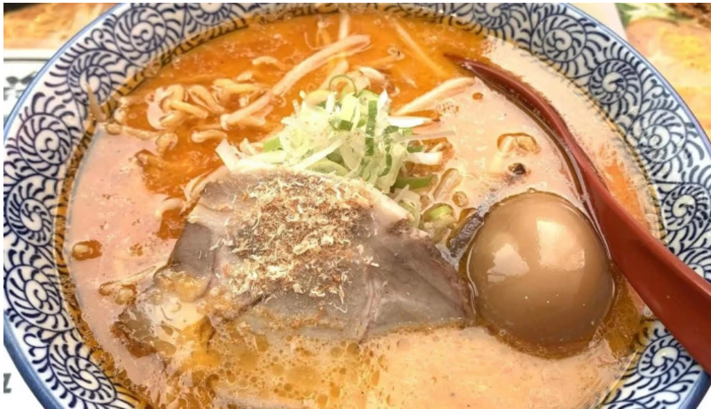
麵屋 海嵐 comentario 5