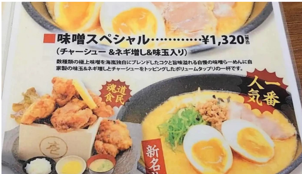
麺屋 海嵐 メニュー