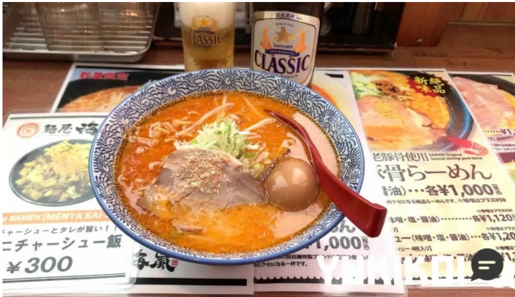
麵屋 海嵐 動画