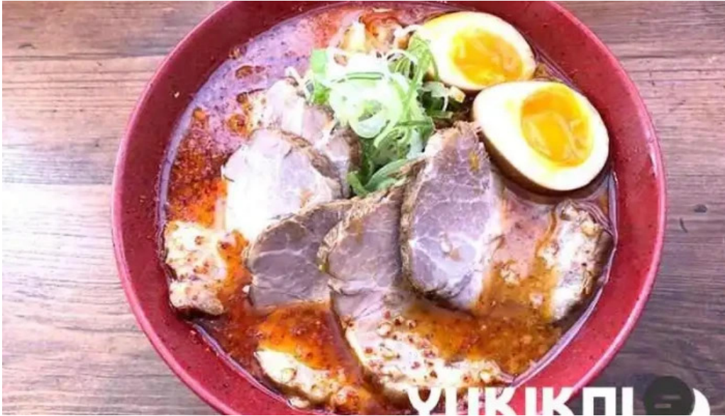
麺屋 海嵐 オーナー提供