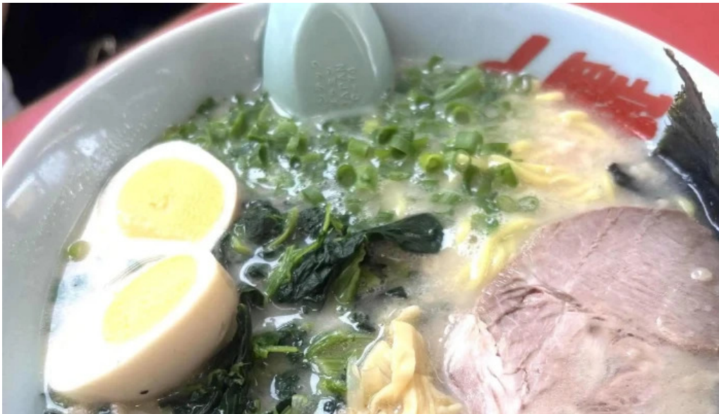
ラーメン山岡家 網走店 comentario 2