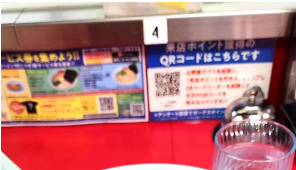
ラーメン山岡家 網走店 comentario 1