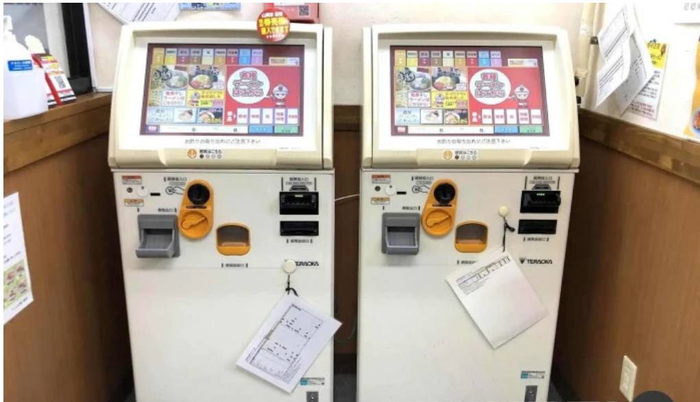
ラーメン山岡家 網走店 霧団気