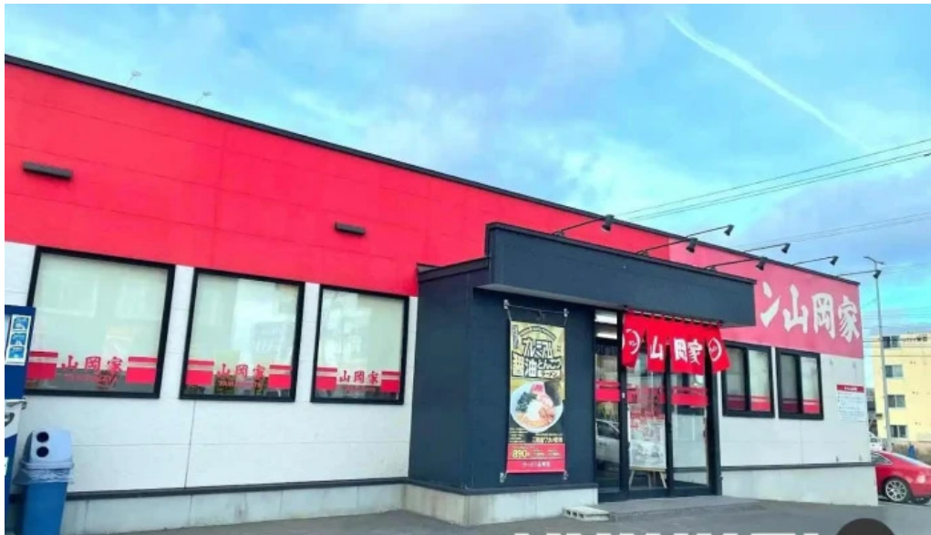
ラーメン山岡家 網走店 網走市