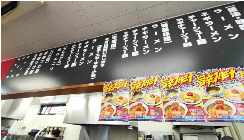
ラーメン山岡家 網走店 メニュー