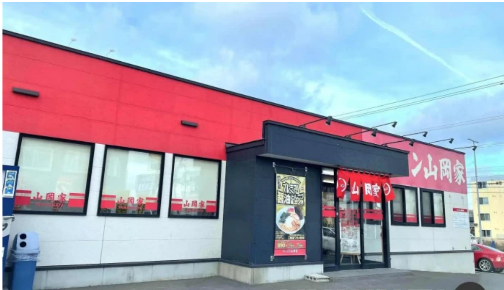
ラーメン山岡家 網走店 すべて