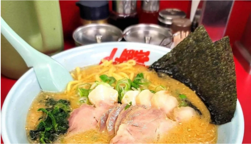
ラーメン山岡家 網走店 comentario 6