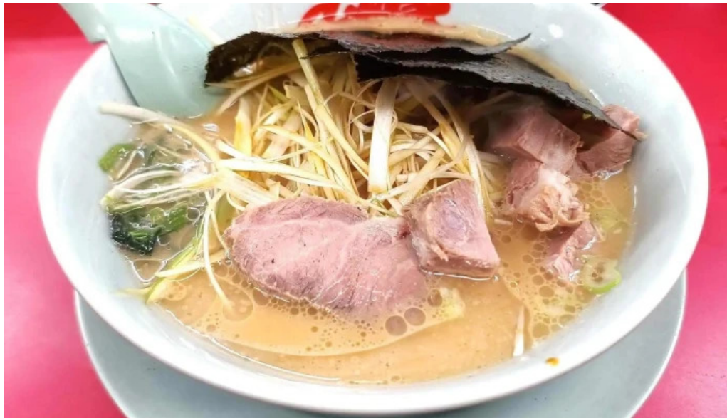
ラーメン山岡家 網走店 comentario 7