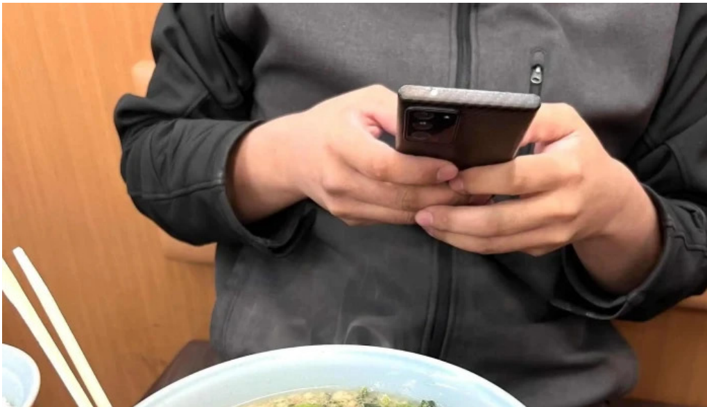
ラーメン山岡家 網走店 comentario 3