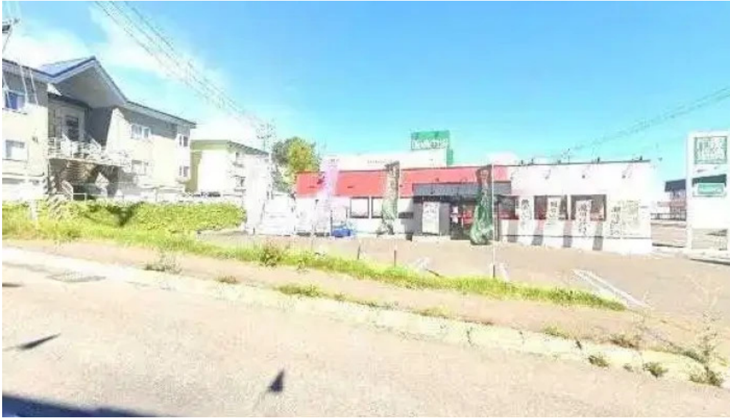
ラーメン山岡家 網走店 ストリートビューと 360 ビュー