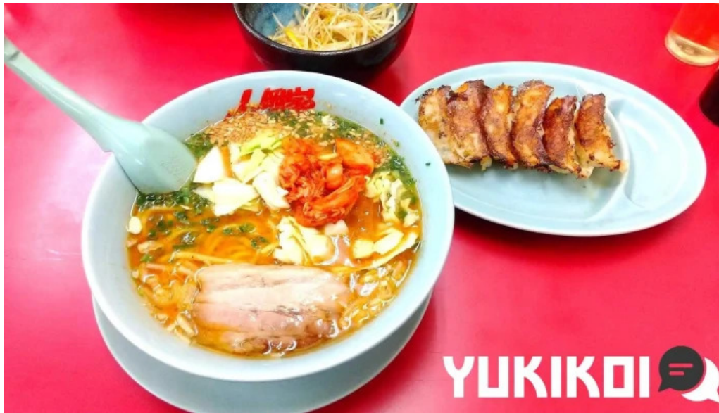
ラーメン山岡家 網走店 料理飲み物