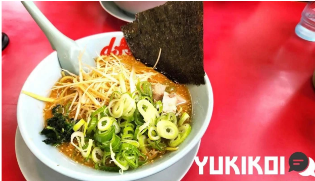
ラーメン山岡家 網走店 ラーメン