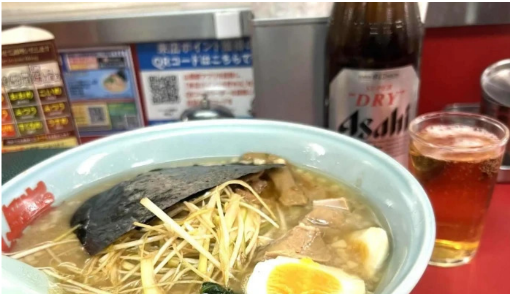
ラーメン山岡家 網走店 comentario 4