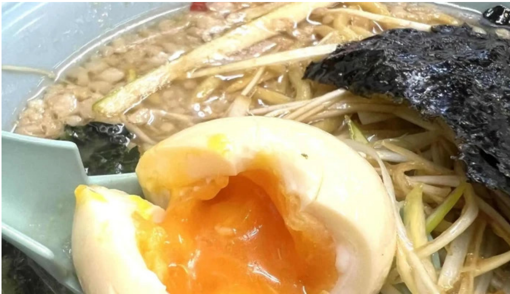
ラーメン山岡家 網走店 comentario 5