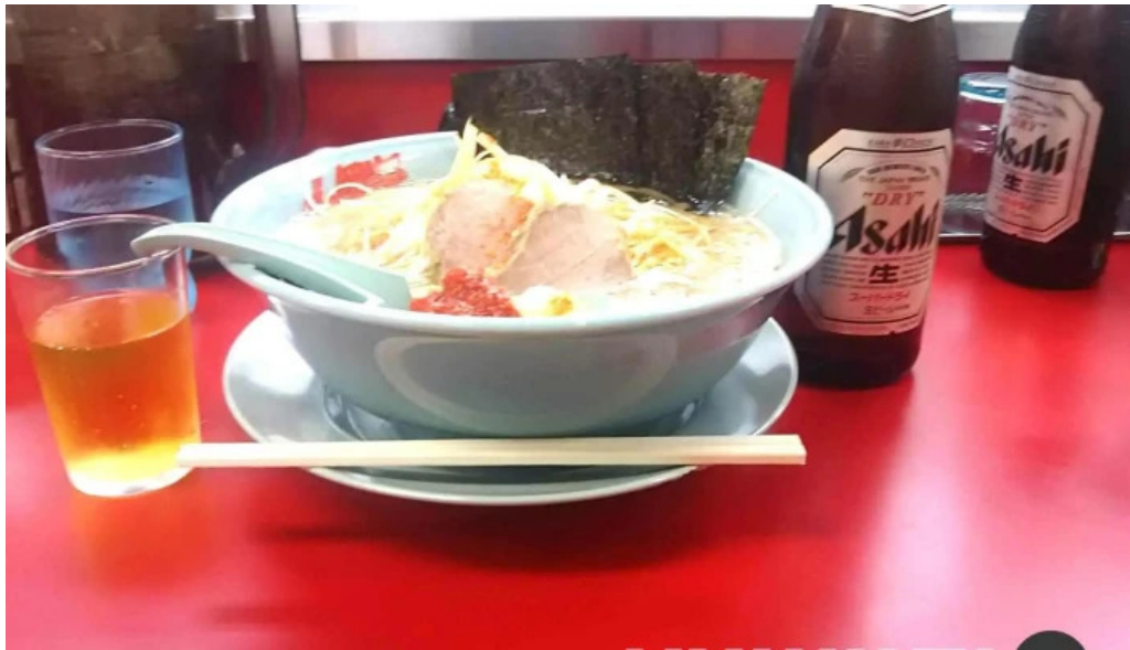
ラーメン山岡家 網走店 スープ