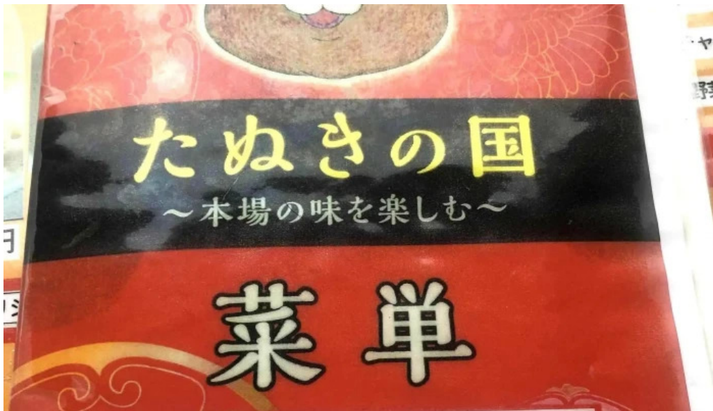
たぬきの国 中華料理 ちゃんぽん comentario 3