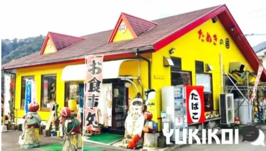
たぬきの国 中華料理 ちゃんぽん すべて