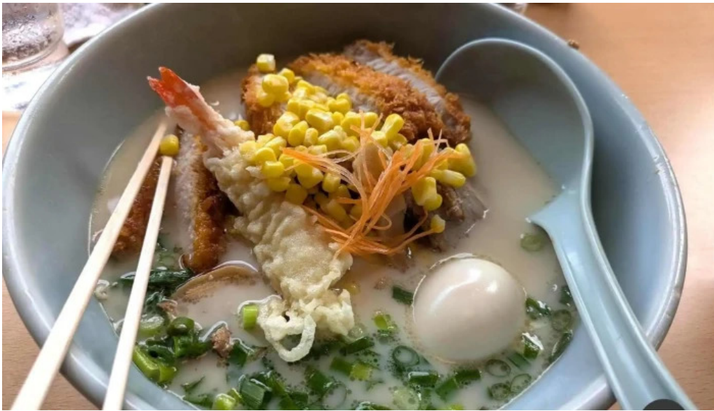
たぬきの国 中華料理 ちゃんぽん 豚骨ラーメン