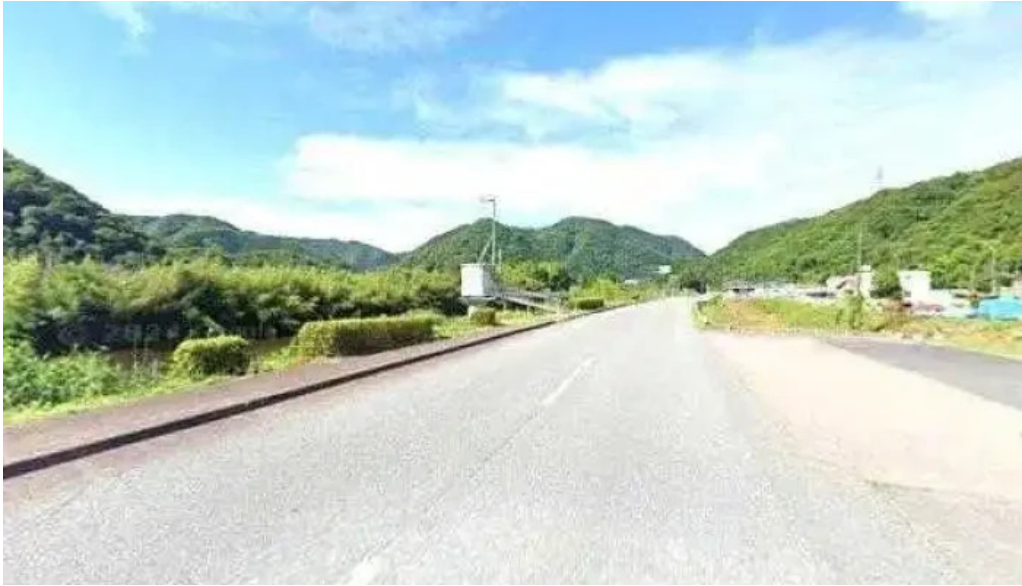
たぬきの国 中華料理 ちゃんぽん ストリートビューと 360 ビュー