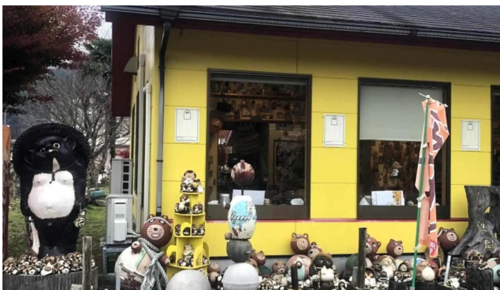
ためきの国 中華料理 ちゃんぽん comentario 1