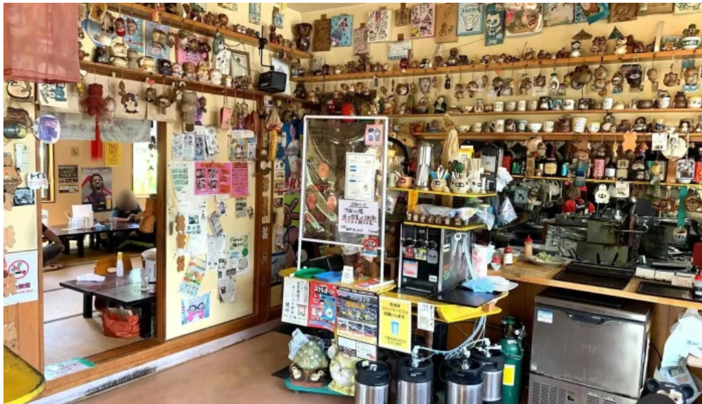
たぬきの国 中華料理 ちゃんぽん 雰囲気