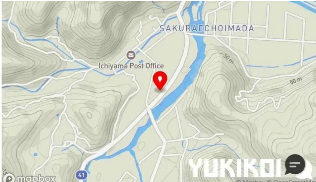
たぬきの国 中華料理 ちゃんぽん地図