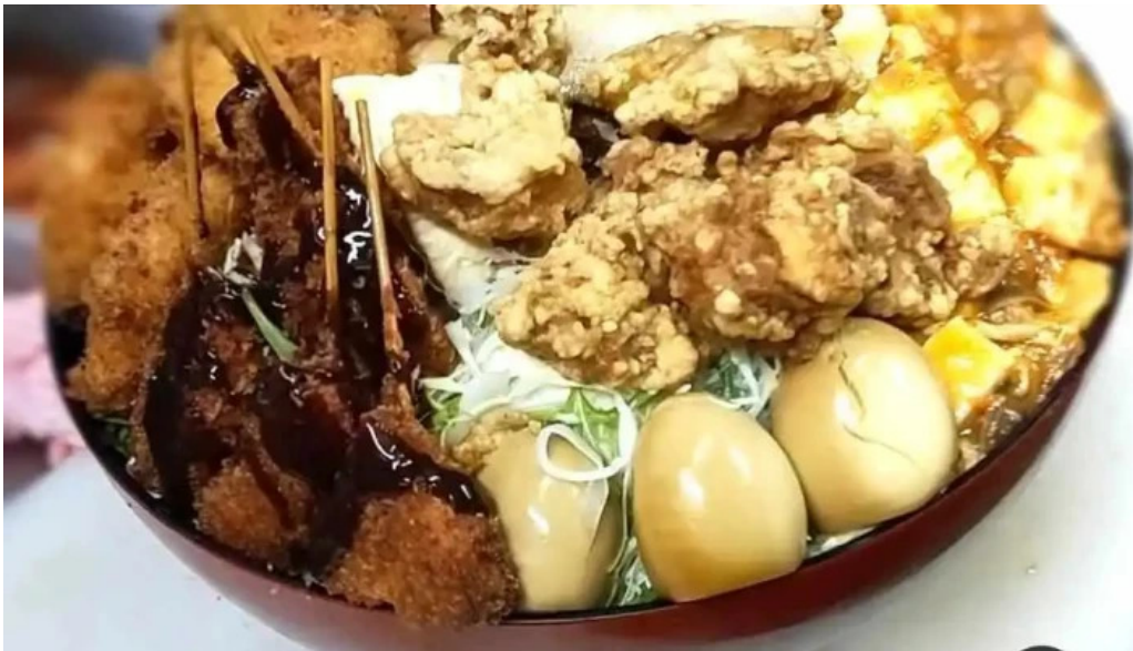
たぬきの国 中華料理 ちゃんぽん 料理飲み物