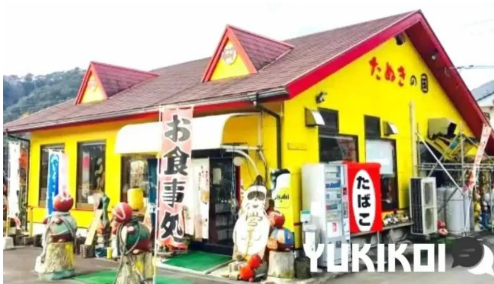
たぬきの国 ～中華料理 ちゃんぽん～ 江津市