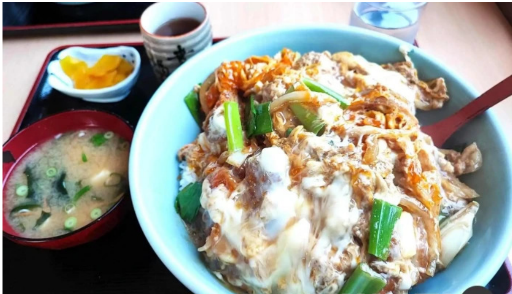
たぬきの国 中華料理 ちゃんぽん カツ丼