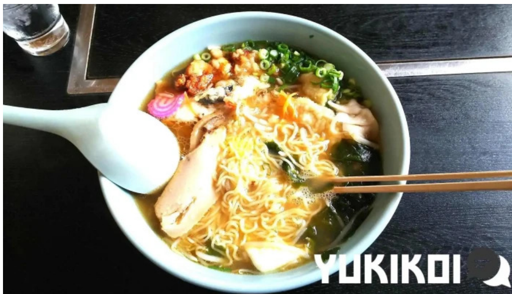
たぬきの国 中華料理 ちゃんぽん スープ