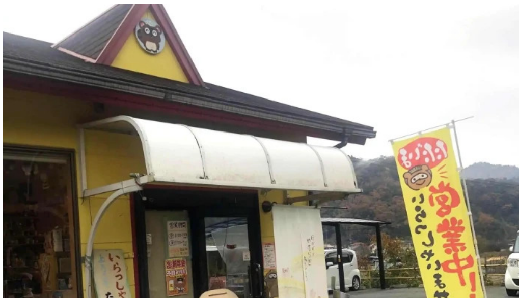
ためきの国 中華料理 ちゃんぽん comentario 2