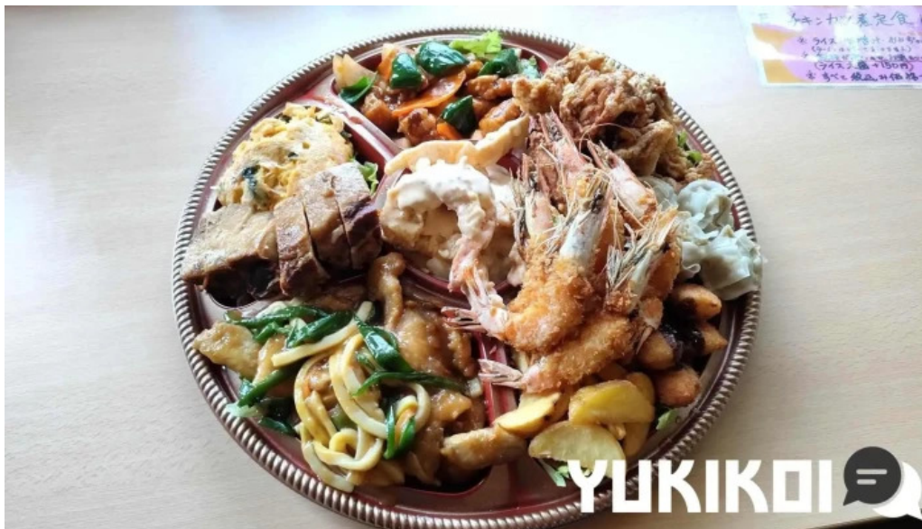
たぬきの国 中華料理 ちゃんぽん