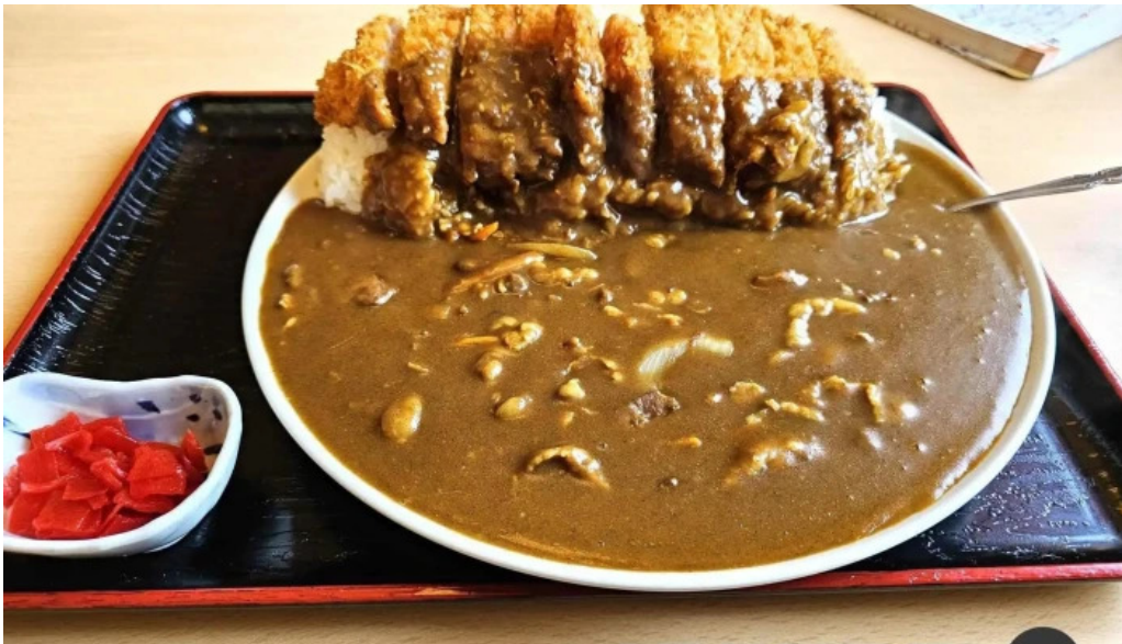
たぬきの国 中華料理 ちゃんぽん カレー