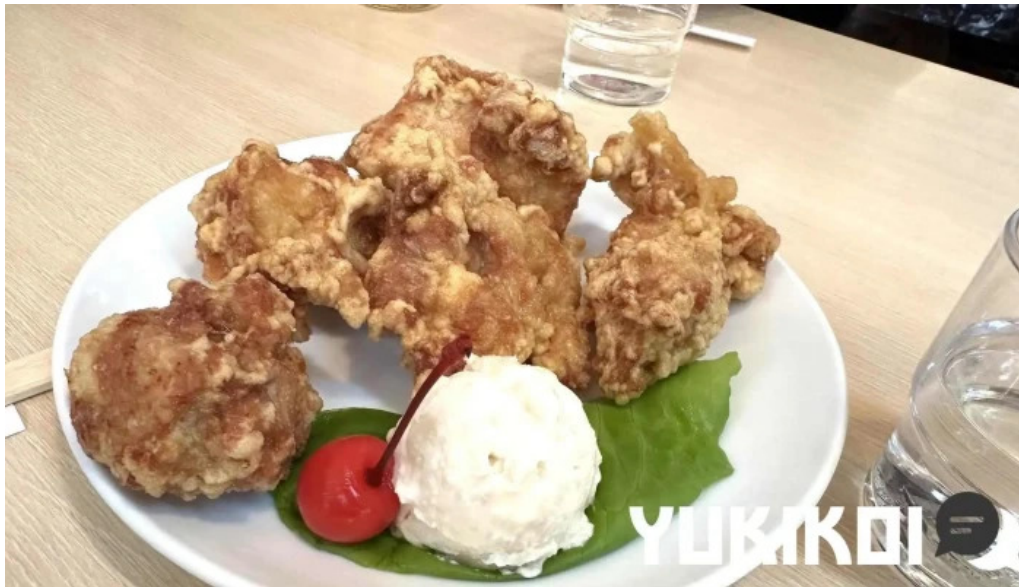
彩華ラーメン 檀原店 から揚げ