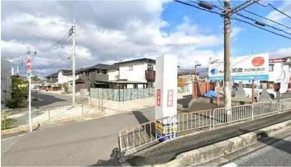
彩華ラーメン 榎原店 榎原市