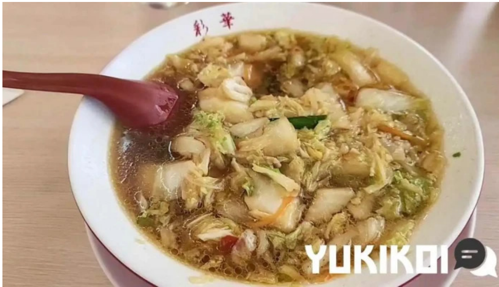
彩華ラーメン 榎原店 ラーメン