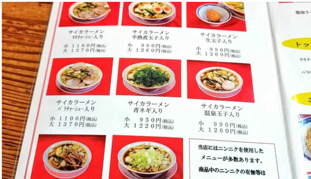
彩華ラーメン 櫃原店 メニュー