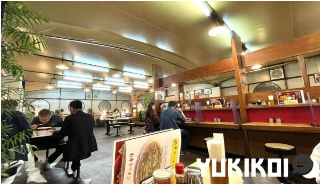
彩華ラーメン 榎原店 雰囲気