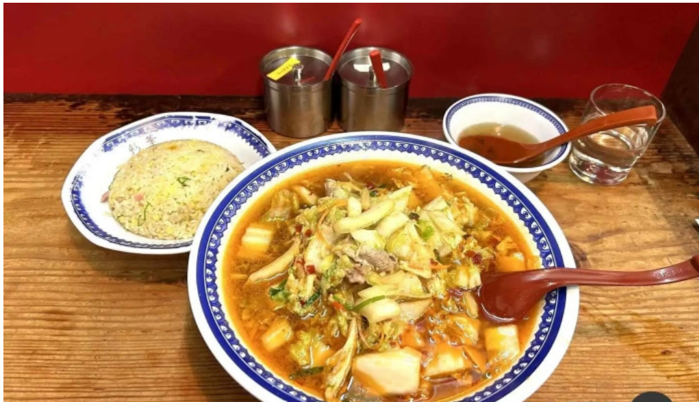
彩華ラーメン 櫃原店 料理飲み物