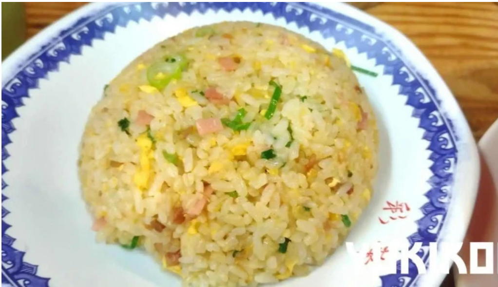
彩華ラーメン 榎原店 最新