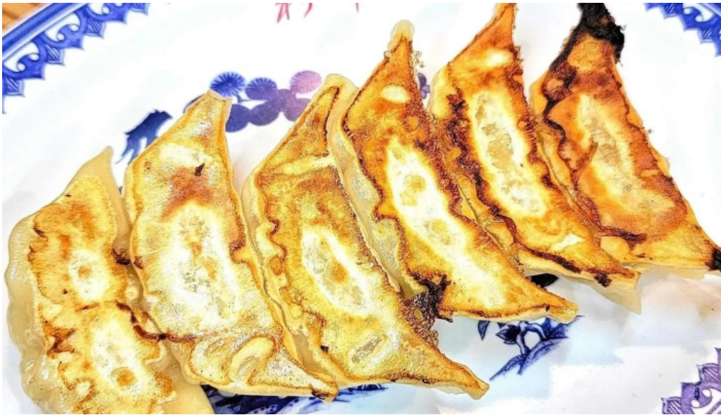
彩華ラーメン 榎原店 餃子