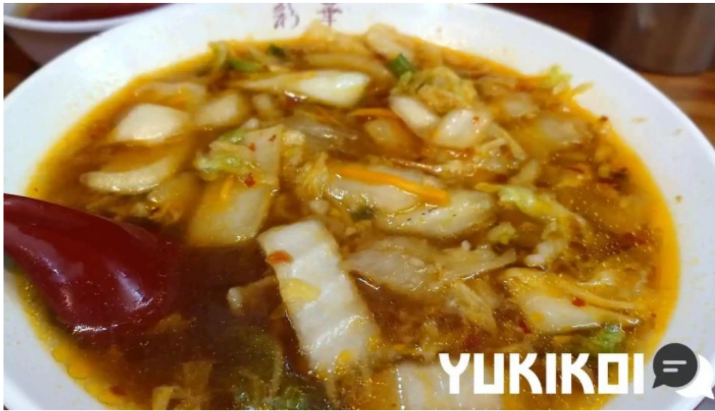
彩華ラーメン 榎原店 動画