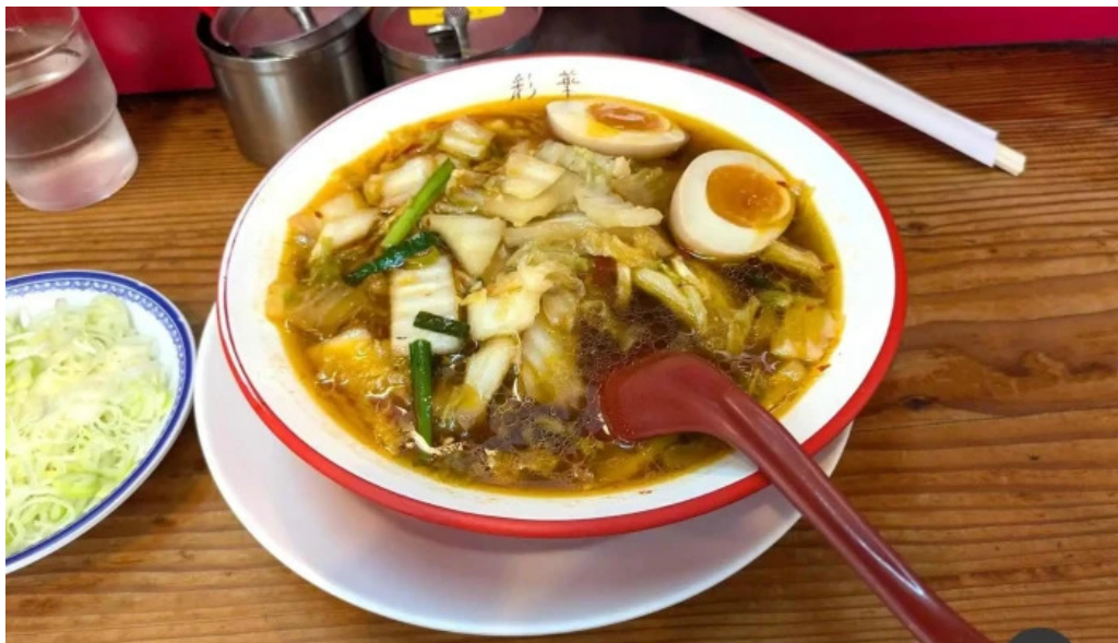
彩華ラーメン 榎原店 スープ