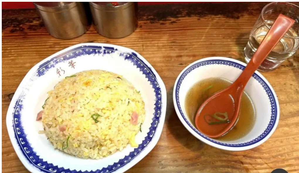
彩華ラーメン 櫃原店 チャーハン