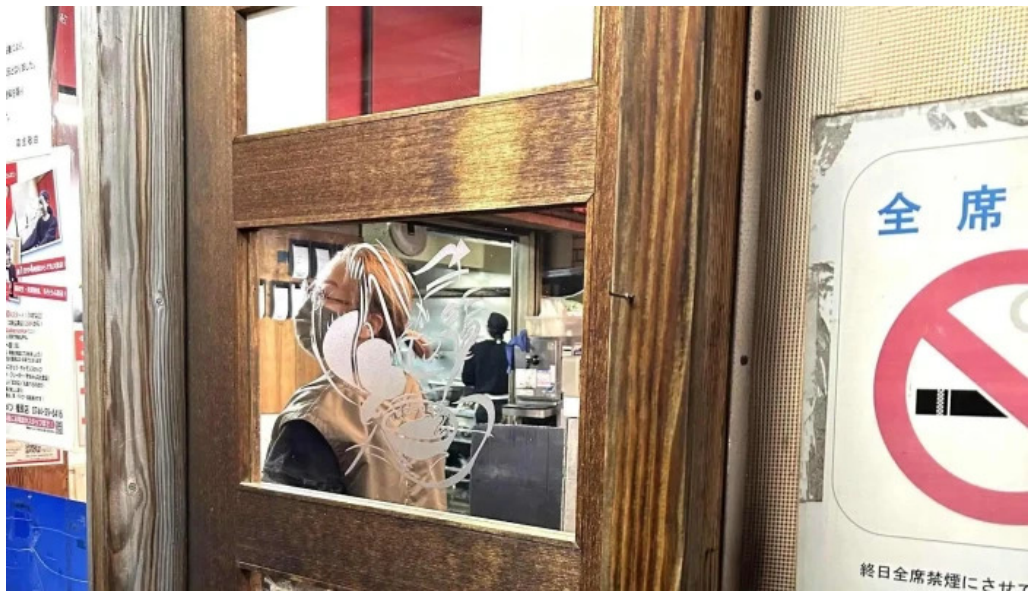
彩華ラーメン 橿原店 営業中