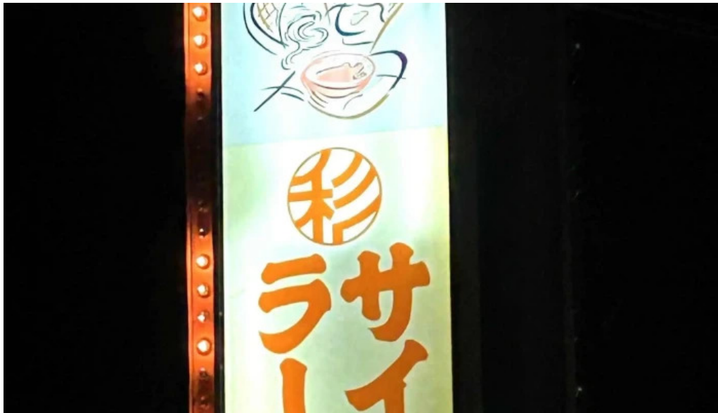
彩華ラーメン 櫃原店 料金