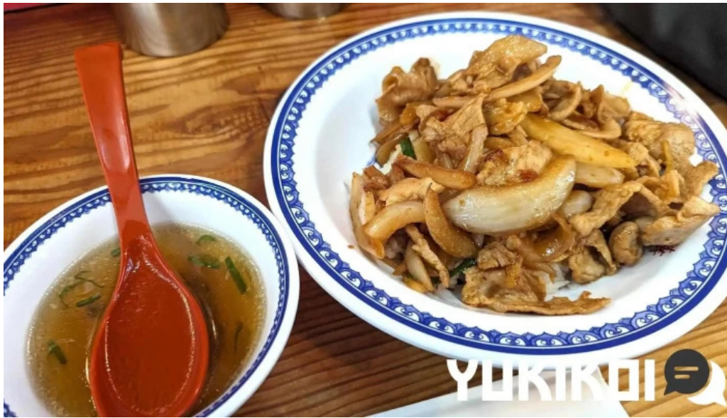
彩華ラーメン 榎原店 チャーシュー