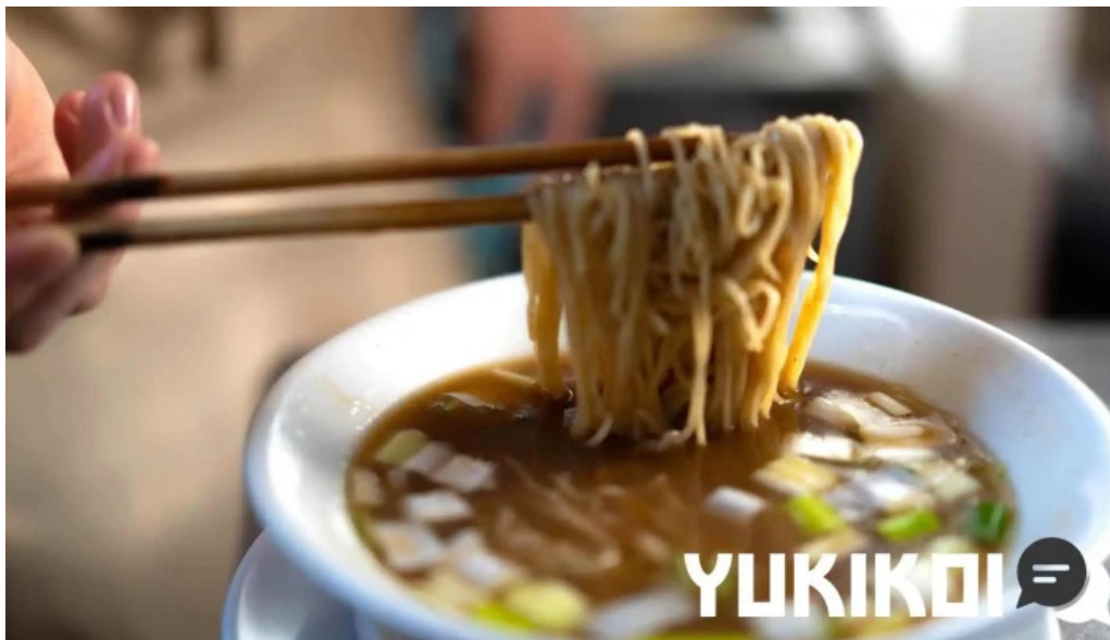
麵麓 menroku 料理飲み物