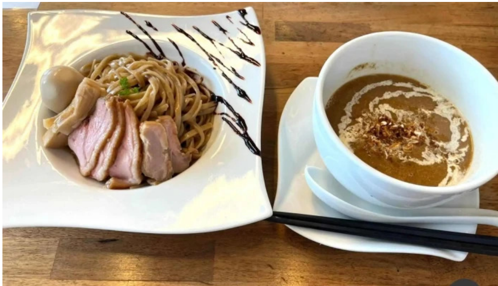
麵麓 menroku 最新