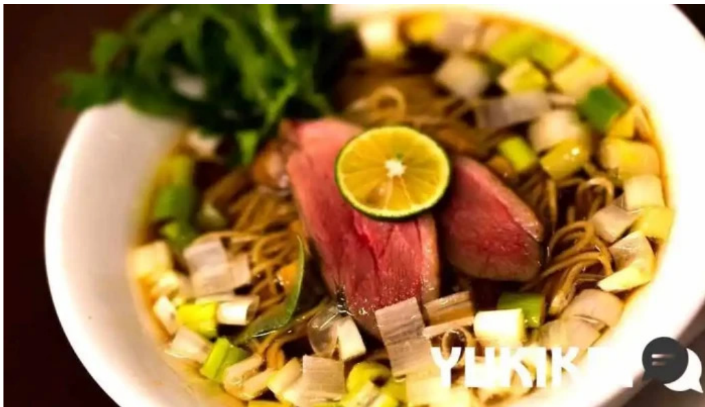
麵麓 menroku オーナー提供