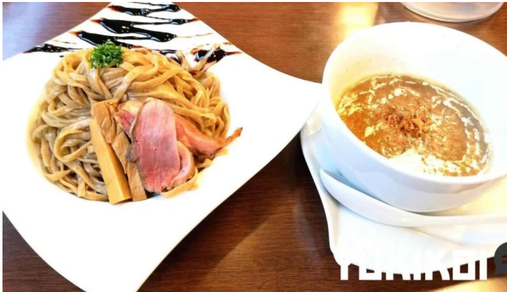
麵麓 menroku つけ麺