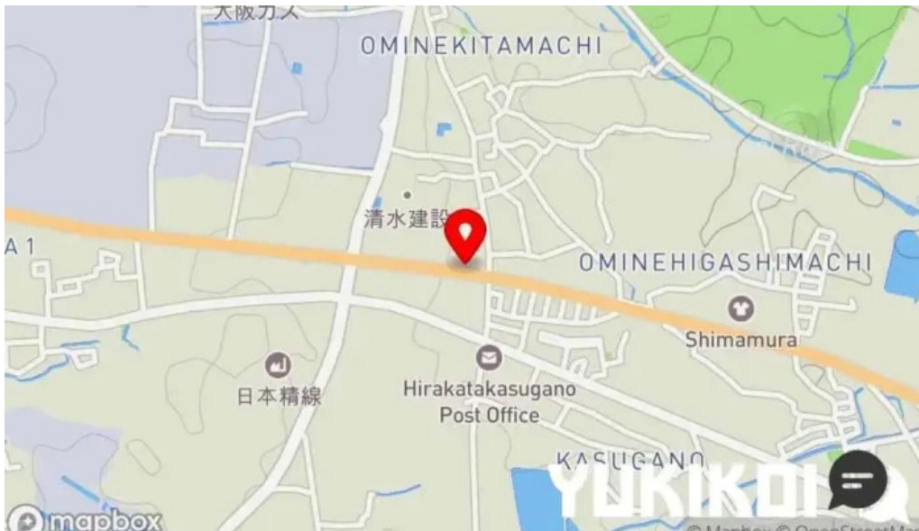
麵麓 menroku 地図