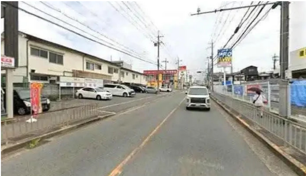
麵麓 menroku 枚方市