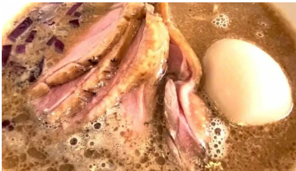
麵麓 menroku ラーメン