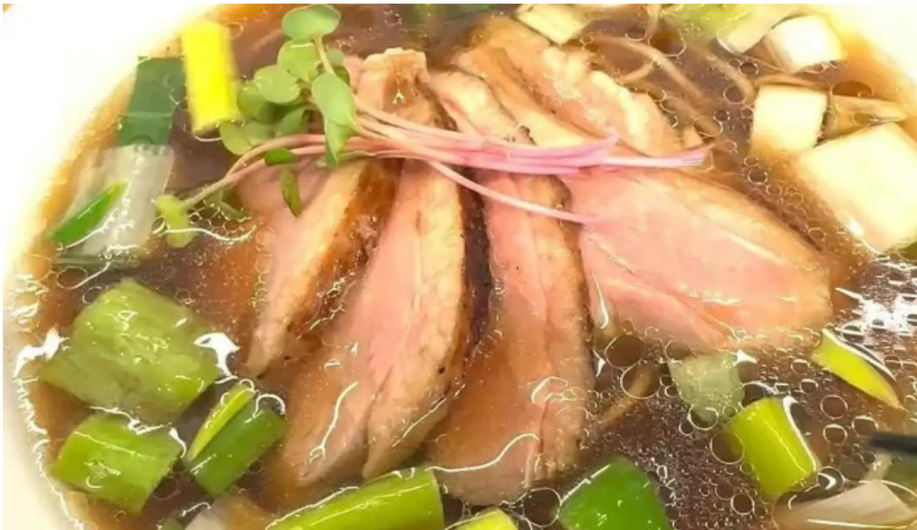
麵麓 menroku 動画