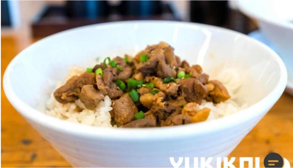
麵麓 menroku 牛肉