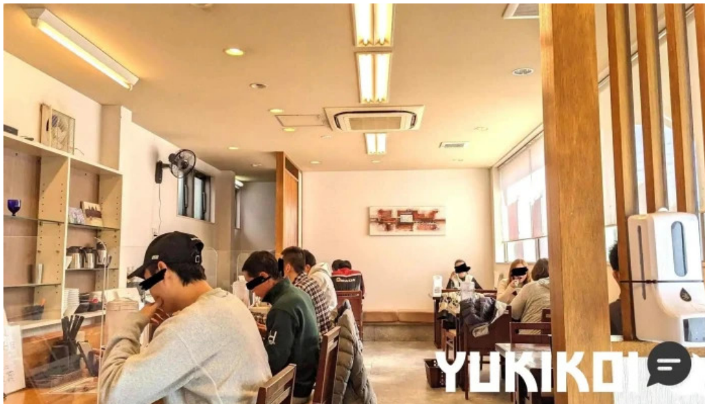
麵麓 menroku 雰囲気