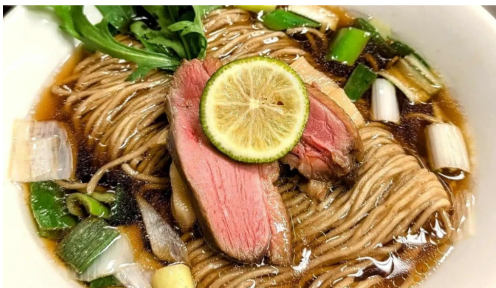
麵麓 menroku スープ