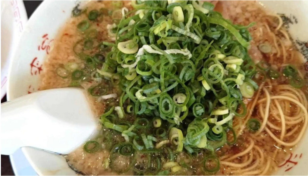
来来亭 枚方藤阪店 動画