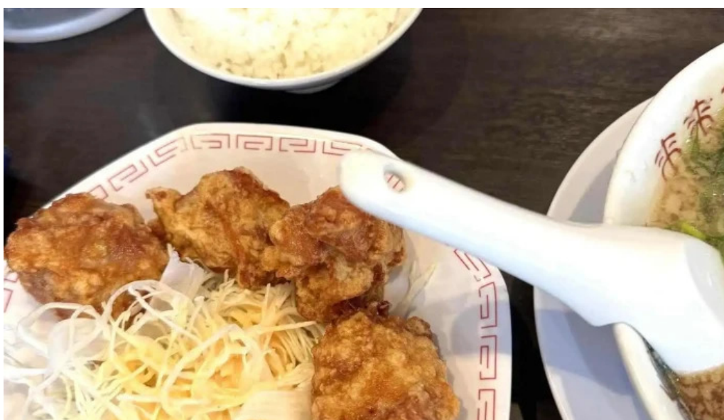
来来亭 枚方藤阪店 から揚げ