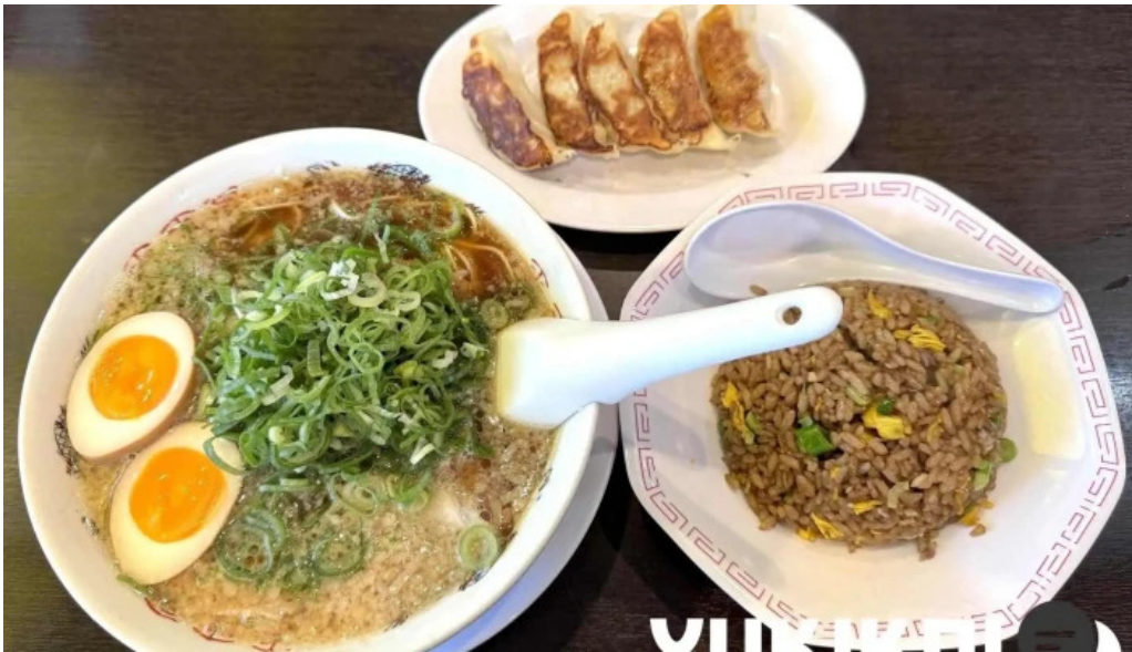
来来亭 枚方藤阪店 料理飲み物