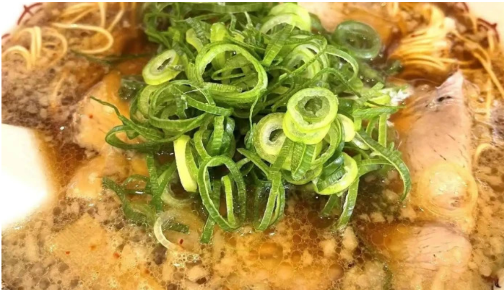
来来亭 枚方藤阪店 スープ