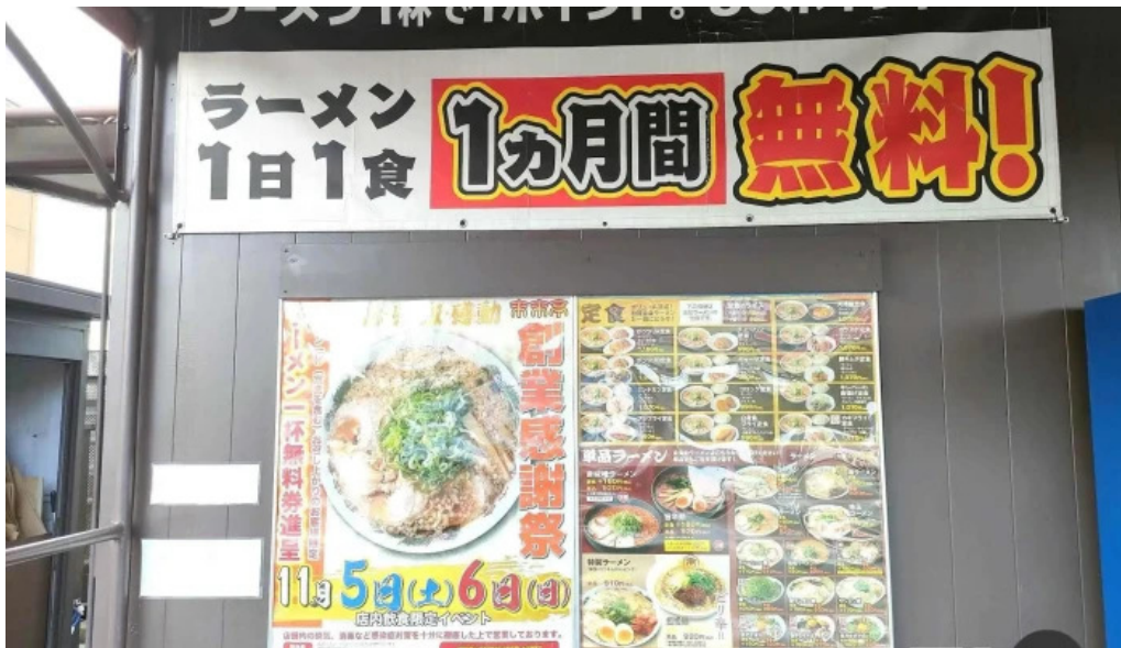
来来亭 枚方藤阪店 メニュー