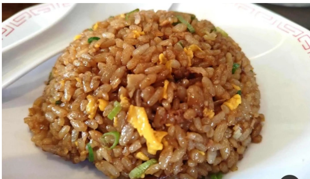
来来亭 枚方藤阪店 焼き飯