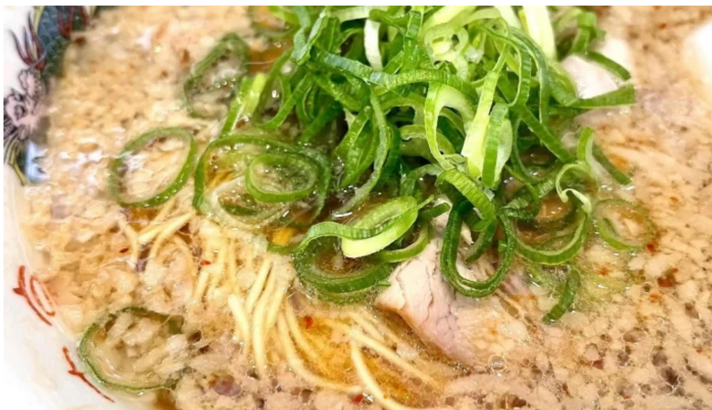
来来亭 枚方藤阪店 どこ