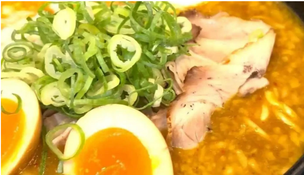
来来亭 枚方藤阪店 ラーメン