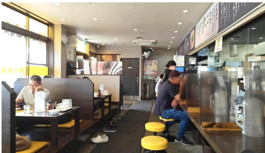
来来亭 枚方藤阪店 雰囲気