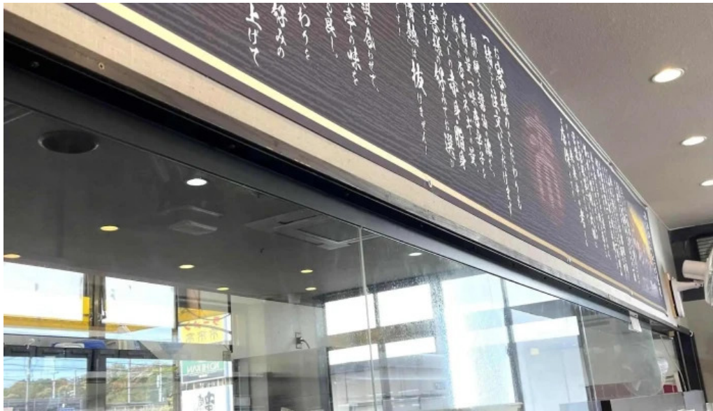
来来亭 枚方藤阪店 口コミ