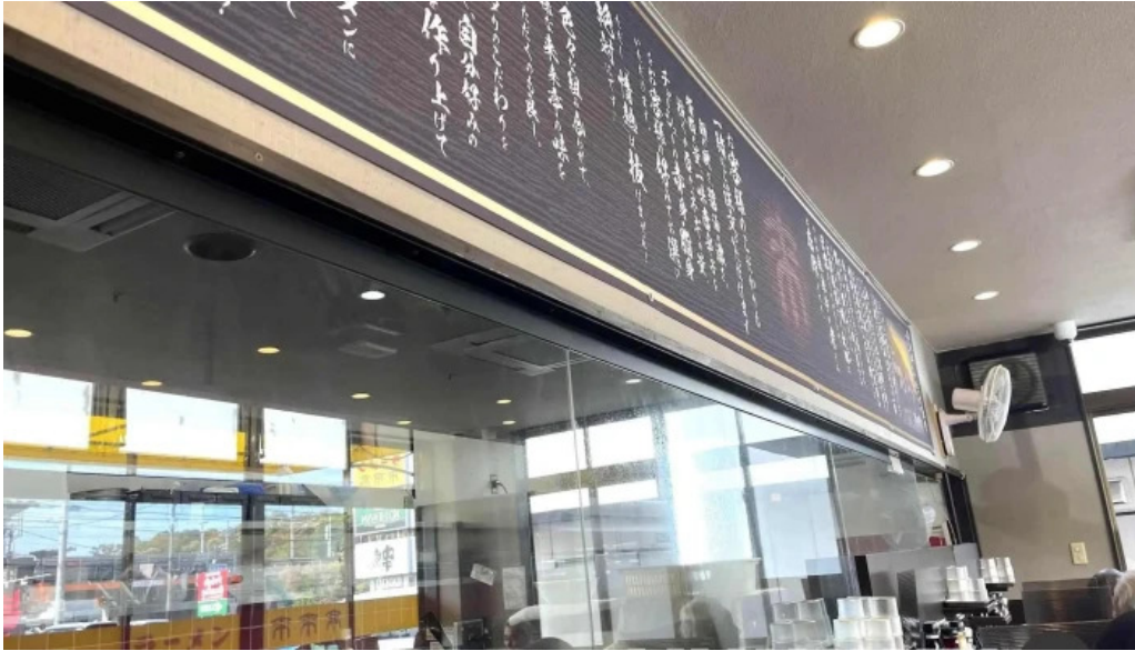
来来亭 枚方藤阪店 最新