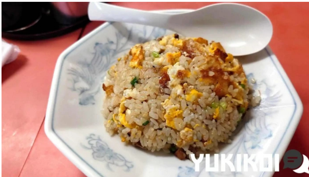
五竜菜館 チャーハン