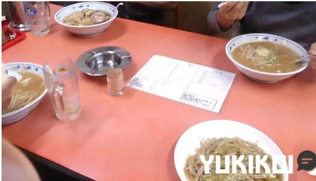
五竜菜館 ラーメン