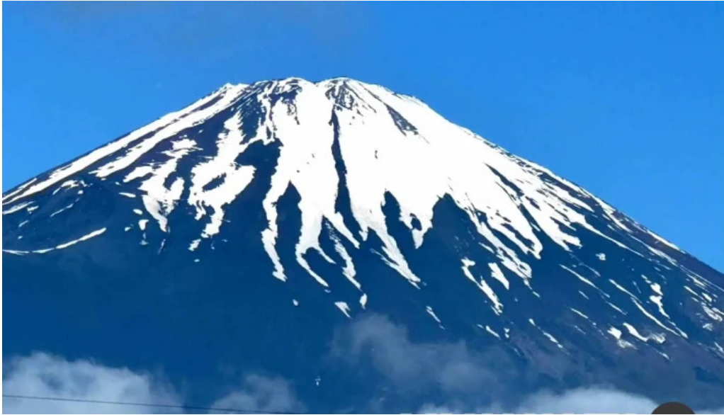
五竜菜館 オーナー提供