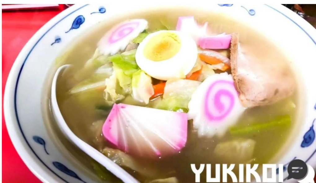
五竜菜館 料理飲み物