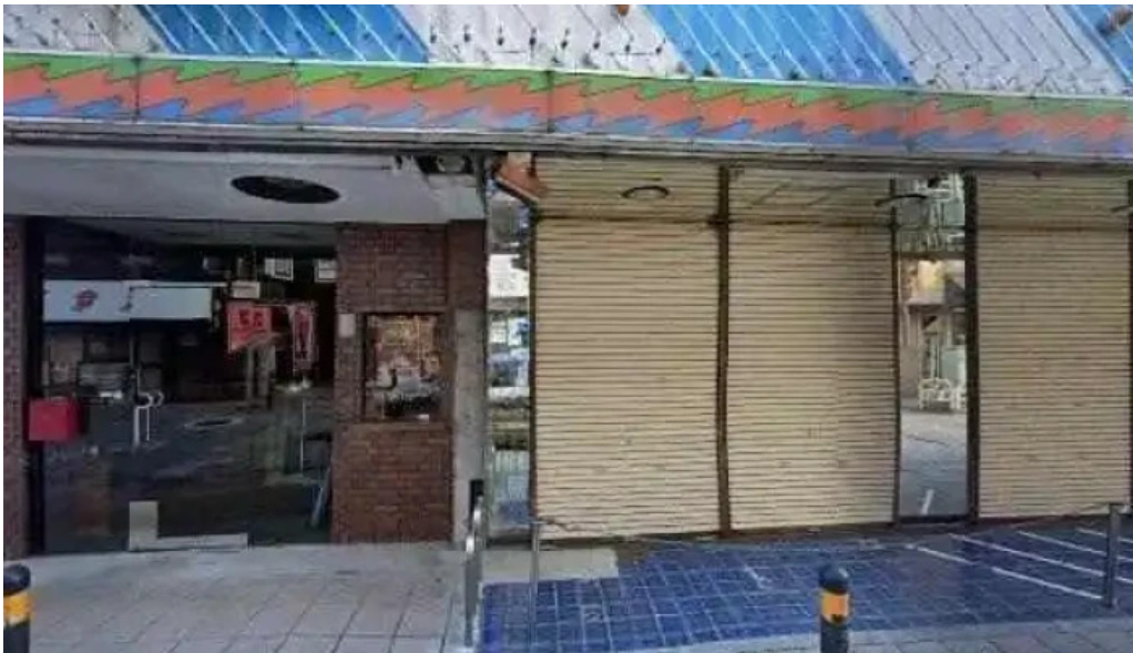
五竜菜館 御殿場市