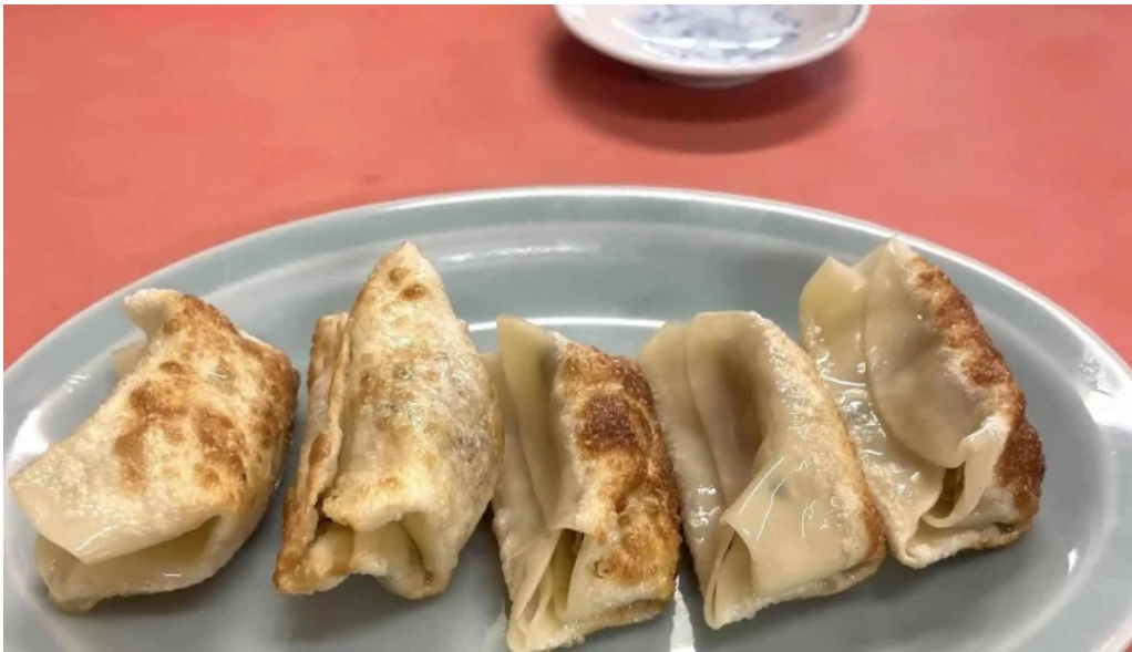
五竜菜館 ウェブサイト