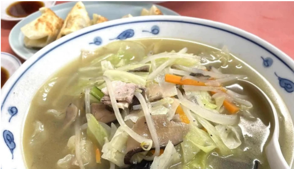
五竜菜館 カタログ