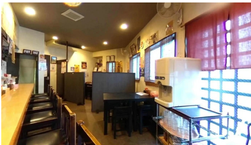
辛麺屋 喜多楼 延岡市