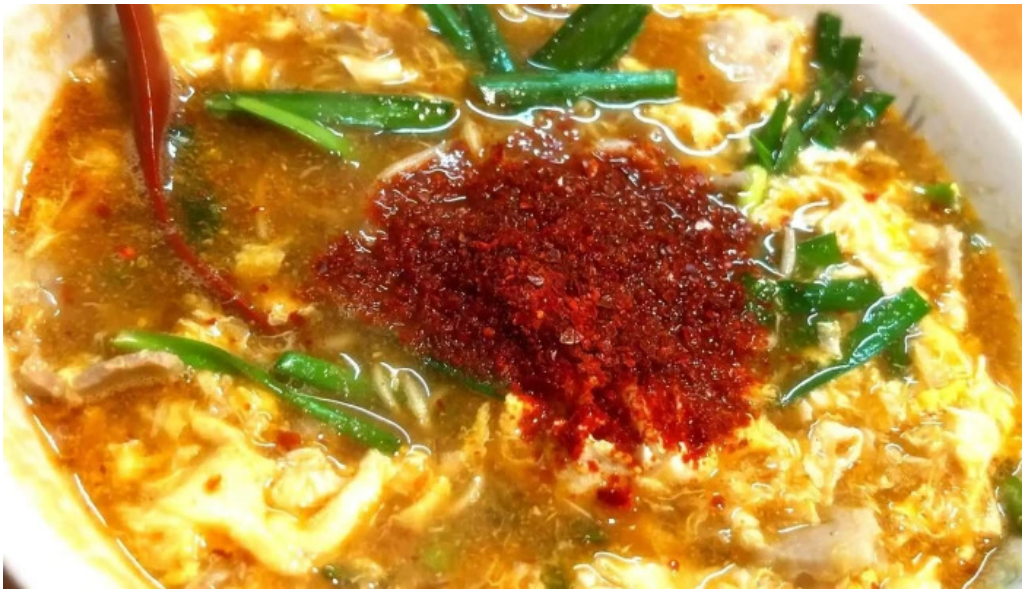
辛麺屋 喜多楼 写真