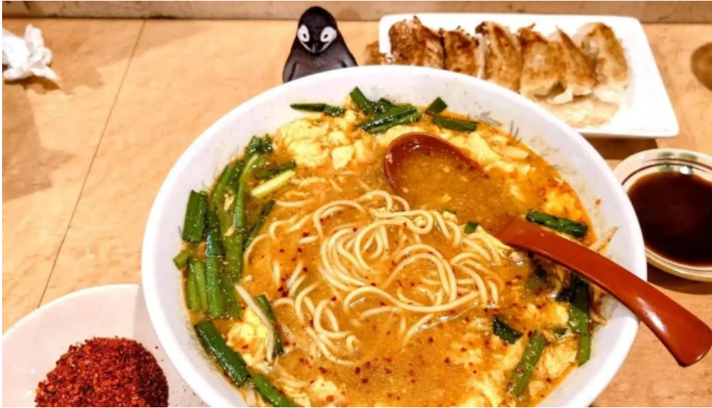
辛麺屋 喜多楼 住所