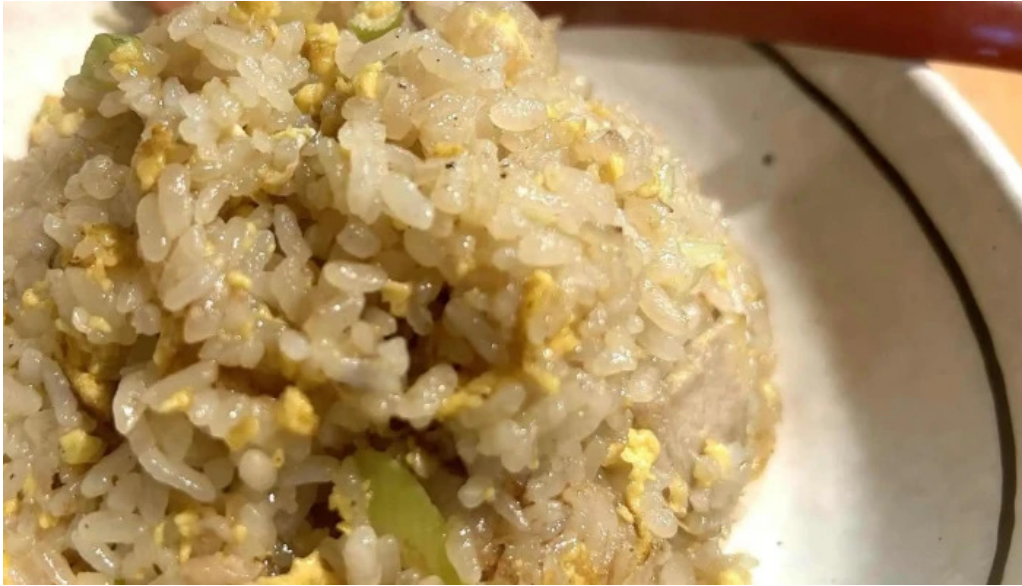
辛麺屋 喜多楼 動画