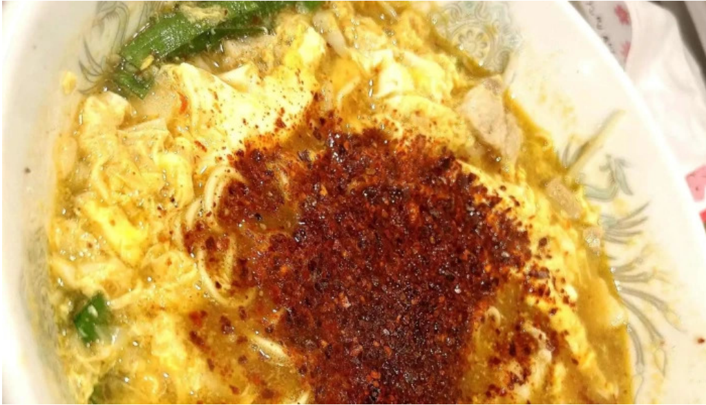
辛麺屋 喜多楼 営業時間