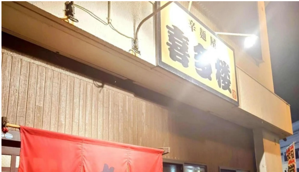
辛麺屋 喜多楼 カタログ