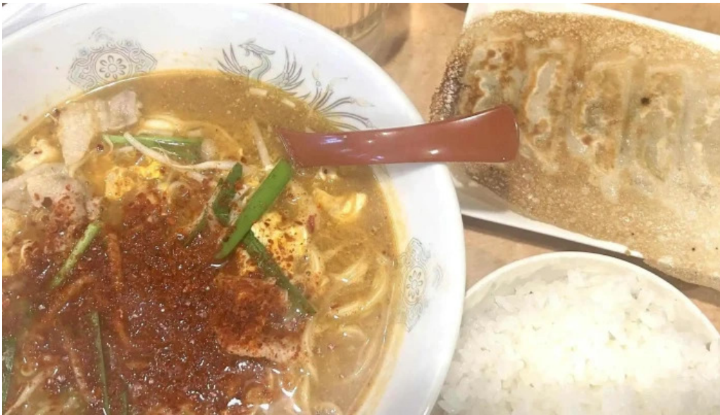
辛麺屋 喜多楼 口コミ