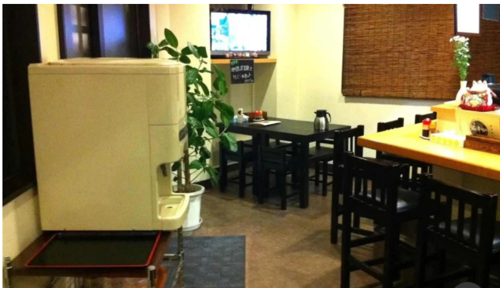
辛麺屋 喜多楼 雰囲気