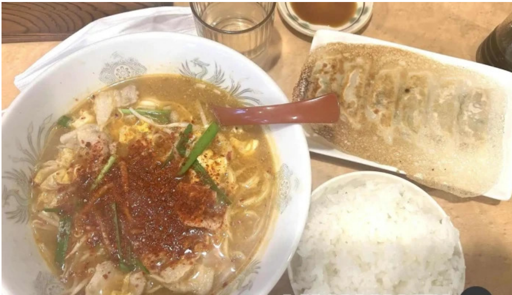
辛麺屋 喜多楼 ラーメン