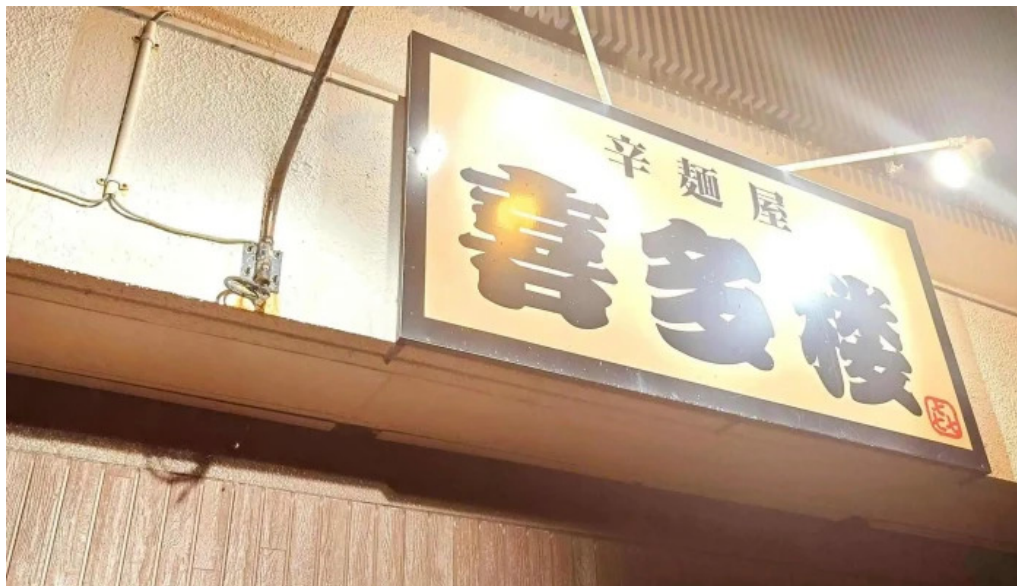
辛麺屋 喜多楼 コメント