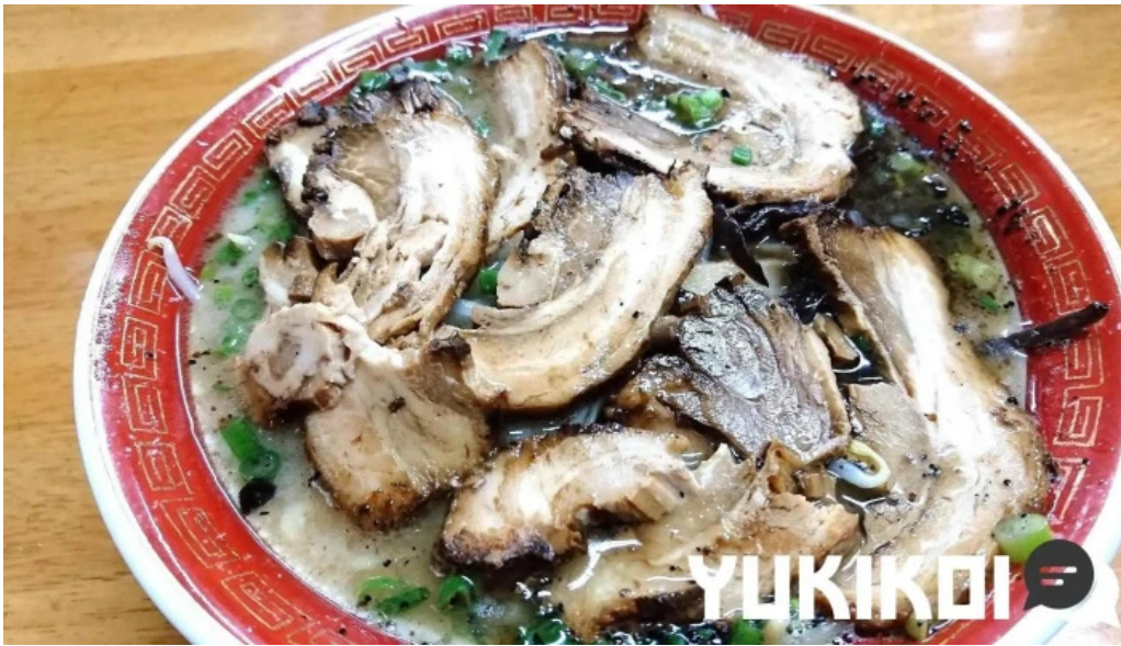
たつや チャーシュー