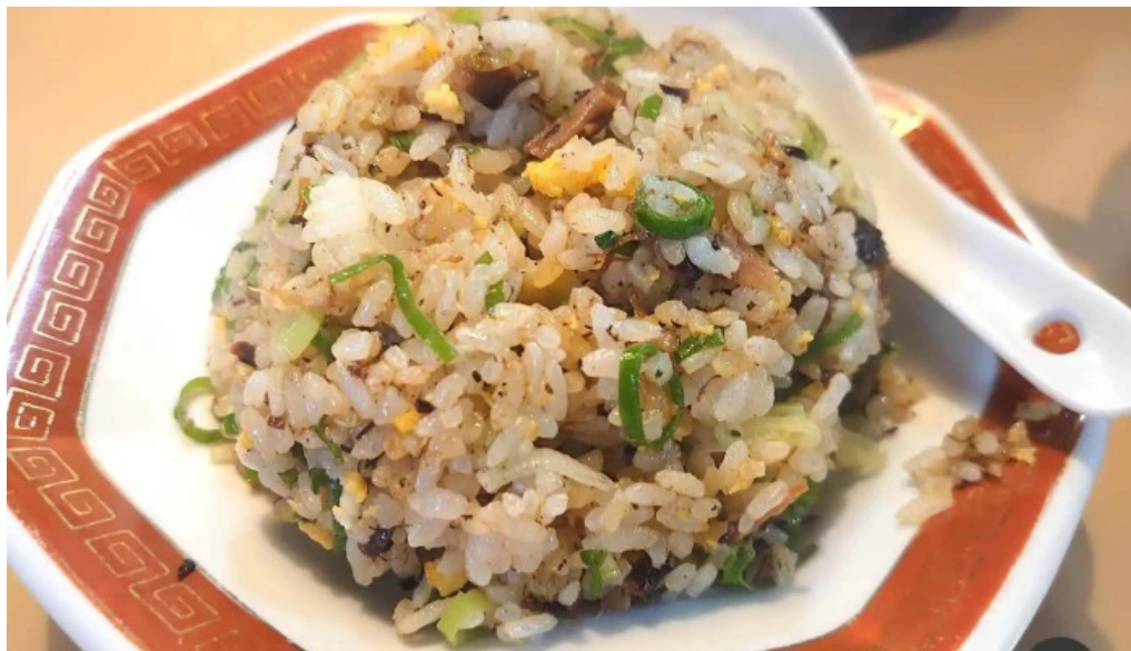
たつやチャーハン