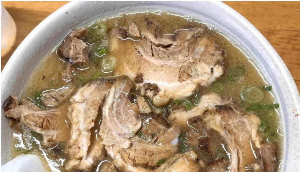
たつや ウェブサイト