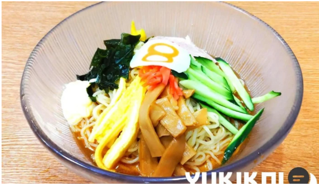
8 番らーめん 羽崎店 料理飲み物