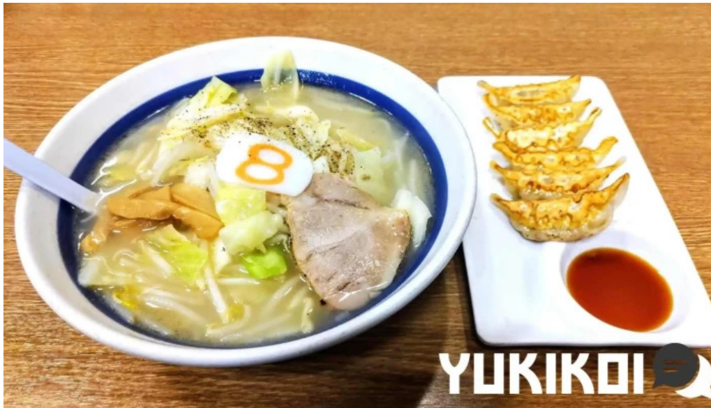
8番らーめん 羽崎店 ラーメン