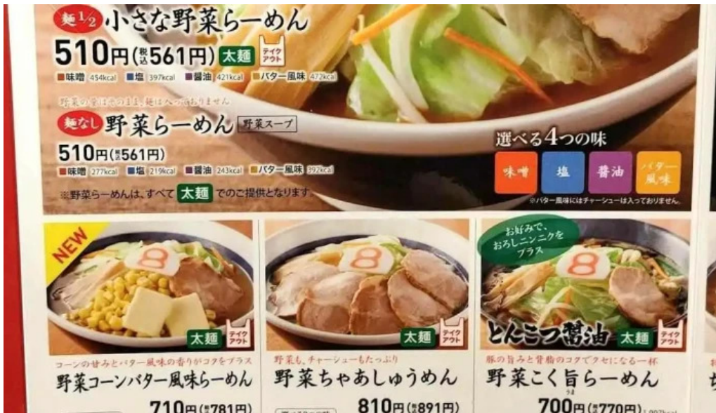
8番らーめん 羽崎店 メニュー