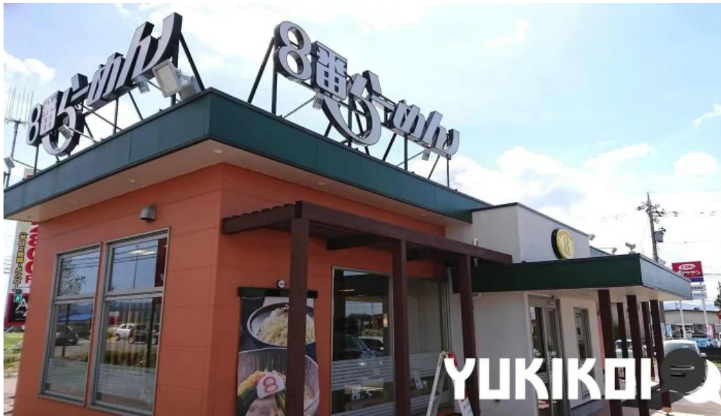
8 番らーめん 羽崎店 坂井市