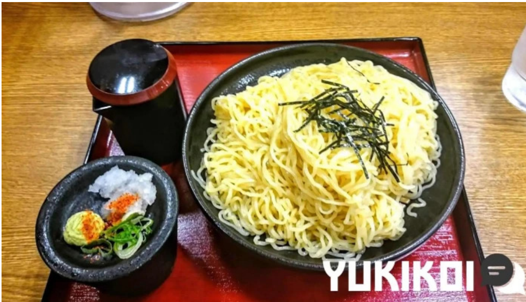
8番らーめん 羽崎店 蕎麦