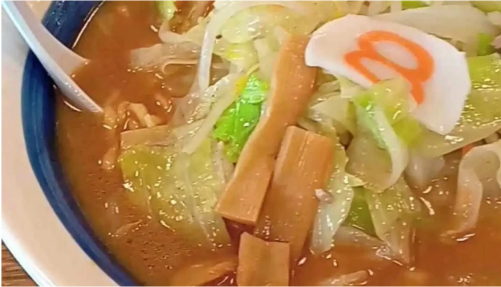
8番らーめん 羽崎店 動画