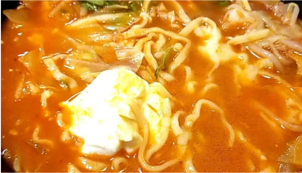
8番らーめん 羽崎店 comentario 2