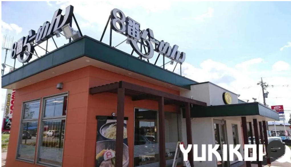
8番らーめん 羽崎店 すべて