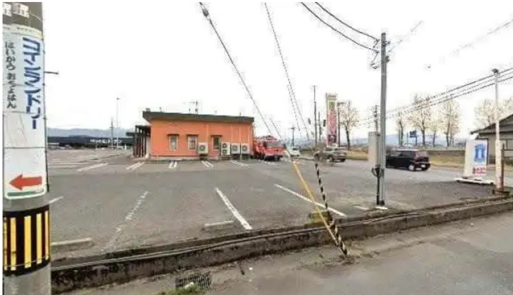
8番らーめん 羽崎店 ストリートビューと 360 ビュー