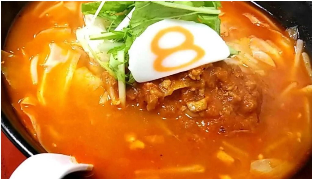
8番らーめん 羽崎店 comentario 1