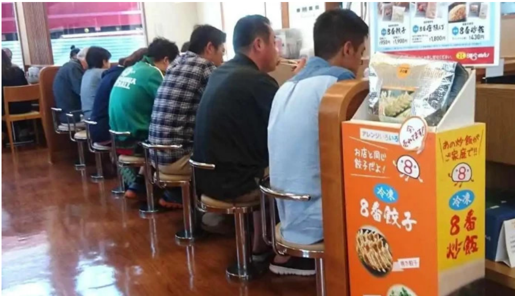
8番らーめん 羽崎店 雰囲気