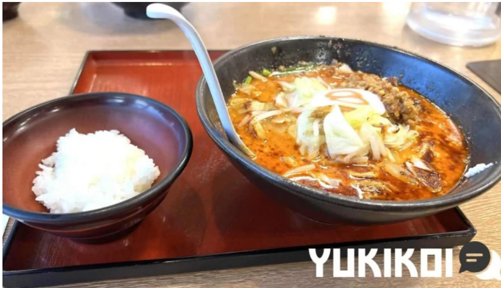
8番らーめん 羽崎店 キムチ