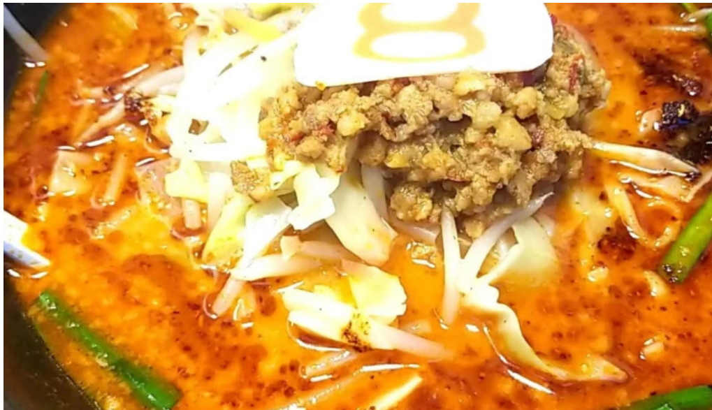
8 番らーめん 羽崎店 comentario 3