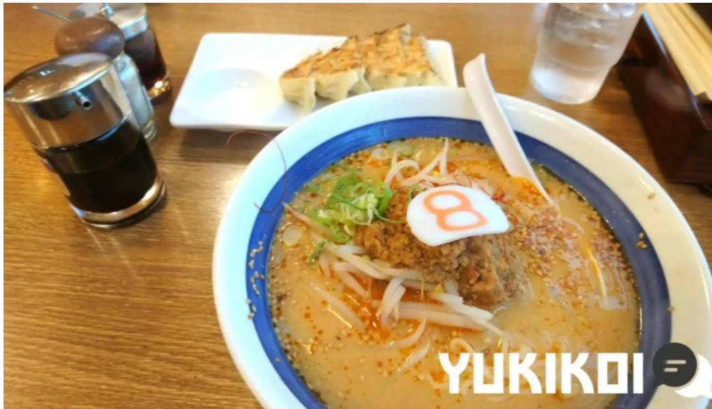
8番らーめん 羽崎店 スープ