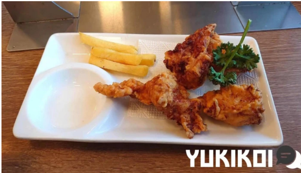
8 番らーめん 羽崎店 から揚げ