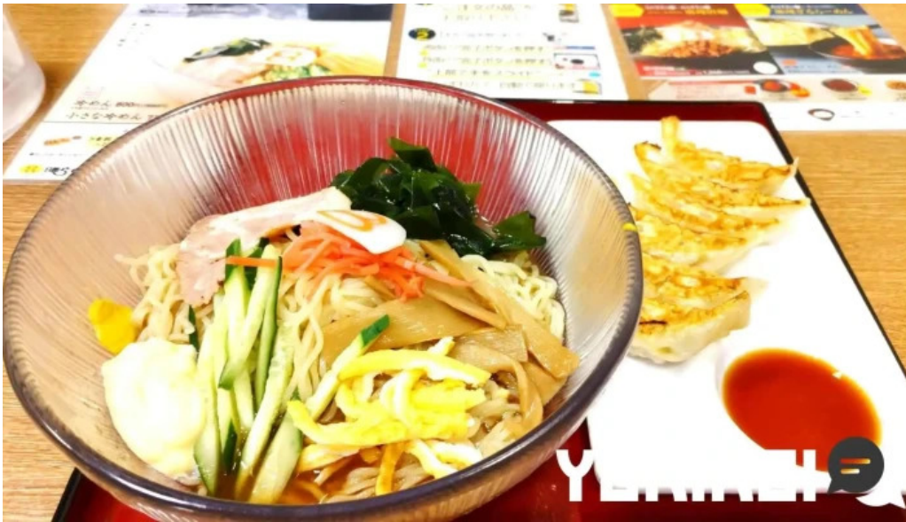
8番らーめん 羽崎店 冷やし中華