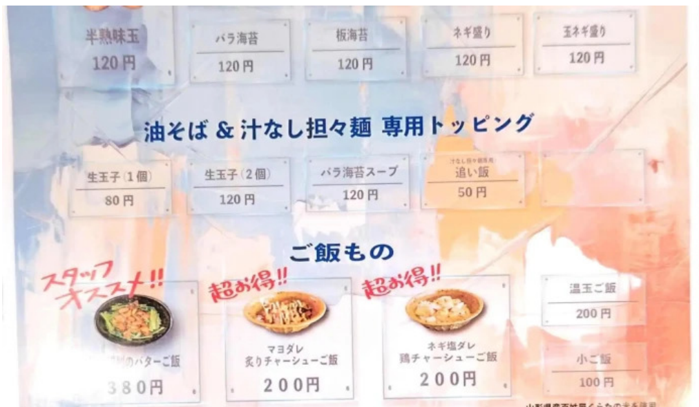
麵屋 葵 電話