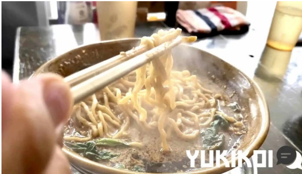
麺屋 葵 スープ