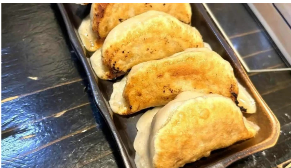
麵屋 葵 餃子