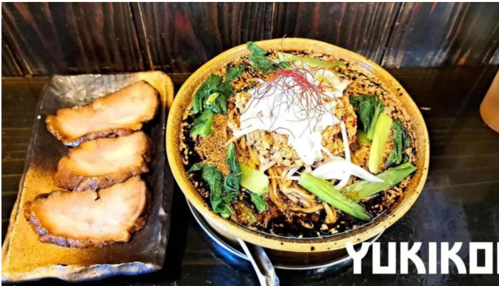
麵屋 葵 料理飲み物