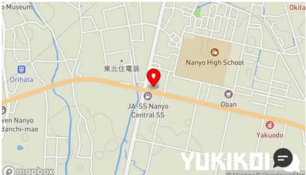
麵屋 葵 地図