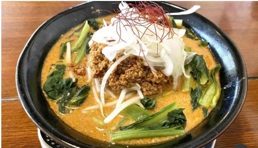
麵屋 葵 ラーメン