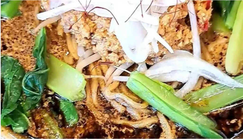
麵屋 葵 最新