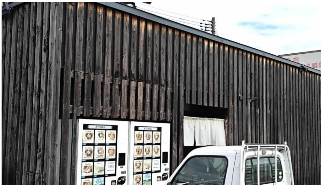
麺屋 葵 カタログ