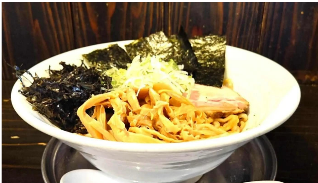
麺屋 葵 蕎麦