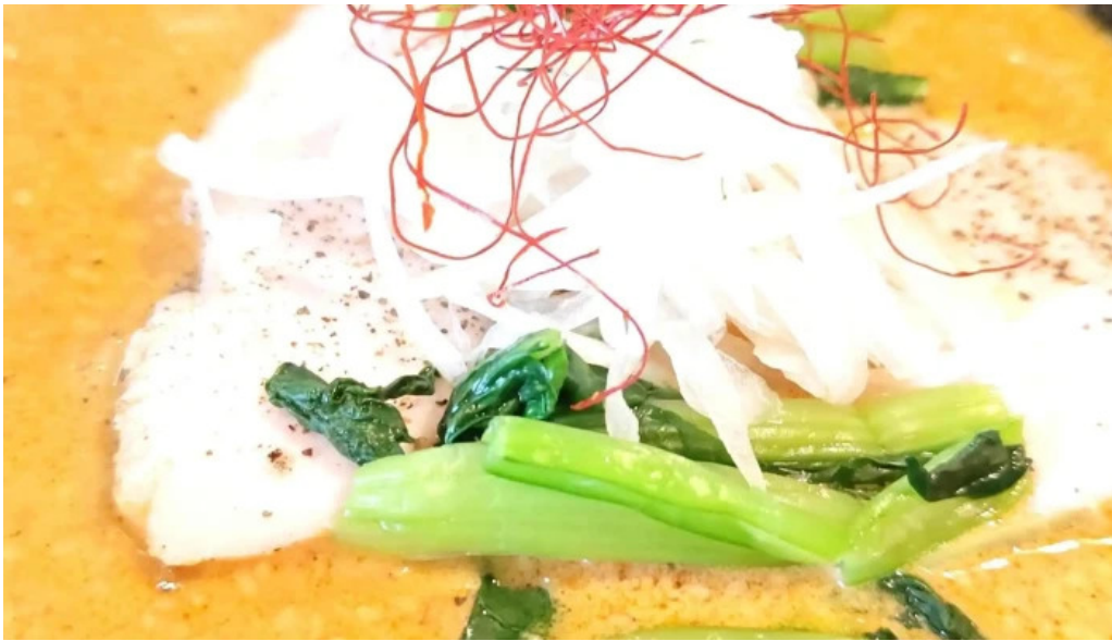
麵屋 葵 所在地