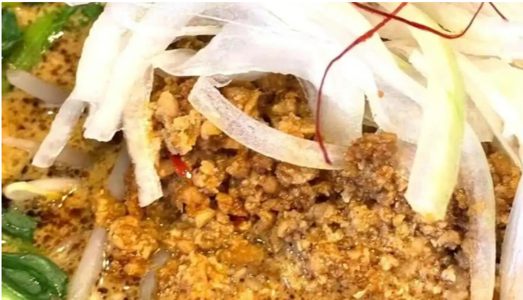
麵屋 葵 動画