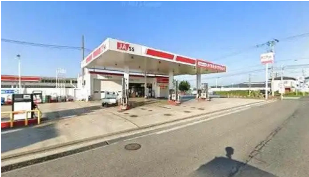
麵屋 葵 南陽市