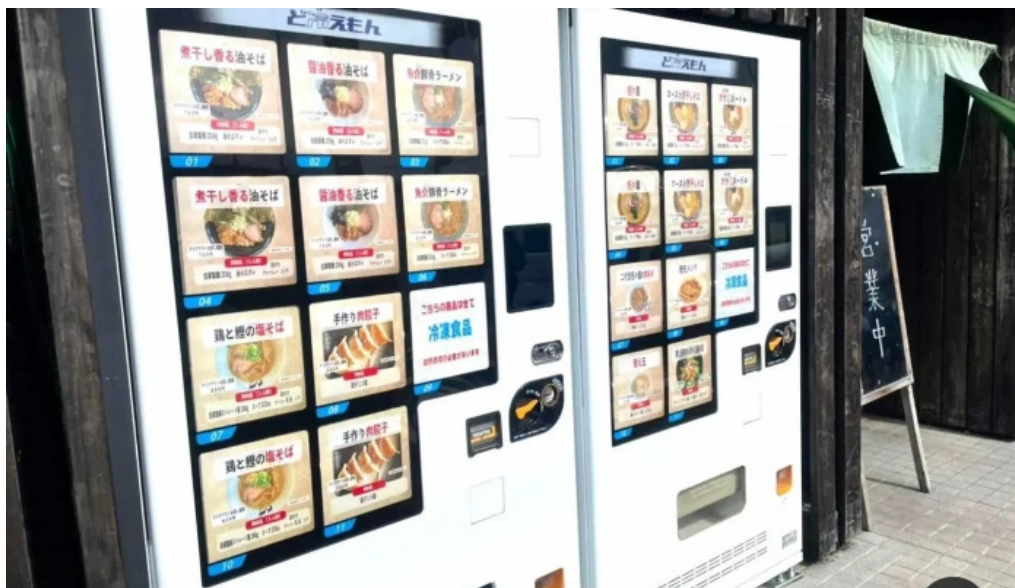
麵屋 葵 雰囲気