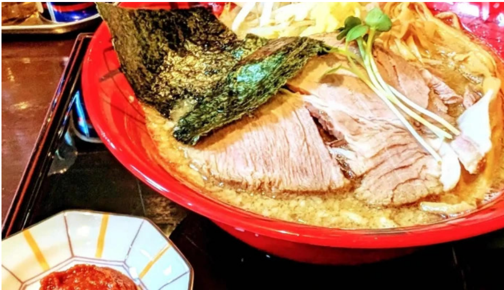
麺や 兼蔵 カタログ