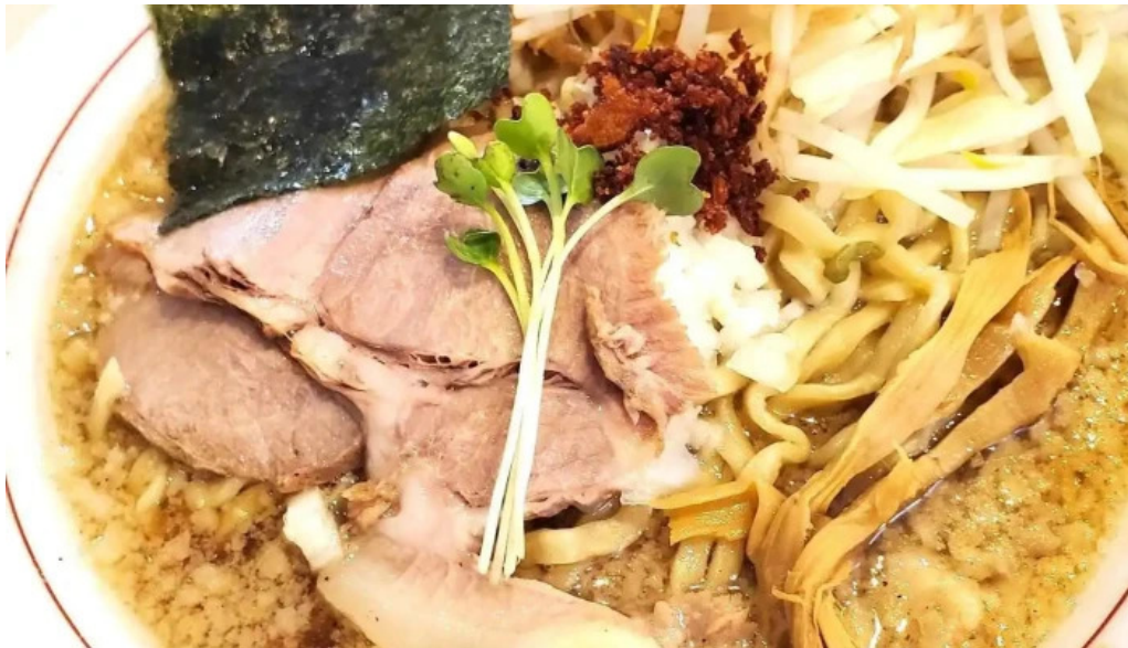
麺や 兼蔵 ラーメン