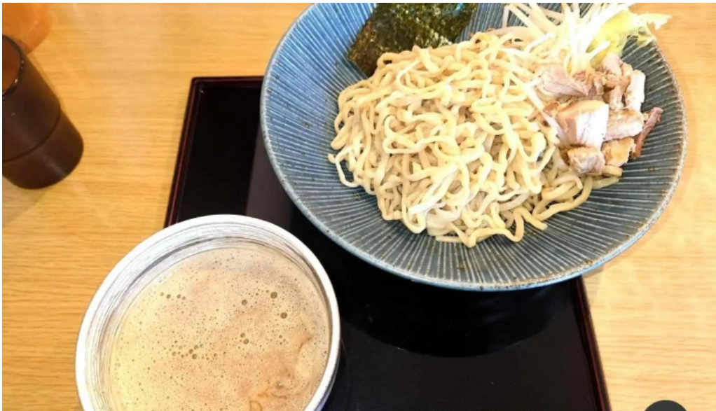
麺や 兼蔵 つけ麺