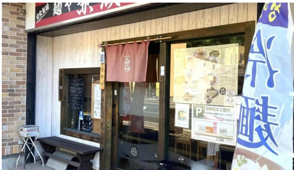
麺や 兼蔵 電話