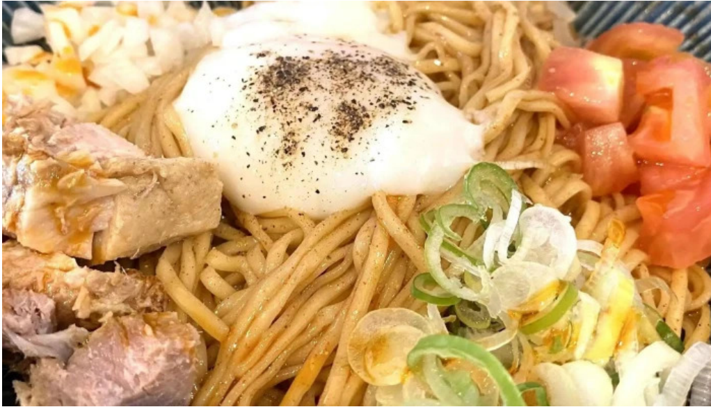
麺や 兼蔵 コメント