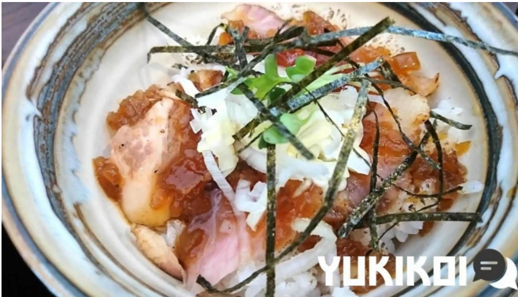
麺や 兼蔵 料理飲み物