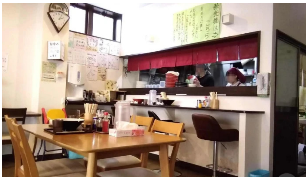
麺や 兼蔵 雰囲気