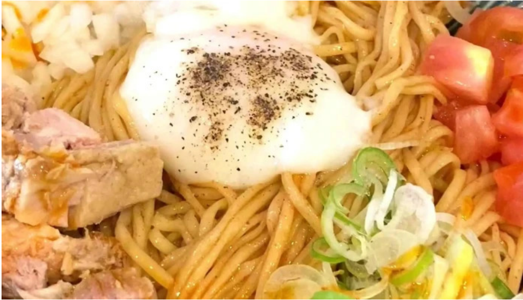
麺や 兼蔵 どこ