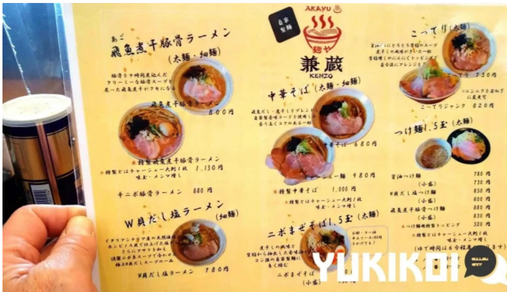
麺や 兼蔵 メニュー