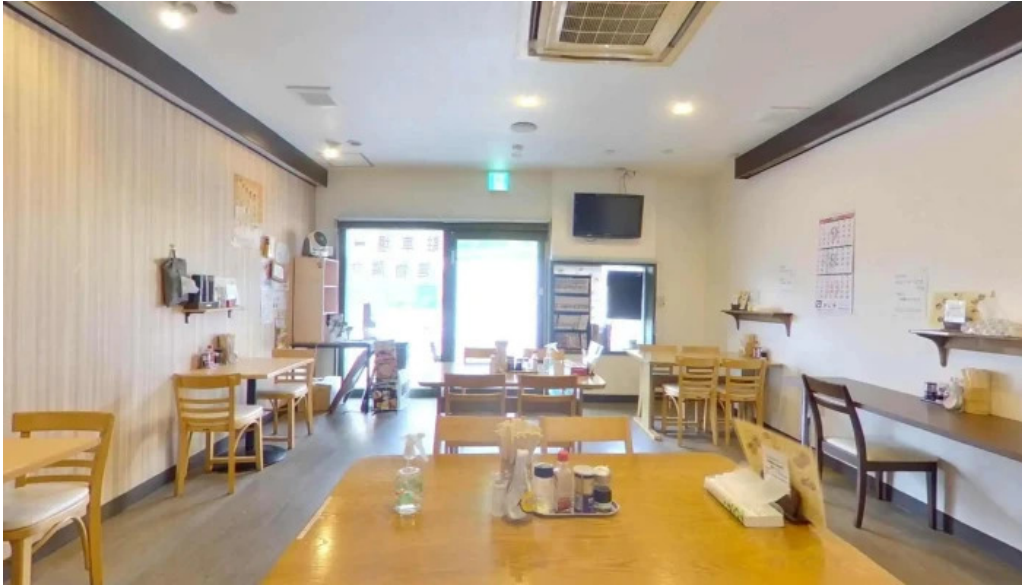
麵や 兼蔵 南陽市