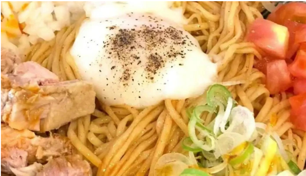
麵や 兼蔵 最新