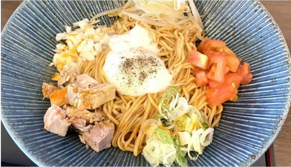
麵や 兼蔵 番号