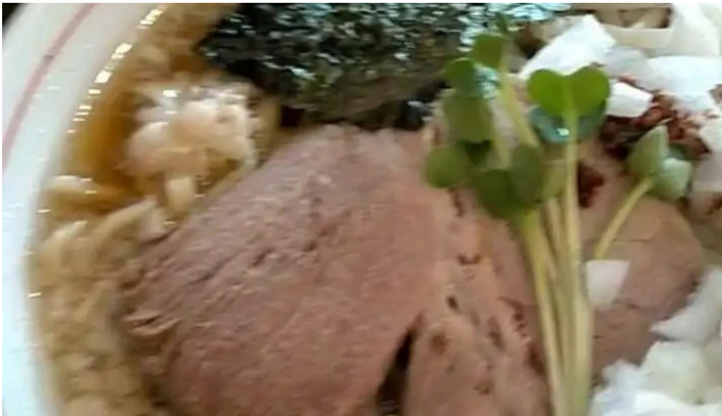
麵や 兼蔵 動画