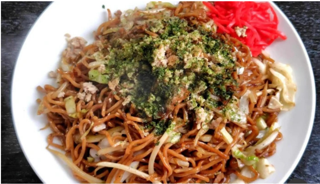
中華そば 来々軒 焼きそば