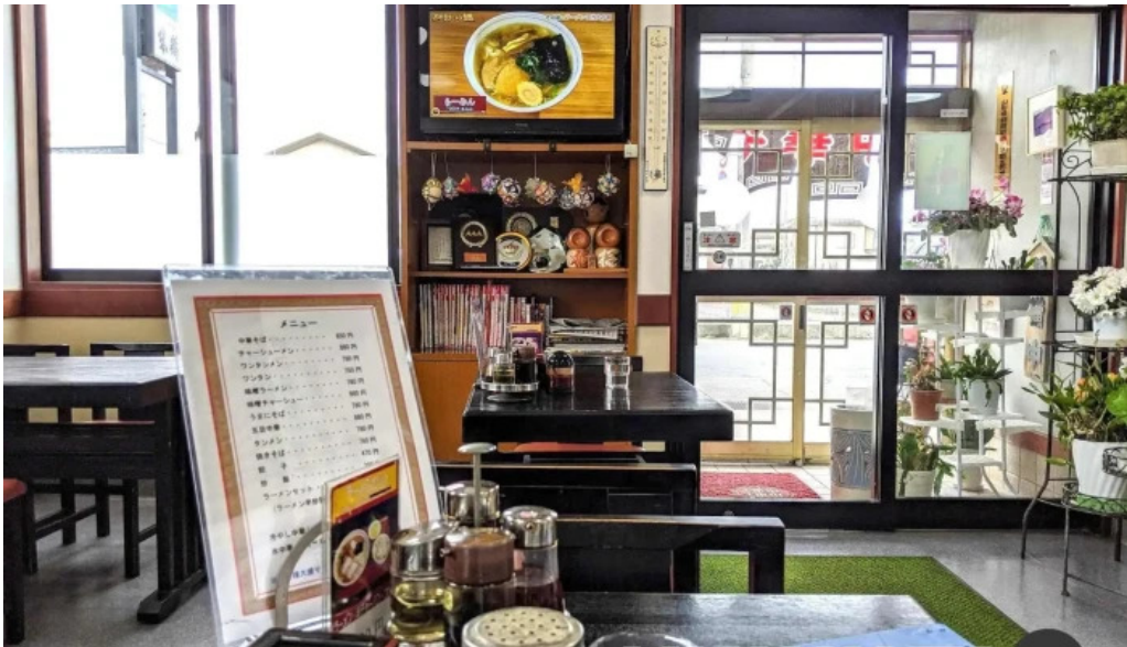
中華そば 来々軒 雰囲気