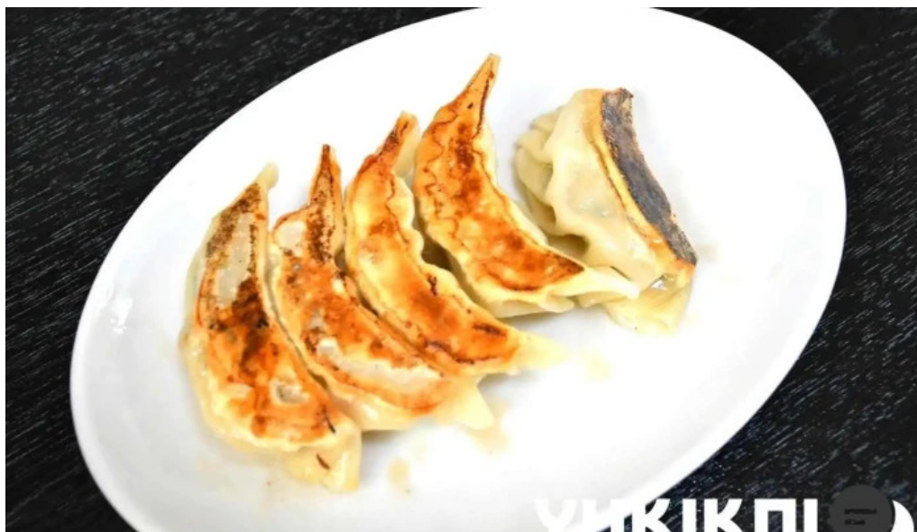
中華そば 来々軒 餃子