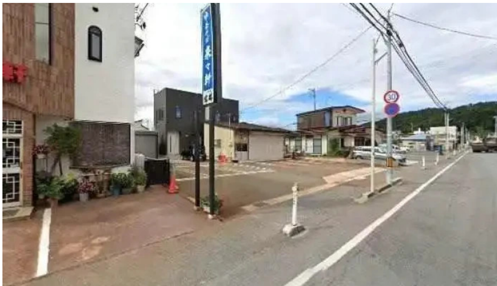
中華そば 来々軒 南陽市