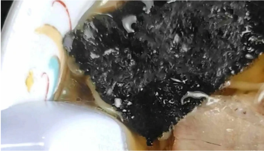
中華そば 来々軒 料金