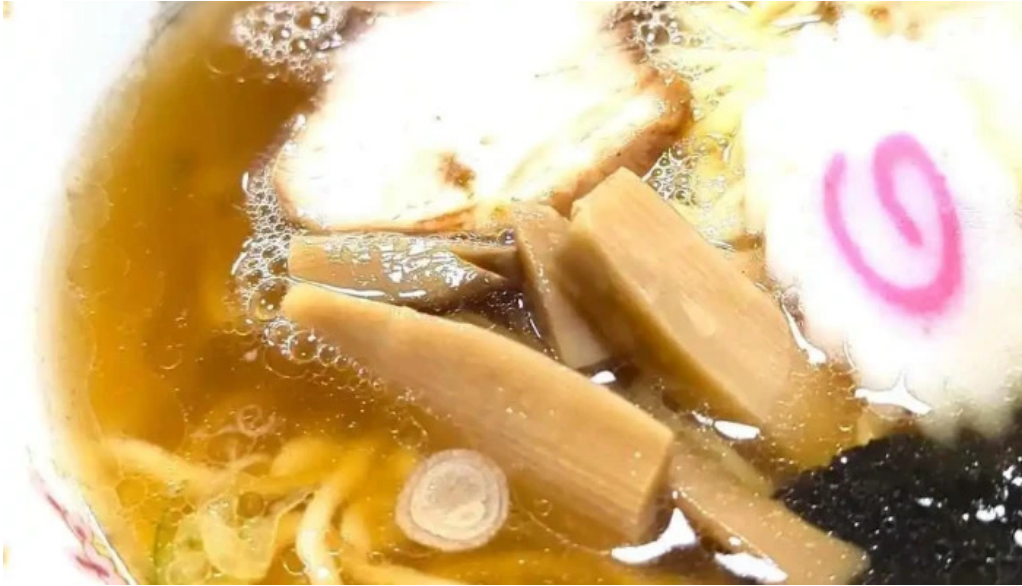
中華そば 来々軒 スープ