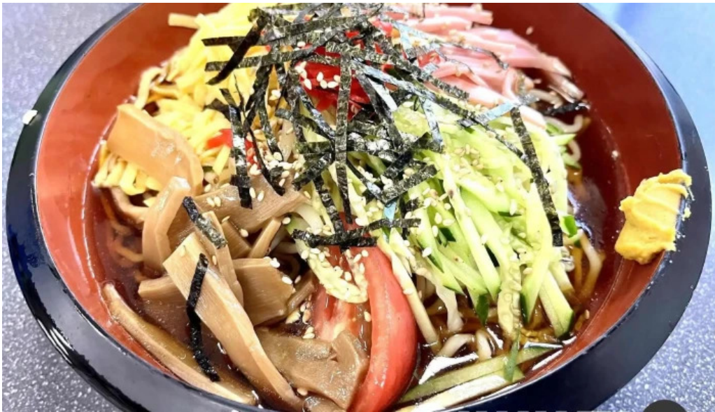
中華そば 来々軒 冷やし中華