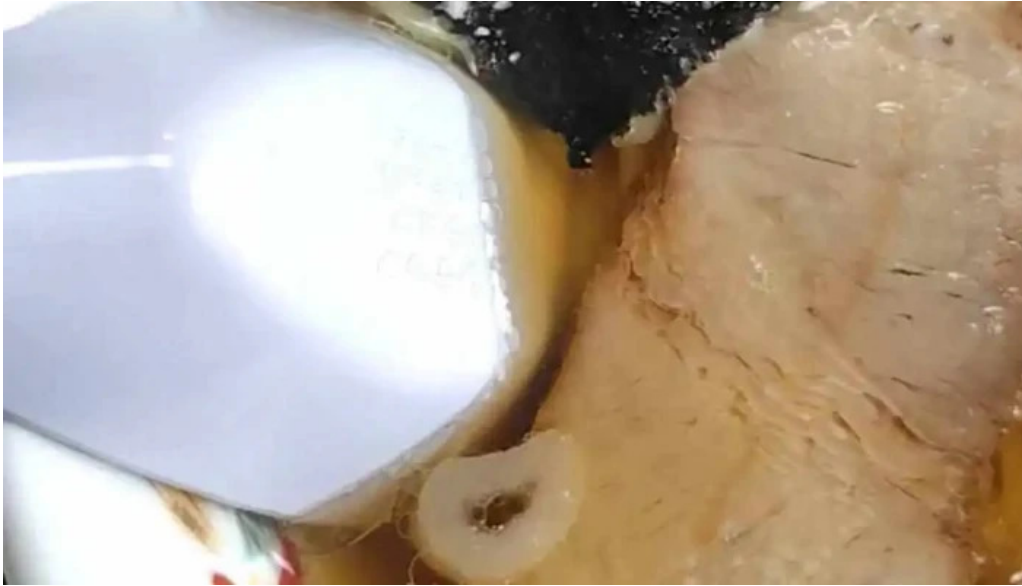
中華そば 来々軒 動画