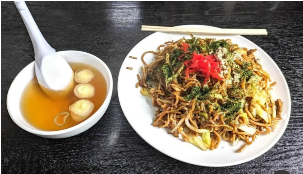
中華そば 来々軒 料理飲み物