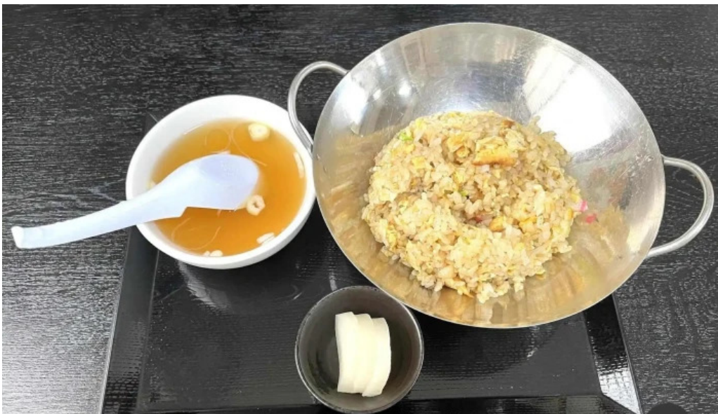
中華そば 来々軒 焼き飯