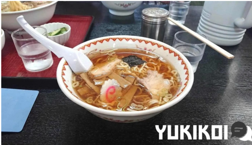
中華そば 来々軒 ラーメン