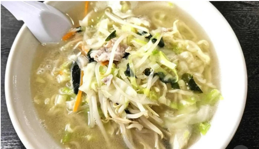
中華そば 来々軒 ちゃんぽん