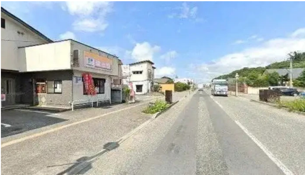
ラーメンほとり 南陽市