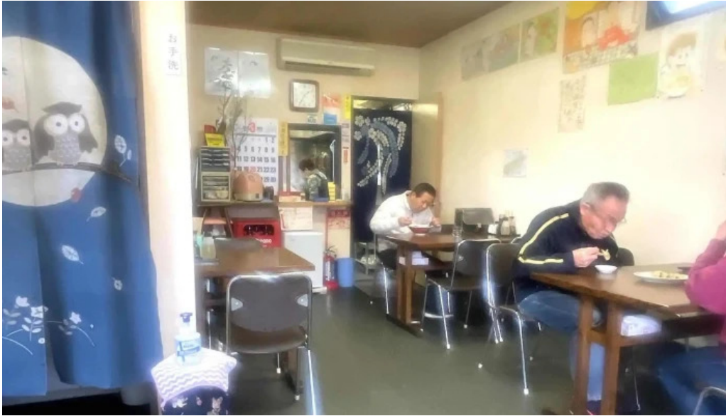
ラーメンほとり 電話