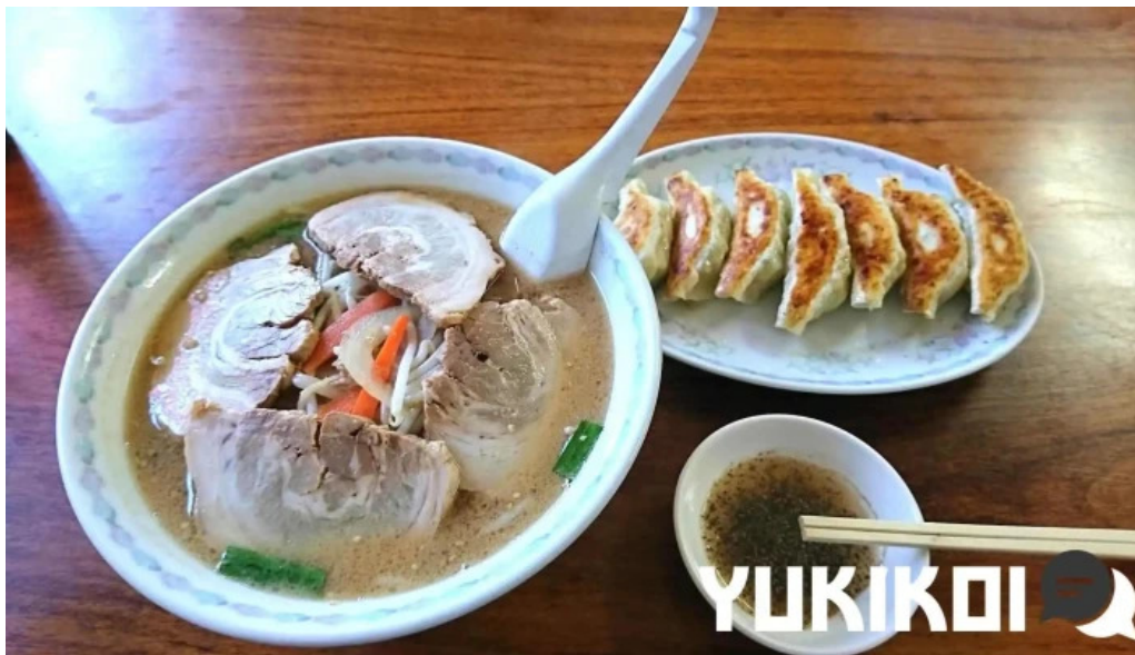
ラーメン ひとり 料理飲み物