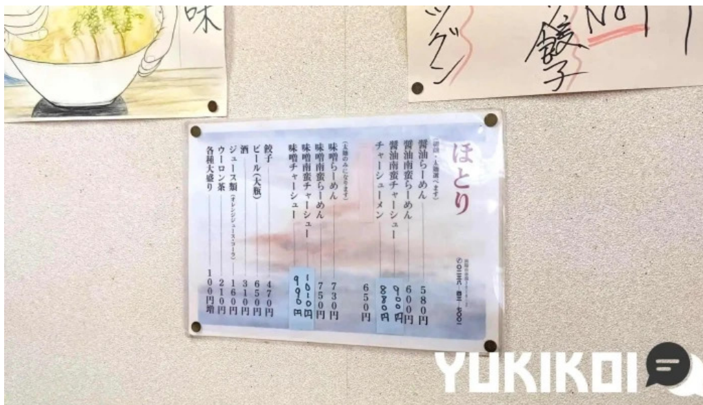
ラーメンほとりメニュー