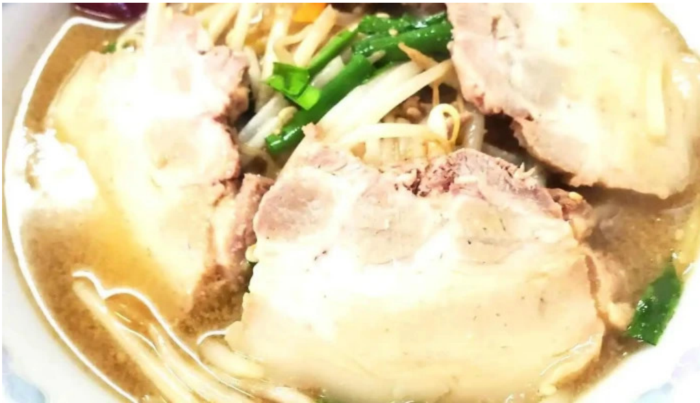
ラーメン ほとり 最新