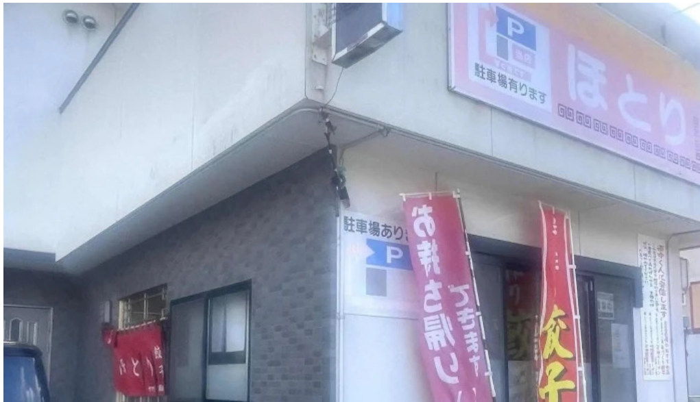
ラーメン ひとり 料金