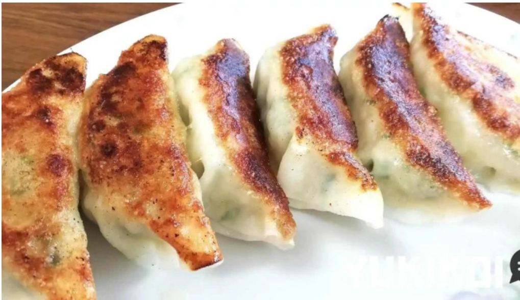
ラーメン ひとり 餃子