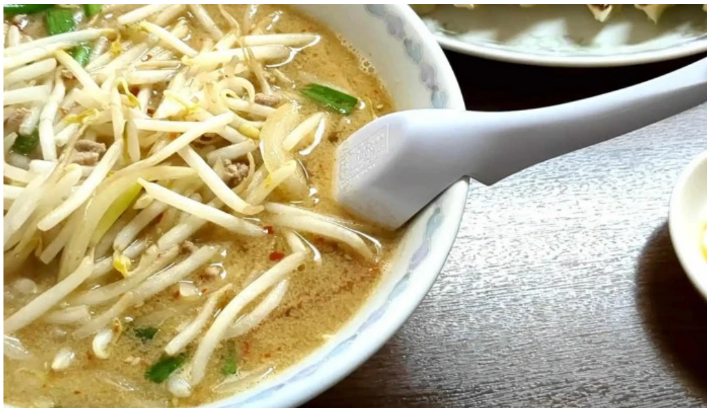
ラーメンほとり コメント