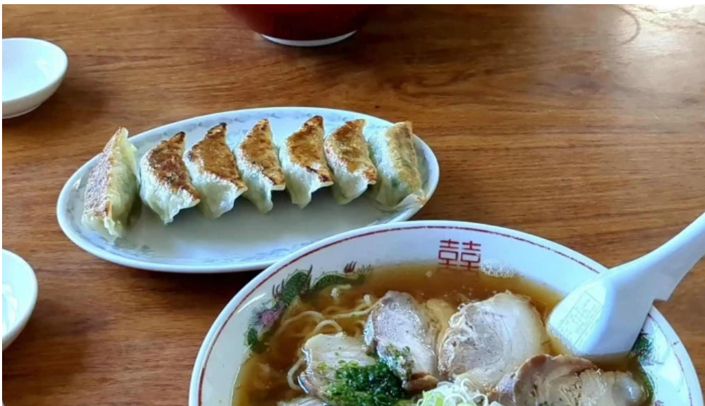
ラーメン ひとり 住所