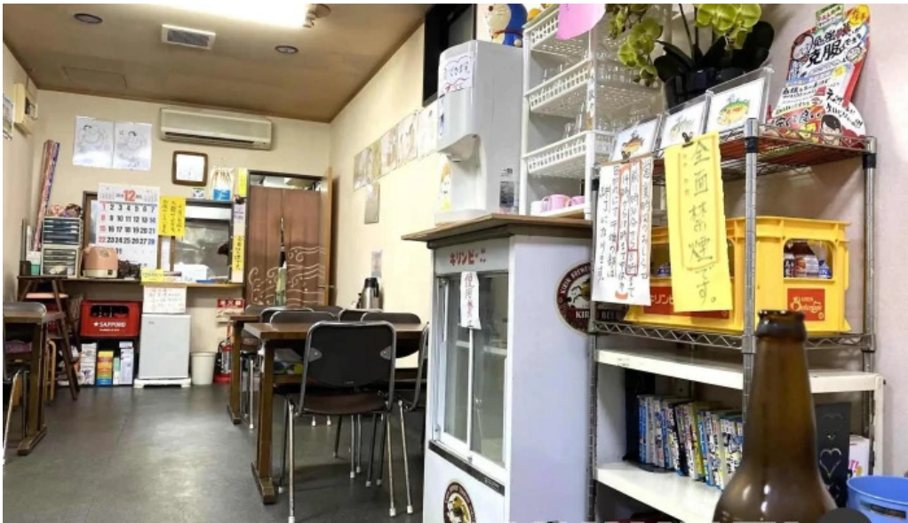
ラーメンほとり 雰囲気