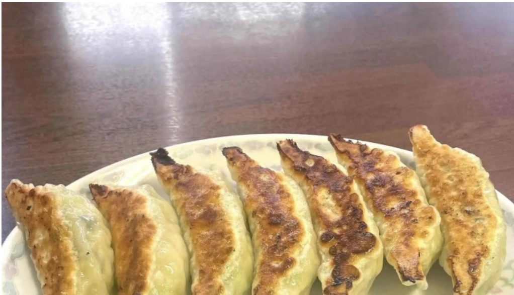
ラーメン ひとり 動画