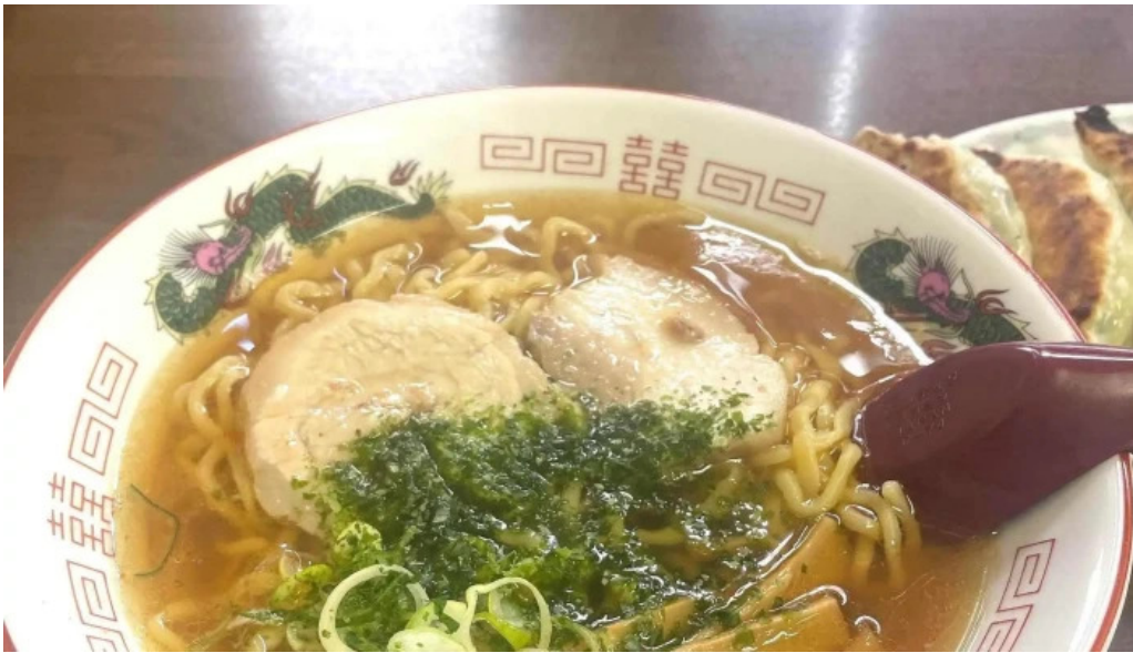
ラーメン ほとり 近く