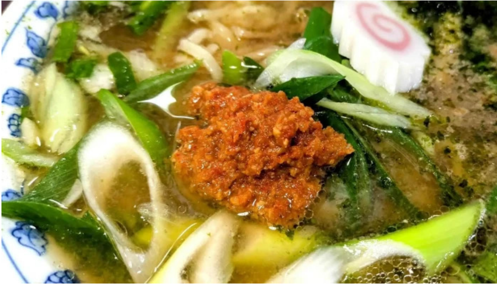
らーめん館くめ 住所