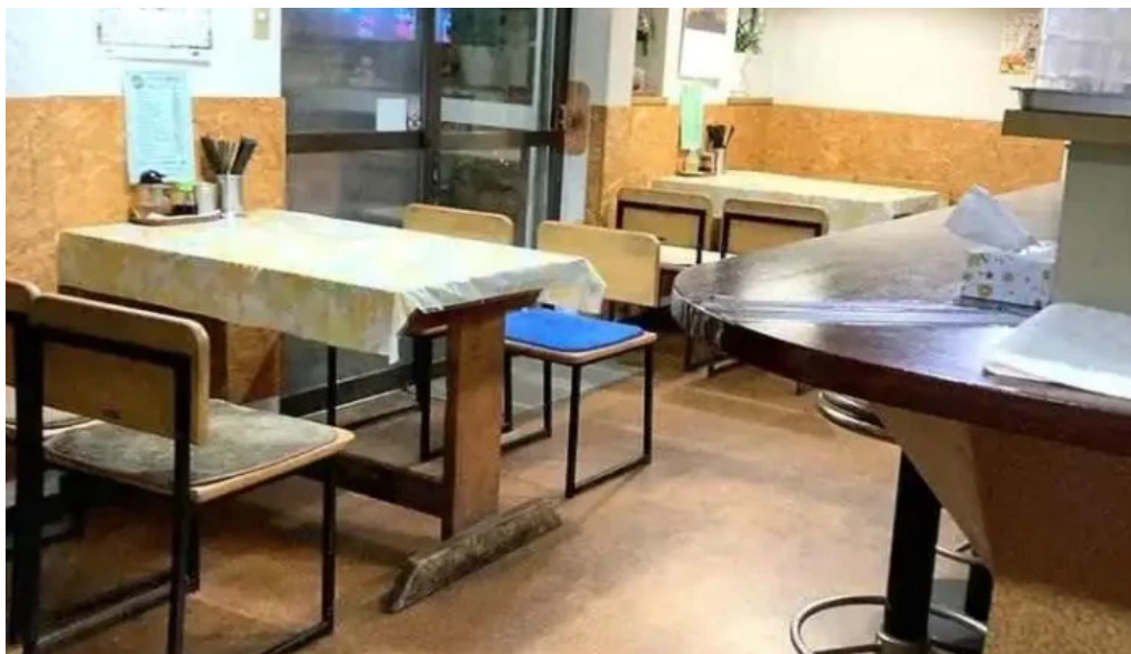
らーめん館くめ 雰囲気