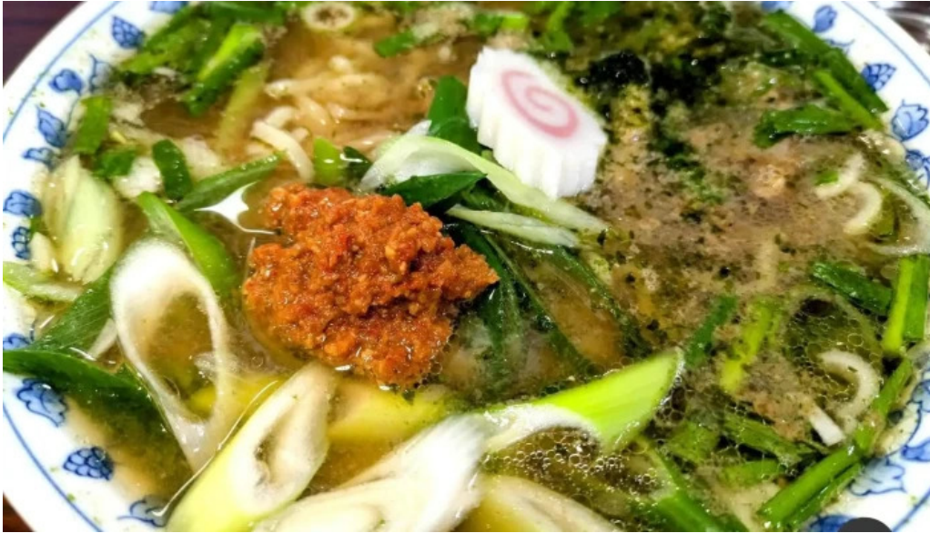
らーめん館くめ スープ