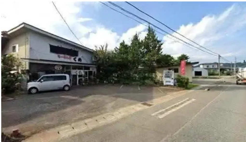
ラーメン館くめ 南陽市