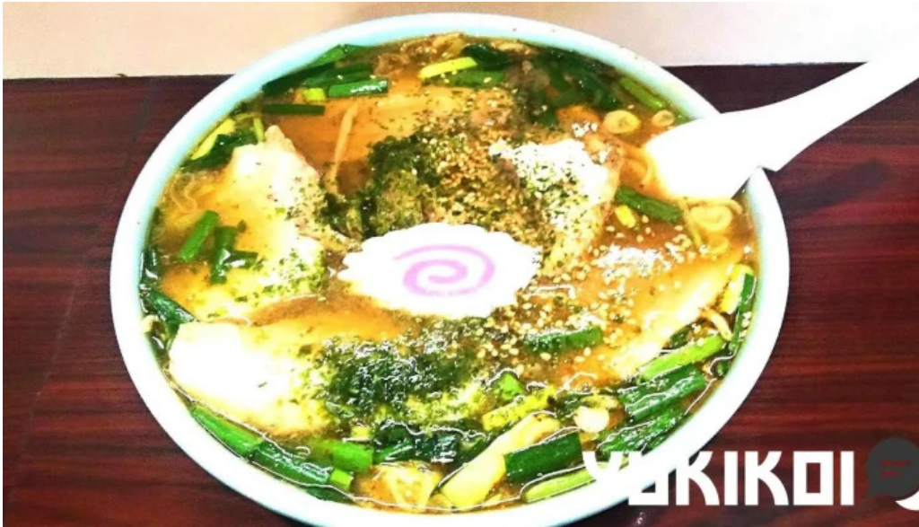
らーめん館くめ ラーメン