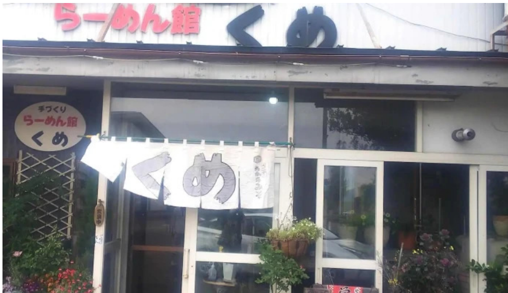
らーめん館くめ 割引