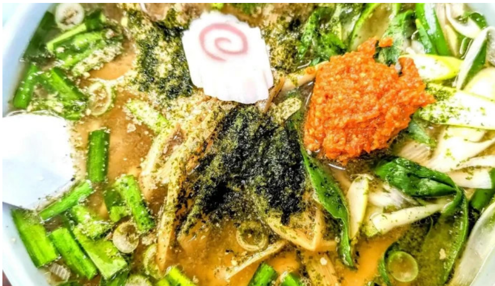
らーめん館くめ 写真