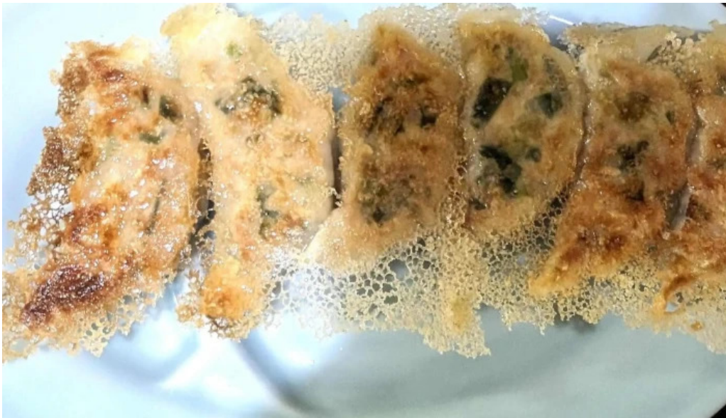
らーめん館くめ 料金