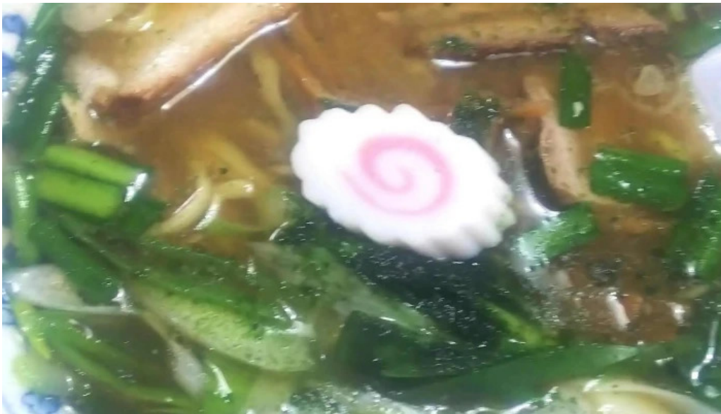
らーめん館くめ スコア