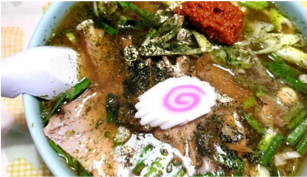
らーめん館くめ 番号