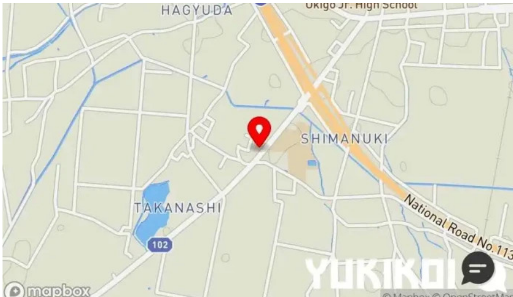
らーめん館くめ 地図