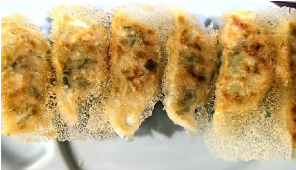
らーめん館くめプロモーション