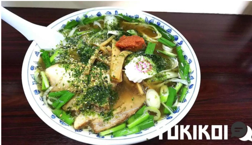
らーめん館くめ 料理飲み物