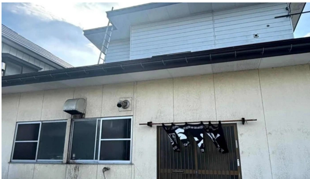
さかえ食堂 行き方