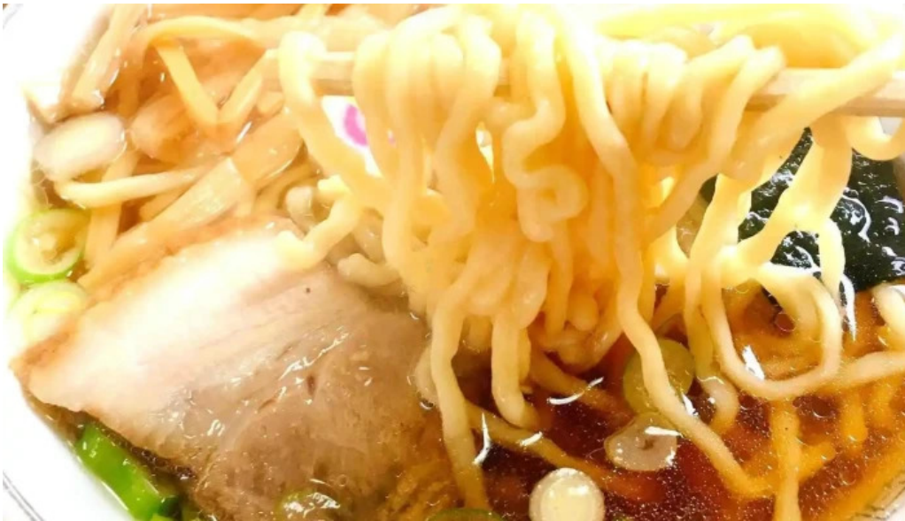
さかえ食堂 料理飲み物