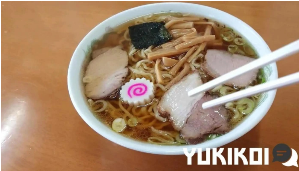
さかえ食堂 ラーメン