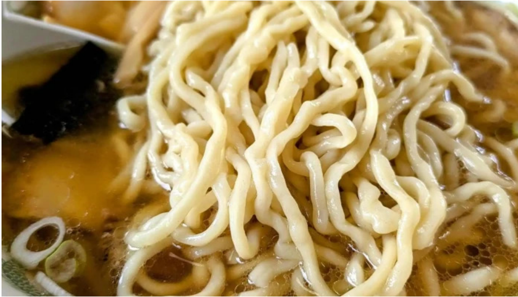
さかえ食堂 営業中