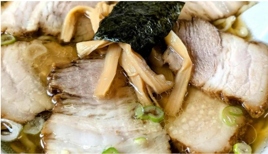
さかえ食堂 所在地