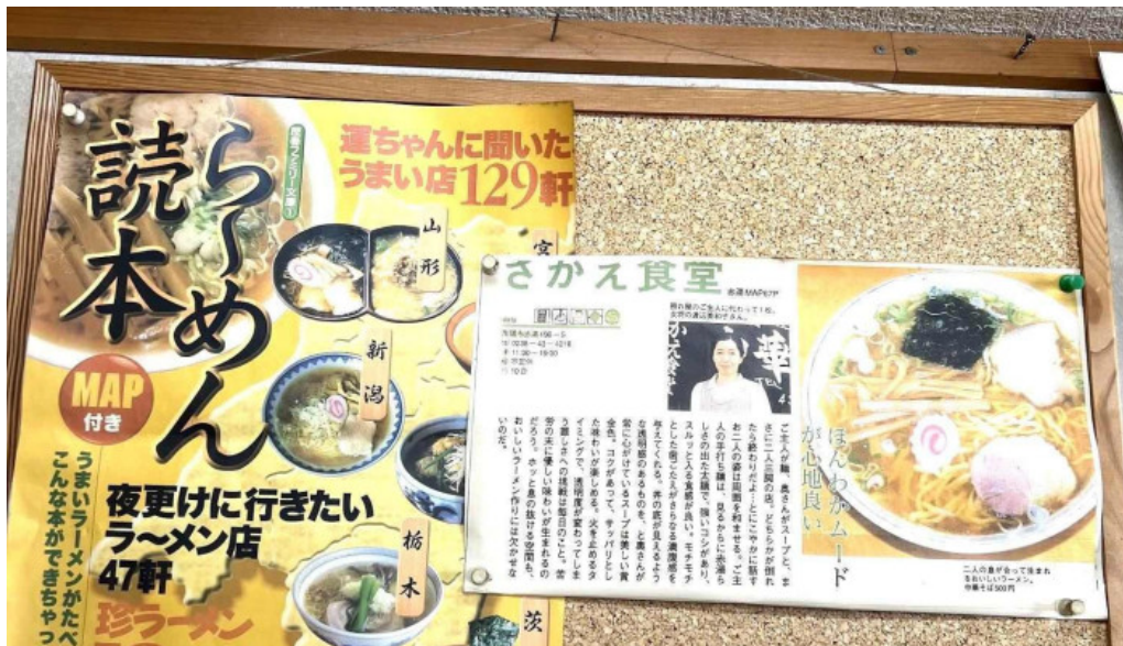
さかえ食堂 メニュー