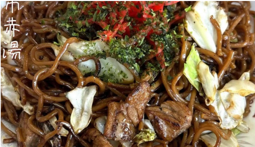
さかえ食堂 エリア