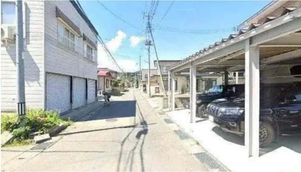
さかえ食堂 南陽市