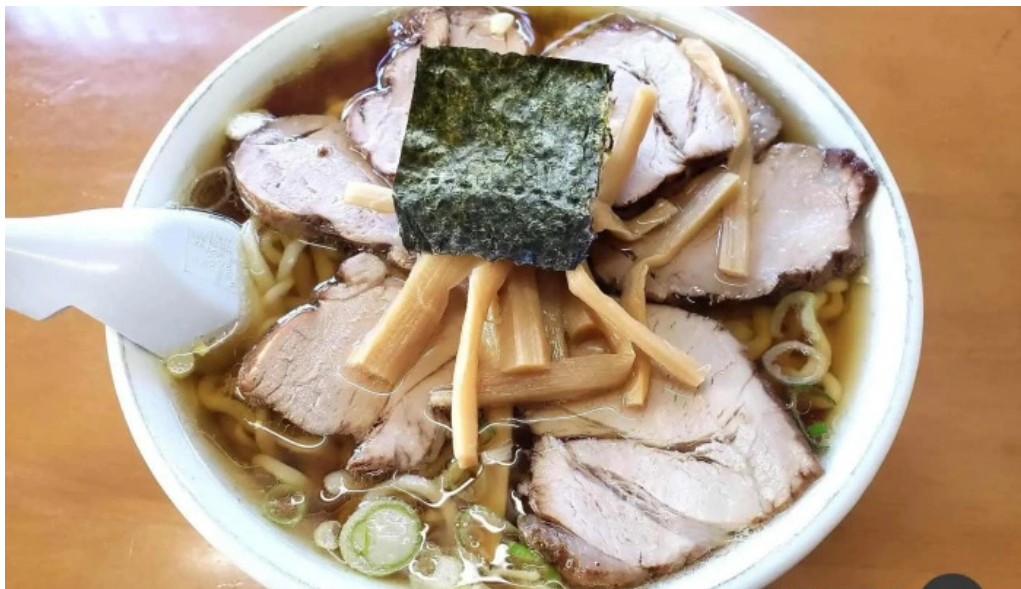
さかえ食堂 スープ