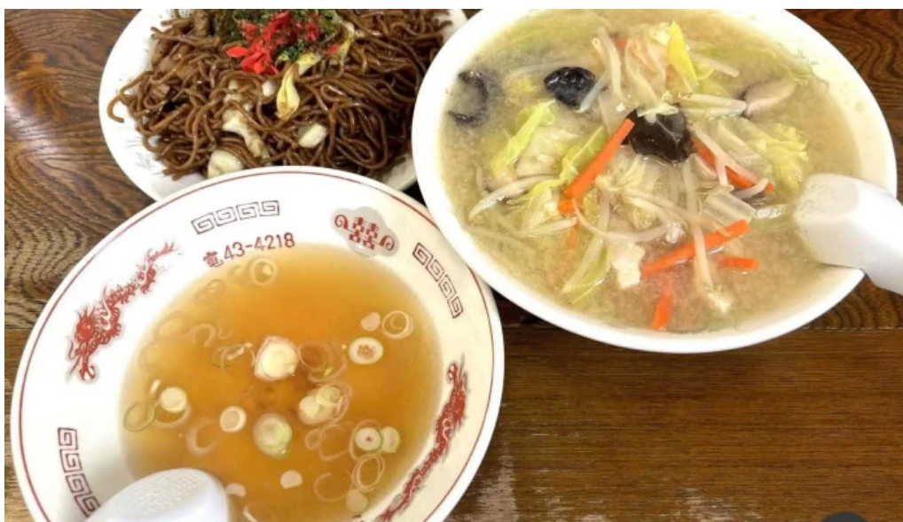
さかえ食堂 焼きそば