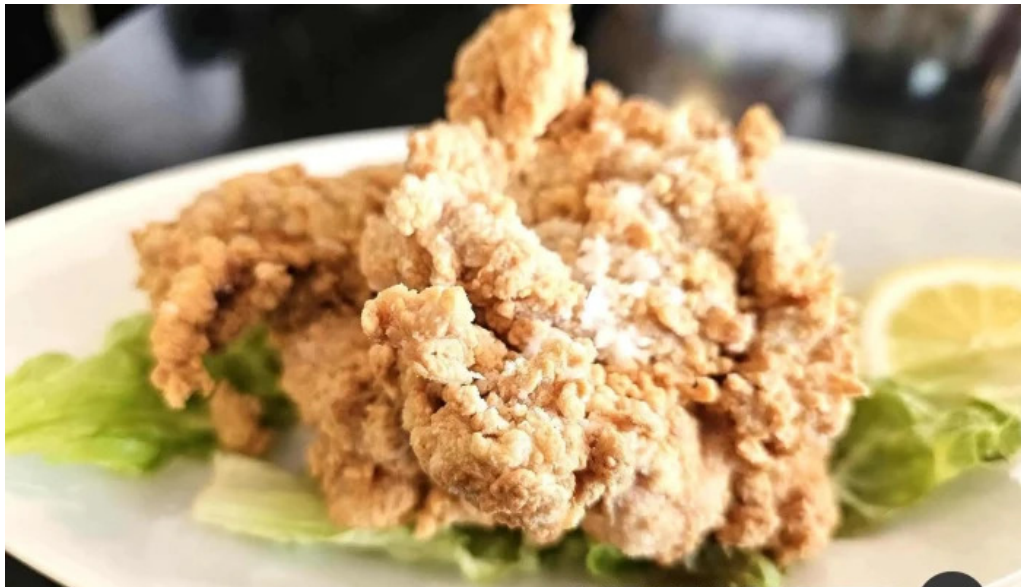
函館麺厨房 あじさい本店 から揚げ