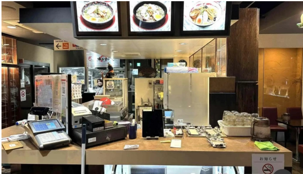
函館麺厨房 あじさい 本店 雰囲気