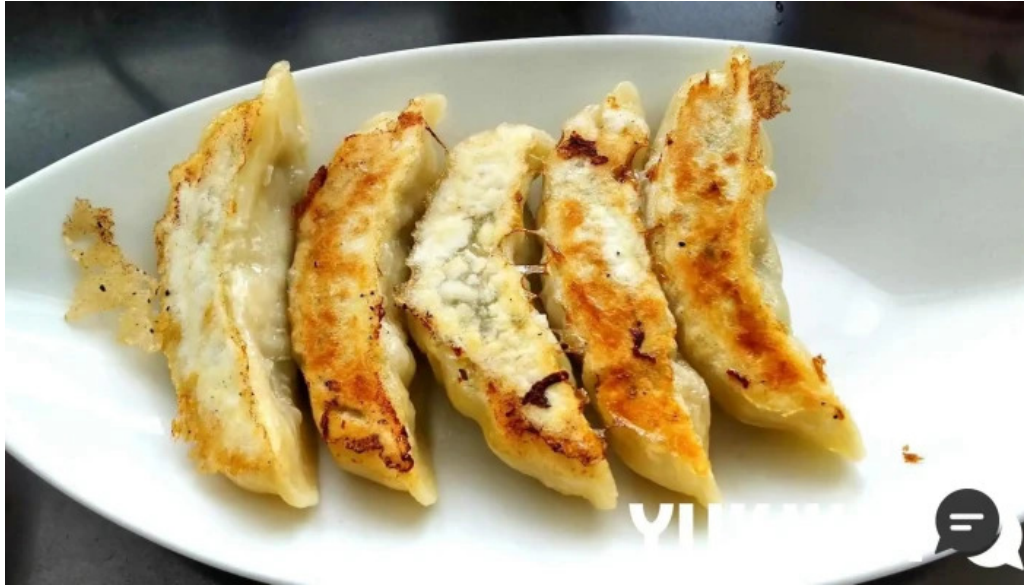
函館麺厨房 あじさい 本店 餃子