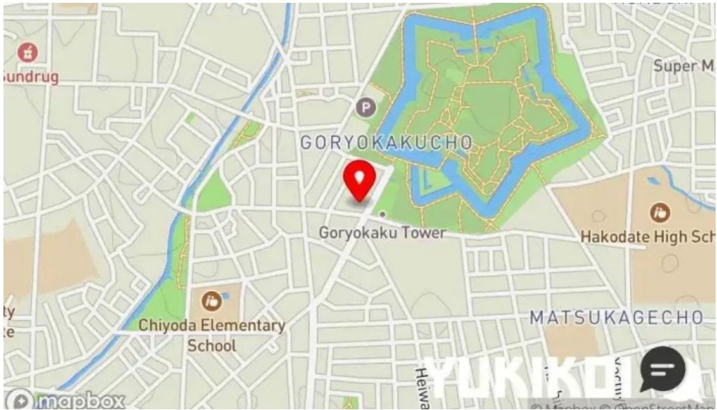
函館麵厨房 あじさい本店 地図