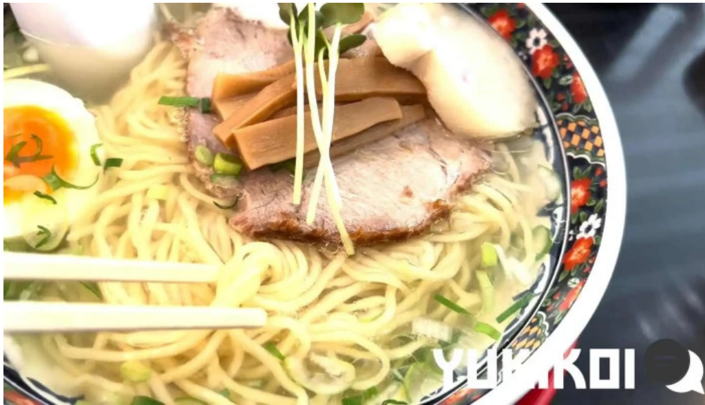
函館麵厨房 あじさい本店 動画