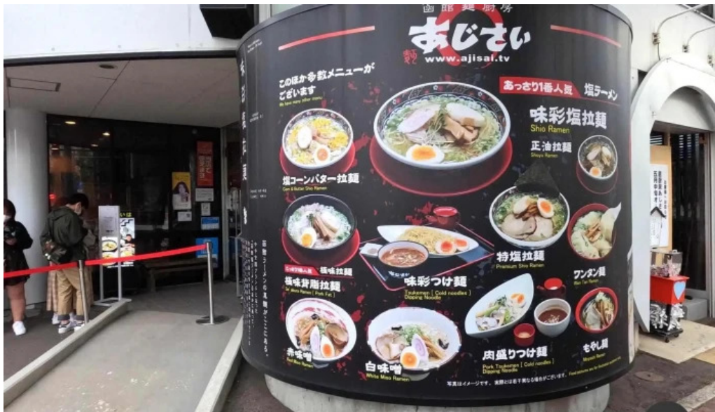
函館麵厨房 あじさい本店 メニュー