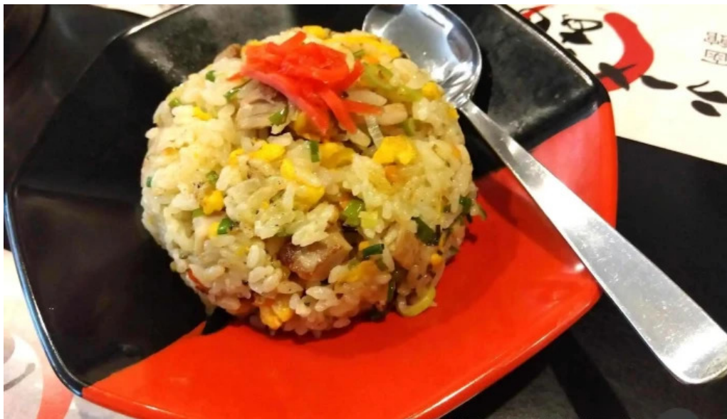
函館麺厨房 あじさい 本店 焼き飯