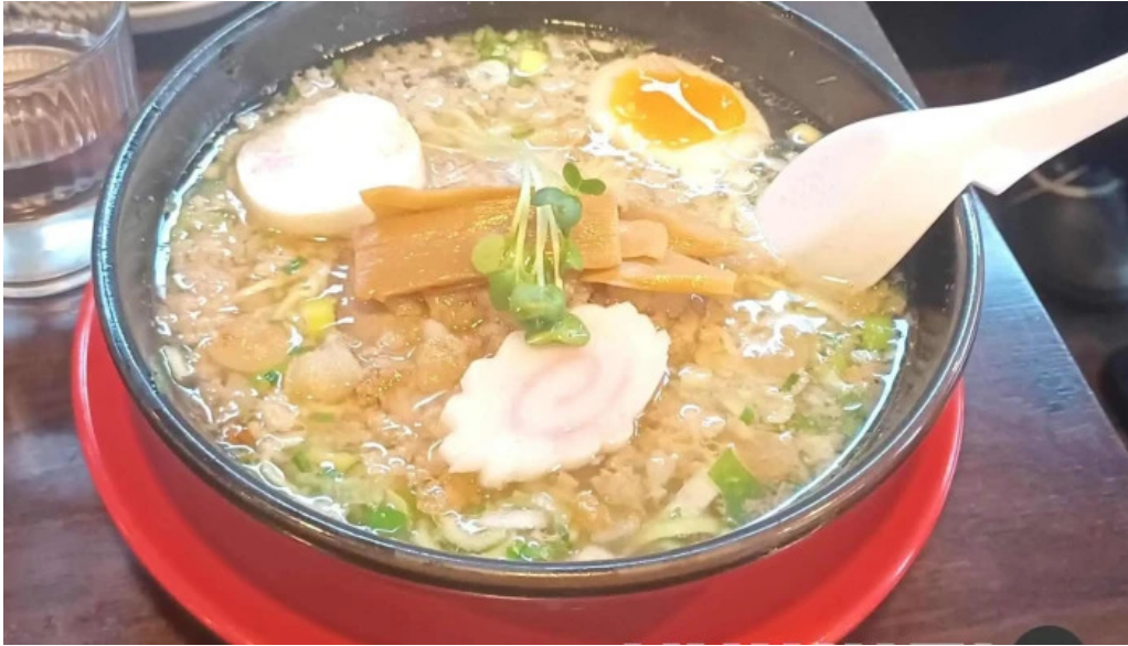
函館麺厨房 あじさい 本店 最新