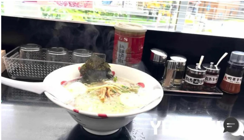
函館麵厨房 あじさい本店 ラーメン