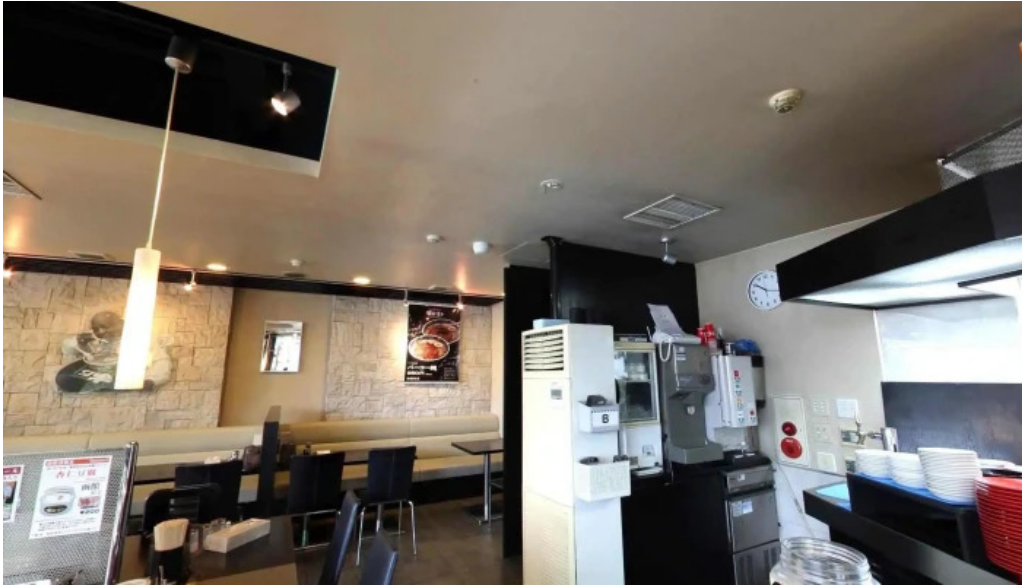
函館麵厨房 あじさい 本店 函館市