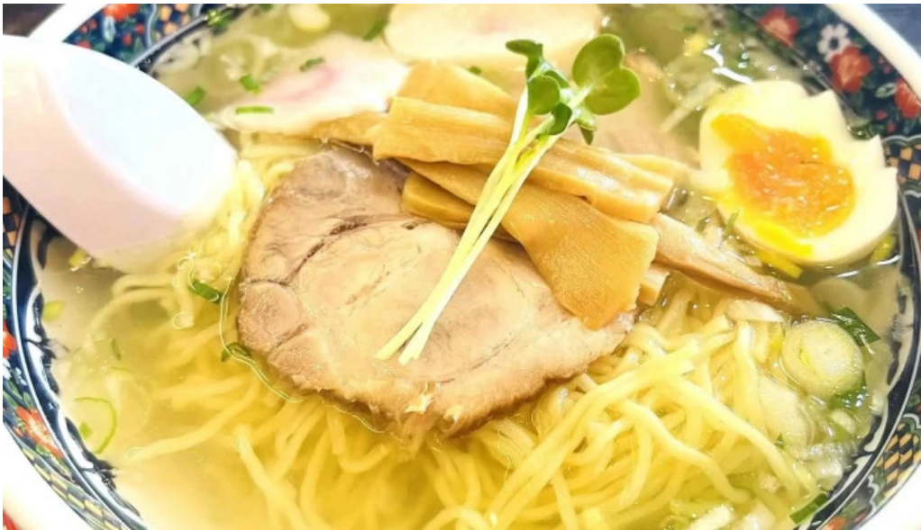
函館麺厨房 あじさい 本店 料理飲み物