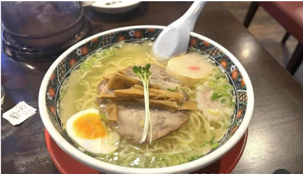
函館麵厨房 あじさい 本店 スープ