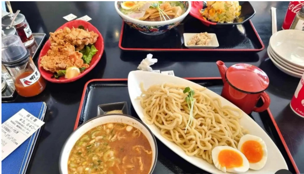
函館麺厨房 あじさい本店 つけ麺