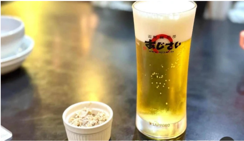
函館麵厨房 あじさい 本店 ビール