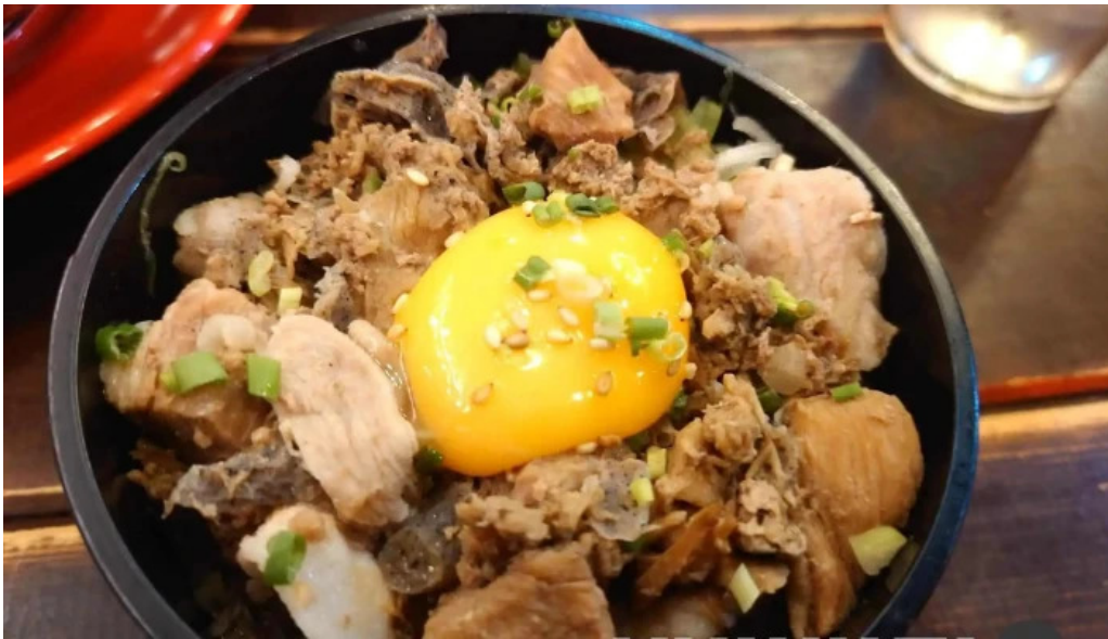
函館麵厨房 あじさい 本店 丼物