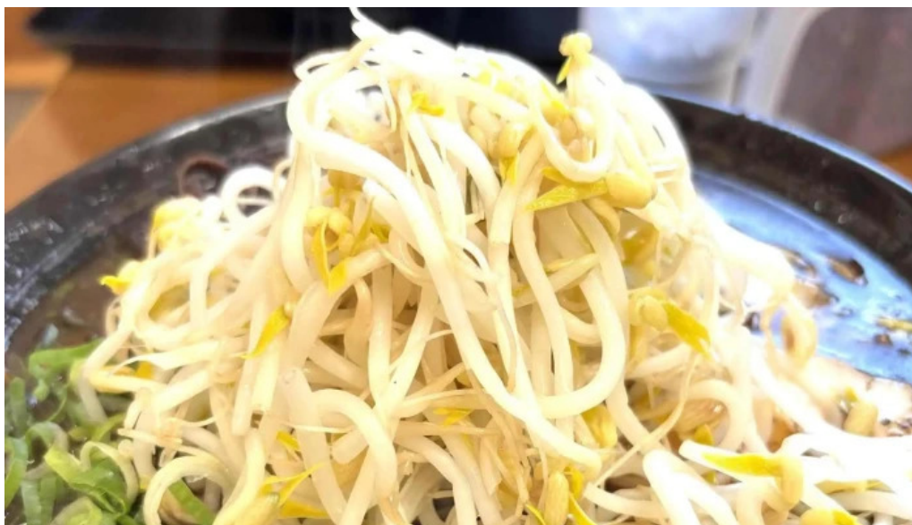
好来ラーメン ウェブサイト