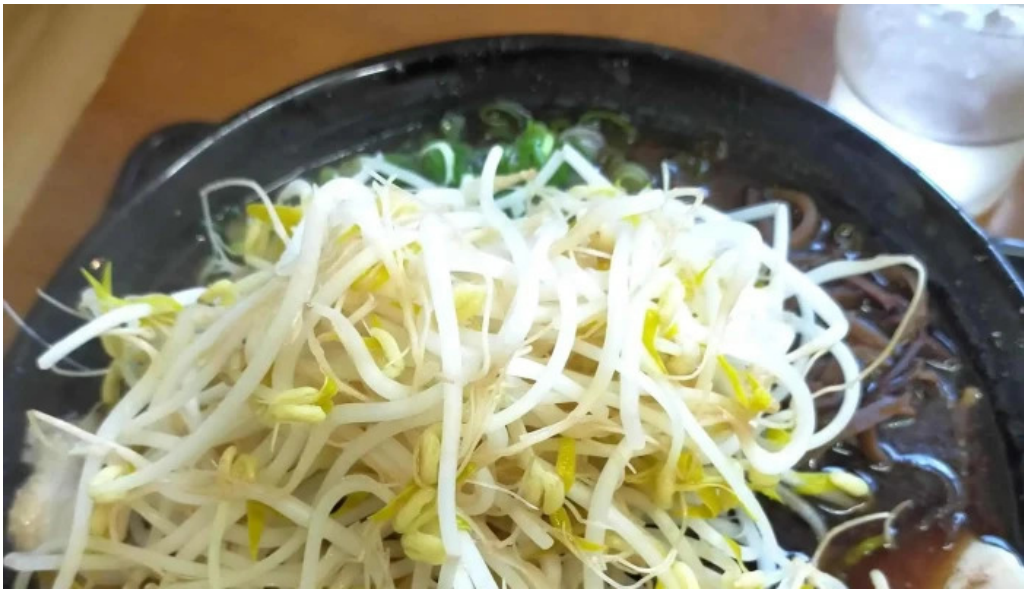
好来ラーメン 料金