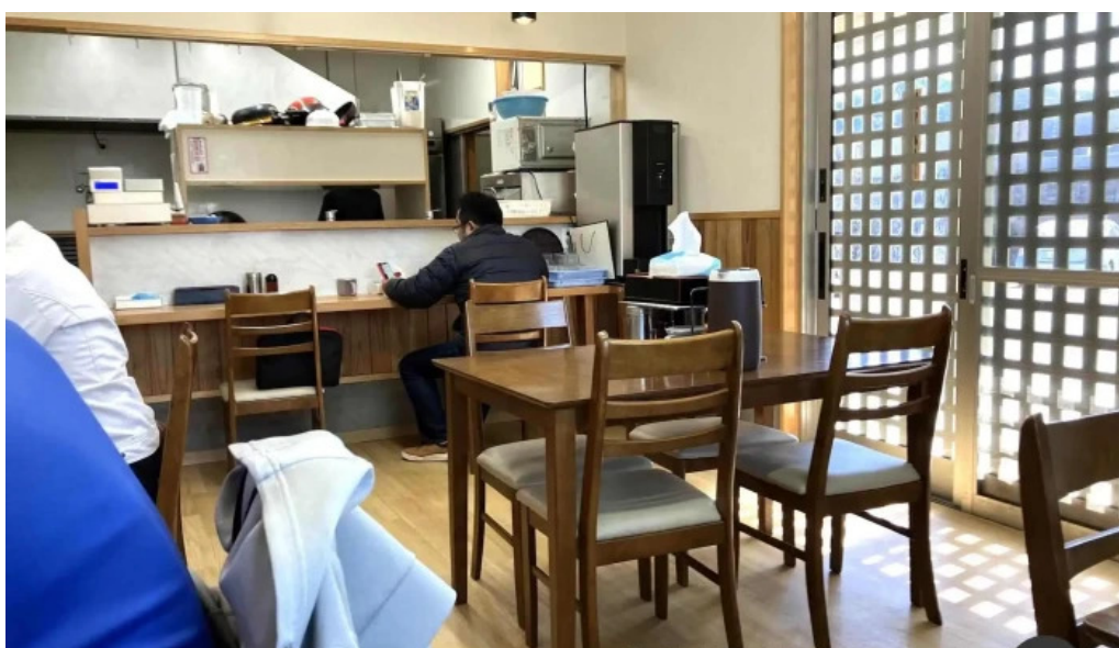
好来ラーメン 霧囲気