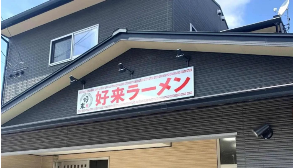
好来ラーメン 割引