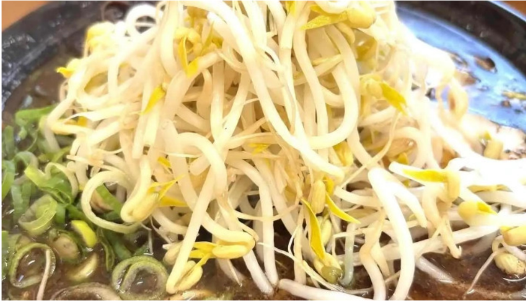
好来ラーメン 最新