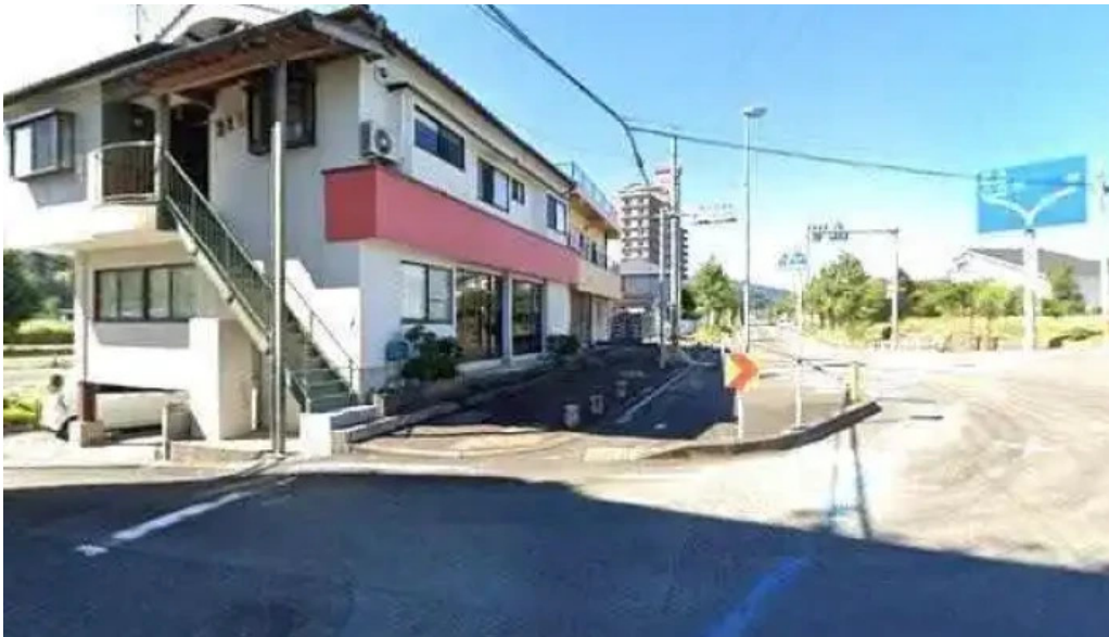
好来ラーメン 人吉市