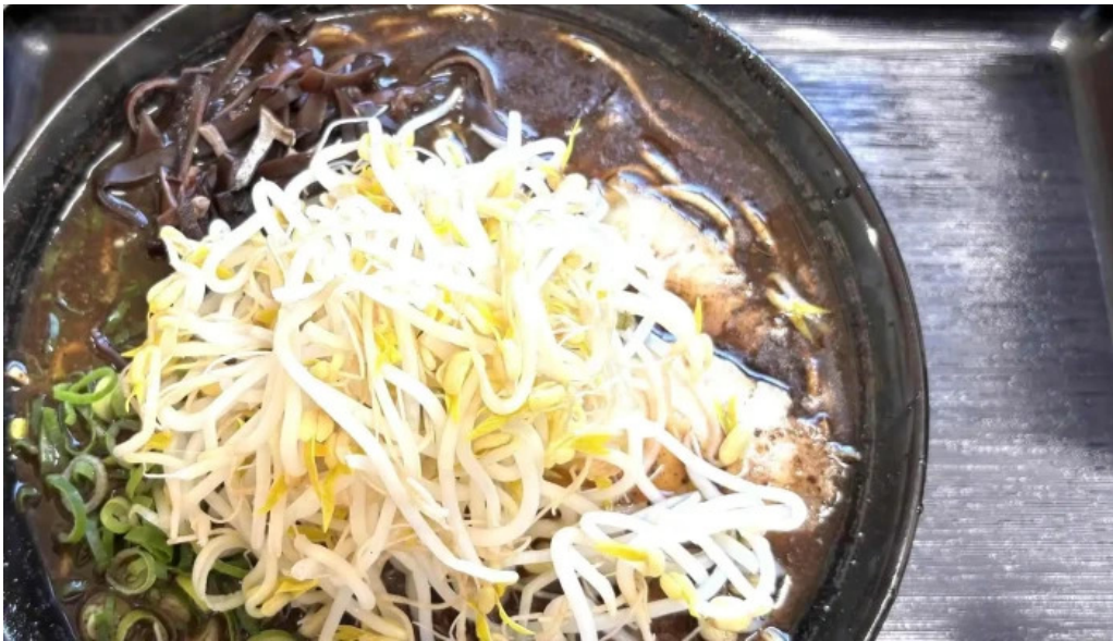
好来ラーメン 写真