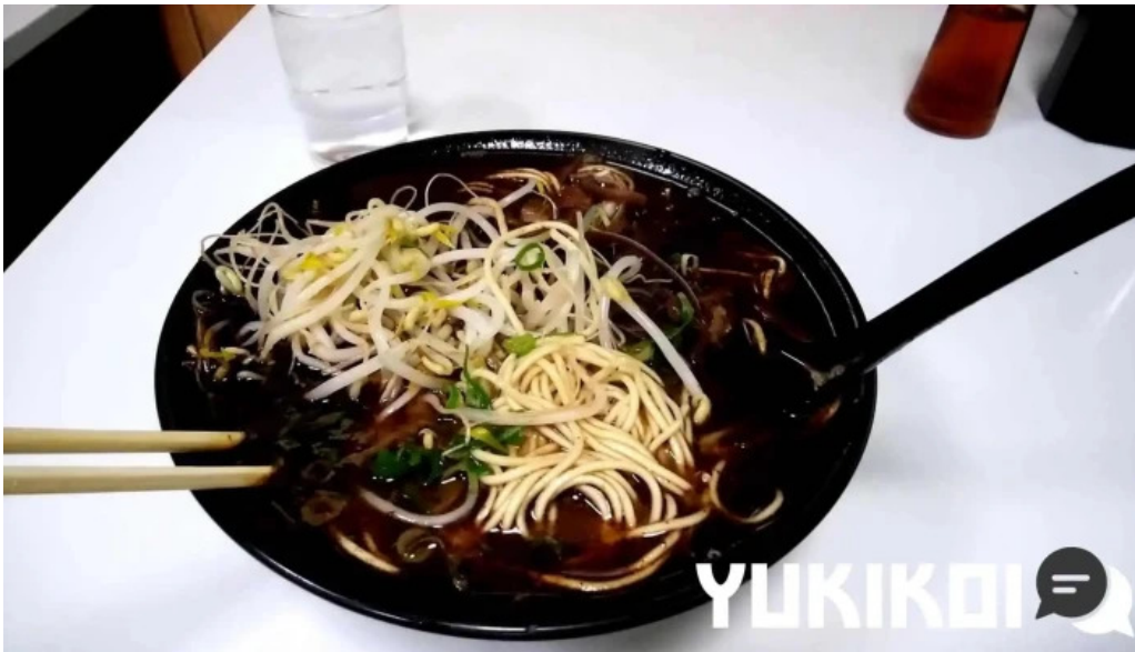
好来ラーメン ラーメン