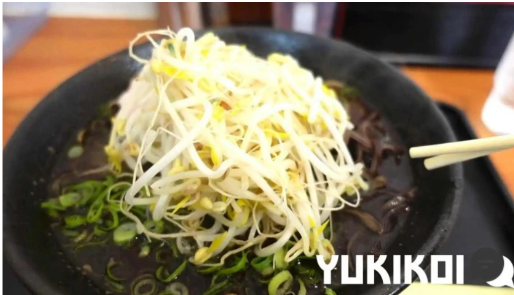
好来ラーメン 動画