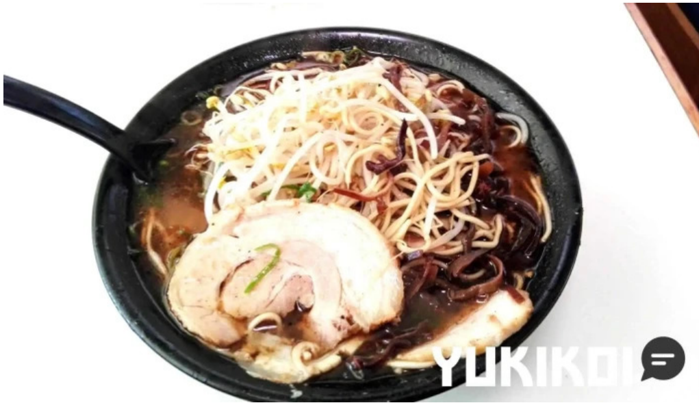
好来ラーメン 料理飲み物