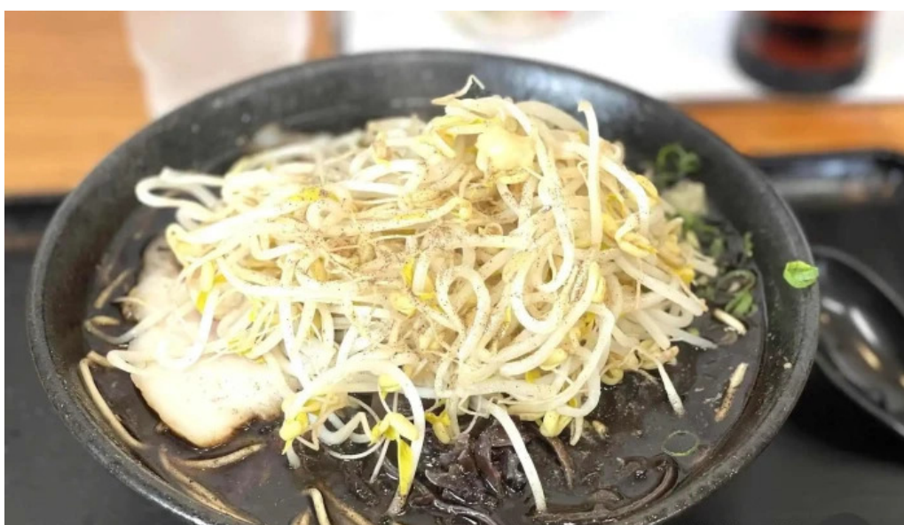
好来ラーメン 蕎麦