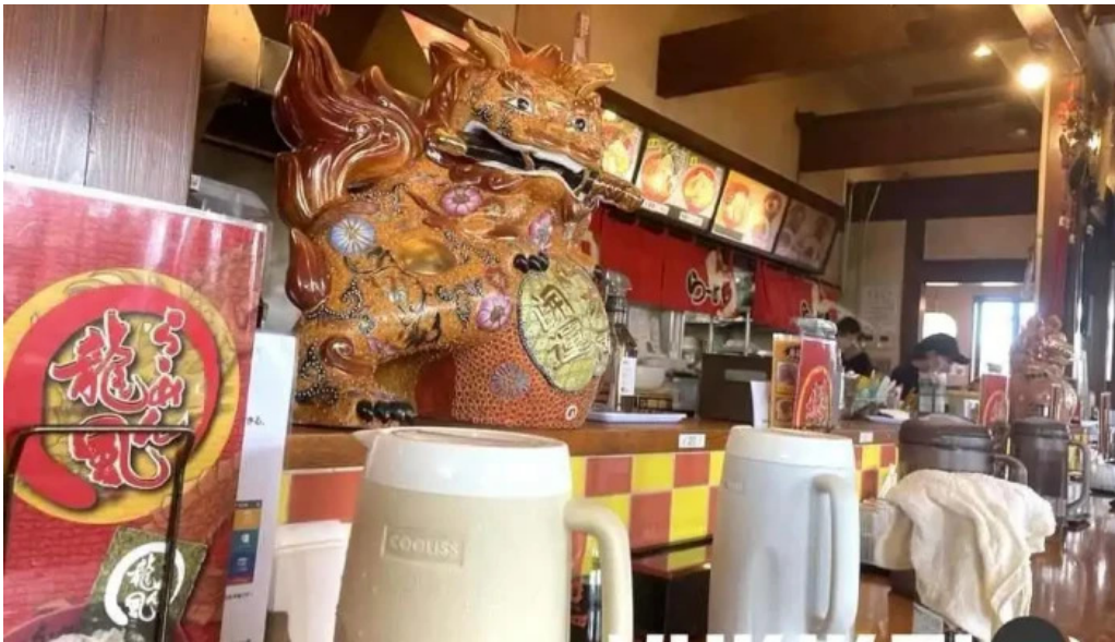
らーめん龍風 人吉店 雰囲気