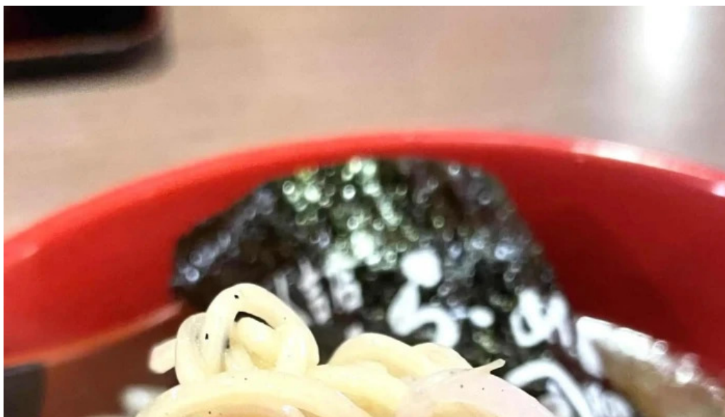
らーめん龍風 人吉店 ウェブサイト