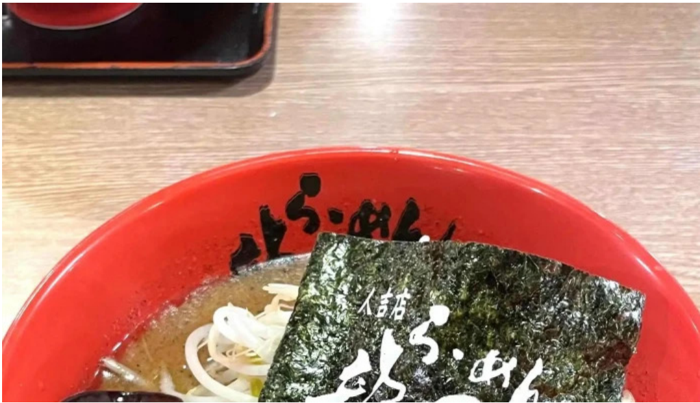
らーめん龍風 人吉店 人吉市