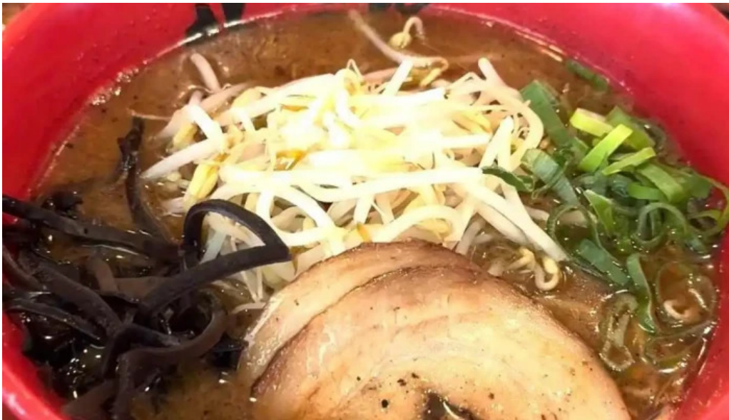
らーめん龍風 人吉店 動画