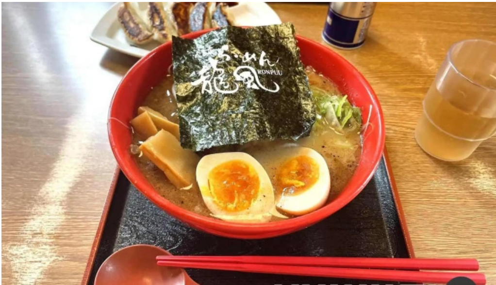
らーめん龍風 人吉店 ラーメン