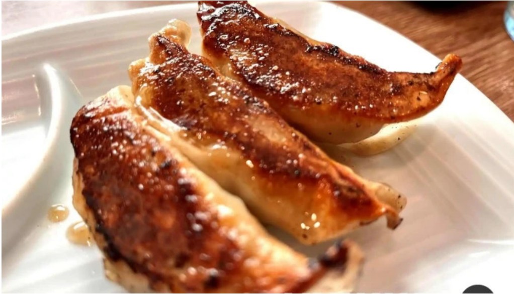
らーめん龍風 人吉店 料理飲み物