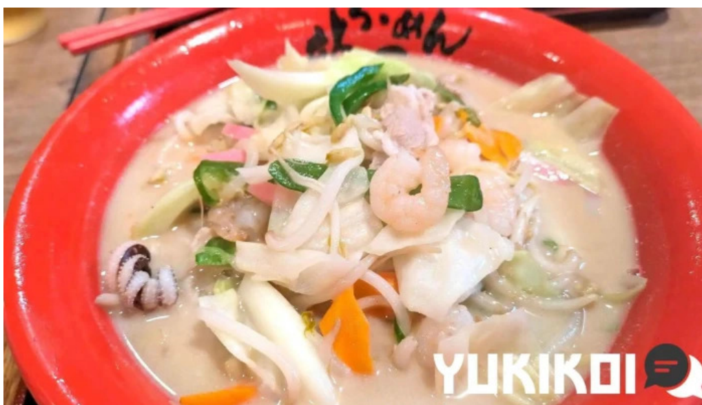
らーめん龍風 人吉店 ちゃんぽん