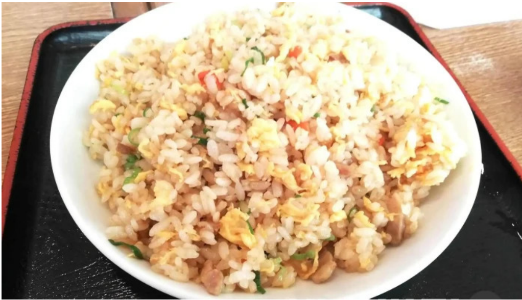
らーめん龍風 人吉店 焼き飯