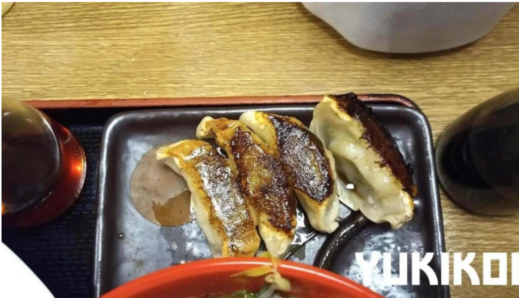
らーめん龍風 人吉店 餃子