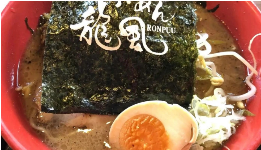
らーめん龍風 人吉店 口コミ