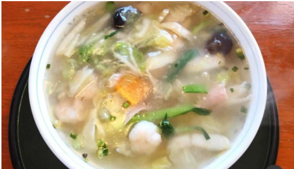
まつ笠 チキンスープ