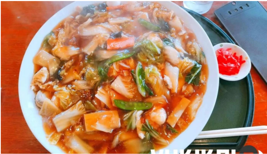
まつ笠 料理飲み物