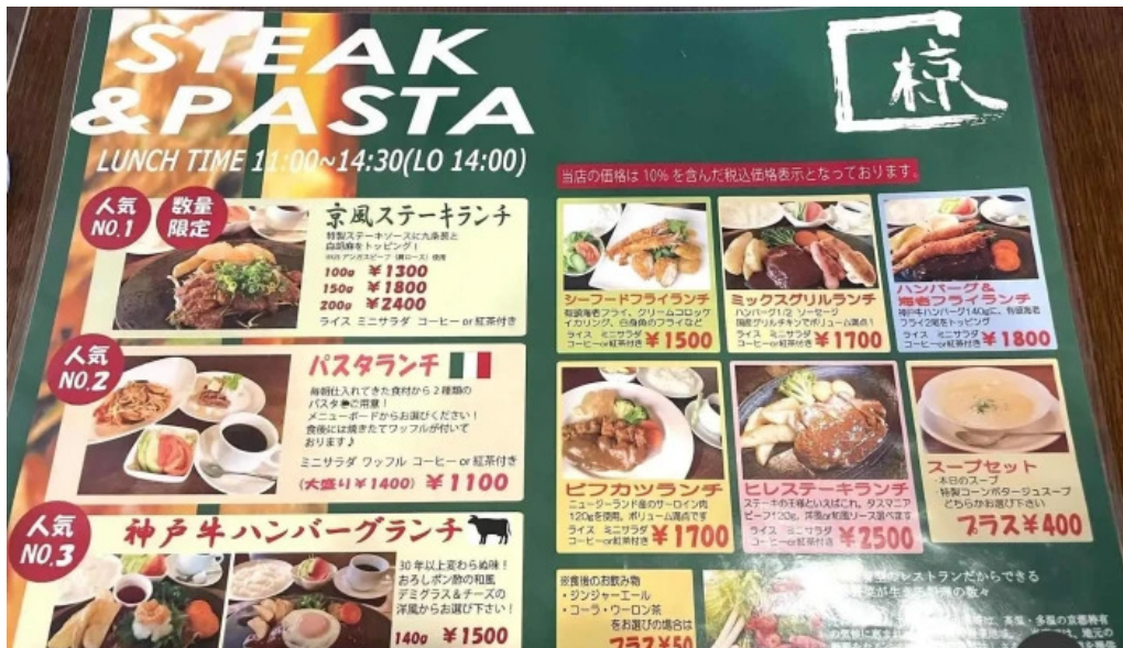
れすとらん 棕 メニュー