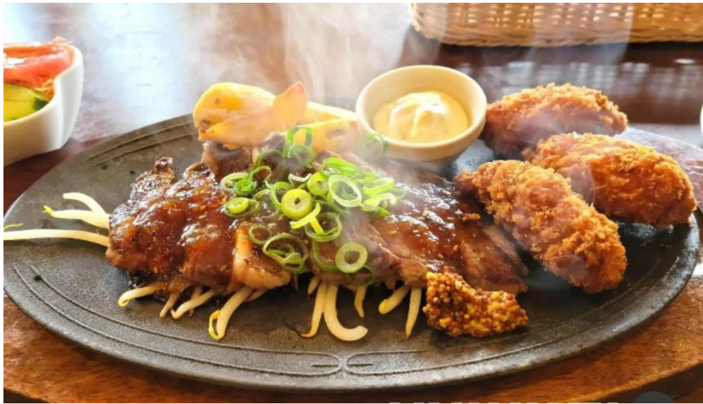
れすとらん 棕 ステーキ