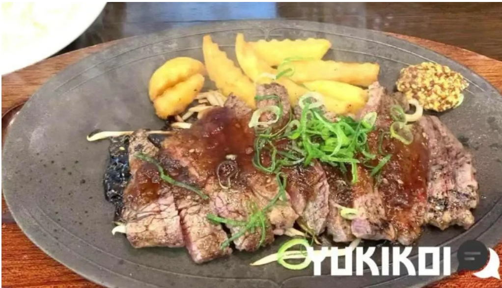
れすとらん 棕 動画