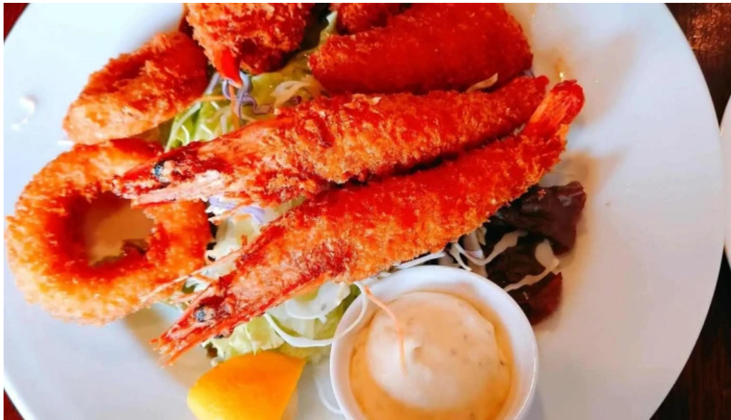
れすとらん 棕 カタログ