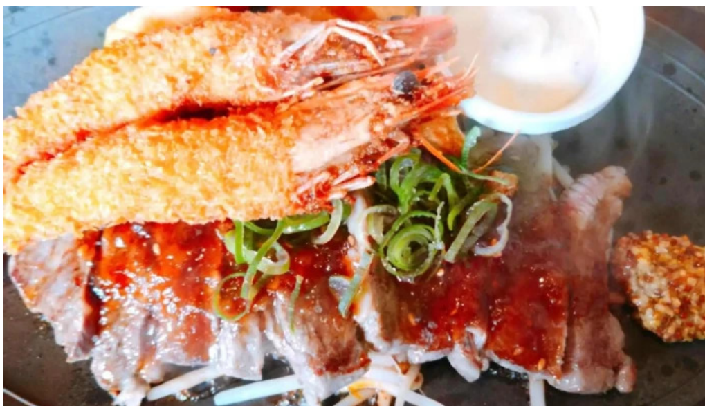
れすとらん 棕 エリア