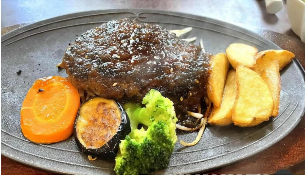
れすとらん 棕 料理飲み物