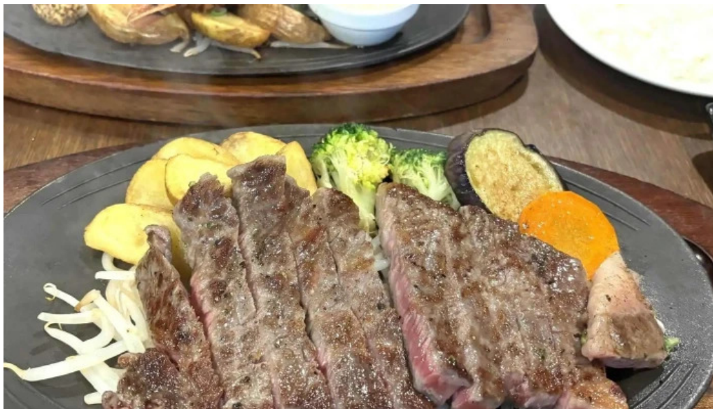
れすとらん 棕 電話