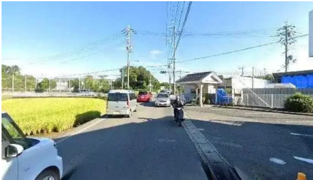
れすとらん 棕 京都市