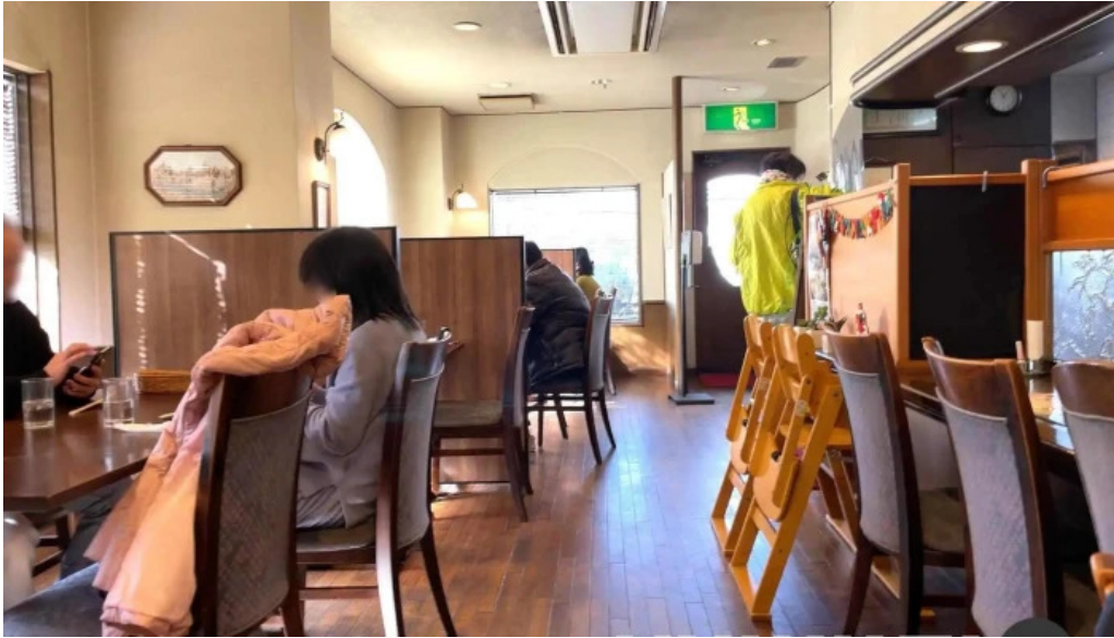
れすとらん 棕 雰囲気