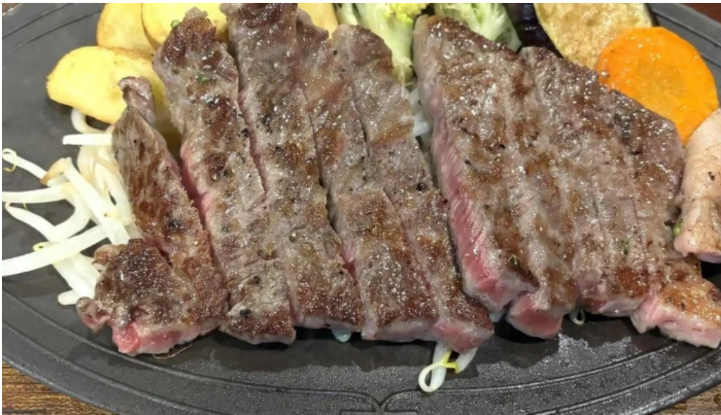
れすとらん 棕 住所