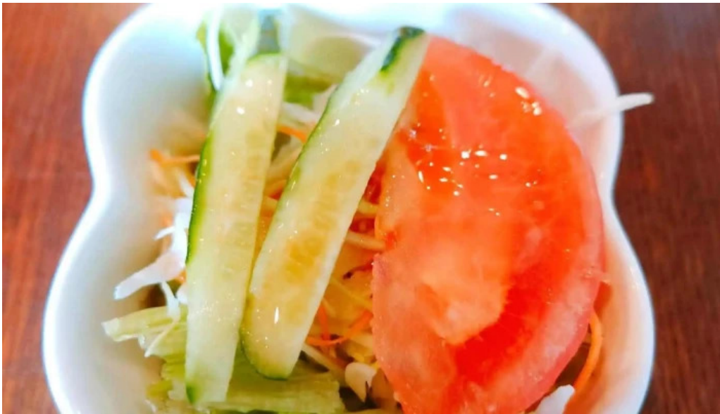
れすとらん 棕 料金