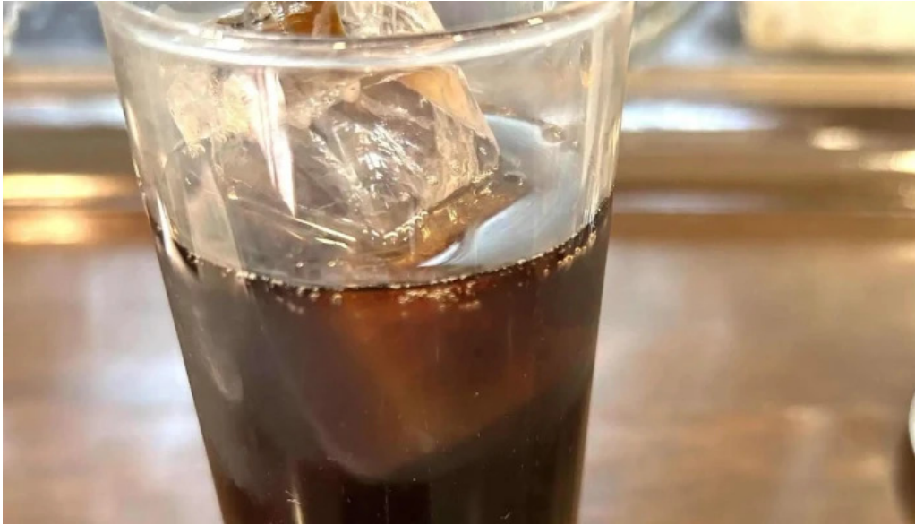
れすとらん 棕 割引