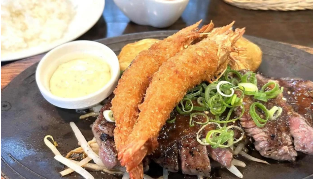
れすとらん 棕 口コミ