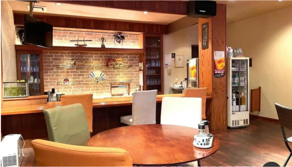
和飲ダイニング koganemushi 霧田気