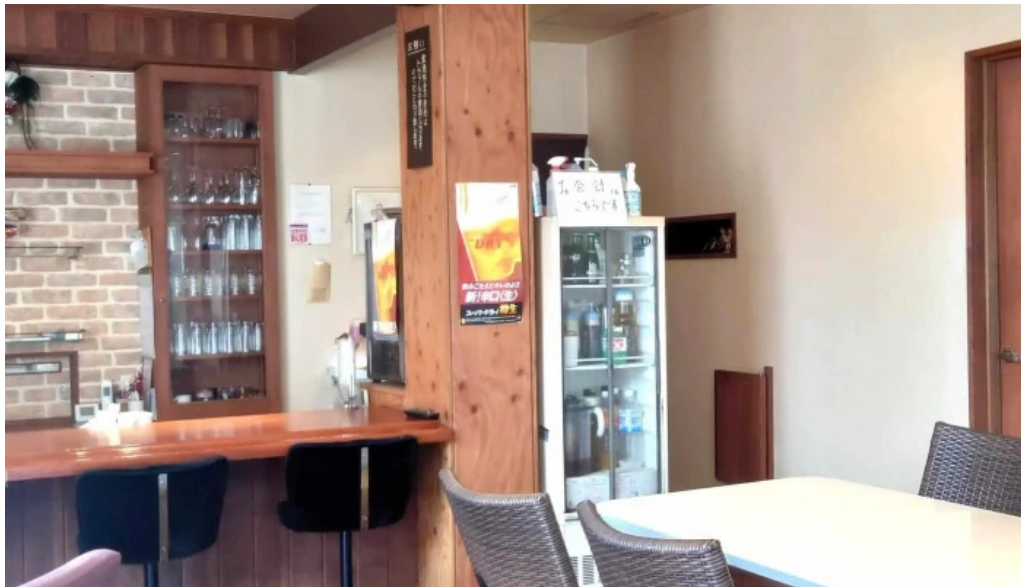
和飲ダイニング koganemushi comentario 8