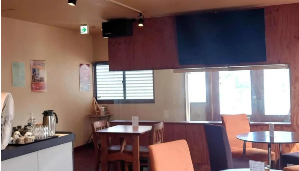
和飲ダイニング kogagemushi comentario 7