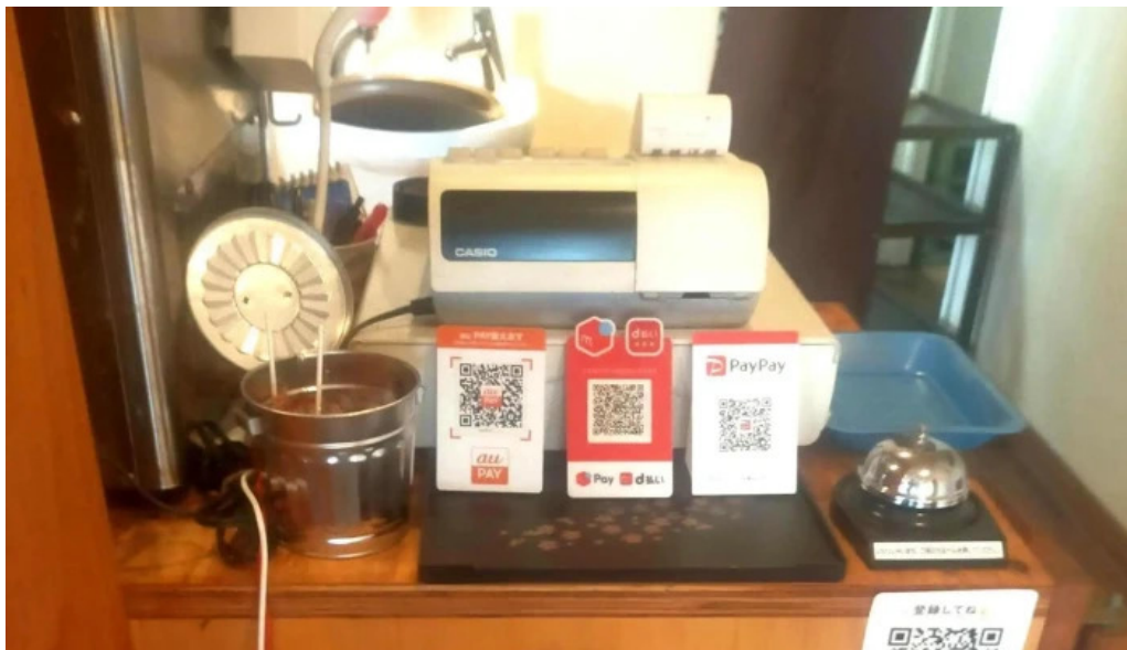
和飲ダイニング kogagemushi comentario 4