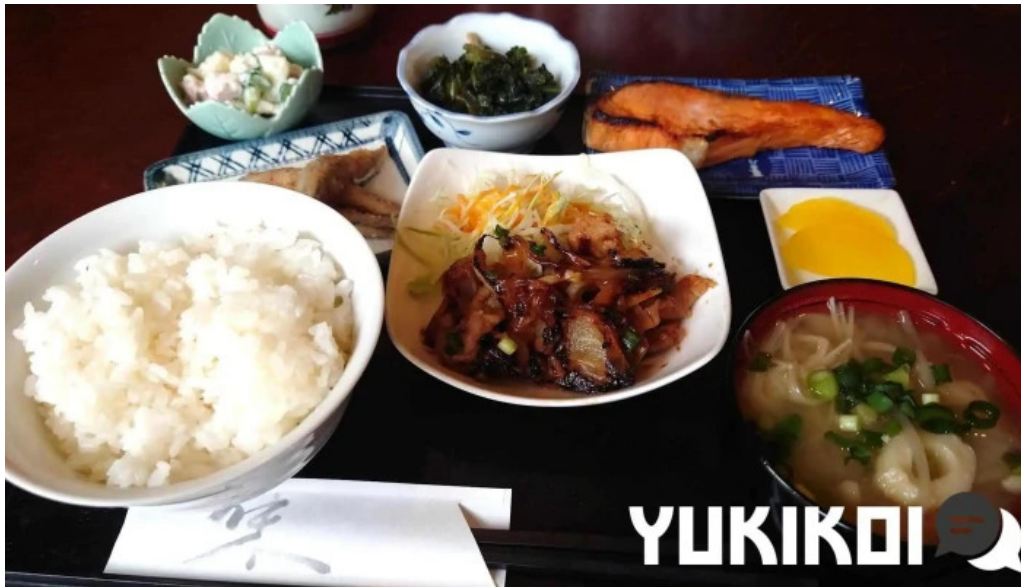
和飲ダイニング kogagemushi 料理飲み物