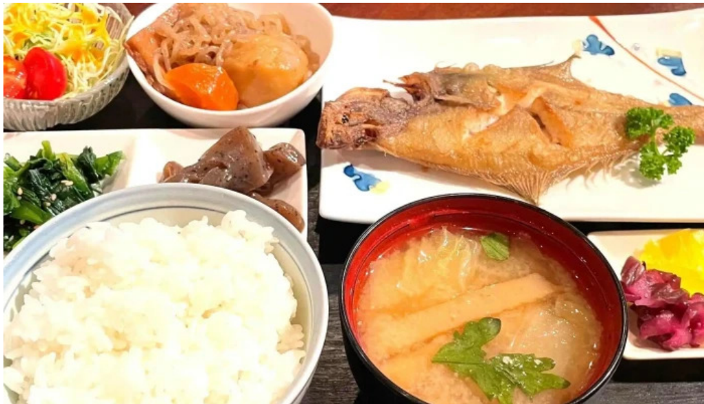
和飲ダイニング koganemushi comentario 9