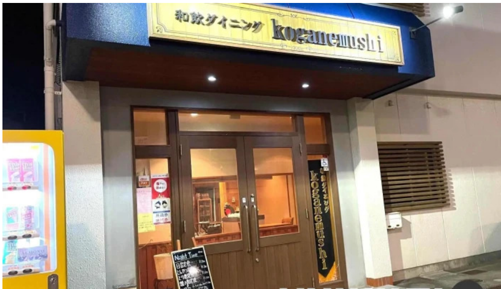
和飲ダイニング koganemushi すべて