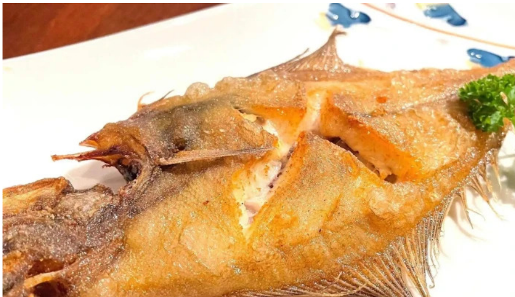
和飲ダイニング kogagemushi comentario 10