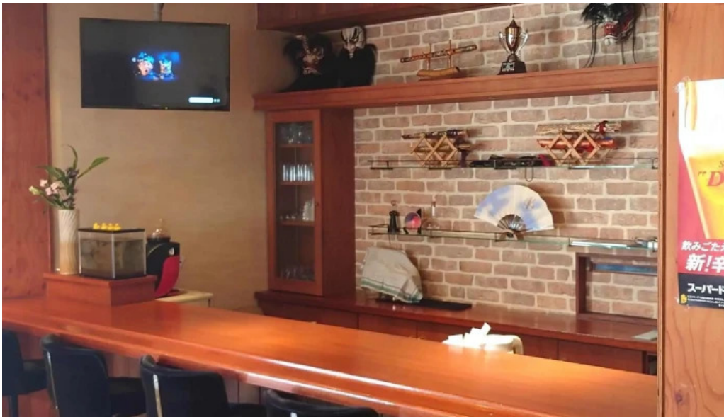
和飲ダイニング kogagemushi comentario 6