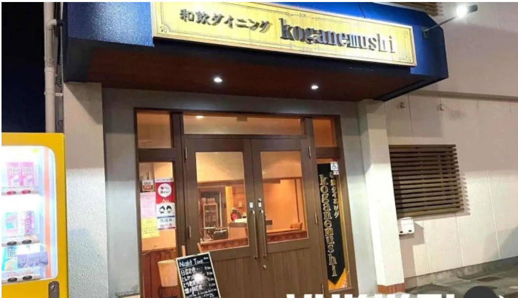
和飲ダイニング koganemushi 江津市