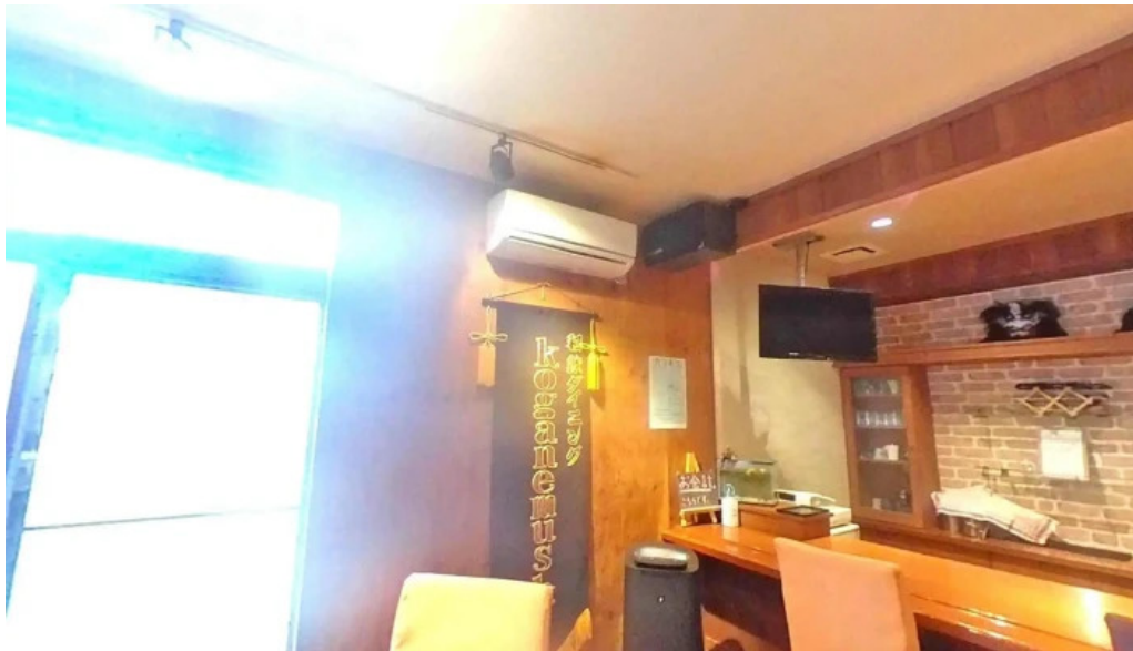
和飲ダイニング koganemushi ストリートビューと 360 ビュー