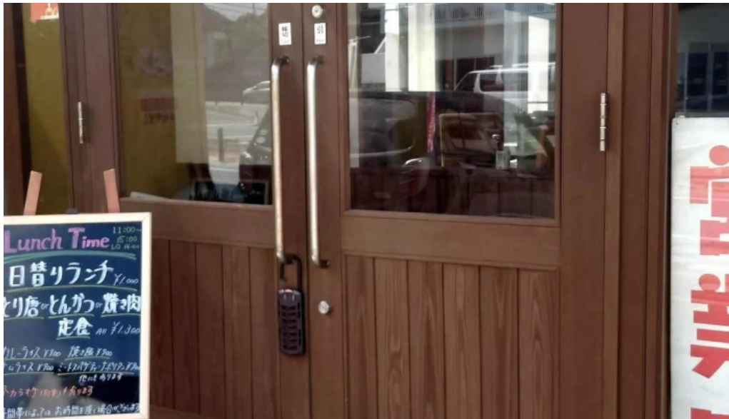
和飲ダイニング kogagemushi comentario 5