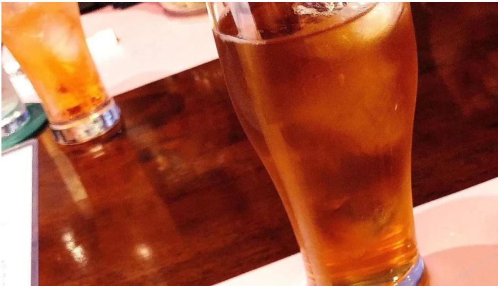
グラッツェ ディ クオーレ grazie di cuore 住所