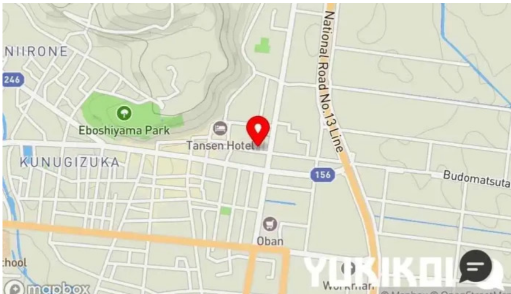
グラッツェ ディ クオーレ grazie di cuore 地図