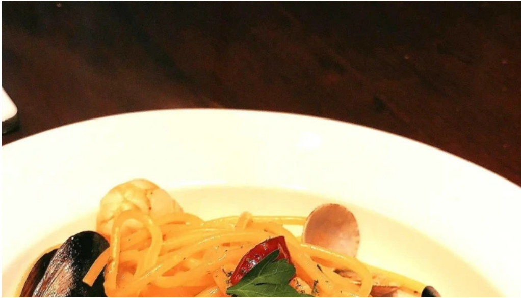
グラッツェ ディ クオーレ grazie di cuore 口コミ