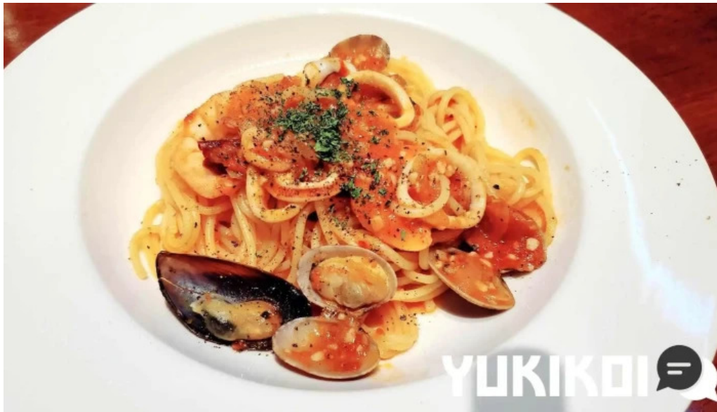
グラッツェ ディ クオーレ grazie di cuore スパゲッティ