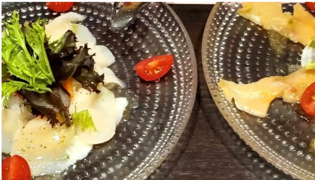
グラッツェ ディクオーレ grazie di cuore 近く