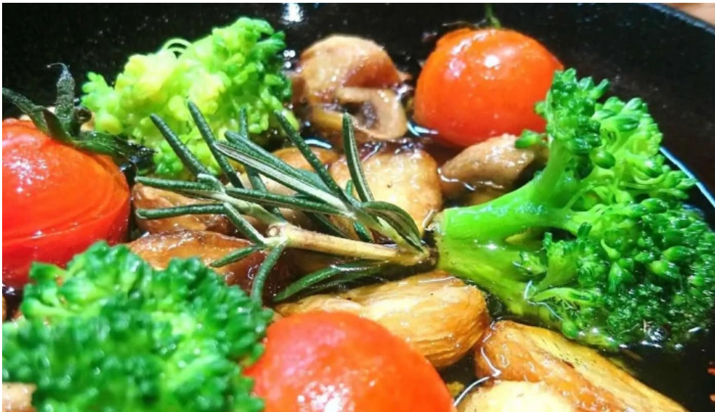
グラッツェ ディ クオーレ grazie di cuore 料理飲み物