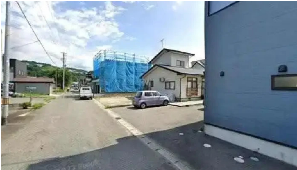
グラッツェ ディ クオーレ grazie di cuore 南陽市