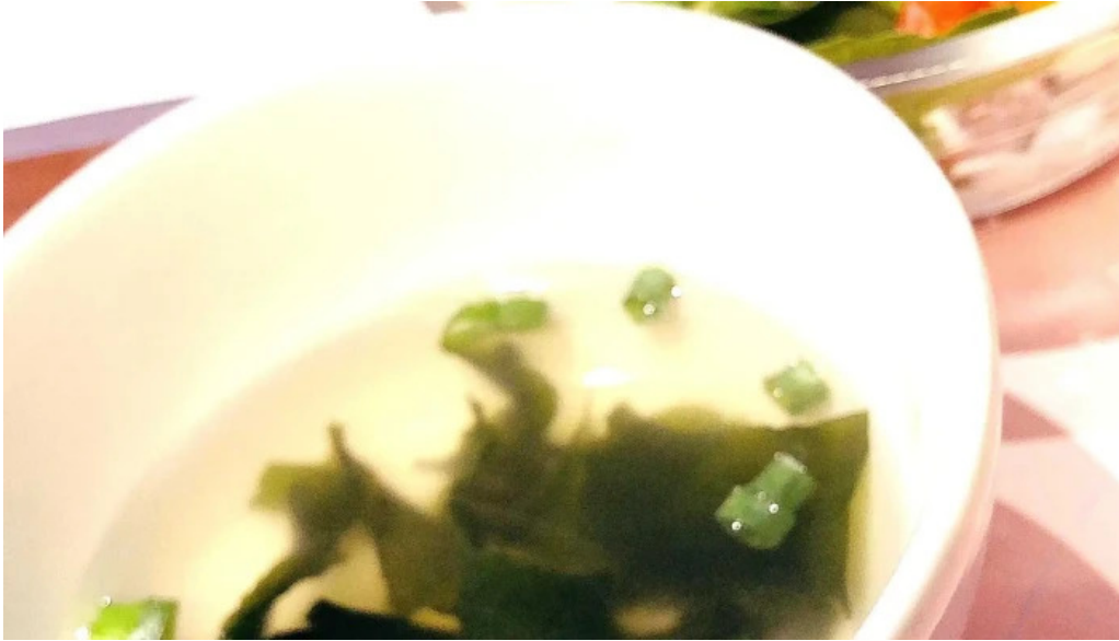
グラッツェ ディ クオーレ grazie di cuore 所在地