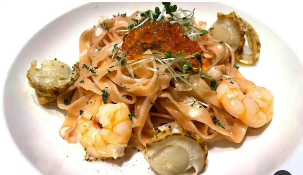
グラッツェ ディ クオーレ grazie di cuore 麵