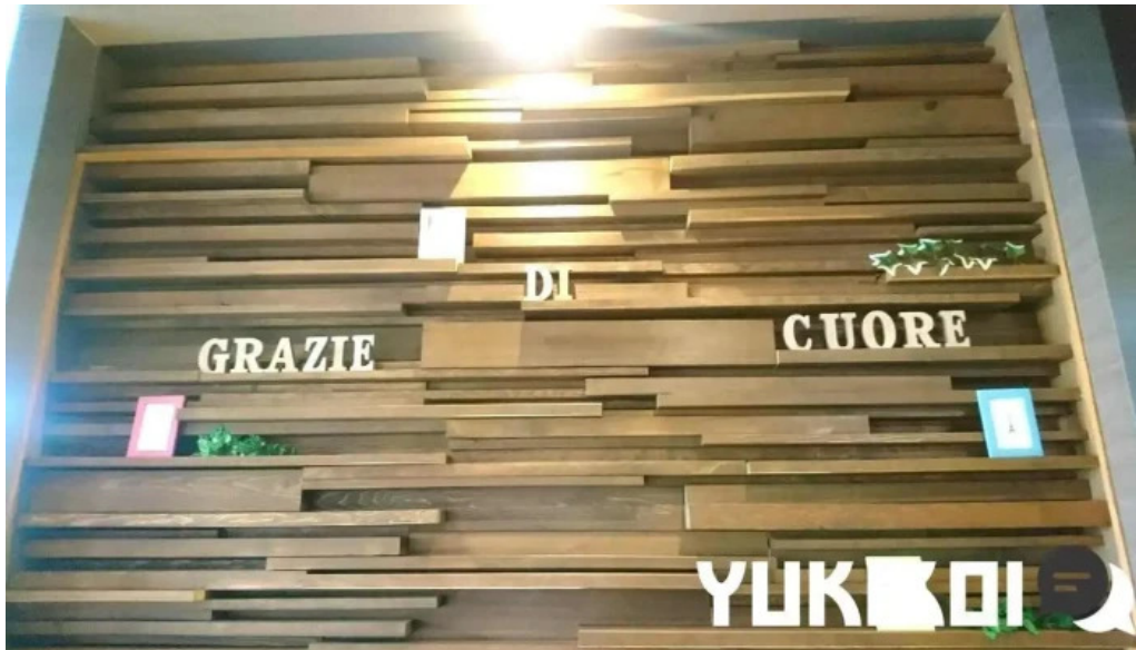
グラッツェ ディ クオーレ grazie di cuore