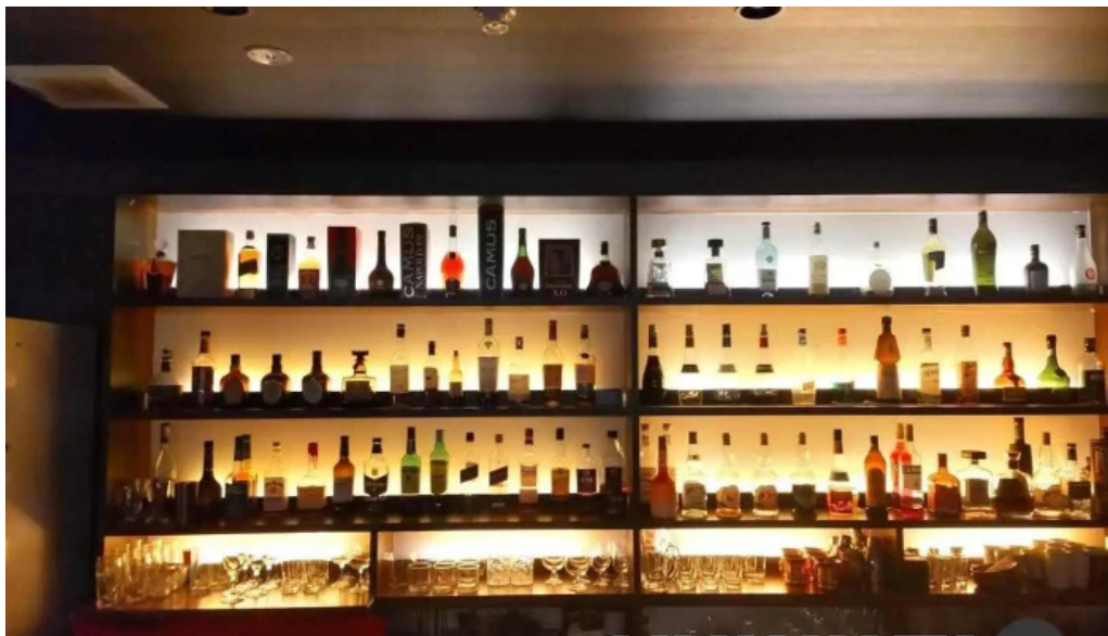
グラッツェ ディクオーレ (grazie di cuore) 南陽市