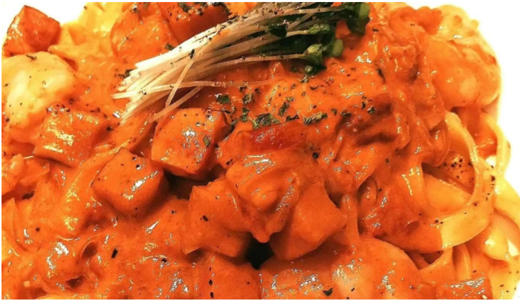
グラッツェ ディ クオーレ grazie di cuore 番号