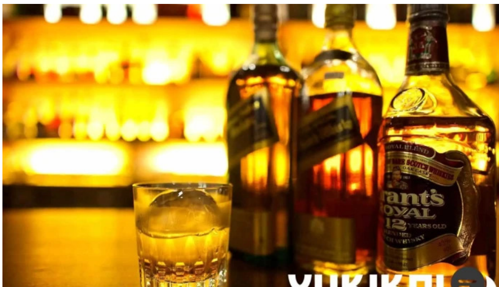
グラッツェ ディクオーレ grazie di cuore ウイスキー