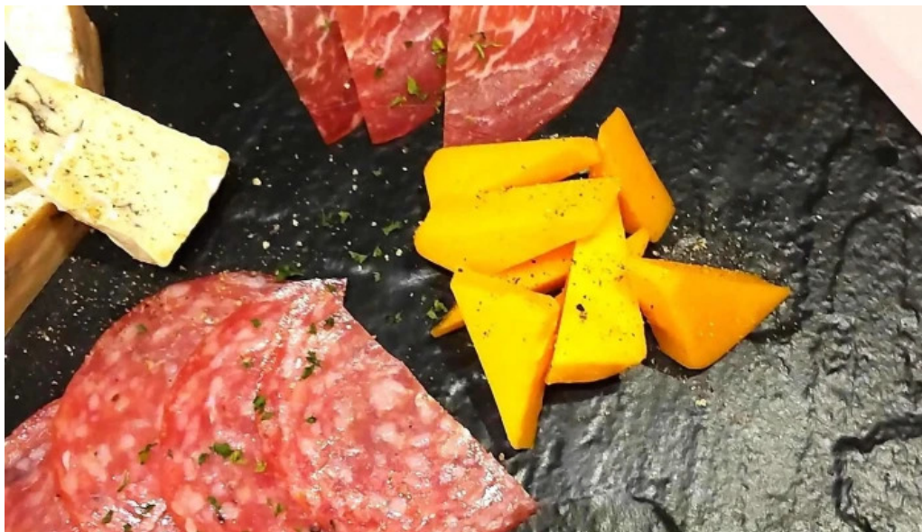
グラッツェ ディ クオーレ grazie di cuore 電話