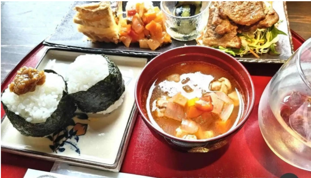
りんどう 料理飲み物