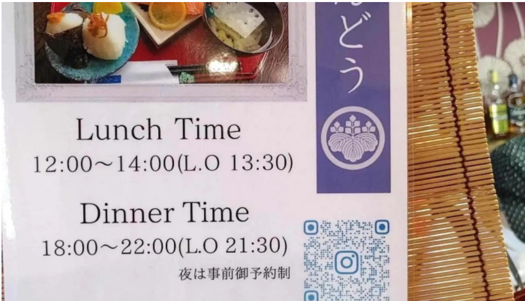
りんどう メニュー