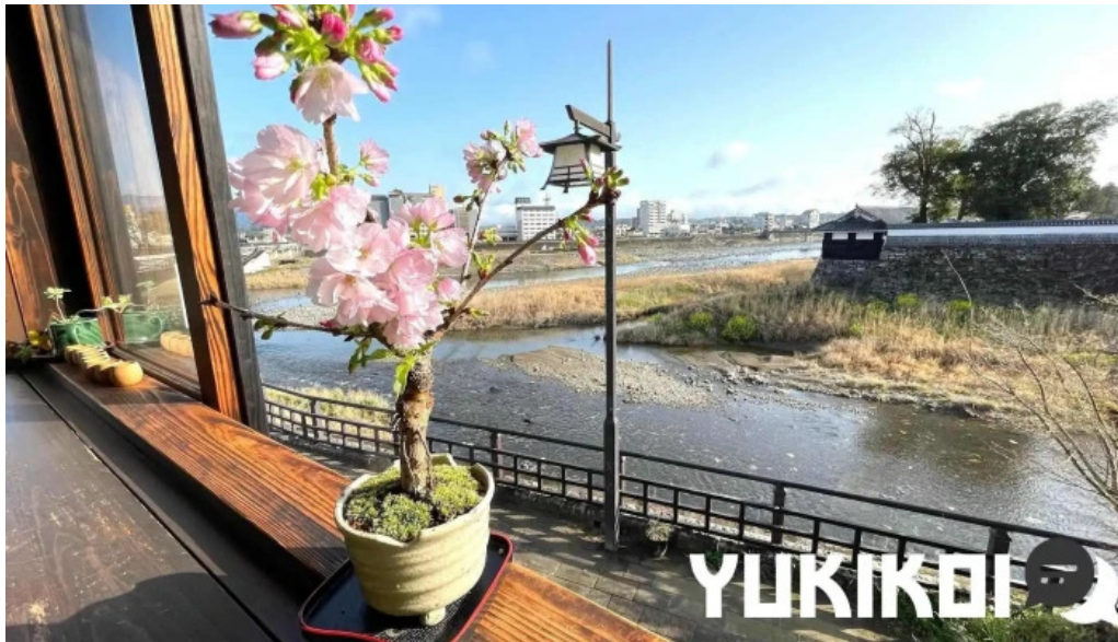
りんどう