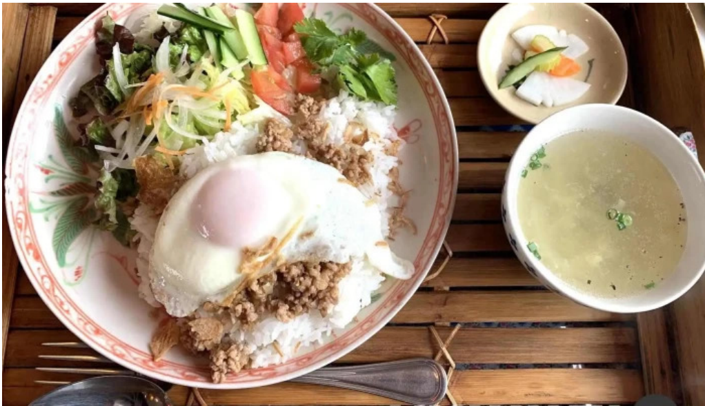
ベトナムレストランアンデップ スープ