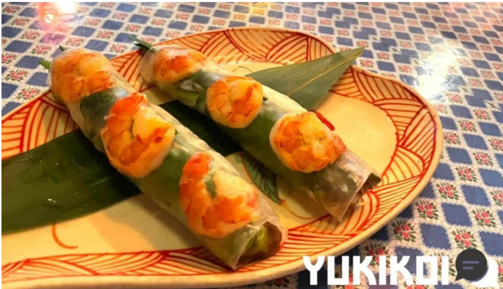
ベトナムレストランアンデップ 料理飲み物