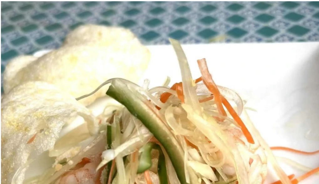
ベトナムレストランアンデップ 動画