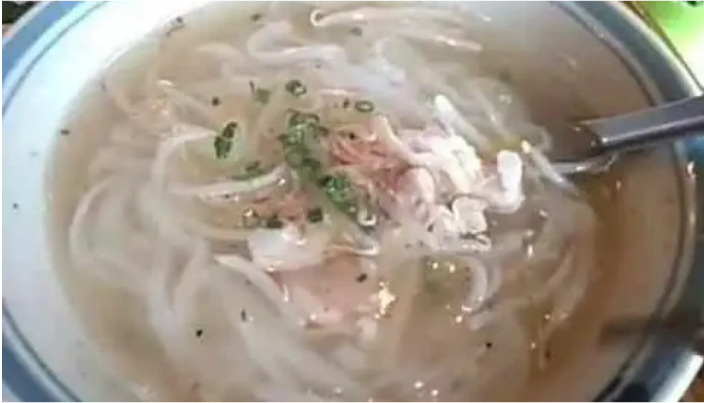
ベトナムレストランアンデップ 麺