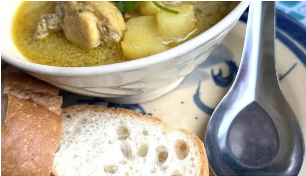
ベトナムレストランアンデップ チキンスープ