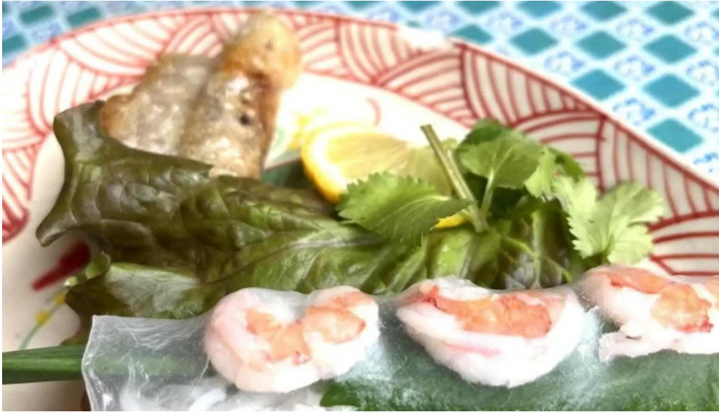
ベトナムレストランアンデップ 春巻き