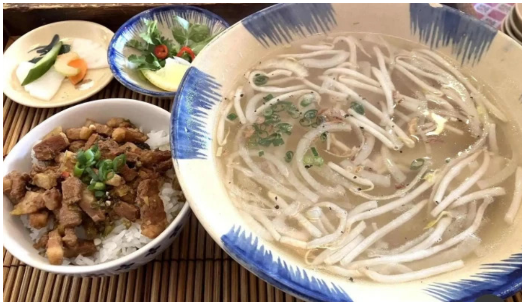
ベトナムレストランアンデップ フォー