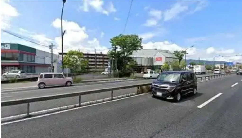
ベトナムレストランアンデップ 草津市