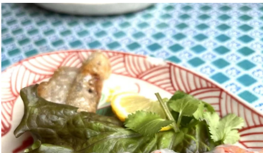
ベトナムレストランアンデップ instagram