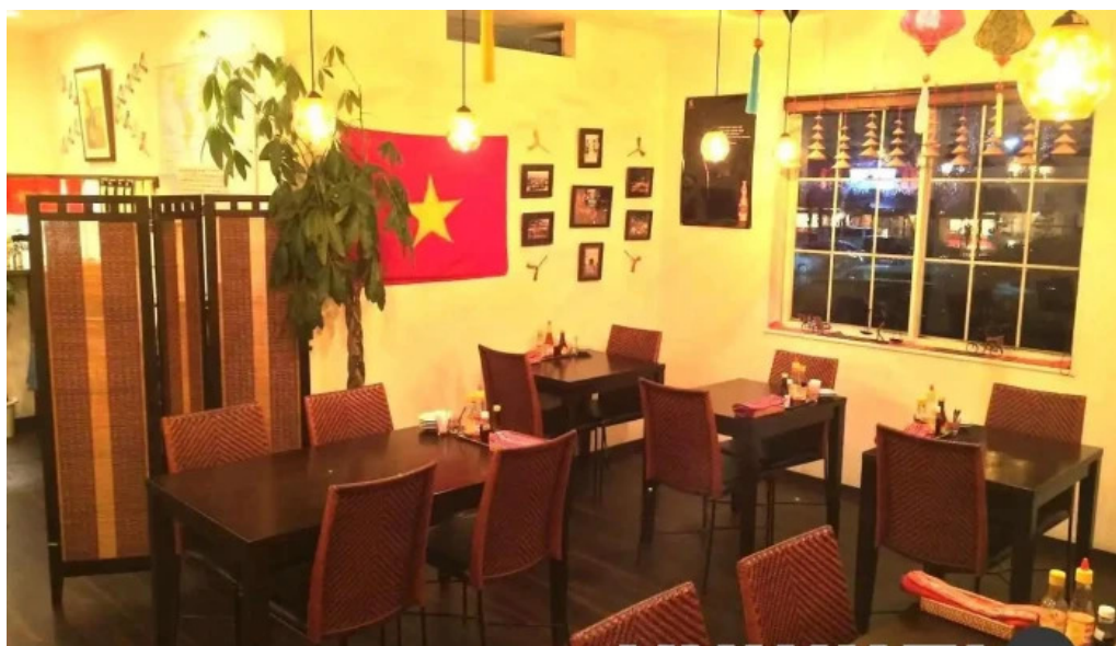
ベトナムレストラン・アンデップ 草津市