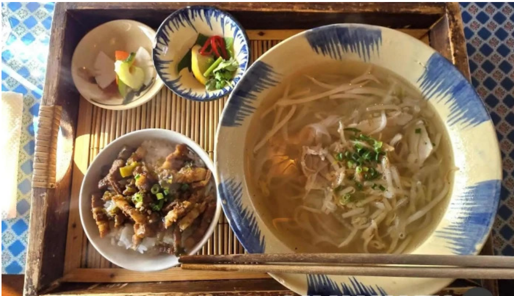
ベトナムレストランアンデップ 最新