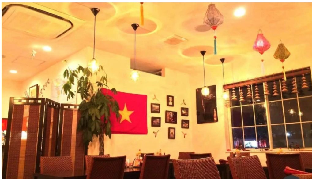
ベトナムレストランアンデップ オーナー提供