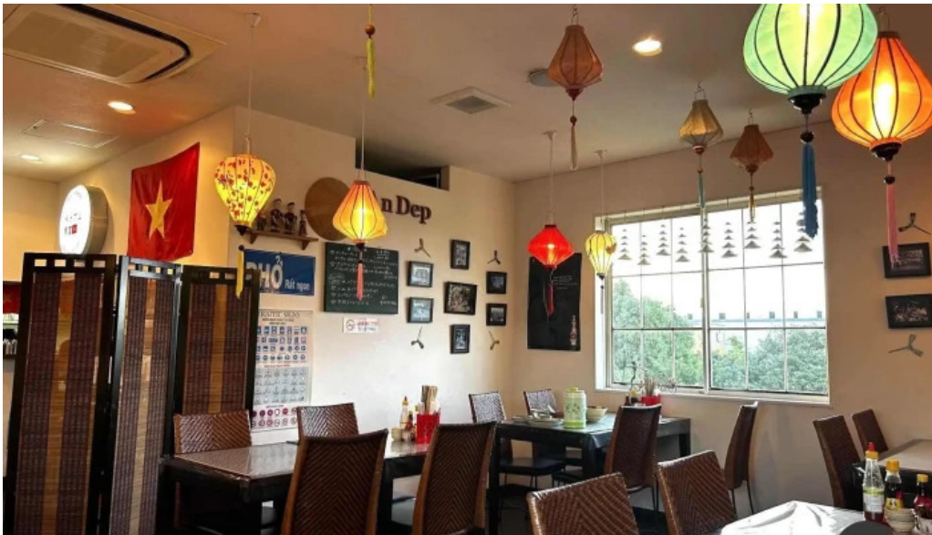
ベトナムレストランアンデップ 雰囲気