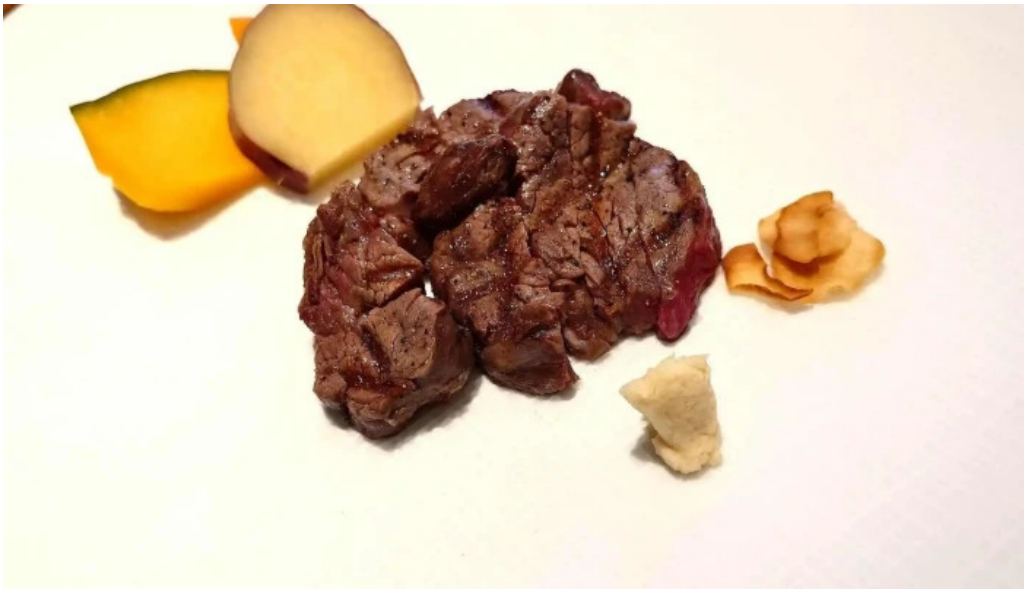
四季 ウェブサイト