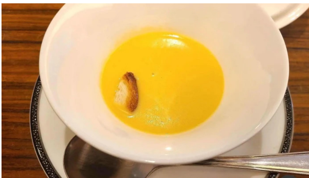
四季 かぼちゃスープ