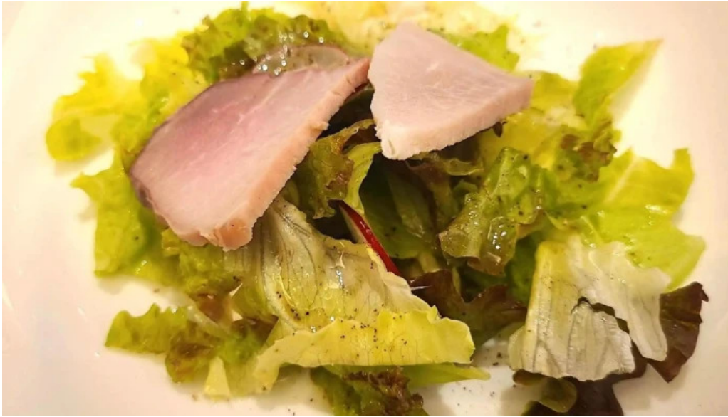
四季 プロモーション