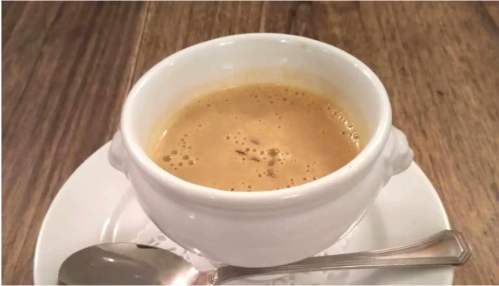
フレンチネオビストロ ラシック 近く