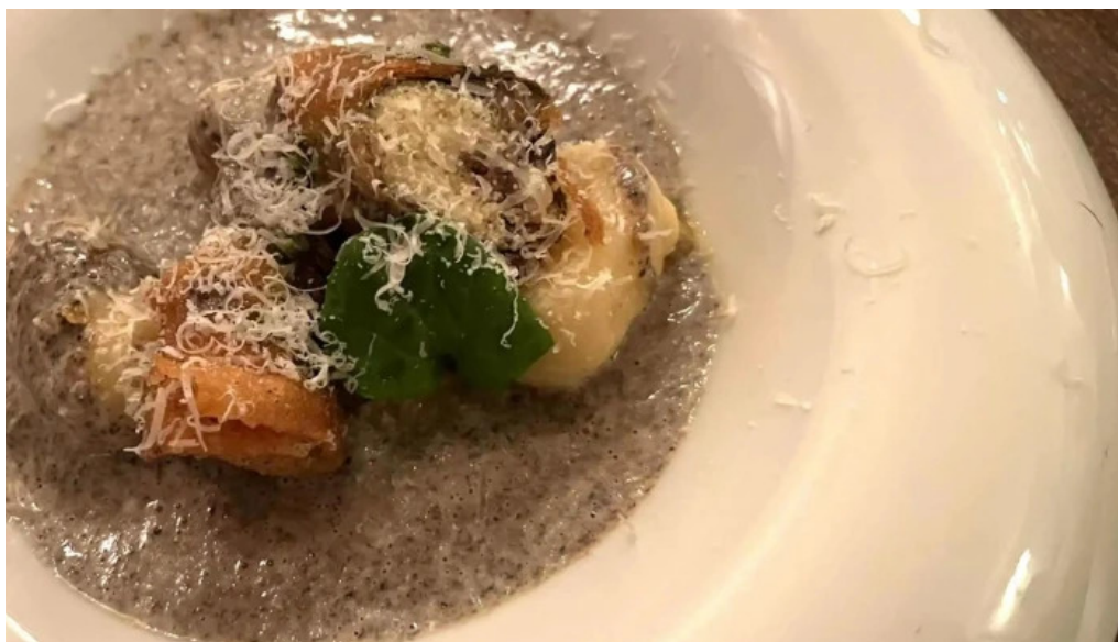
フレンチネオビストロ ラシック 住所