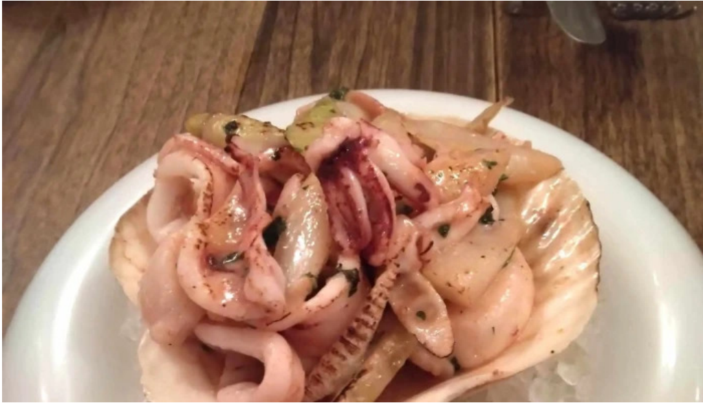
フレンチネオビストロ ラシック スコア