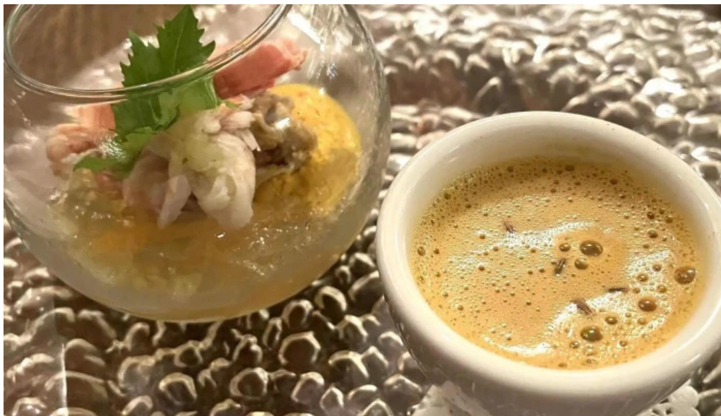
フレンチネオビストロ ラシック 営業時間