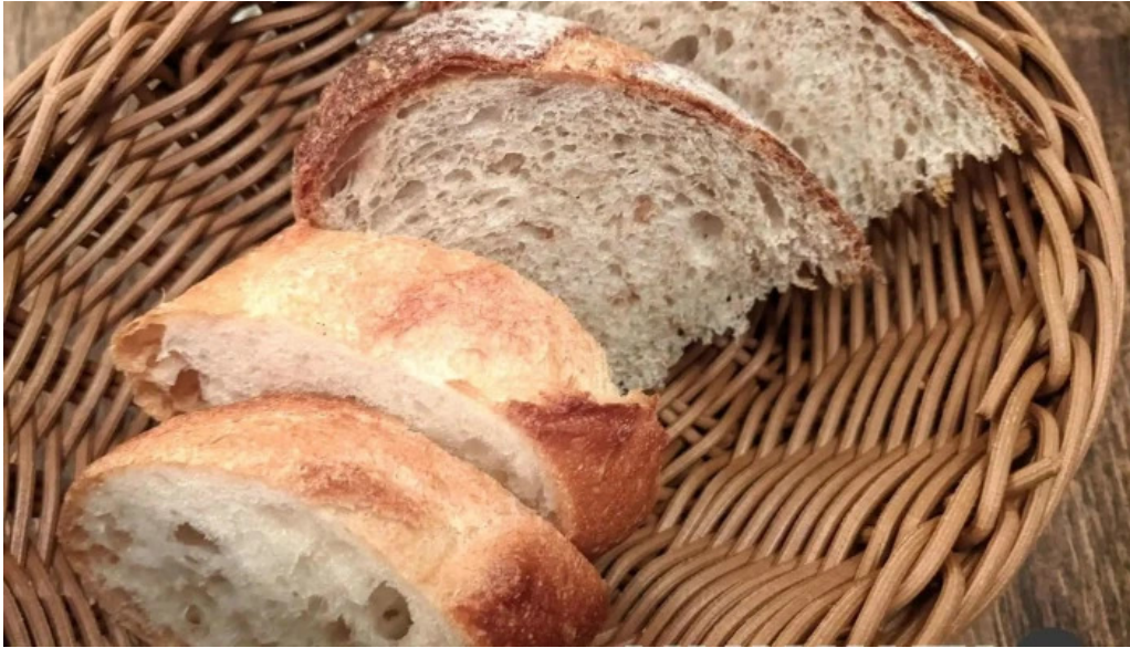
フレンチネオビストロ ラシック 料理飲み物