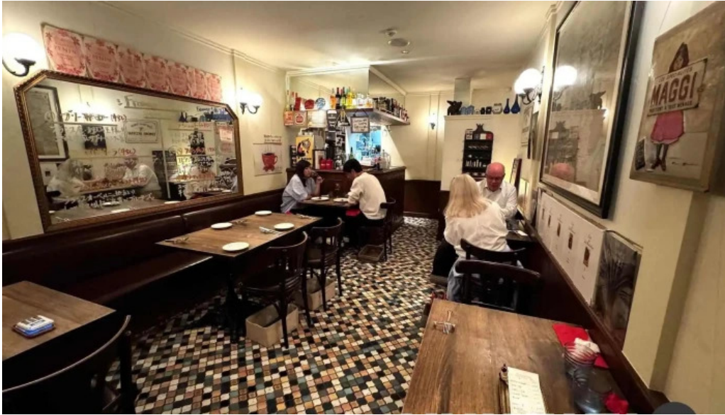
フレンチネオビストロ ラシック 霧岡気