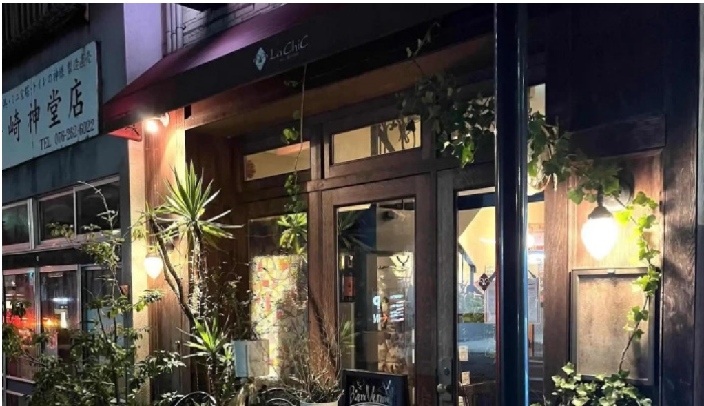
フレンチネオビストロ ラシック 番号