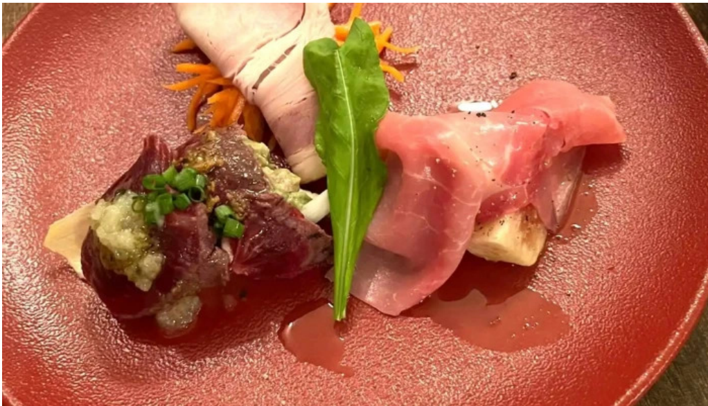
フレンチネオビストロ ラシック 所在地