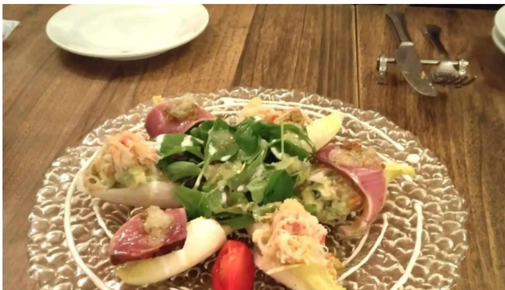
フレンチネオビストロ ラシック ウェブサイト