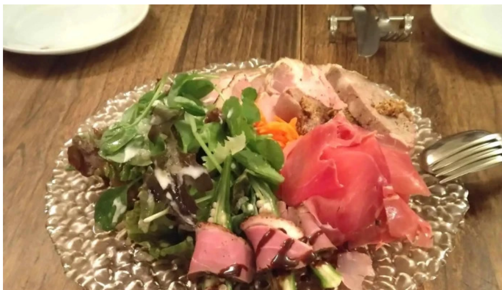
フレンチネオビストロ ラシック 電話