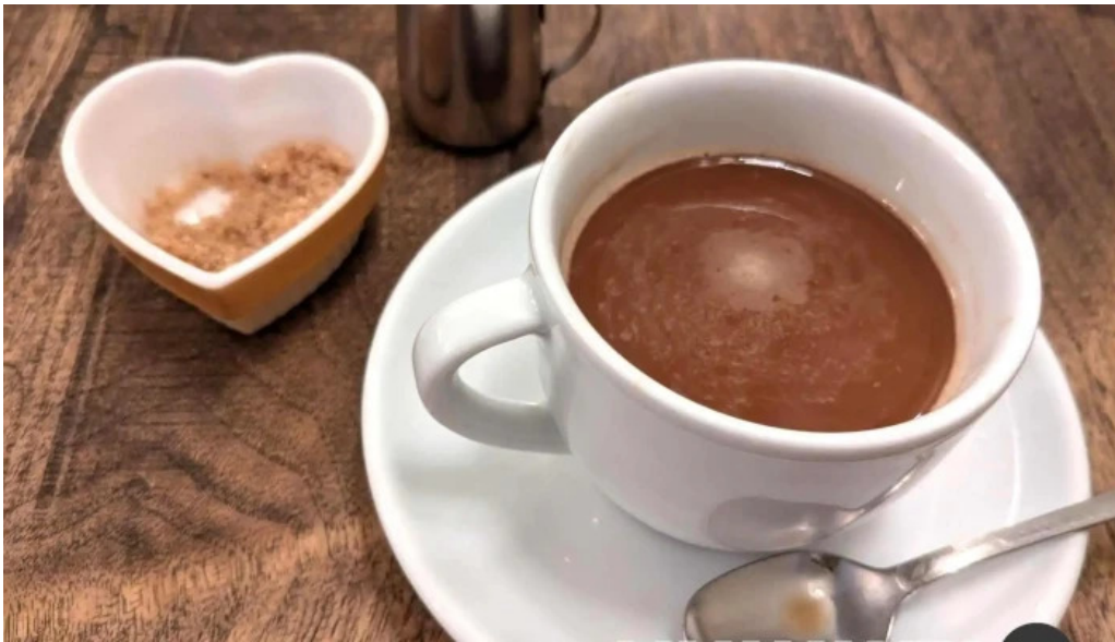
フレンチネオビストロ ラシック エスプレッソ