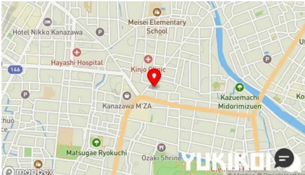
フレンチネオビストロ ラシック 地図