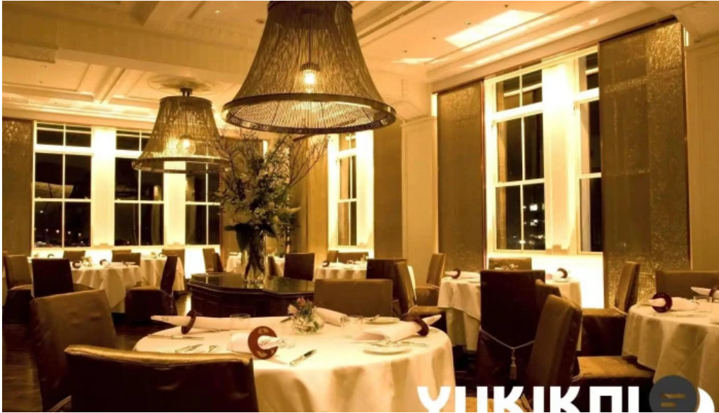
ジャルダン ポールボキューズ オーナー提供