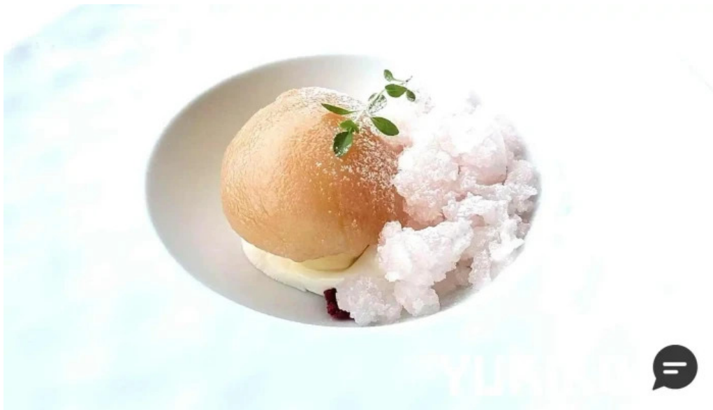
ジャルダン ポールボキューズ 動画