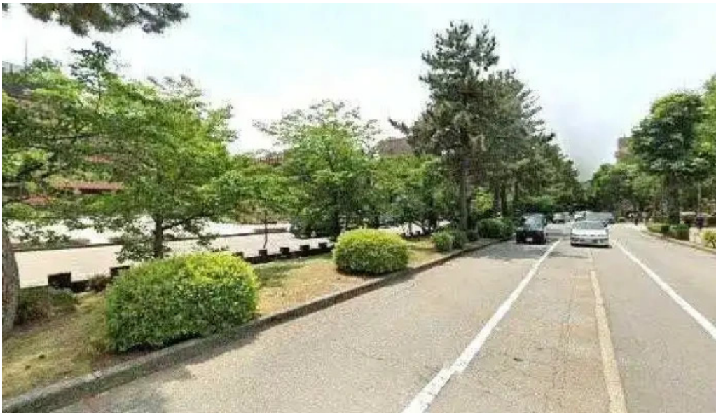
ジャルダン ポールボキューズ 金沢市