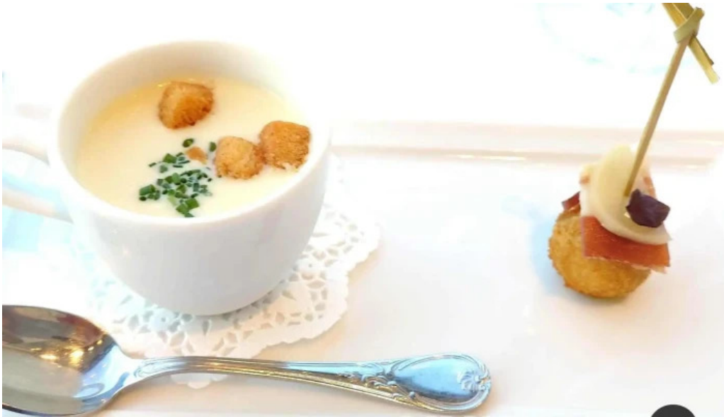
ジャルダン ポールボキューズ スープ