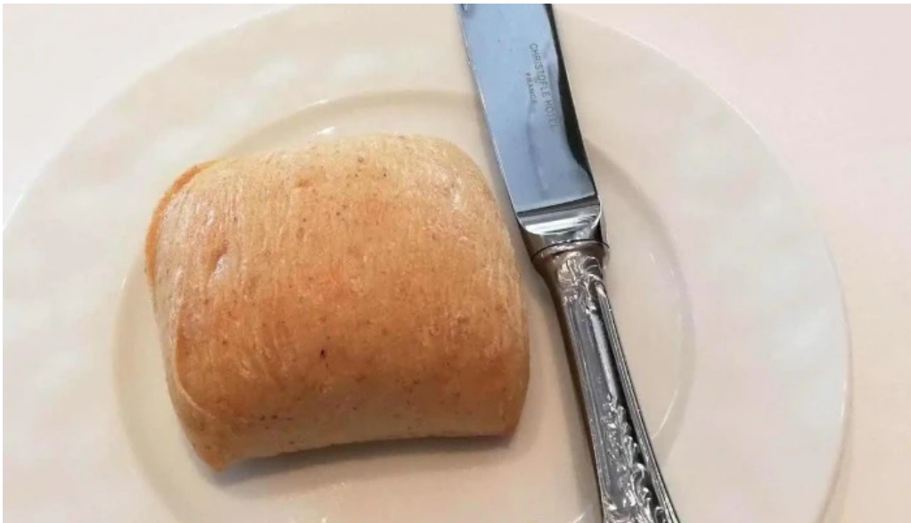
ジャルダン ポールボキューズ チャバッタ