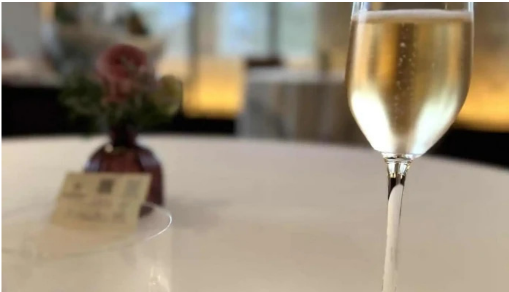
ジャルダン ポールボキューズ シャンパン