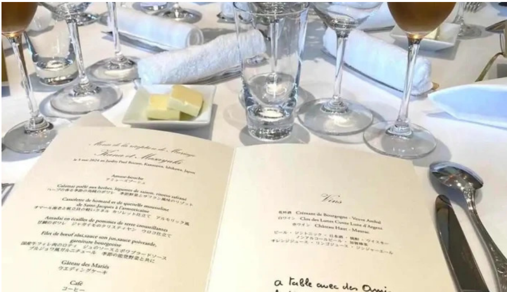
ジャルダン ポールボキューズ 最新