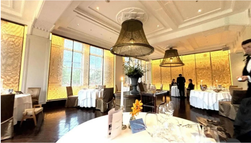
ジャルダン ポールボキューズ 雰囲気