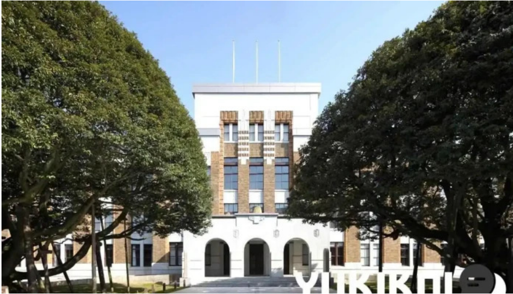
ジャルダン ポールボキューズ 石川県政記念しいのき迎賓館旧石川県庁舎本館