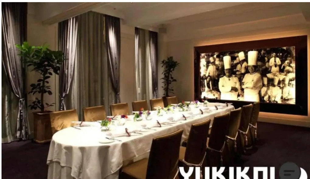
ジャルダン ポール・ボキューズ 金沢市