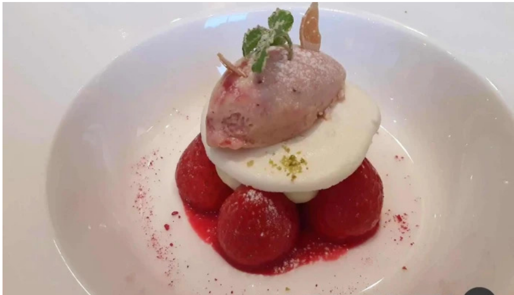
ジャルダン ポールボキューズ パンナコッタ