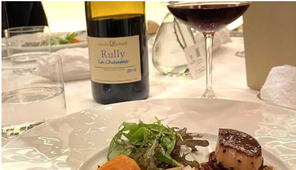
ジャルダン ポールボキューズ フォアグラ