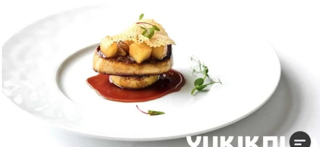
ジャルダン ポールボキューズ 料理飲み物