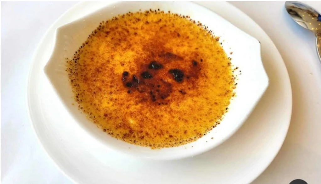
ジャルダン ポールボキューズ カスタード