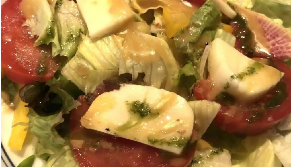
ワインと炭の音 食堂ますだ 動画