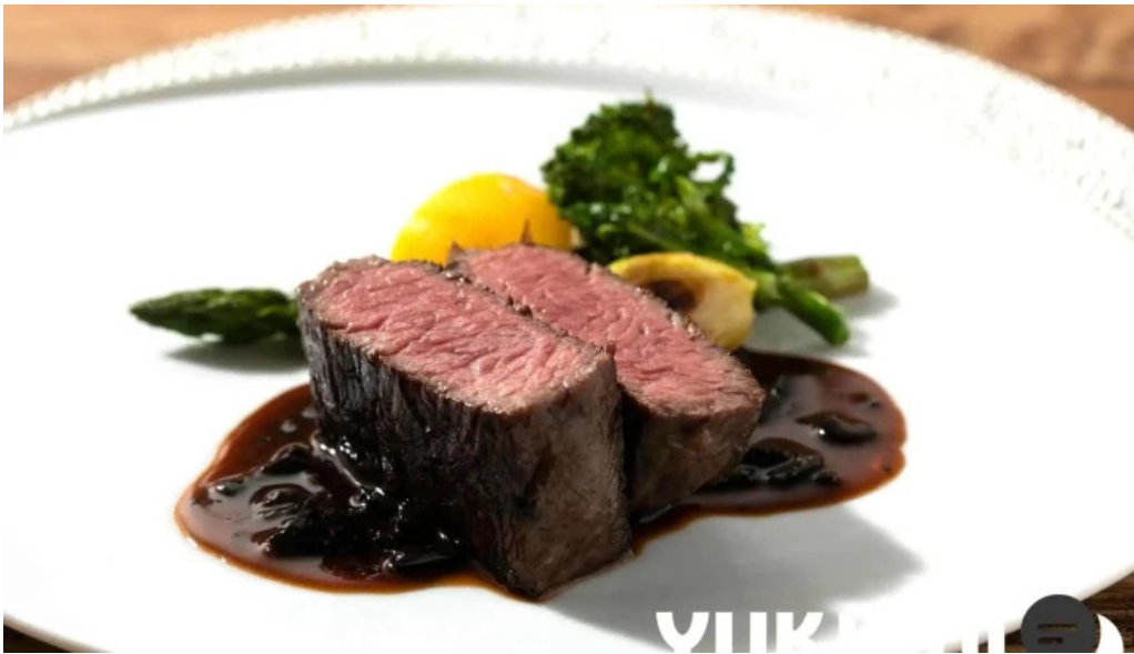
ワインと炭の音 食堂ますだ 料理飲み物