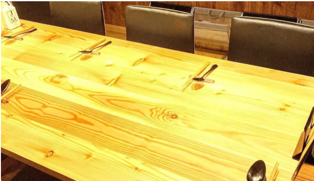
ワインと炭の音 食堂ますだ 住所