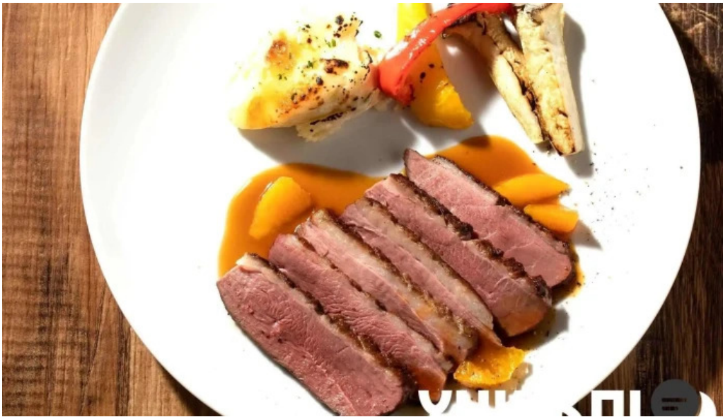
ワインと炭の音 食堂ますだ オーナー提供