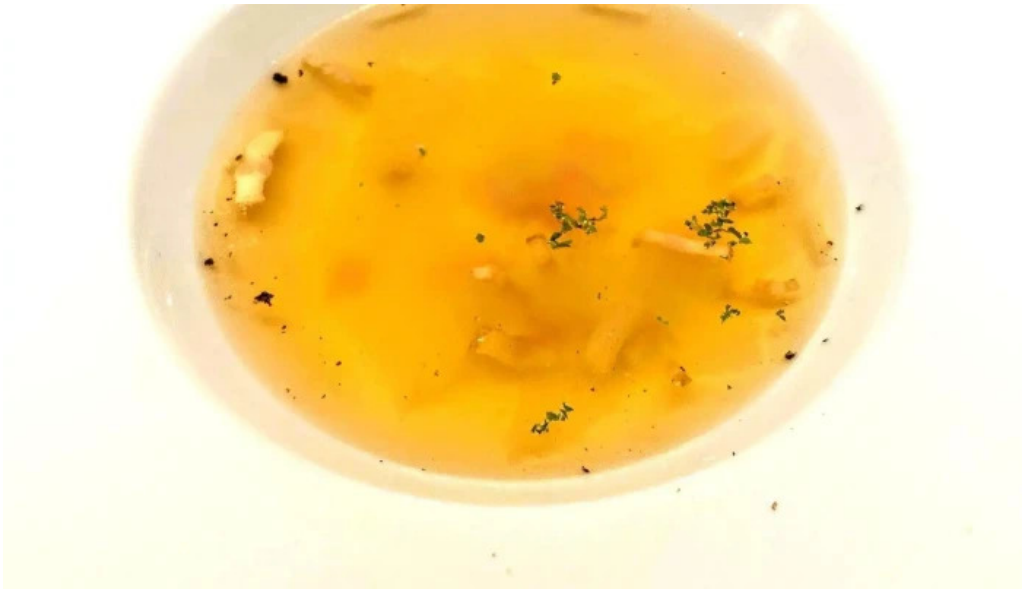
ワインと炭の音 食堂ますだ 所在地