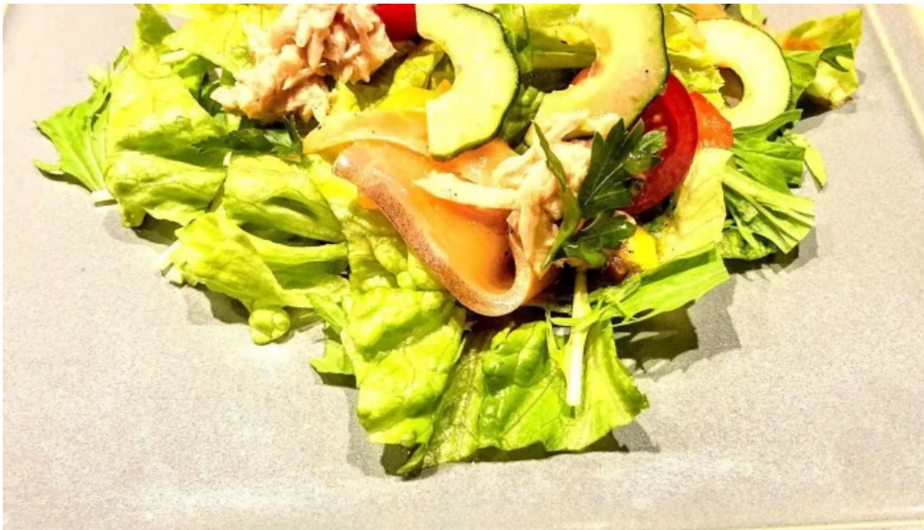
ワインと炭の音 食堂ますだ 料金