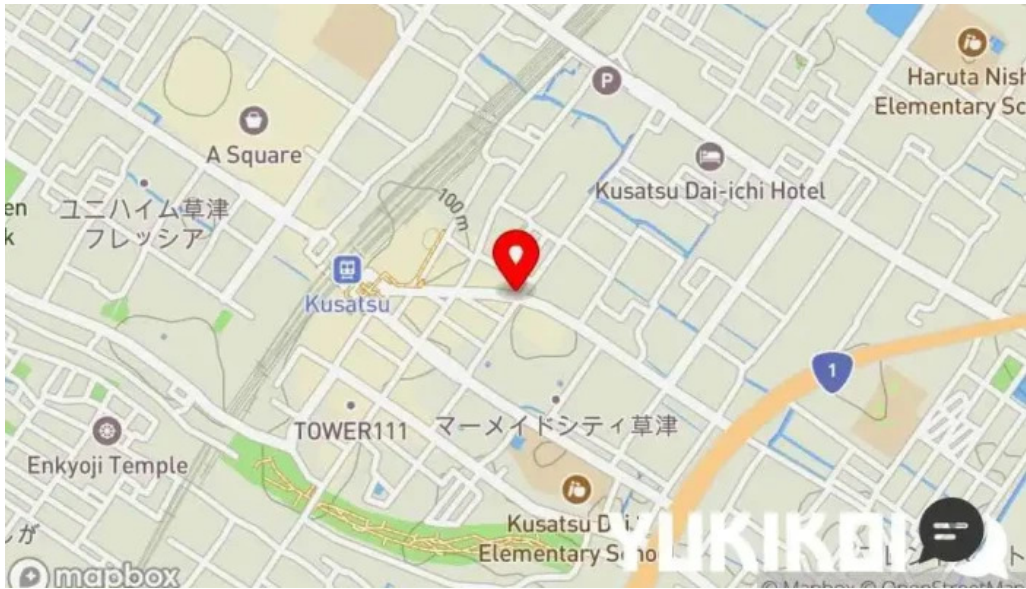
ワインと炭の音 食堂ますだ 地図