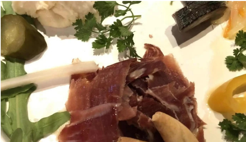
ワインと炭の音 食堂ますだ 営業中