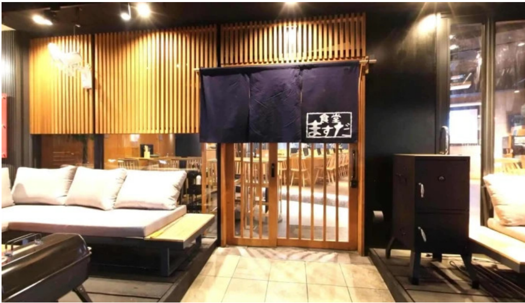
ワインと炭の音 食堂ますだ 草津市