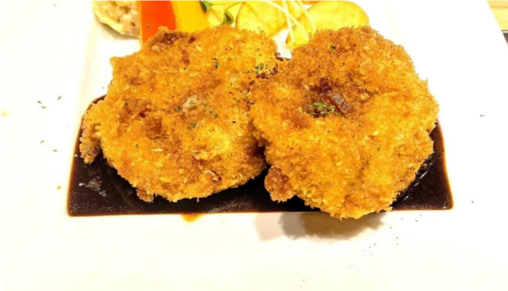
ワインと炭の音 食堂ますだ ウェブサイト