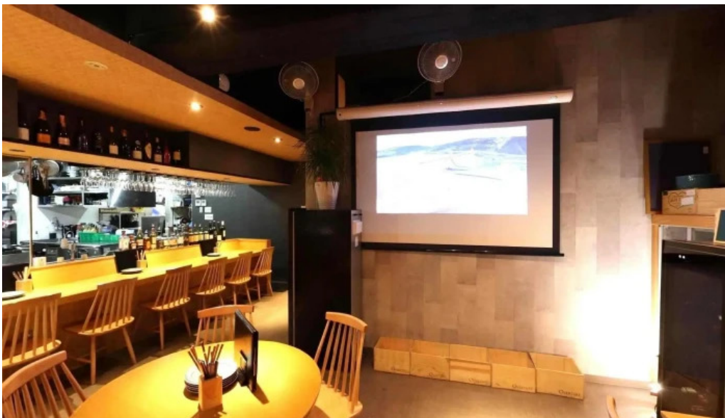
ワインと炭の音 食堂ますだ 雰囲気