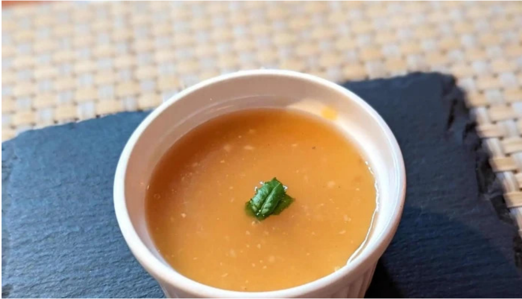
デラッセ プロモーション