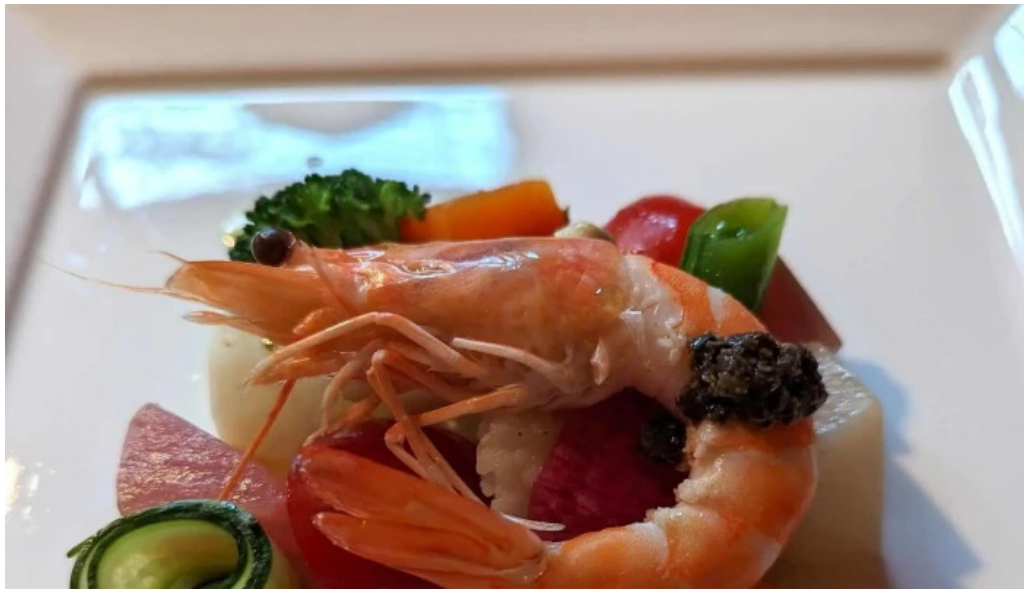
デラッセ 営業時間