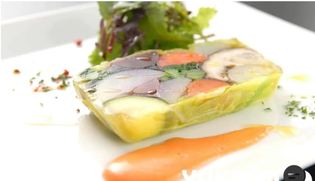
デラッセ 料理飲み物