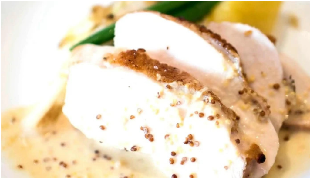
デラッセ カタログ