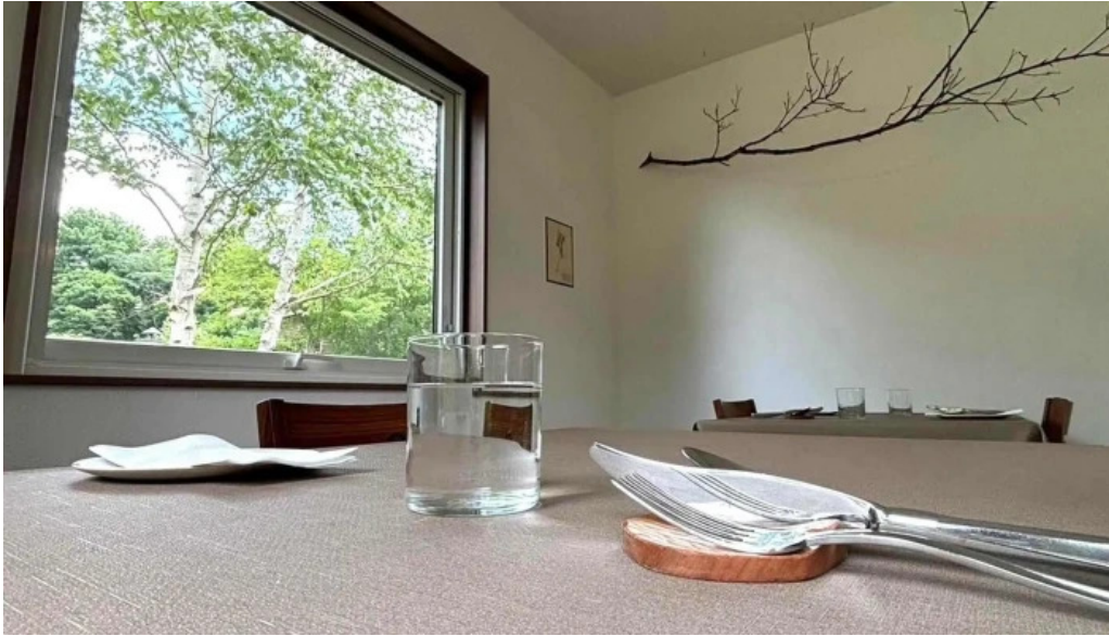
Jai la patate ジェラパタット プロモーション