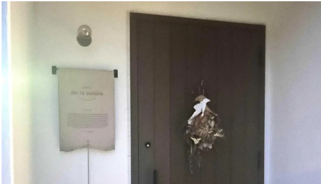
Jai la patate ジェラパタット 住所