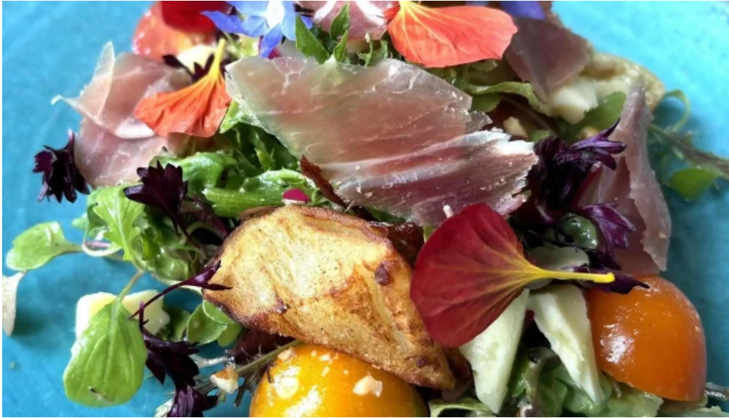
Jai la patate ジェラパタット スコア