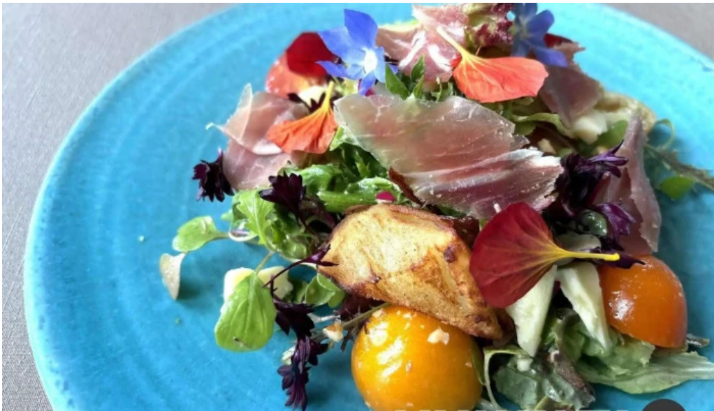
Jai la patate ジェラパタット 料理飲み物