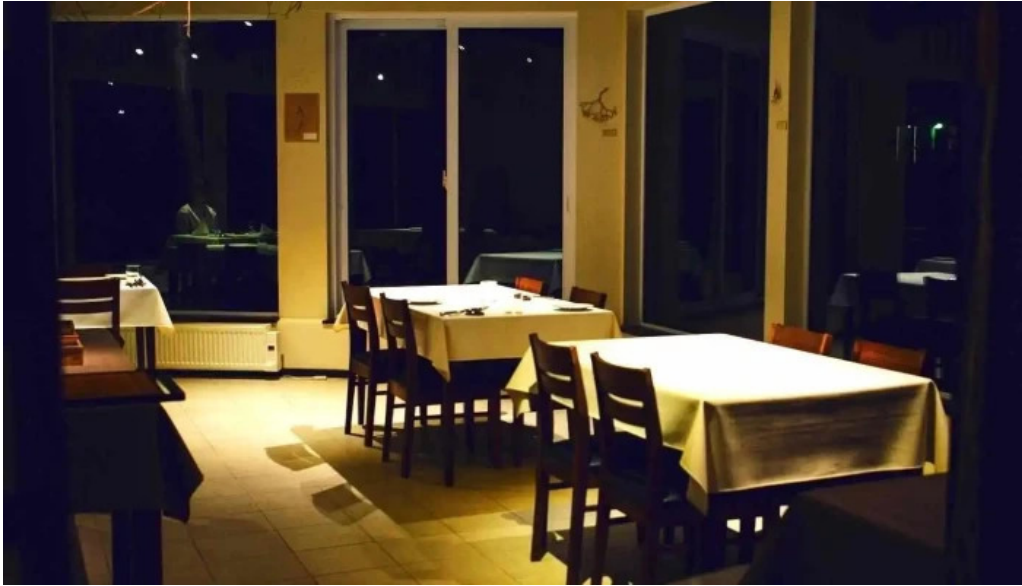
Jai la patate ジェラパタット 雰囲気