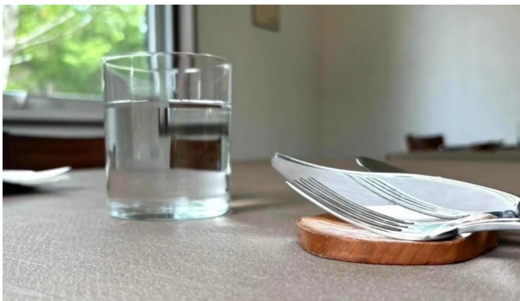
Jai la patate ジェラパタット 電話