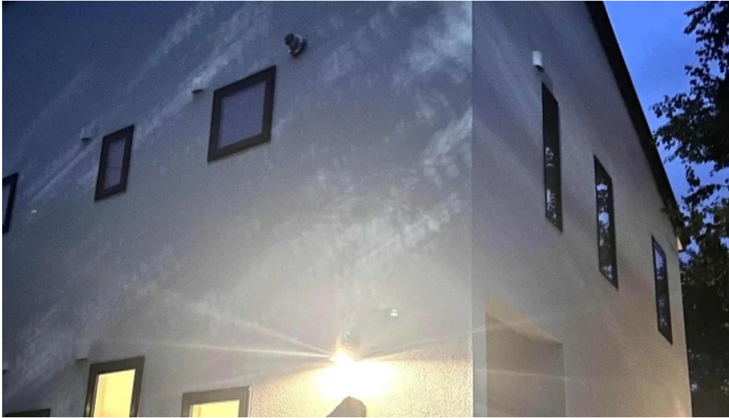
Jai la patate ジェラパタット 料金