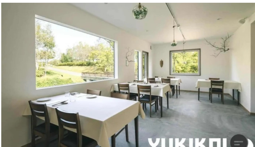
Jai la patate ジェラパタット ニセコ町