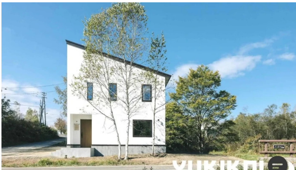
Jai la patate ジェラパタット オーナー提供