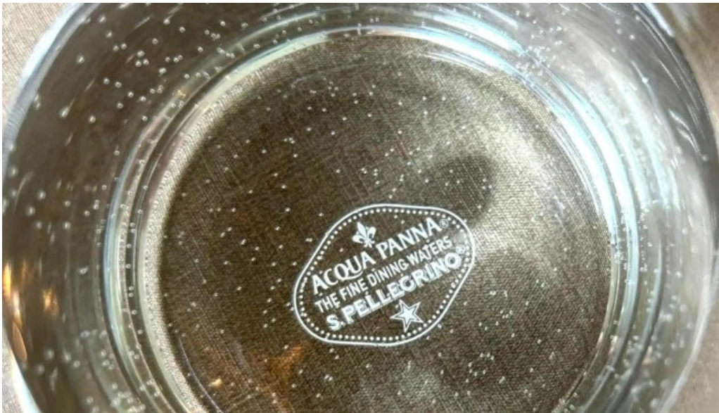
Jai la patate ジェラパタット コメント