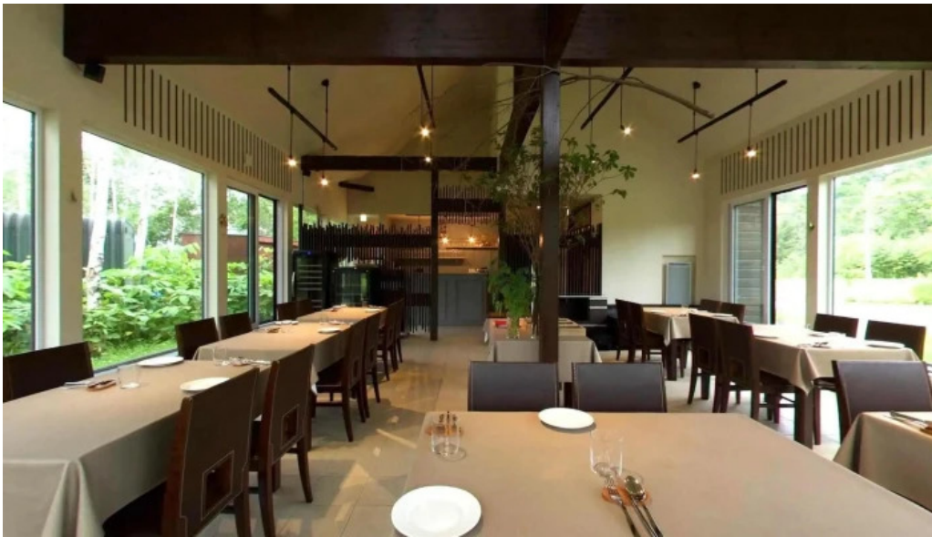
Jai la patate ジェラパタット ニセコ町