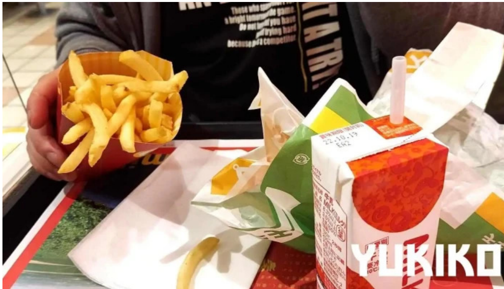
マクドナルド 網走店 フライドポテト