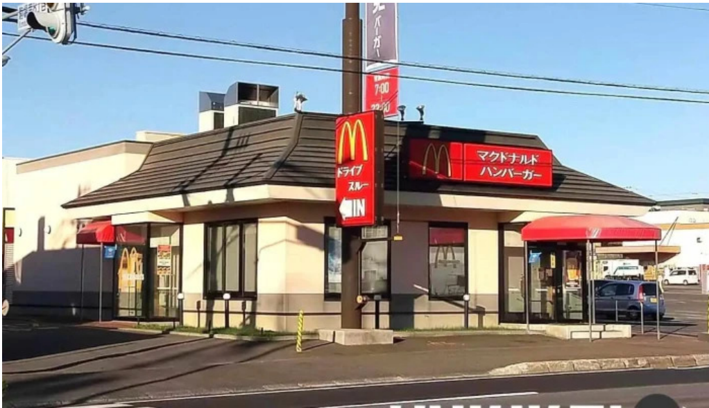
マクドナルド 網走店 網走市