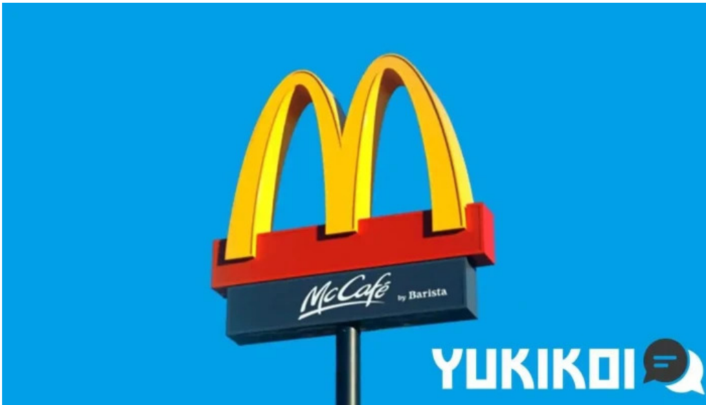
マクドナルド 網走店