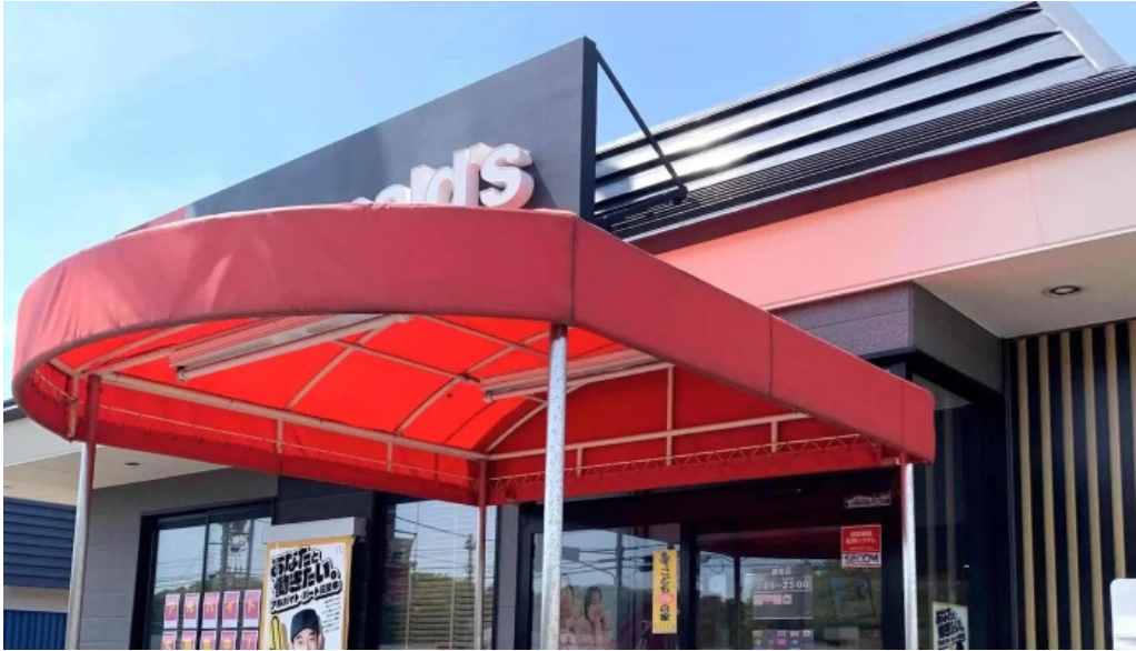
マクドナルド 網走店 comentario 3