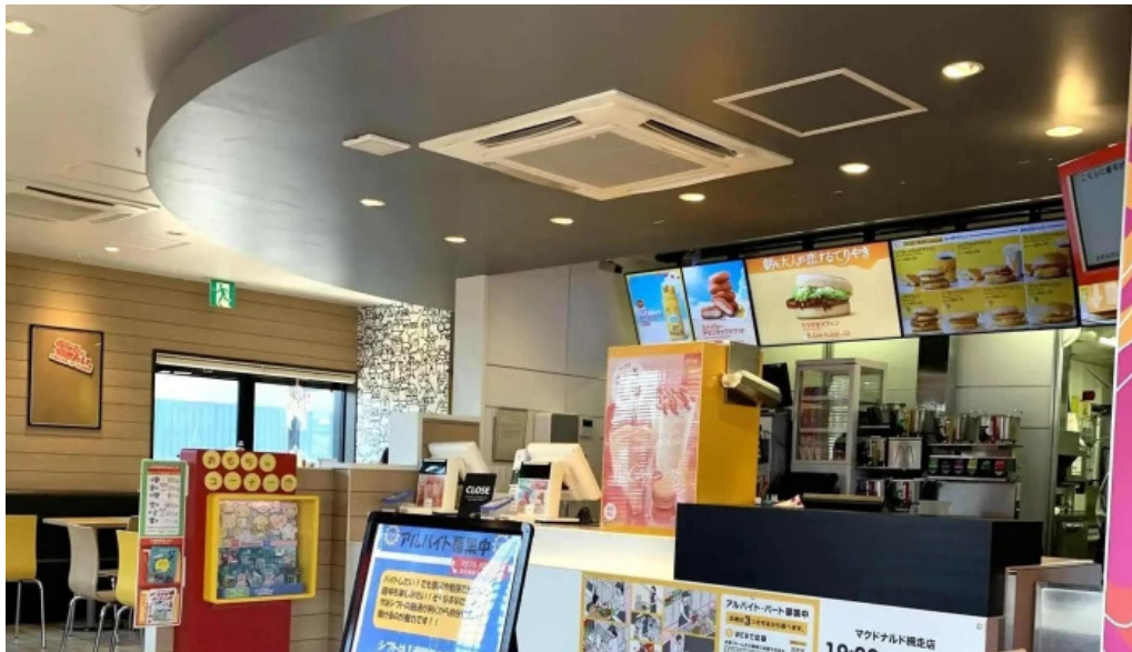
マクドナルド 網走店 comentario 1