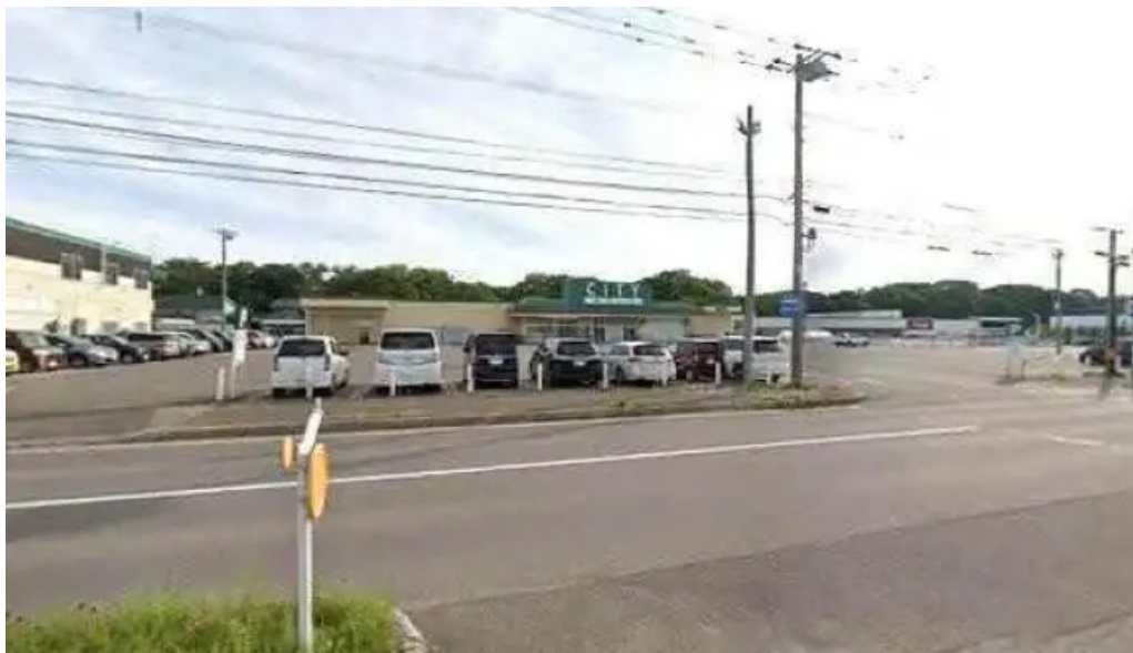
マクドナルド 網走店 ストリートビューと 360 ビュー