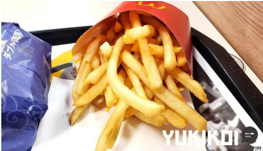
マクドナルド 網走店 料理飲み物