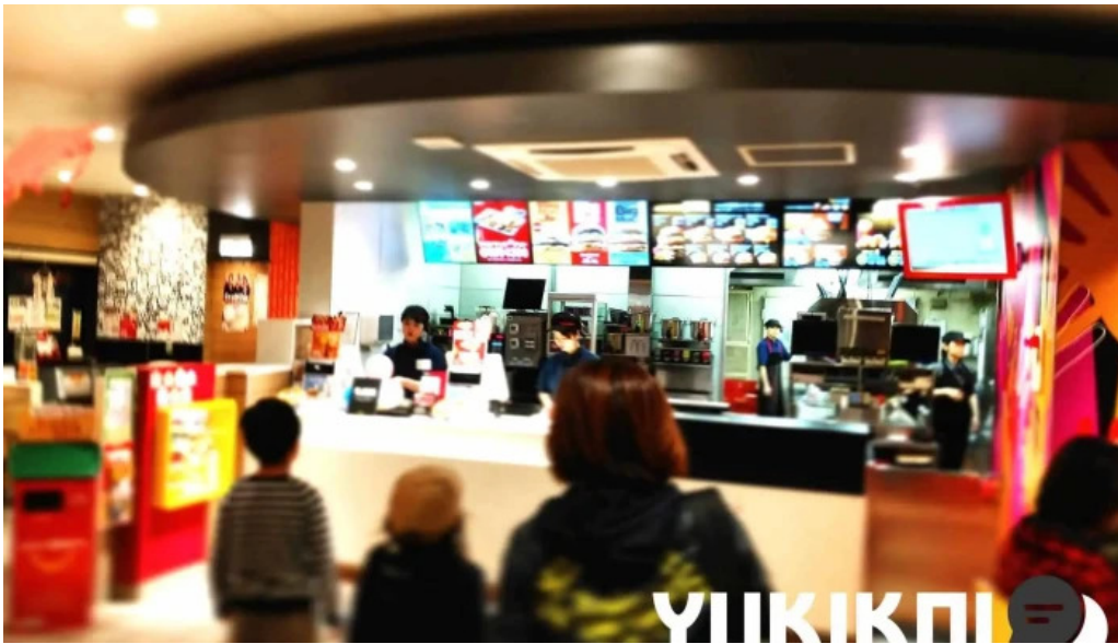
マクドナルド 網走店 雰囲気