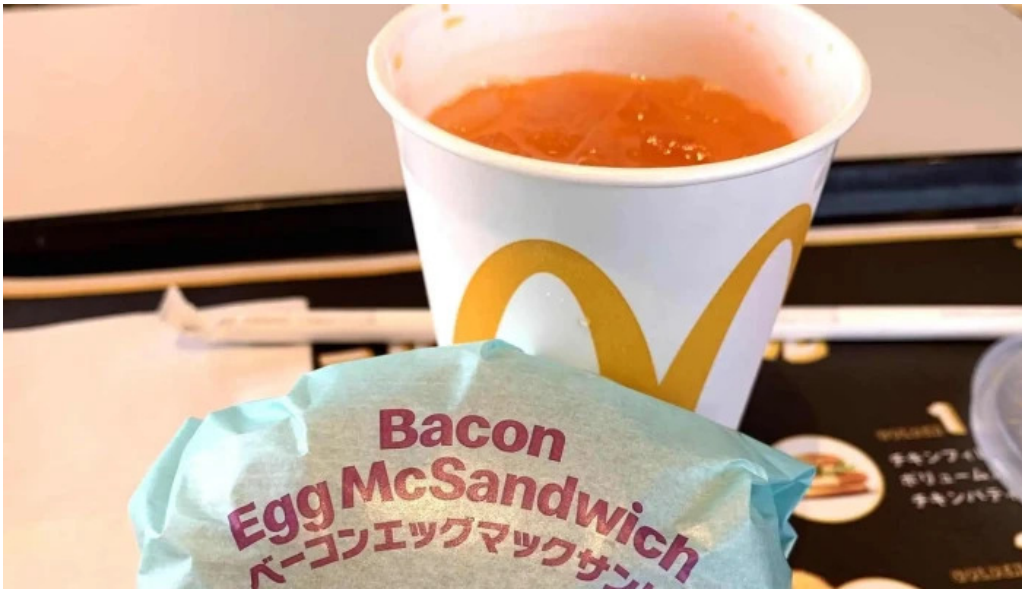
マクドナルド 網走店 comentario 2