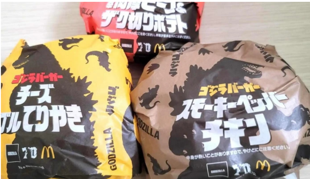
マクドナルド 網走店 comentario 4