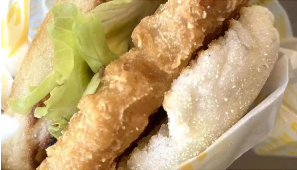
マクドナルド 網走店 コンフォートフード