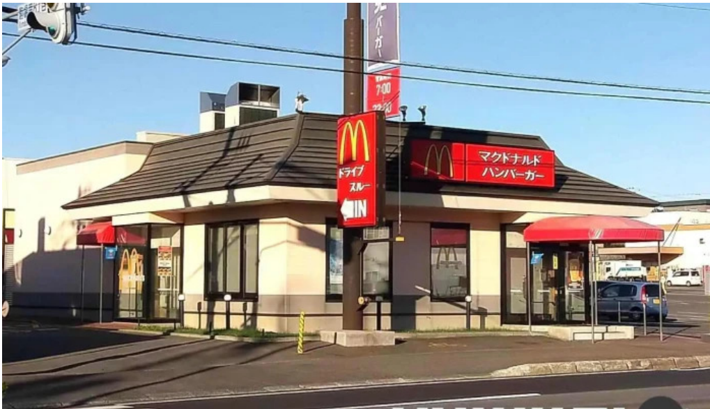
マクドナルド 網走店 すべて