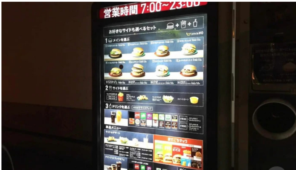
マクドナルド 網走店 メニュー