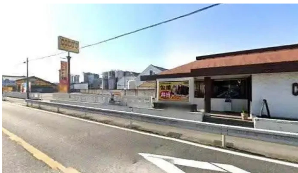
ココス 野田愛宕店 野田市