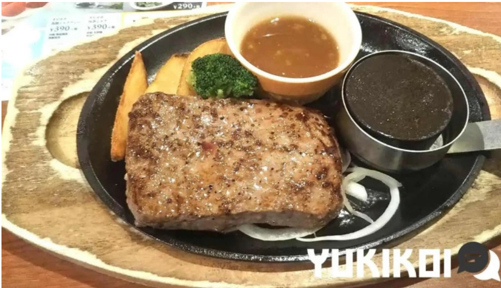
ココス 野田愛宕店 サーロインステーキ