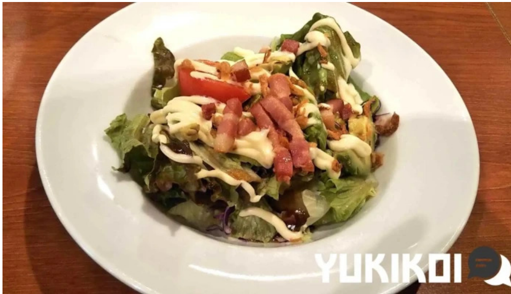
ココス 野田愛宕店 サラダ