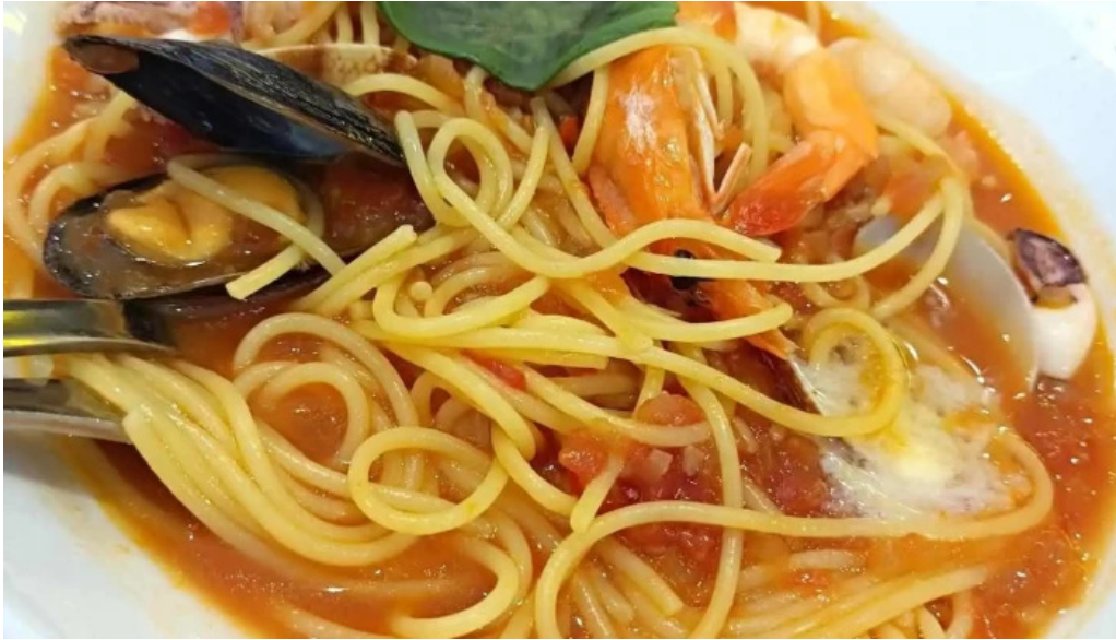
ココス 野田愛宕店 スパゲッティ