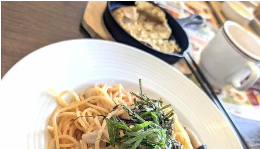
ココス 野田愛宕店 コメント