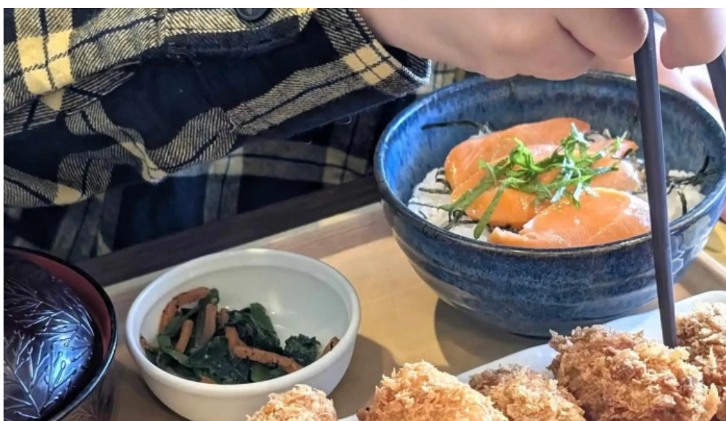
ココス 野田愛宕店 instagram