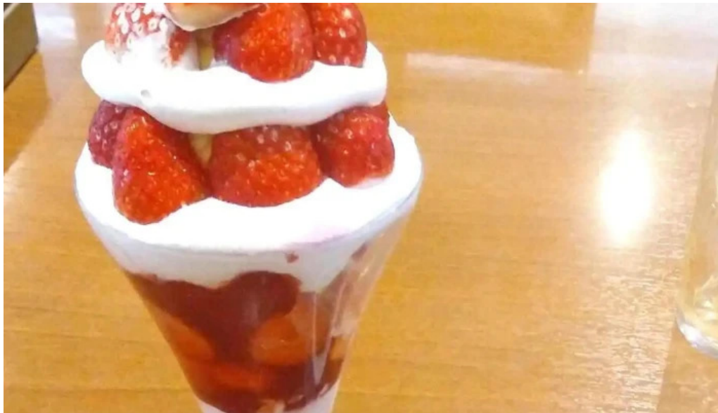
ココス 野田愛宕店 パフェ