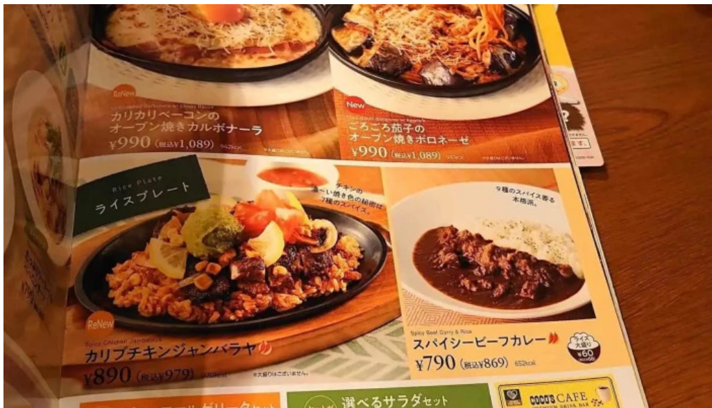
ココス 野田愛宕店 メニュー