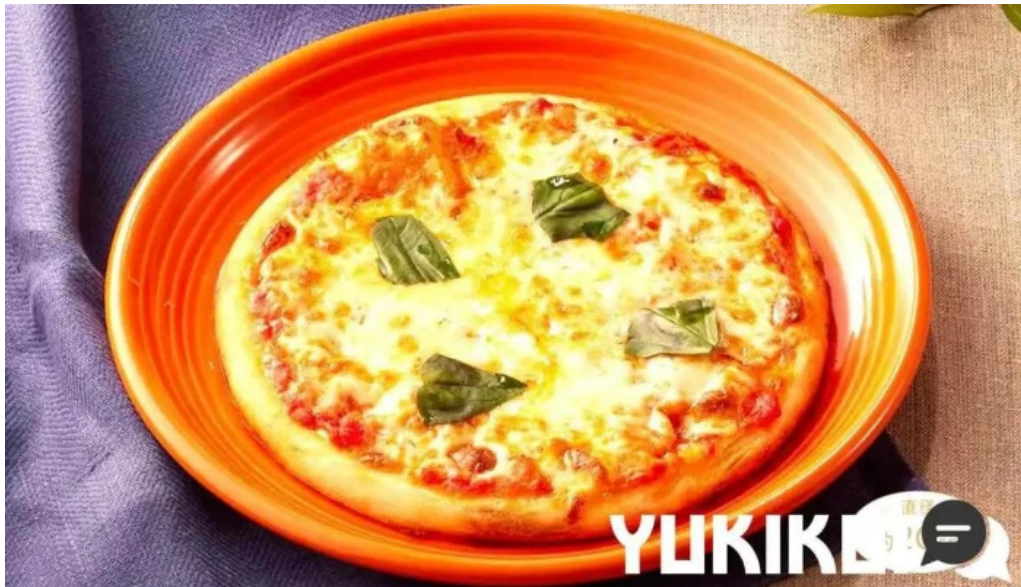
ココス 野田愛宕店 ピザ