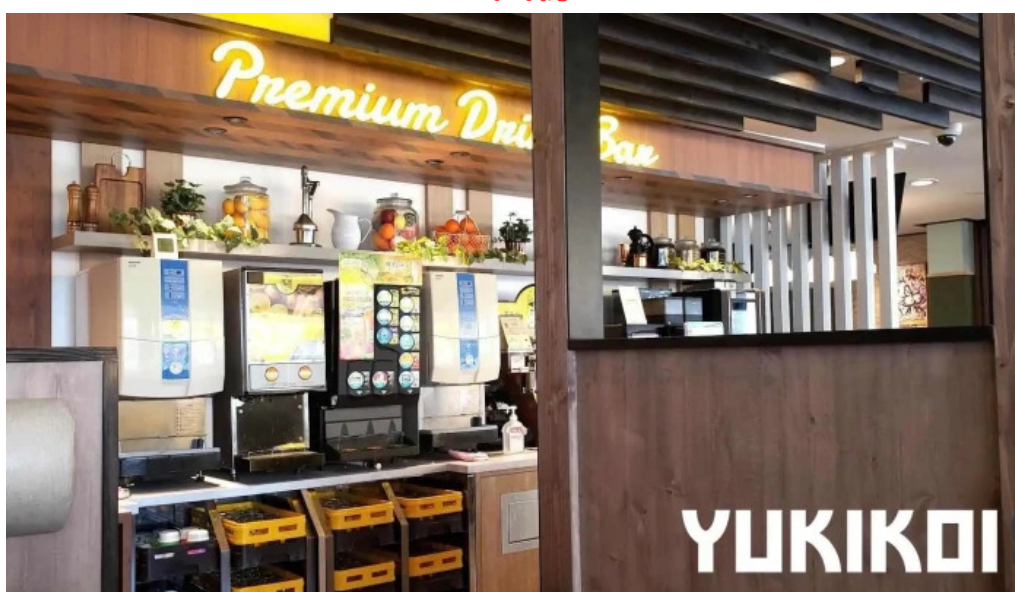
ココス 野田愛宕店 雰囲気