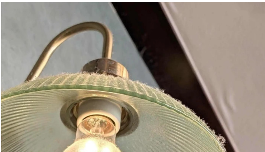
ココス 野田愛宕店 どこ