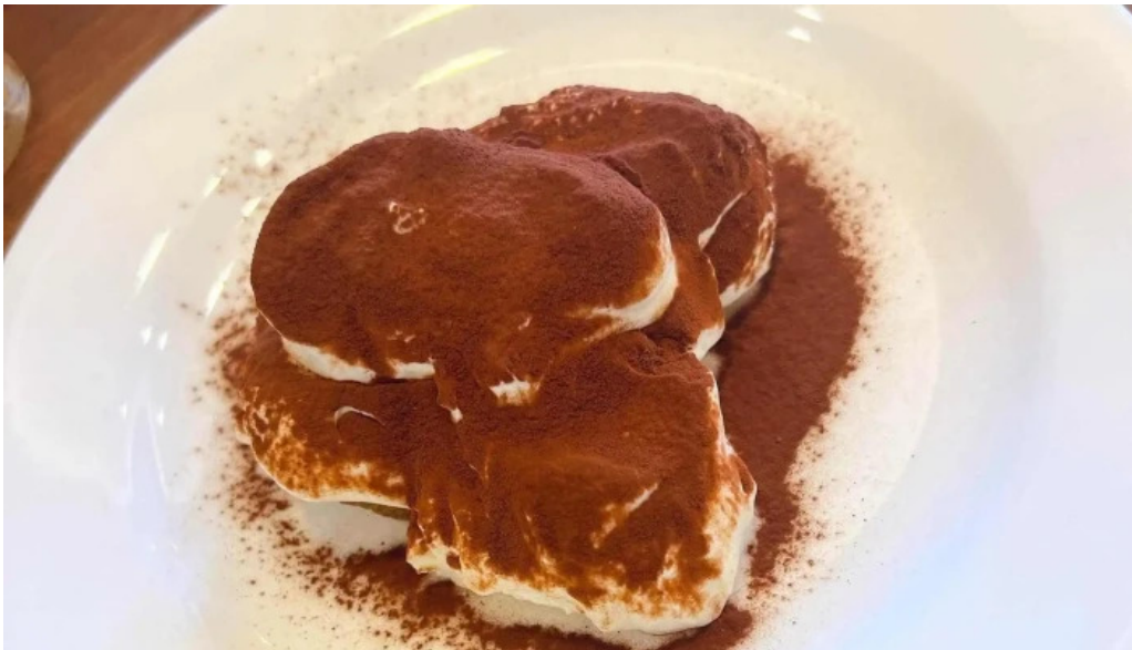
ジョナサン 御殿場インター店 写真