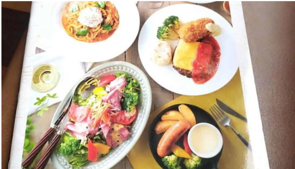
ジョナサン 御殿場インター店 メニュー