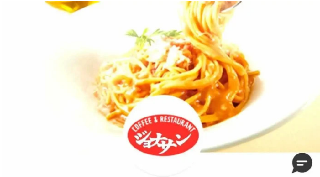
ジョナサン 御殿場インター店 料理飲み物