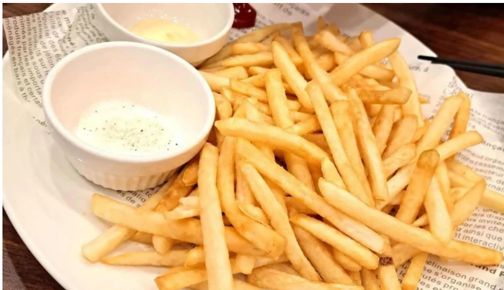
ジョナサン 御殿場インター店 フライドポテト