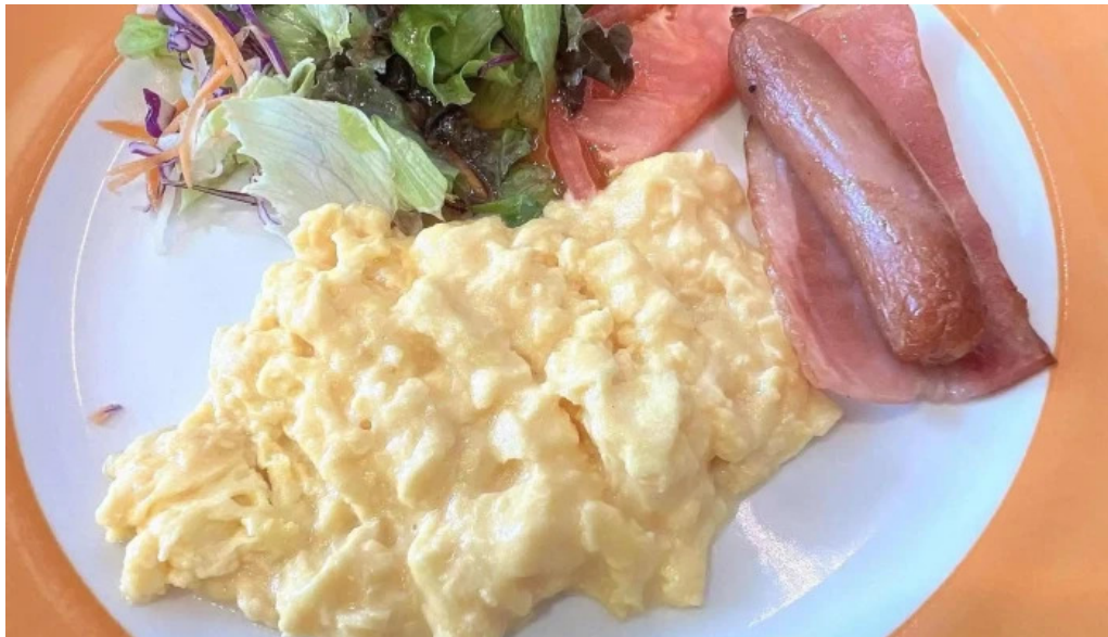
ジョナサン 御殿場インター店 御殿場市