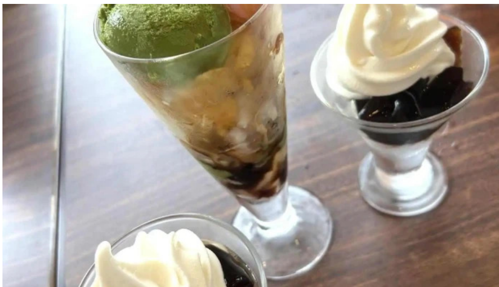
ジョナサン 御殿場インター店 パフェ