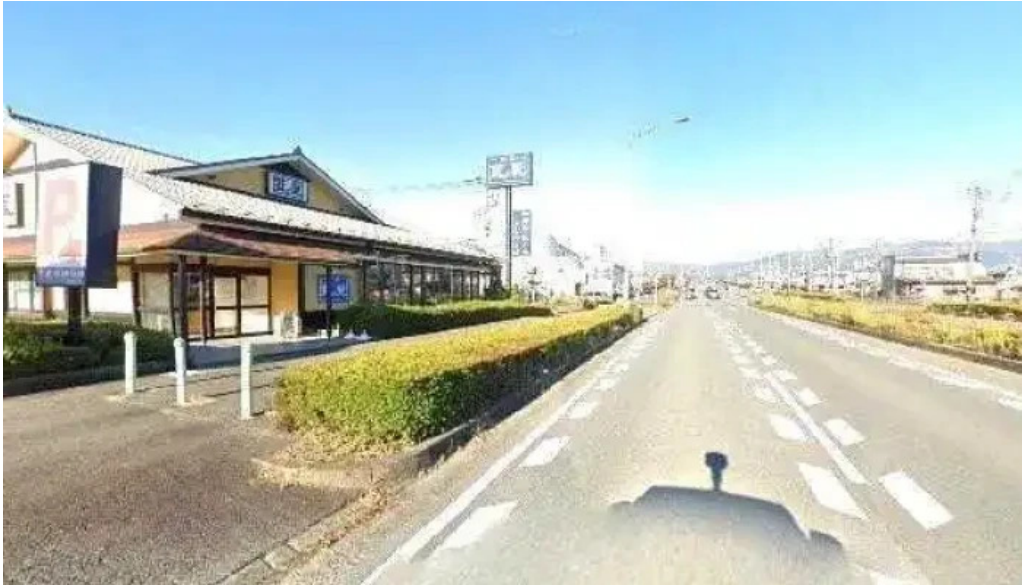
ジョナサン 御殿場インター店 最新