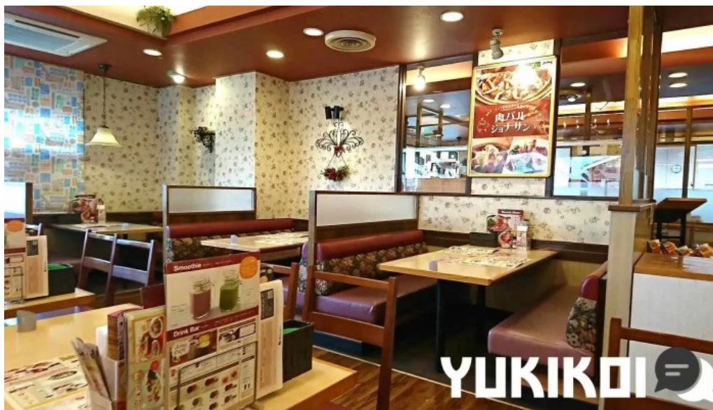
ジョナサン 御殿場インター店 雰囲気