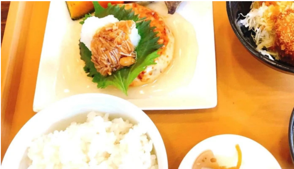
ジョナサン 御殿場インター店 料金