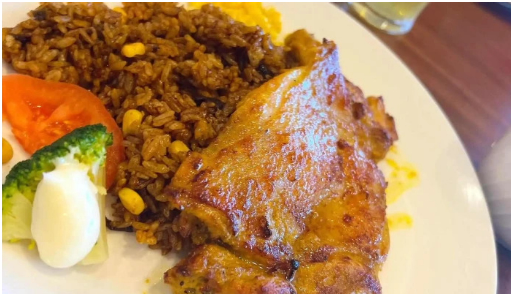
ジョナサン 御殿場インター店 口コミ