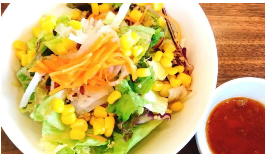
ジョナサン 御殿場インター店 どこ