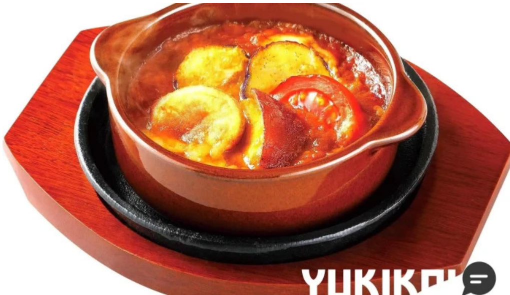
さわやか 御殿場プレミアムアウトレット店 料理飲み物