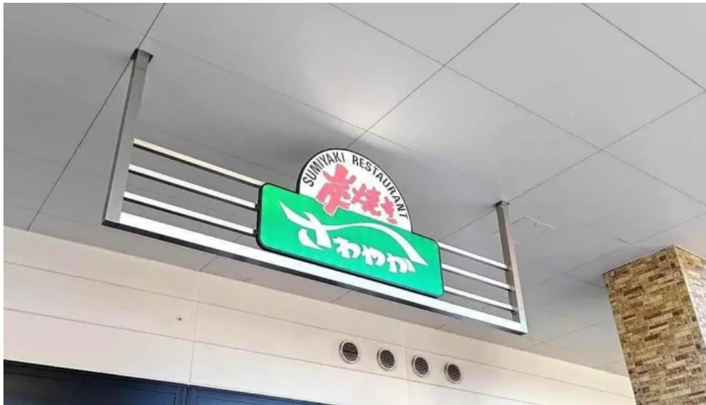
さわやか 御殿場プレミアム・アウトレット店 御殿場市