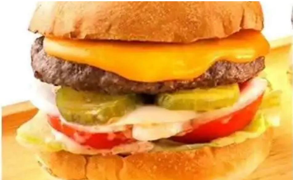
さわやか 御殿場プレミアムアウトレット店 ハンバーガー