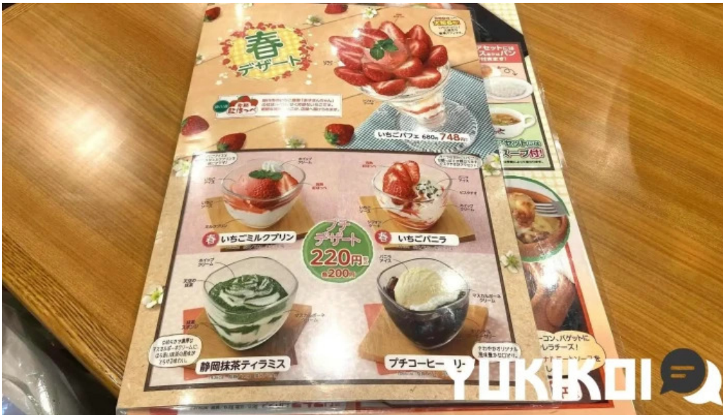
さわやか 御殿場プレミアムアウトレット店 メニュー