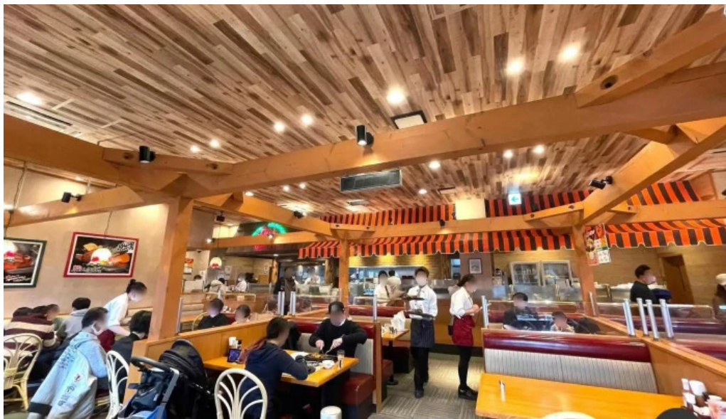
さわやか 御殿場プレミアムアウトレット店 雰囲気