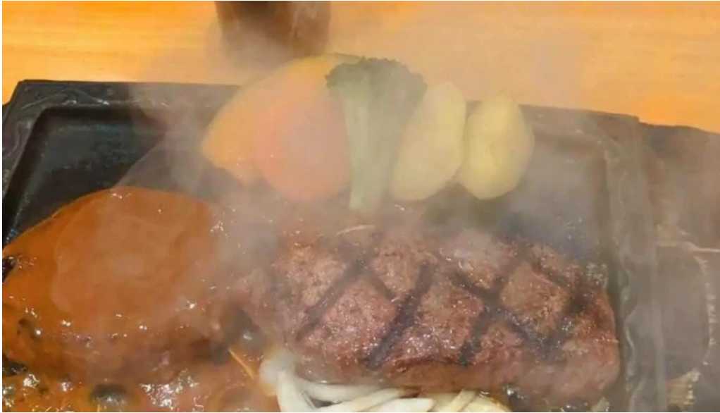
さわやか 御殿場プレミアムアウトレット店 動画