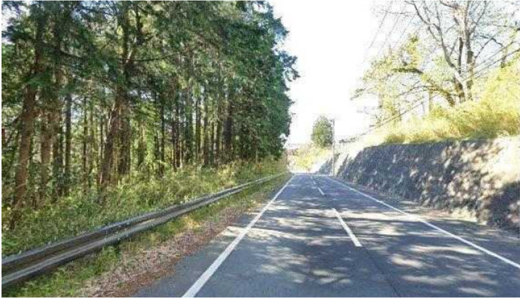
さわやか 御殿場プレミアムアウトレット店 御殿場市