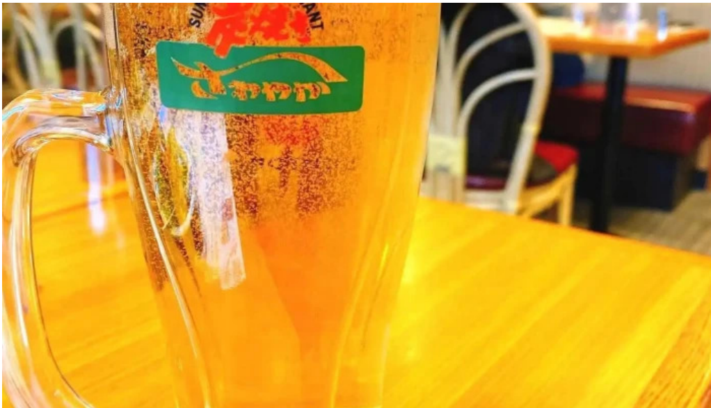
さわやか 御殿場プレミアムアウトレット店 ビール