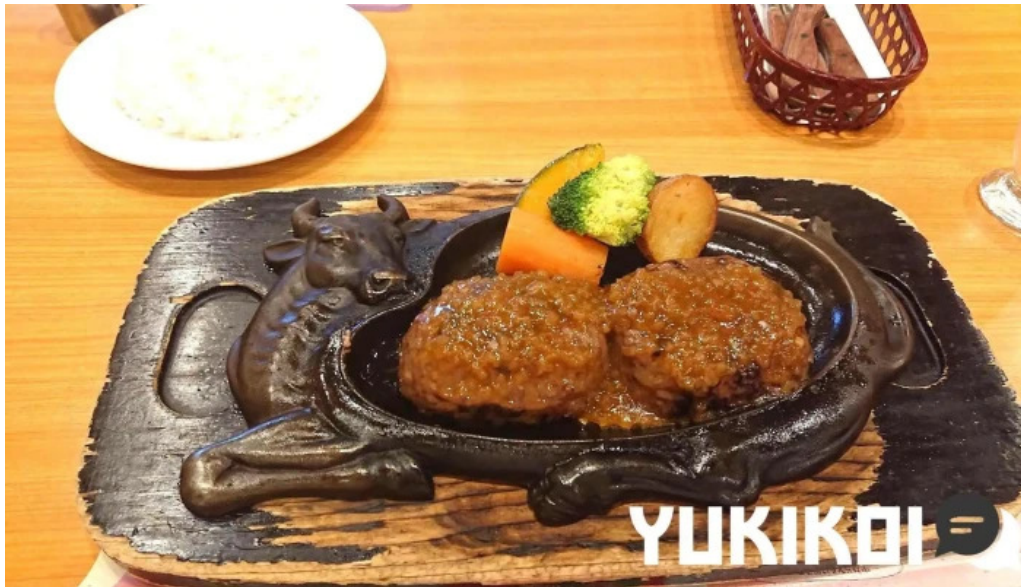
さわやか 御殿場プレミアムアウトレット店 ソールズベリーステーキ