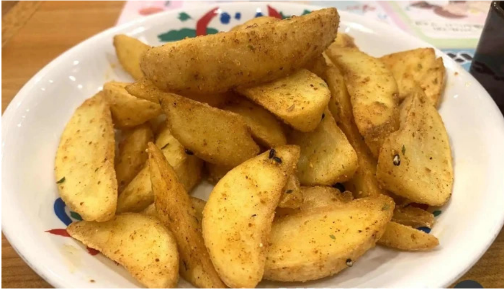
さわやか 御殿場プレミアムアウトレット店 ポテトウェッジズ