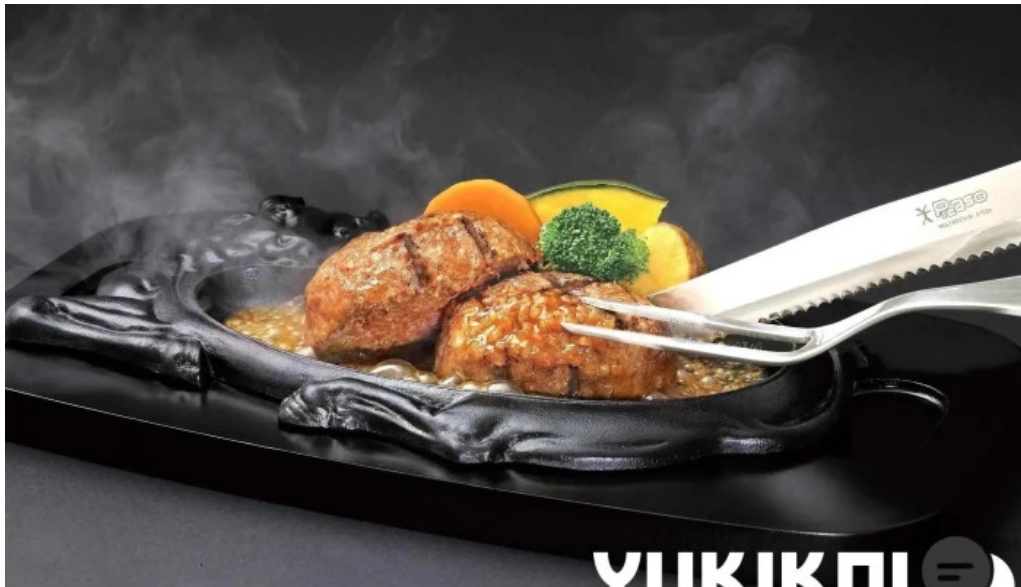
さわやか 御殿場プレミアムアウトレット店