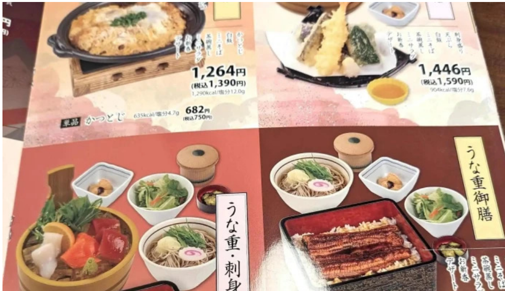
和風レストランまるまつ 南陽店 営業中