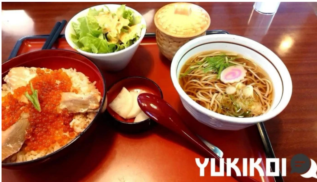
和風レストランまるまつ 南陽店 蕎麦