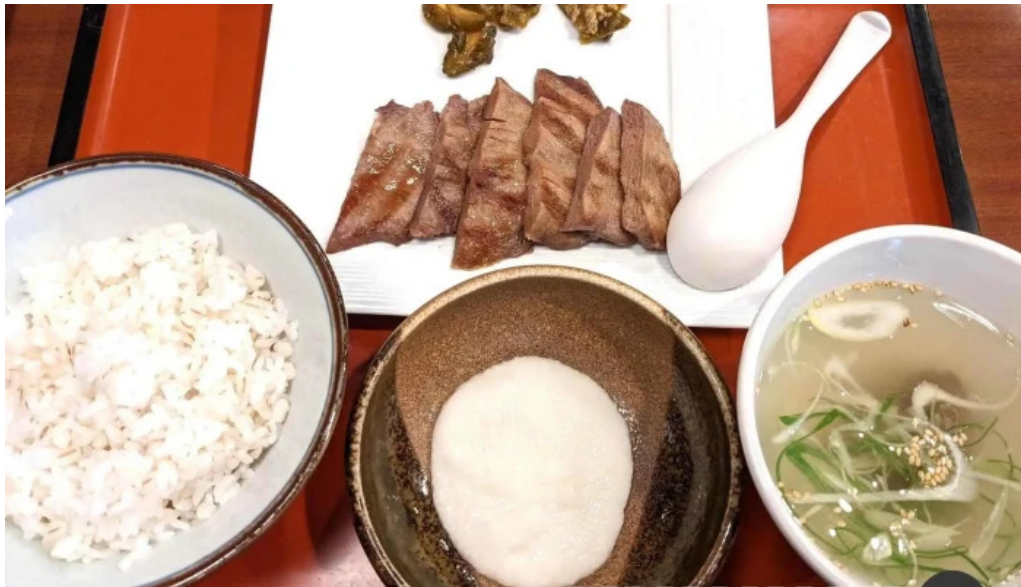
和風レストランまるまつ 南陽店 豚カツ