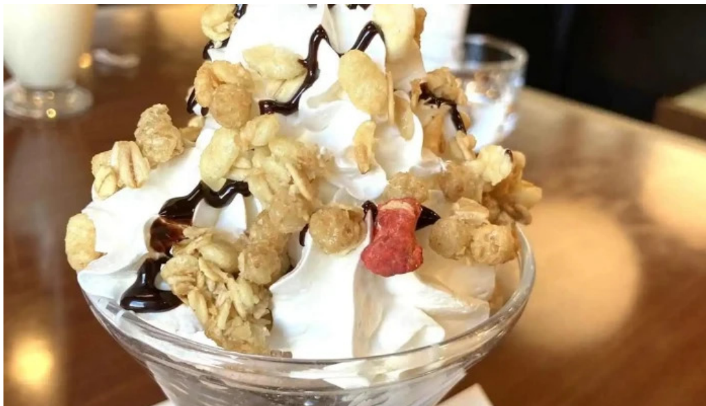
和風レストランまるまつ 南陽店 パフェ