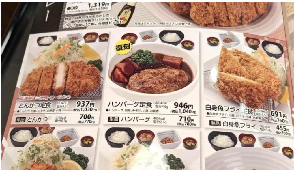
和風レストランまるまつ 南陽店 所在地