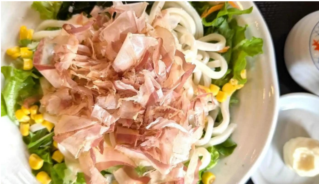
和風レストランまるまつ 南陽店 スコア