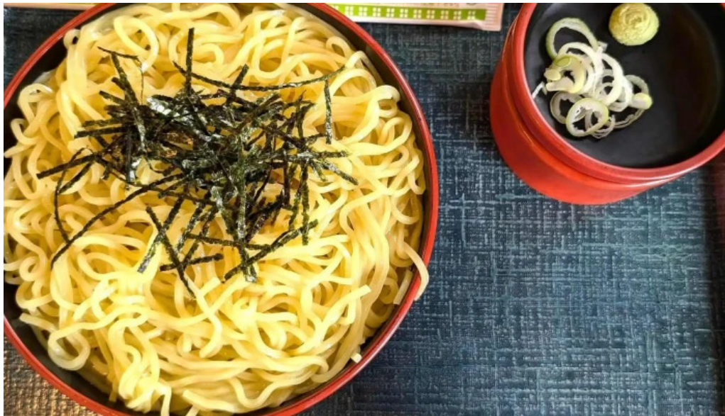
和風レストランまるまつ 南陽店 instagram