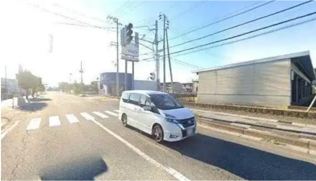
和風レストランまるまつ 南陽店 南陽市