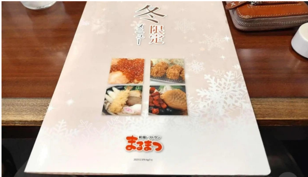
和風レストランまるまつ 南陽店 料理飲み物