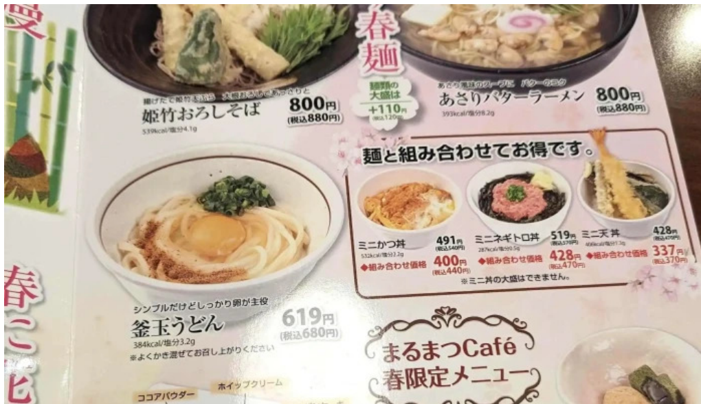
和風レストランまるまつ 南陽店 カタログ