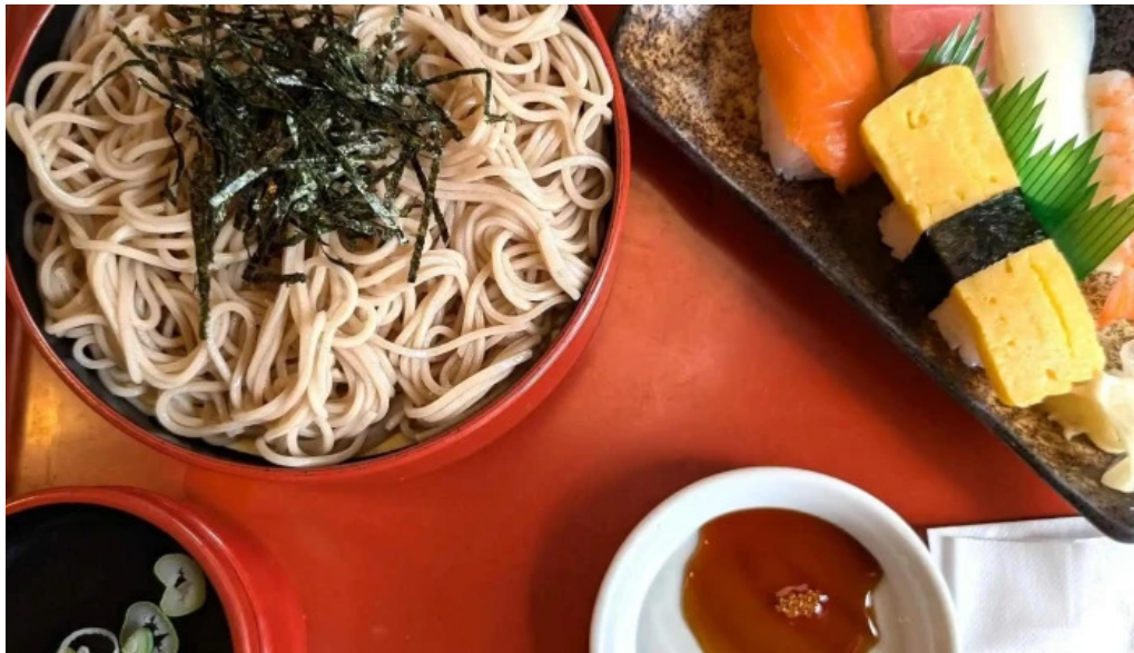
和風レストランまるまつ 南陽店 口コミ