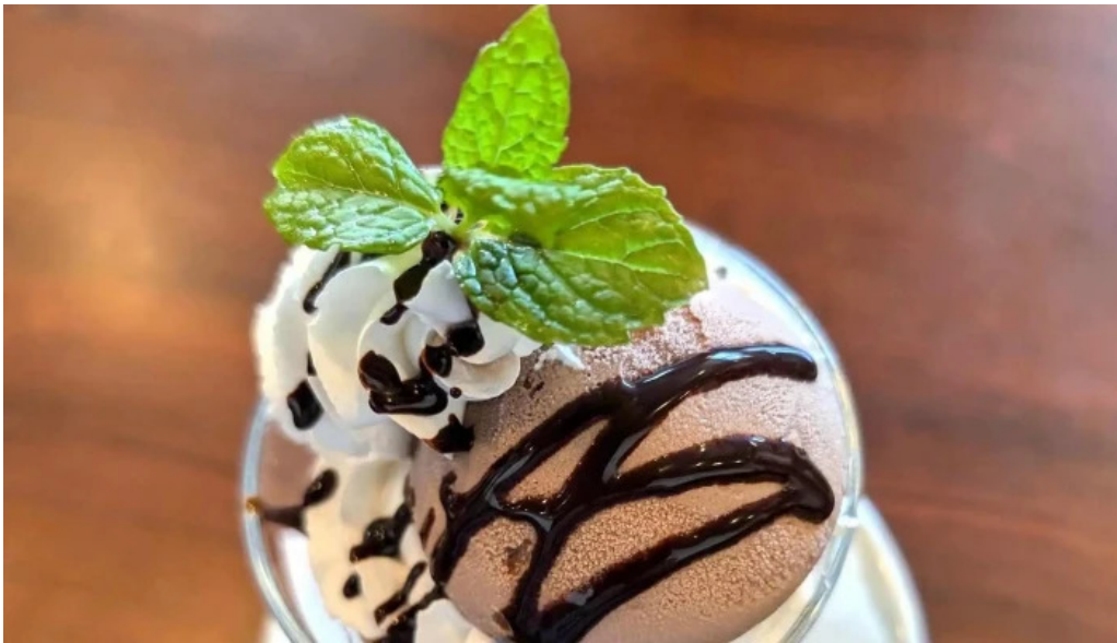
和風レストランまるまつ 南陽店 営業時間