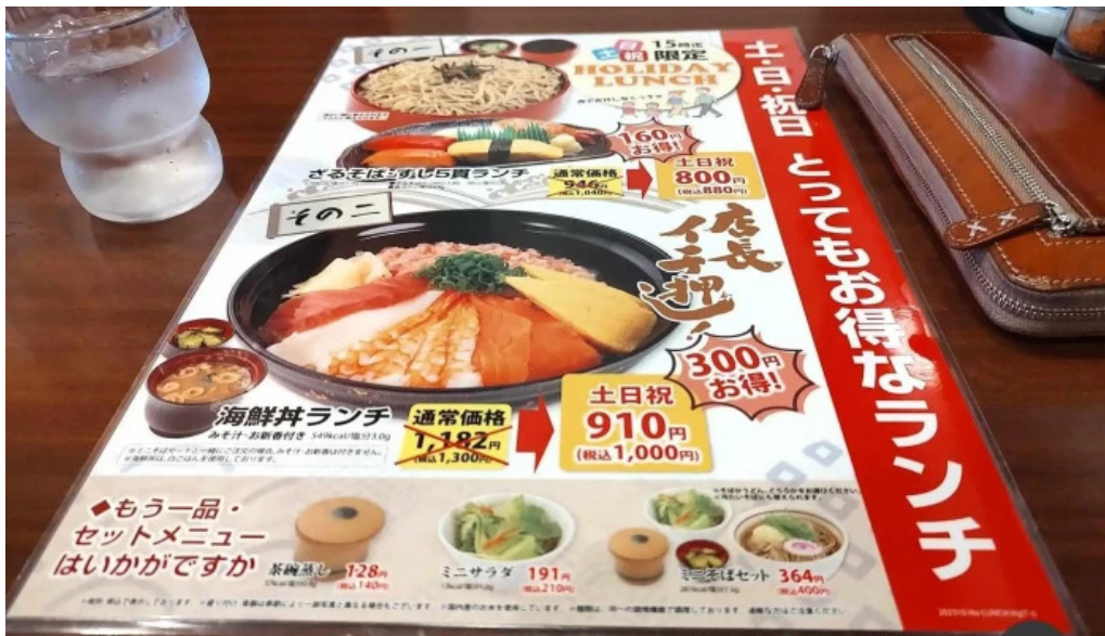
和風レストランまるまつ 南陽店 メニュー