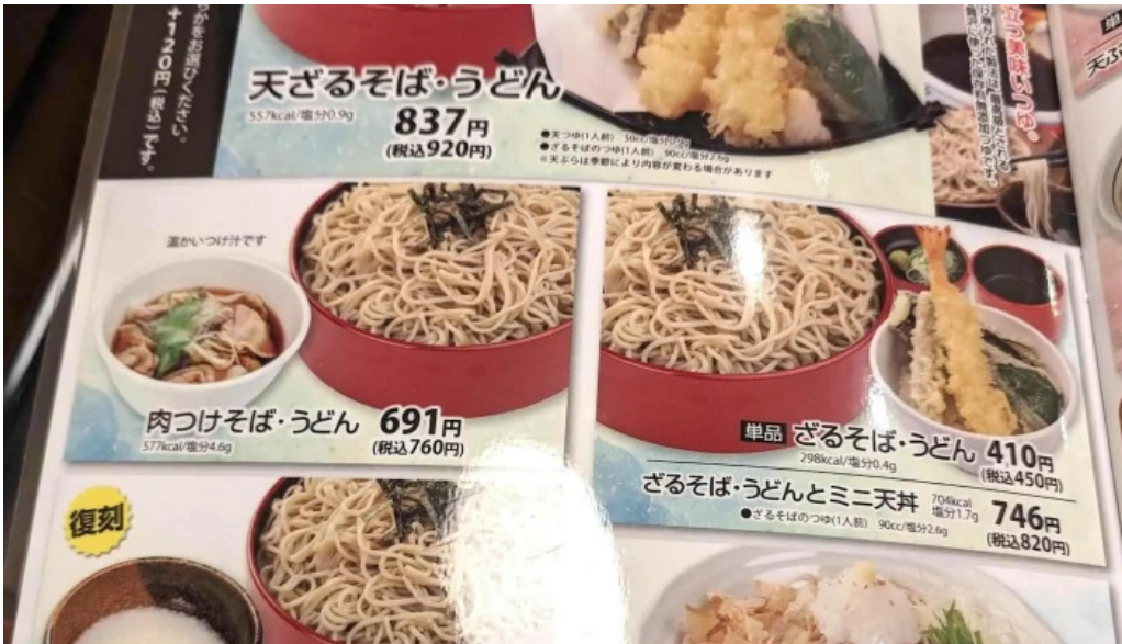
和風レストランまるまつ 南陽店 住所